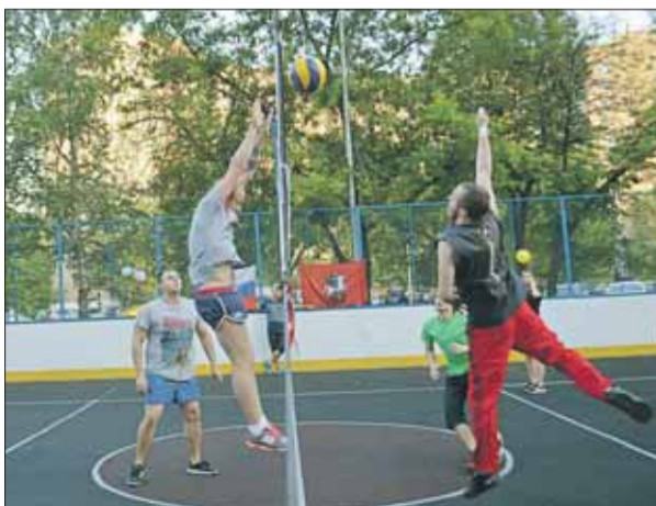
На турнир приехали команды со всех концов Москвы