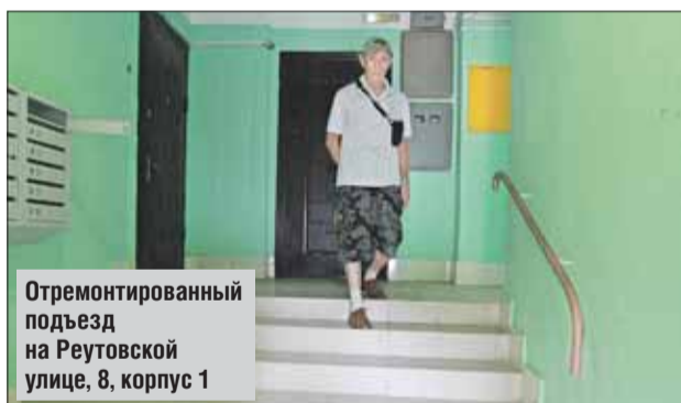
Отремонтированный подъезд на Реутовской улице, 8, корпус 1