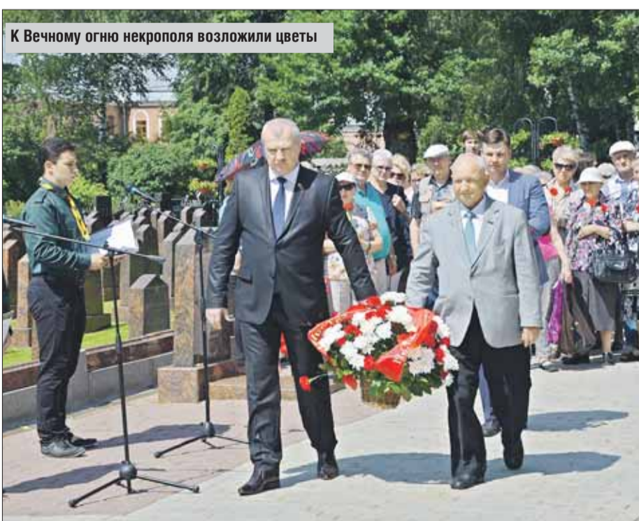
К Вечному огню некрополя возложили цветы