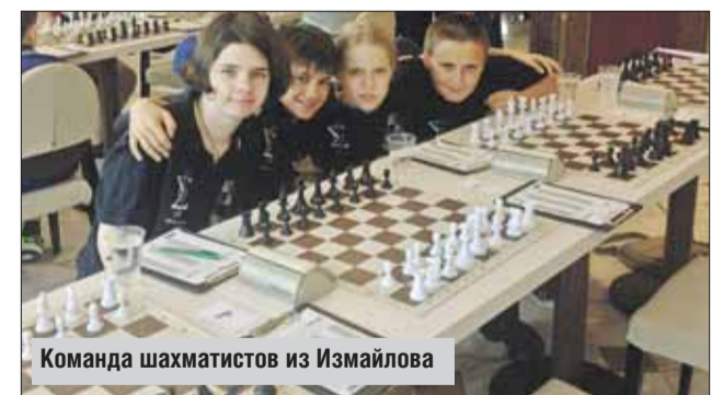
Команда шахматистов из Измайлова

Ученики школы №444 в Измайлове заняли престижное 7-е место на международном шахматном турнире «Белая ладья», проходившем в Сочи. В прошлом году столица — а ребята представляли на соревнованиях Москву — была лишь на 31-м месте в турнирной таблице. Всего же в нынешних соревнованиях участвовала 91