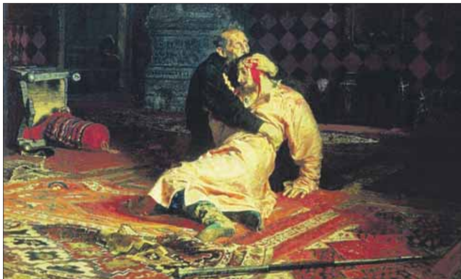
Картина Ильи Репина «Иван Грозный и сын его Иван 16 ноября 1581 года»

Дальтонизм может передаваться по наследству, но может появиться и вследствие заболеваний зрительного нерва или сетчатки глаза. Наследственный дальтонизм встречается чаще, он поражает оба глаза и не прогрессирует со временем.