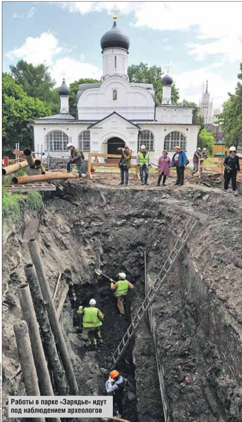
Работы в парке «Зарядье» идут под наблюдением археологов

На каждом участке проведения работ существует специальный журнал, в котором фиксируются все находки. Они обследуются археологами прямо на месте, и если объект представляет какую-либо научную или историческую значимость,