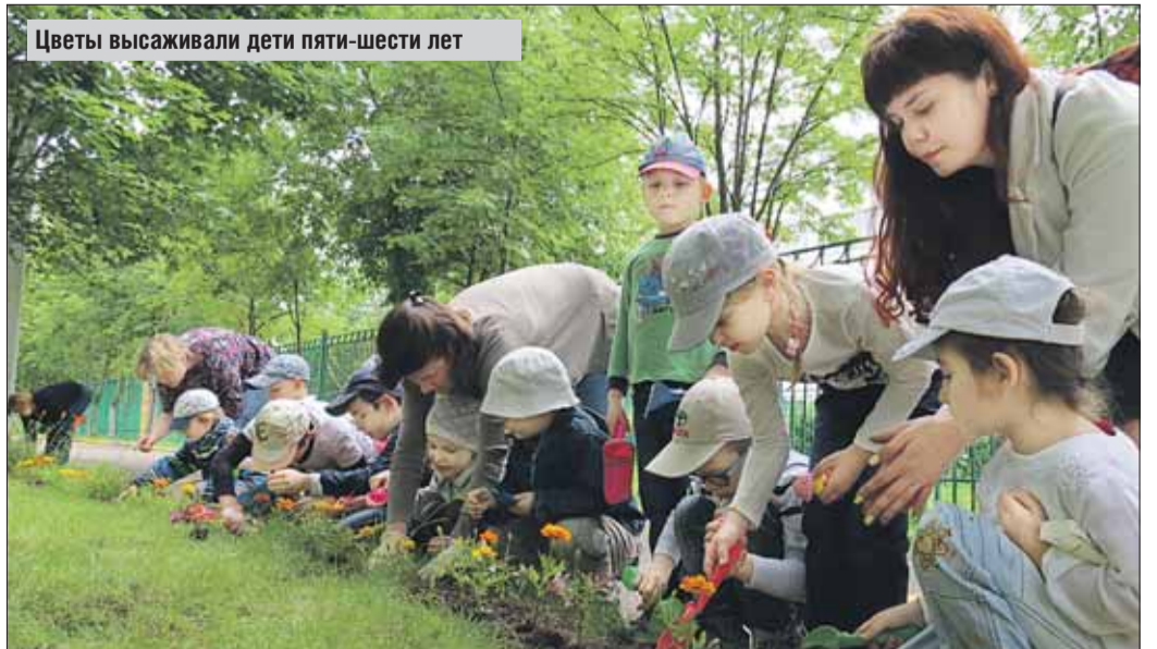
Цветы высаживали дети пяти-шести лет