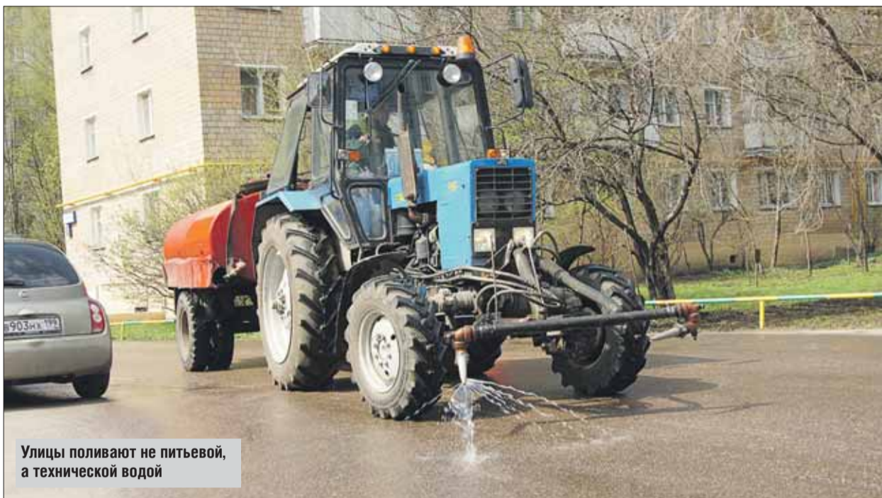
Улицы поливают не питьевой, а технической водой