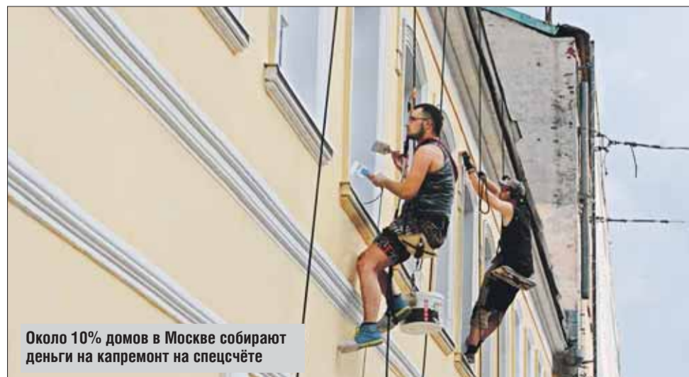
Около 10% домов в Москве собирают деньги на капремонт на спецсчёте

По мнению первого заместителя председателя Комитета по региональной политике Совета Федерации Аркадия Чернецкого, сначала специальные счета для многих были не очень понятным методом формирования фонда капремонта дома, требовавшим личного участия, большой активности и значительной личной ответственности. Поэтому часть жителей многоквартирных домов не решились пойти на эту форму сразу. Но прошло какое-то время, прошла разъяснительная работа, люди начали понимать, что в случае формирования фонда капитального ремонта на спецсчёте у них есть воз-