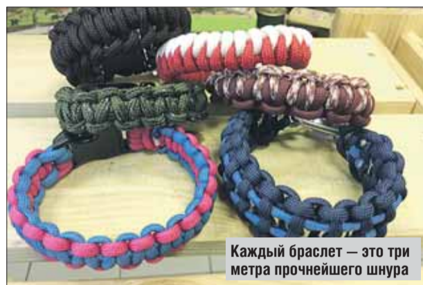
Каждый браслет — это три метра прочнейшего шнура

По словам Бориса, прочный шнур в походе незаменим. Если распустить паракорд на тон-