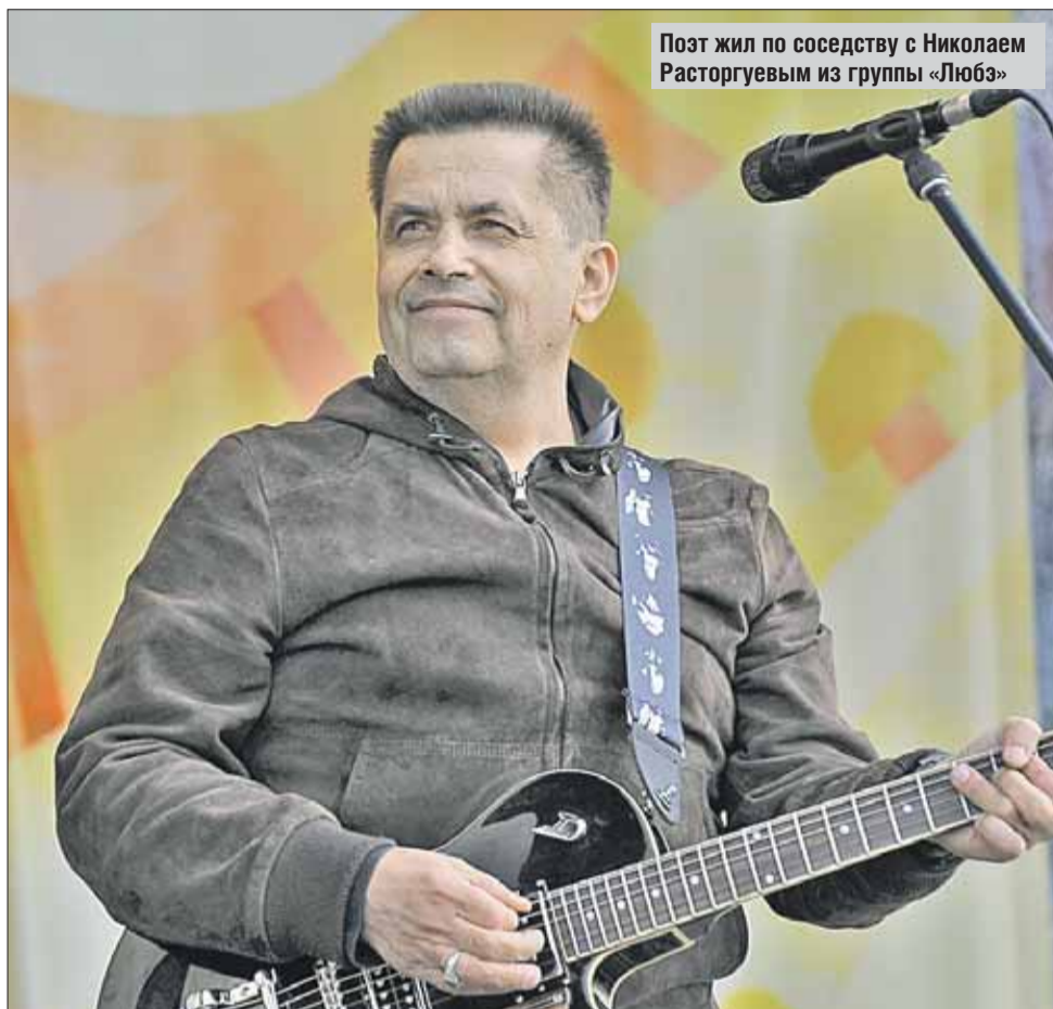
Поэт жил по соседству с Николаем Расторгуевым из группы «Любэ»

— Иногда нёс то, что уже было написано, а иногда звонили и говорили, что и для кого надо написать. Я сначала какое-то время общался с исполнителем, потом, подстраиваясь под него, под его индивиду-