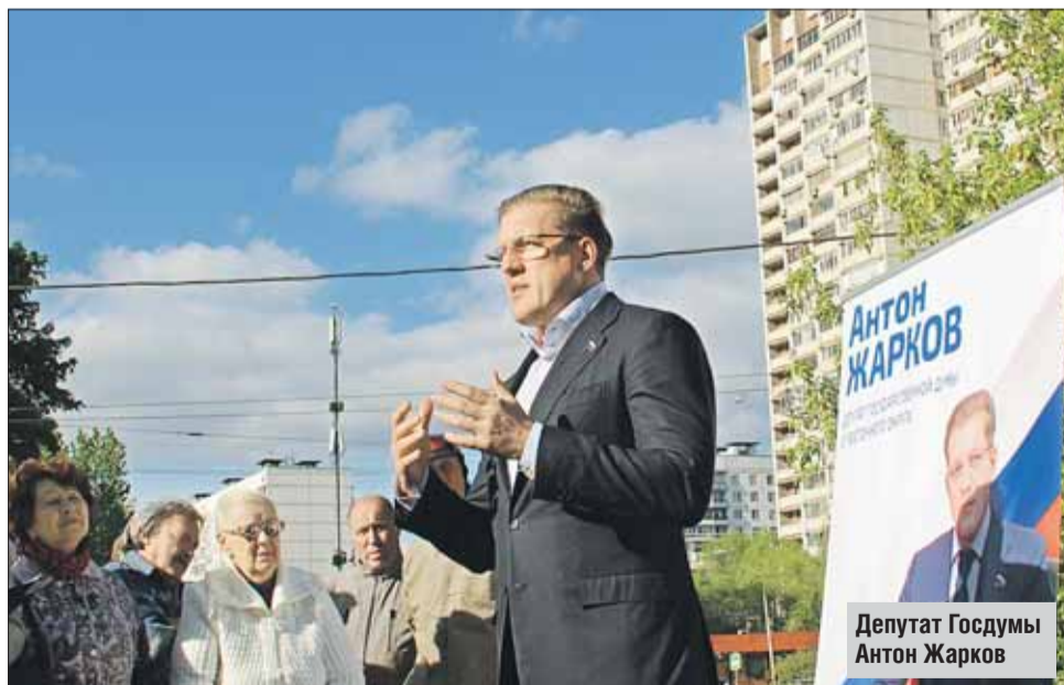
Депутат Госдумы Антон Жарков

Многое удалось сделать. Более чем из 300 обращений граждан практически