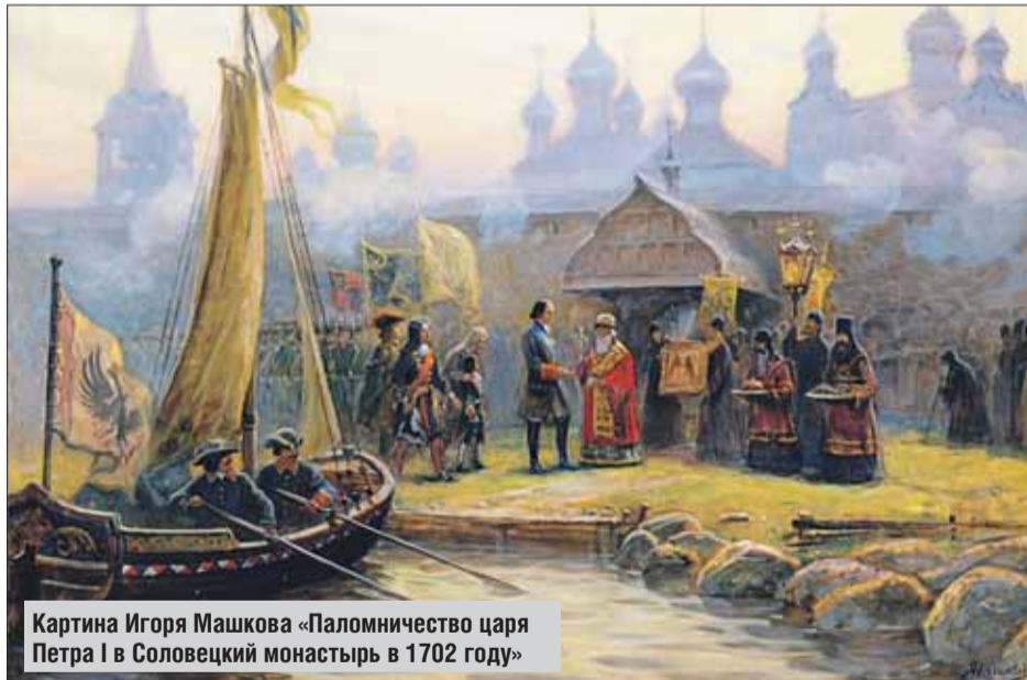
Картина Игоря Машкова «Паломничество царя Петра I в Соловецкий монастырь в 1702 году»

Выставка «Дорогой к Храму вечною идя» открыта в выставочном зале музея-усадьбы «Измайлово» (городок имени Баумана, 2, стр. 14).