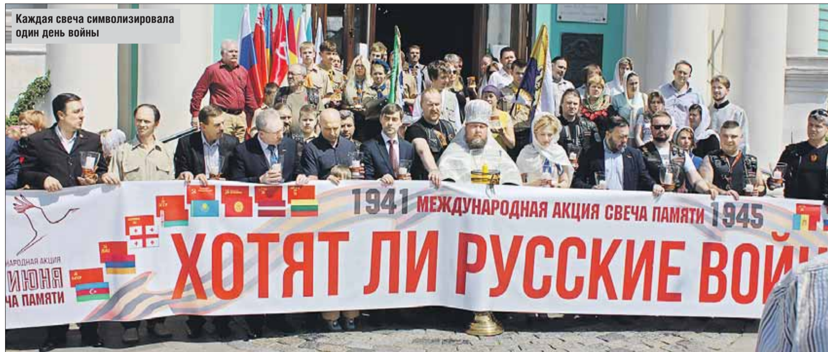
Каждая свеча символизировала один день войны

21 июня в Богоявленском соборе отслужили панихиду по всем павшим в войне