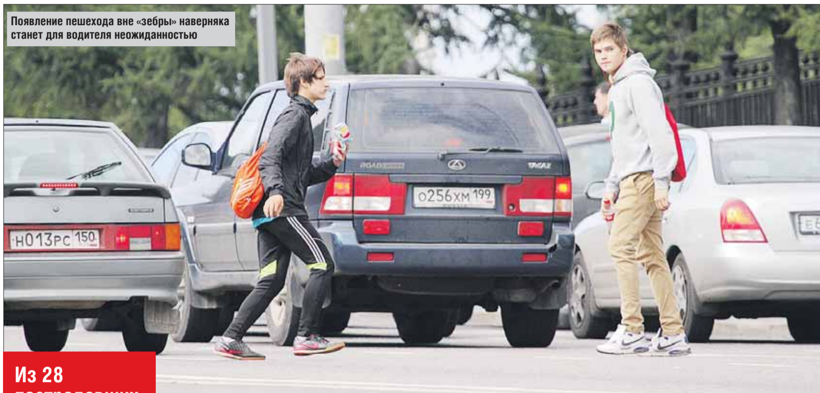
Появление пешехода вне «зебры» наверняка станет для водителя неожиданностью

■ Совет водителям: постоянно «сканируйте» возможные подходы к проезжей части и снижайте скорость там, где хорошо бы обзор этих подходов что-то мешает.