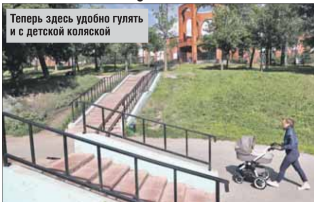
Теперь здесь удобно гулять и с детской коляской