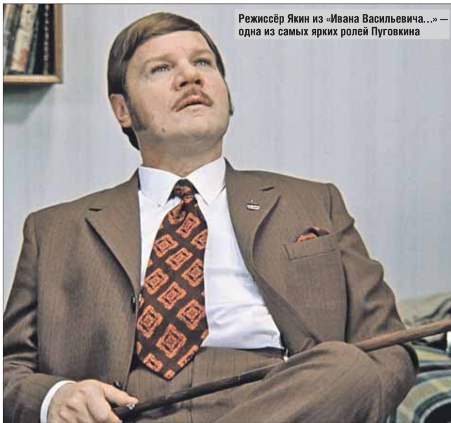
Режиссёр Якин из «Ивана Васильевича...» — одна из самых ярких ролей Пуговкина

Артист поменял свою двухкомнатную квартиру на Олимпийском проспекте на жильё в Ялте.