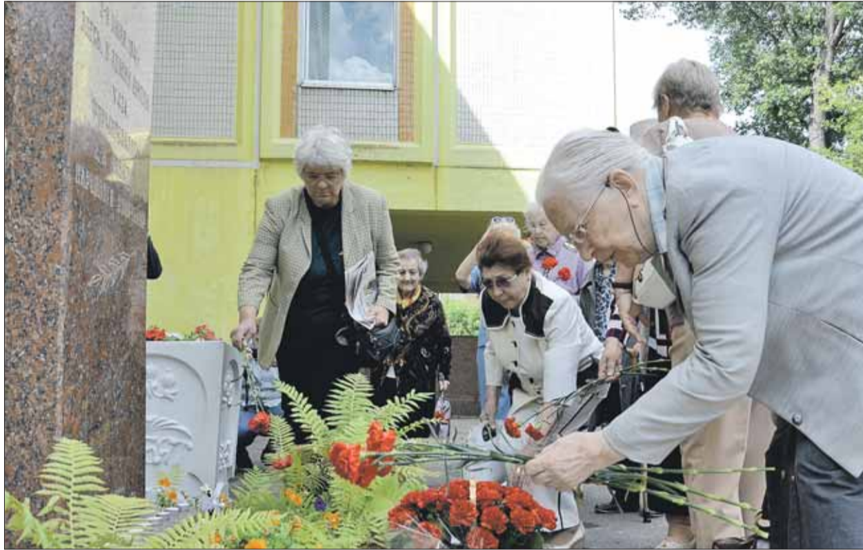
Отсюда в ночь с 7 на 8 июля несколько тысяч ополченцев отправились на фронт

Вопрос о создании в Москве народного ополчения был поднят уже 26 июня 1941 года. К 7 июля было сформировано 12 дивизий общей численностью 120 тысяч человек. Во 2-ю дивизию народного ополчения Сталинского района Москвы входило 12 тысяч москвичей. В основном это были жители Востока Москвы и работники местных предприя-