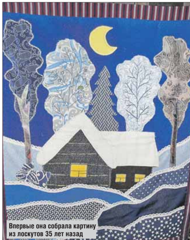
Впервые она собрала картину из лоскутков 35 лет назад

художник-передвижник Алексей Саврасов, тот самый, который нарисо-