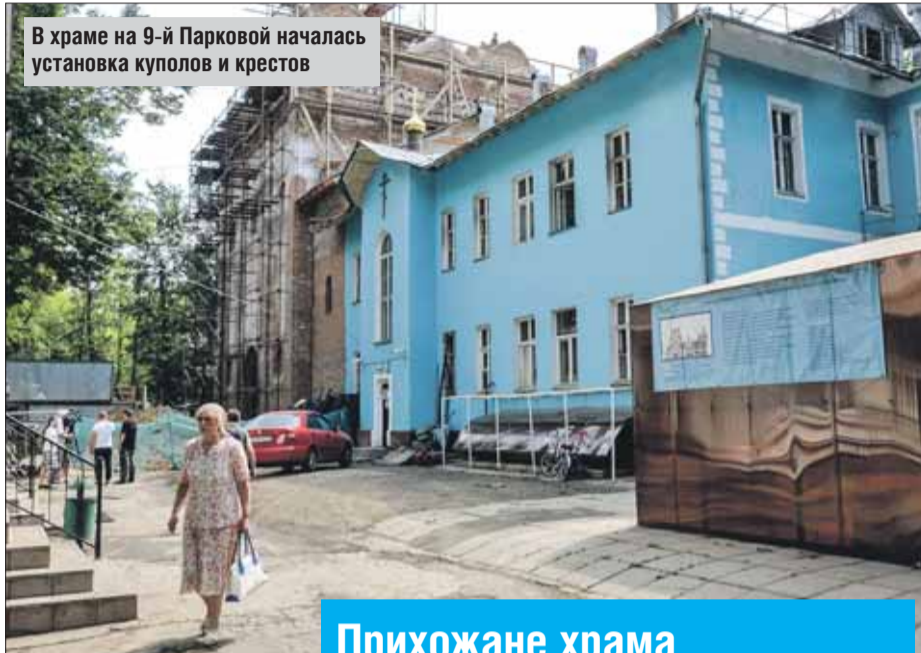
В храме на 9-й Парковой началась установка куполов и крестов

Сейчас в храме на 9-й Парковой улице началась установка куполов и крестов. Храм ещё не достроен, а приходская жизнь кипит. Прихожане оказывают помощь малоимущим семьям и одиноким людям. При приходе создана группа поддержки заключённых, которым на пожертвования верующих