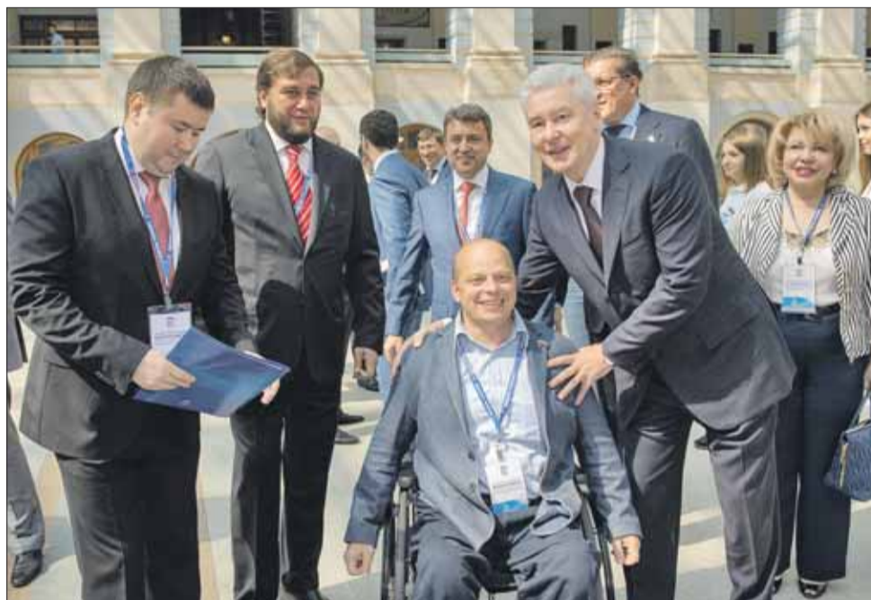
Программа, с которой идёт на выборы «ЕР», учитывает интересы всех москвичей

— Наши оппоненты любят говорить о проблемах