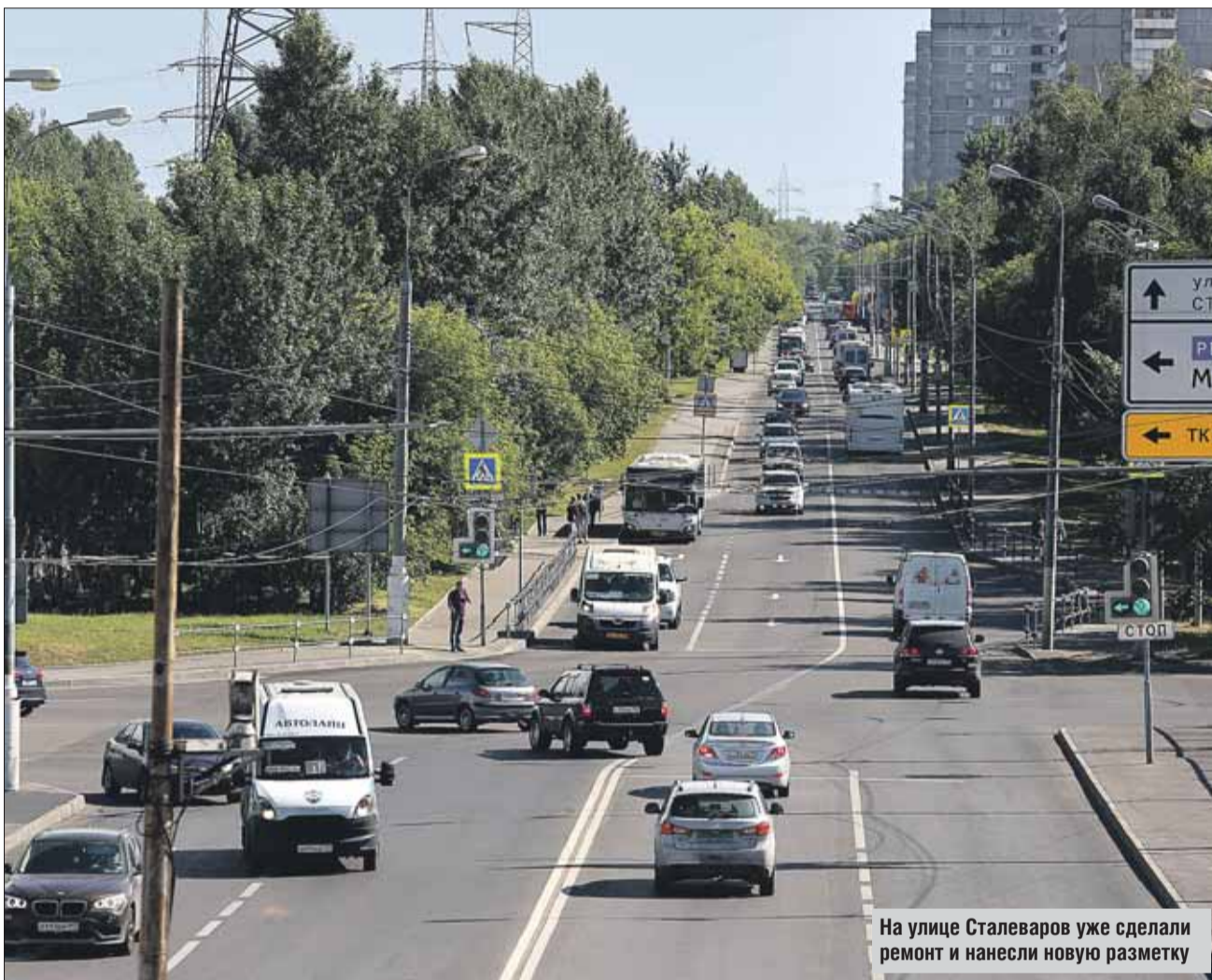
На улице Сталеваров уже сделали ремонт и нанесли новую разметку

Ещё 10 объектов сейчас находятся в работе.