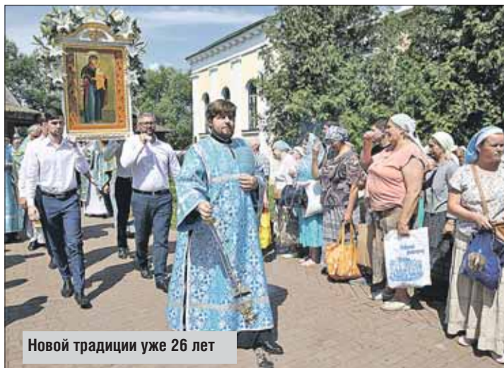
Новой традиции уже 26 лет