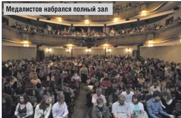
Медалистов набрался полный зал

думы Сергей Железняк. — Искренне рад, что в нашем Восточном округе