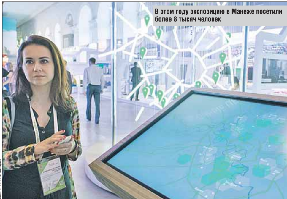
В этом году экспозицию в Манеже посетили более 8 тысяч человек

На месте бывшего Тушинского аэродрома разместится район спорта и инноваций