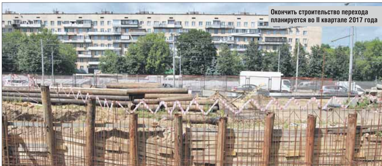
Окончить строительство перехода планируется во II квартале 2017 года