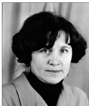
Они поженились в 1965-м

восточным сопкам: тоже увидели его, путешествуя. — Когда вернулись, рассказали на КПП, где брали пропуск — там военная часть стоит: «Вот мишку хотели поймать — не догнали». Они: «Москвичи? Это только вы ненормальные, люди от медведя, наоборот, ноги побыстрее уносят».