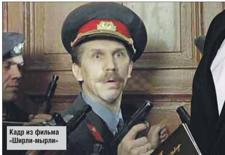
Кадр из фильма «Ширли-мырли»

— Снимали фильм «Под полярной звездой». Поздняя осень, снег, холодно... Мы снимаем сцену на озере, где два друга перевора-