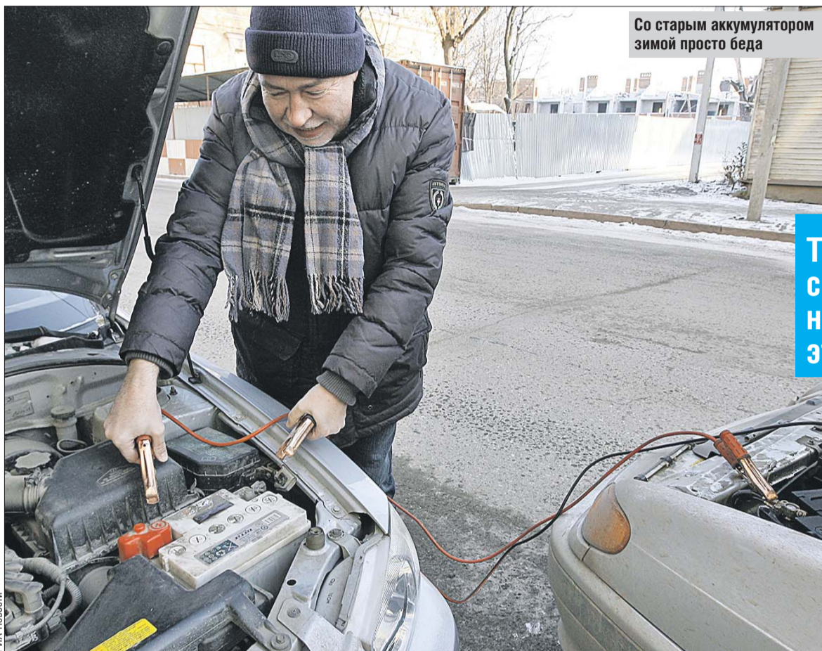
Со старым аккумулятором зимой просто беда

Кстати, о «липучке», то есть о зимней резине без шипов. Многими водителями замечено: в первый год она работает в гололедицу хорошо. Но уже ко второму сезону свойства могут измениться, а к третьему тем более. Хотя и шипованная резина, разумеется, подвержена износу, но там обычно всё очевидно.