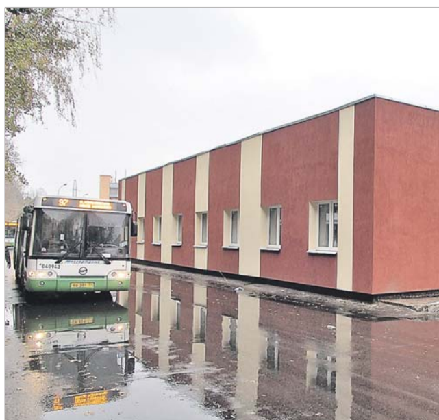
Это будет настоящая станция, а не просто разворотный круг