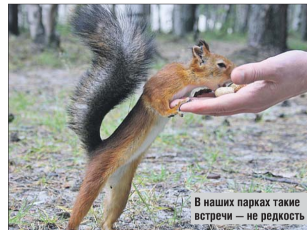
В наших парках такие встречи — не редкость