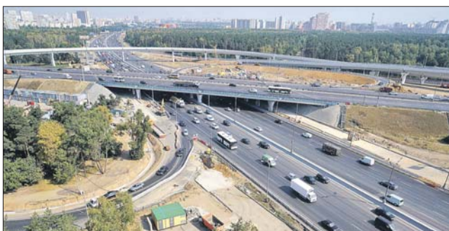
Реконструкция значительно улучшит трафик на МКАД