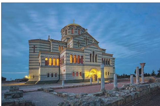
Владимирский храм в Херсонесе