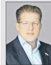
Антон Жарков, депутат Государственной думы

Город готов проводить реконструкцию развязки Щёлковского шоссе и МКАД, но это сложный инженерный процесс, который требует большого количества согласований и не может быть начат, пока не будет завершена окончательная трассировка по федеральной части Щёлковского шоссе на территории области. Так заявил недавно зам. мэра Москвы Марат Хуснуллин.