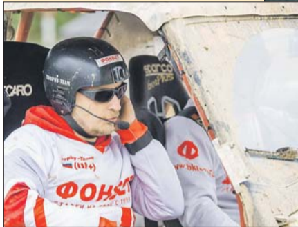
Роману по душе роль штурмана

Д ремучий лес, промозглый холод, мощный джип увяз в трясине. И ладно бы случайно. Так нет, эти люди специально ищут самые гиблые места, чтобы ещё раз проверить на прочность себя и машину. Их называют джиперами.