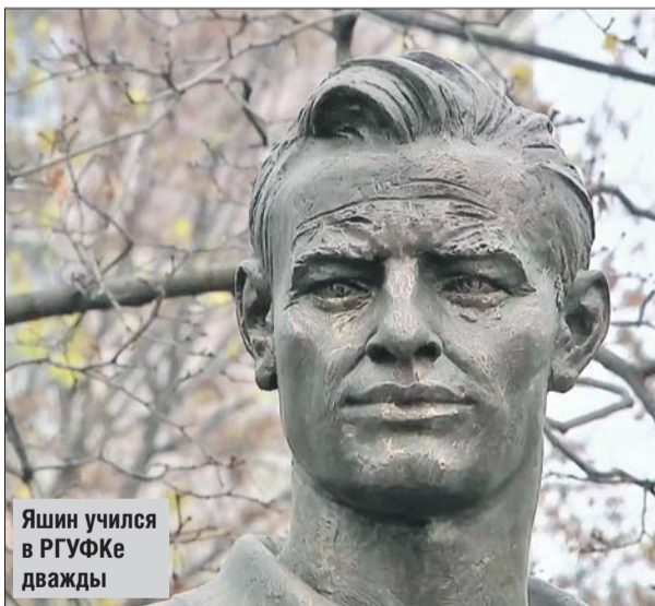
Яшин учился в РГУФКе дважды

— Начиная с 2017 года в день рождения Льва Яшина, 22 октября, в университете будут проходить футбольные турниры, посвящённые памяти великого вратаря. В них примут участие команды россий-