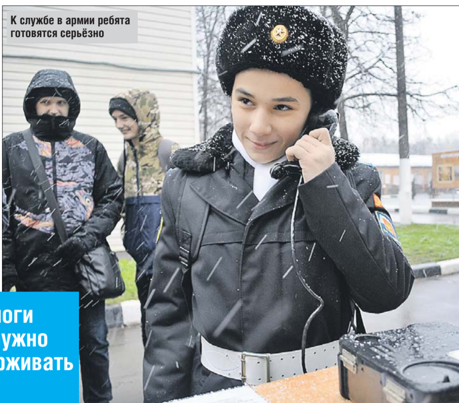
К службе в армии ребята готовятся серьёзно

— Завтра вы пойдёте в армию, я хотел бы пожелать вам пройти этот важный этап вашей жизни с достоинством и честью, — сказал предсе-