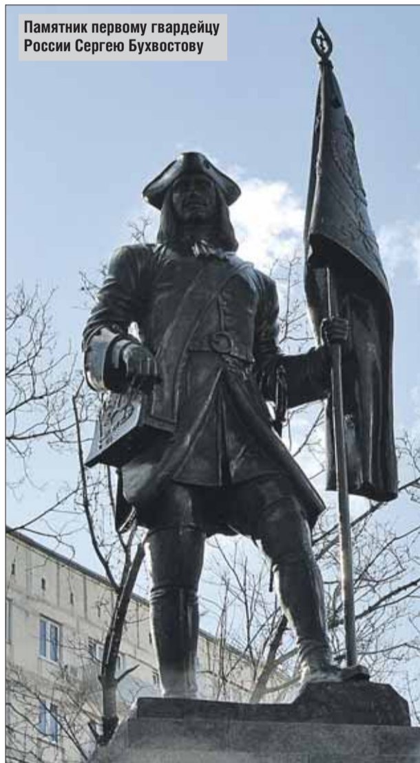
Памятник первому гвардейцу России Сергею Бухвостову