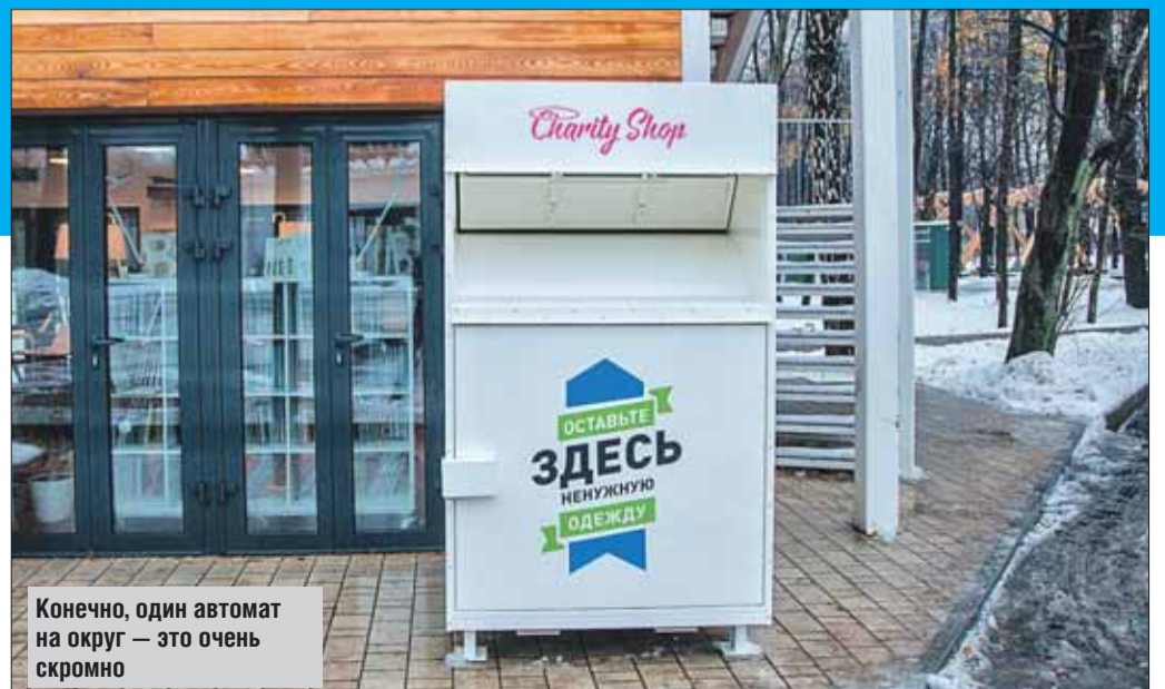
Конечно, один автомат на округ — это очень скромно