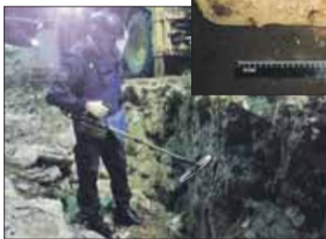
Минёры определили: авиационная осколочная бомба АО-10

се здесь используют керосин). — Специалисты установили, что найденный предмет является авиационной осколочной бомбой советского производства времён Великой Отечественной войны АО-10. Бомба была