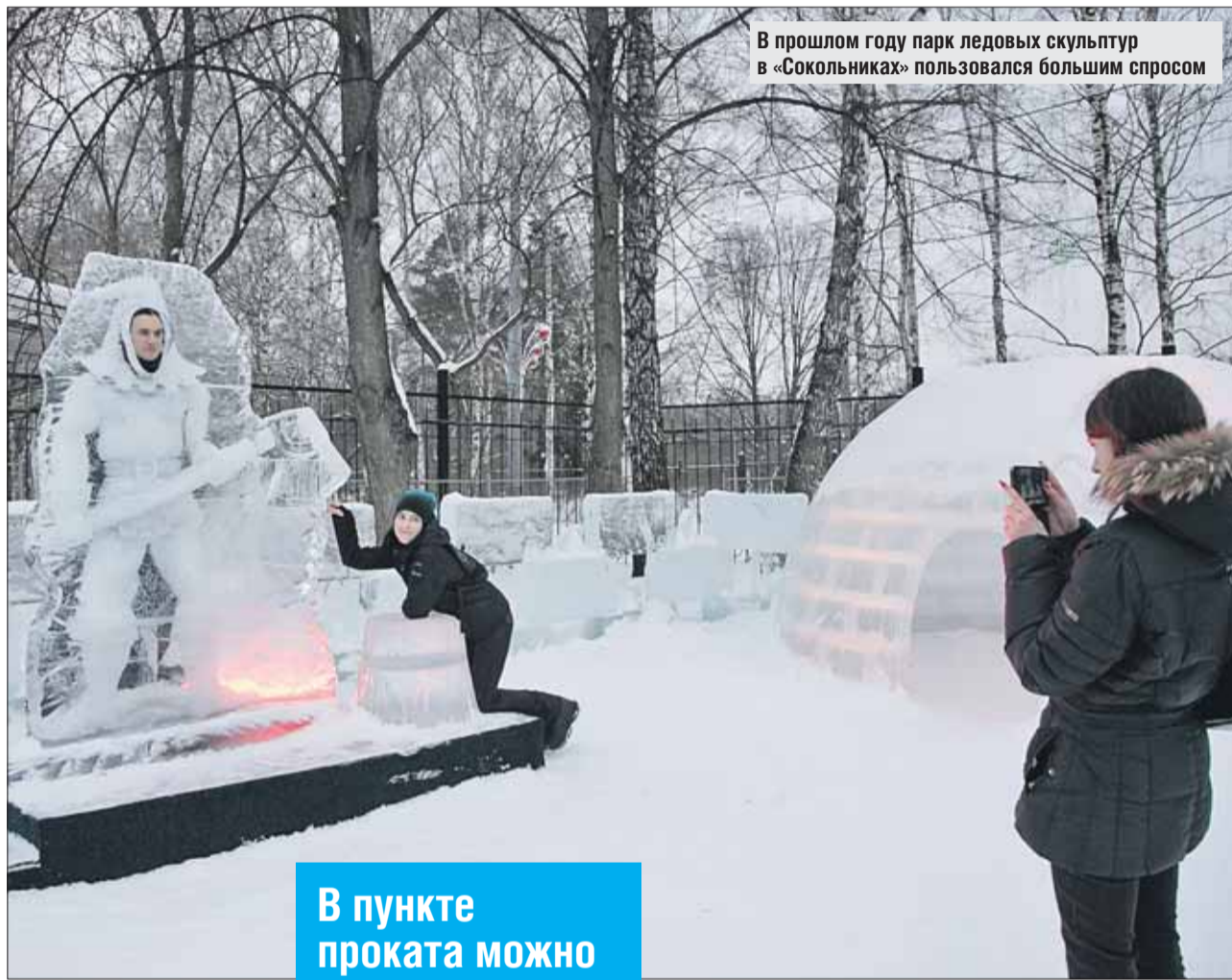
В прошлом году парк ледовых скульптур в «Сокольниках» пользовался большим спросом

Для любителей лыжных прогулок обустроят всепогодную лыжню. Она