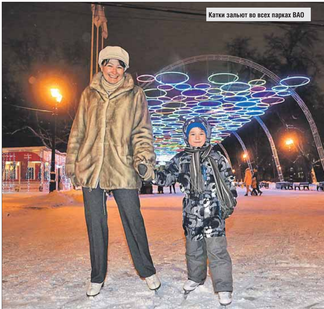
Катки залиют во всех парках ВАО