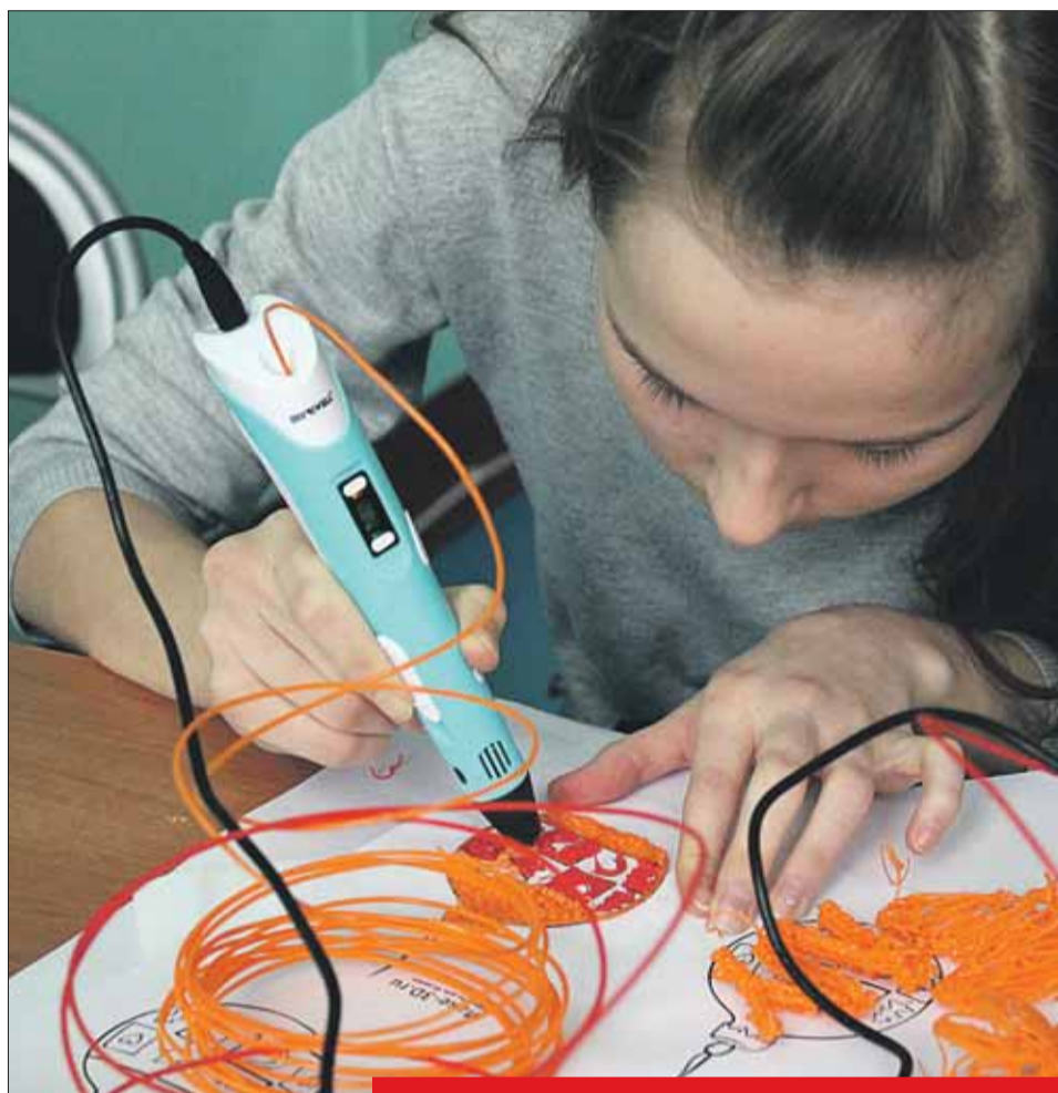
Вместо красок и кисти — разноцветная леска