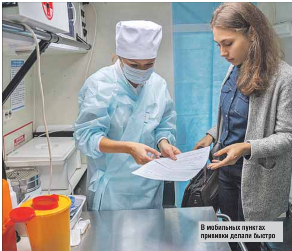
В мобильных пунктах прививки делали быстро

Около 24 тысяч жителей округа воспользовались мобильными пунктами у метро