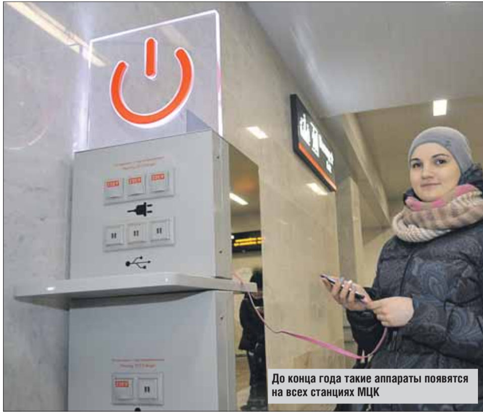
До конца года такие аппараты появятся на всех станциях МЦК

Каждая стойка оборудована 16 USB-выходами и 8 розетками с напряжением 220 вольт