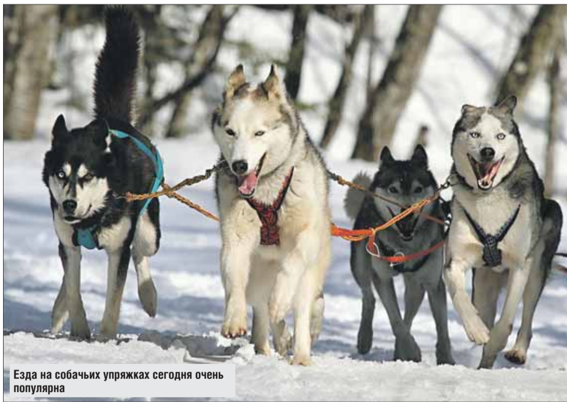
Езда на собачьих упряжках сегодня очень популярна