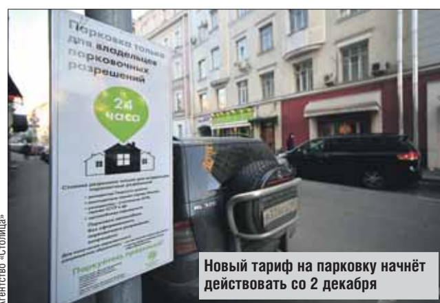
Новый тариф на парковку начнёт действовать со 2 декабря

За Третьим транспортным кольцом тариф останется без изменений. Максимальный тариф — 200 рублей в час — будет установлен на наиболее загруженных улицах: загружен-