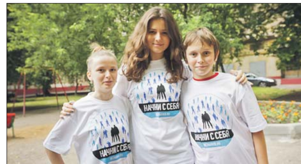
В базе волонтерского движения ВАО зарегистрировались 300 человек

Из постоянных волонтерских проектов, которые реализуются в округе, очень интересен, например, «В.Н.У.К.» — «Ветеранам нужен уход и компания». Волонтеры знакомятся с ветеранами, живущими в округе, приходят к ним, помогают по хозяйству и просто общаются. Также волонтеры постоянно ездят в детские дома