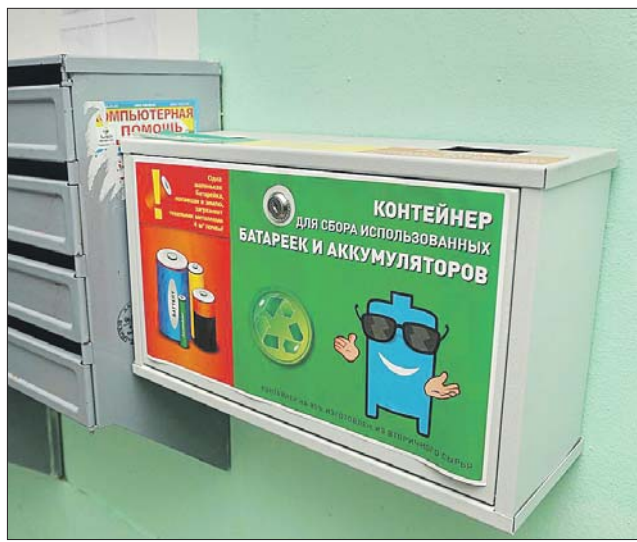
В подъездах некоторых домов установили контейнеры для батареек

Телефон ближайшей к вашему дому диспетчерской вам подскажут в диспетчерской службе района: