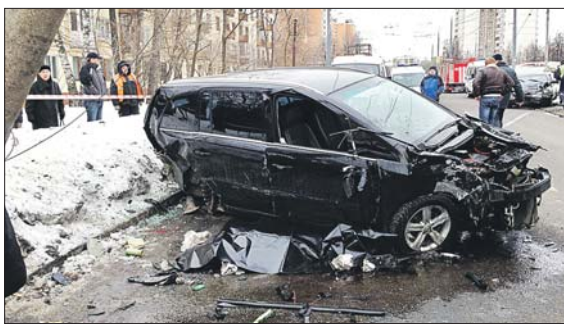
Через несколько минут после трагедии

В результате 12-летний мальчик, ехавший пристёгнутым на переднем пассажирском сиденье «Опеля»,