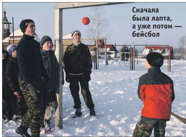
Сначала была лапта, а уже потом — бейсбол