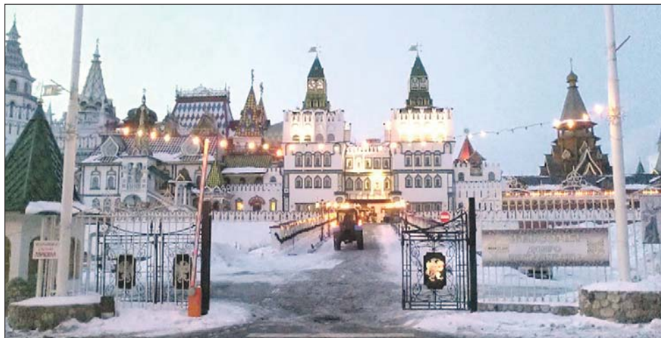
Кремль в Измайлово — дорогое удовольствие для молодожёнов