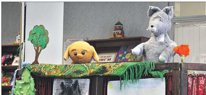
Театр начинается с детства