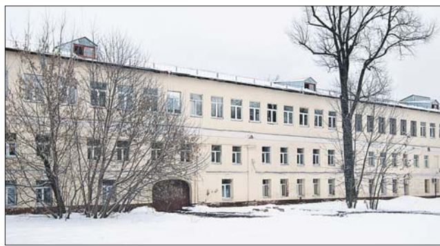
Сейчас дом 20 — это учебно-административный корпус МГУПИ

Удивительные истории дома 20 на Стромынке