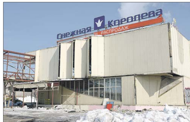
На этом месте построят транспортную развязку