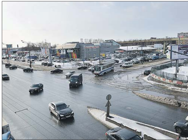
На проспекте Будённого появятся две эстакады

В районах Перово и Соколиная Гора прошли публичные слушания по Северо-Восточной хорде