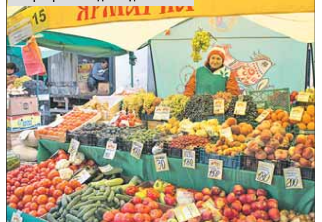
В этом году в ВАО будут работать 12 ярмарок выходного дня

говли и услуг управы Измайлово. — Жители ждут открытия ярмарки, звонят в управу, спрашивают, когда ждать фермеров, ведь в нашем районе альтернативы магазинам нет. И место удачное: площадка большая и популярна у жителей.