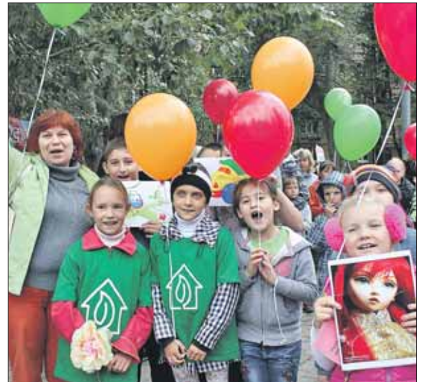
Ребята из клуба «Перово» поучаствовали в районной викторине для первоклашек

Семейный клуб «Перово» в тесных отношениях и с детскими домами. Благодаря клубу