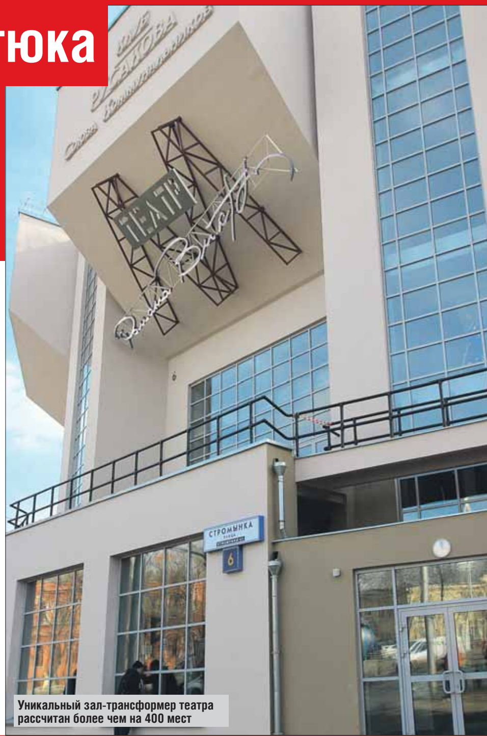
Уникальный зал-трансформер театра рассчитан более чем на 400 мест

Это единственный театр в городе, где можно использовать солнечный свет для постановки