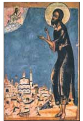
Икона Алексия, человека Божия

Родители долго и безуспешно искали сына. Их