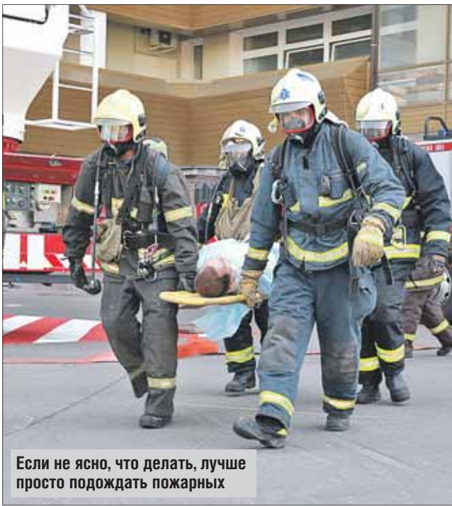
Если не ясно, что делать, лучше просто подождать пожарных

Итак, что ещё нужно помнить в экстремальной ситуации, чтобы сохранить жизнь себе и своим близким?