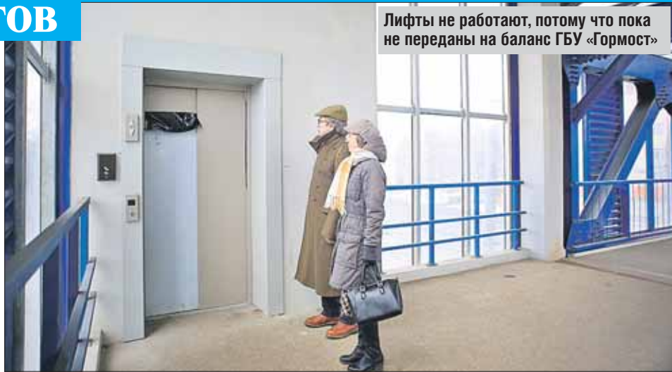
Лифты не работают, потому что пока не переданы на баланс ГБУ «Гормост»

Похожая картина в двух следующих переходах (ш. Энтузиастов, 86, корп. 1, и 88). Оба эти перехода ведут непосредственно в Измайловский парк. Нижние двери почти везде заблокированы (видимо, от чрезмерно любопытных и жаждущих покатасться на лифте) — где глыбой асфальта, где пнём. Желаящие, надо сказать, есть.