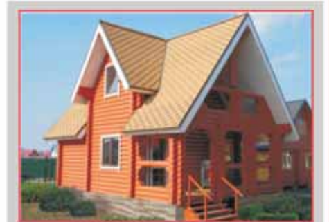
БАНЯ 6x8 м от 407 700 руб. с мансардой.