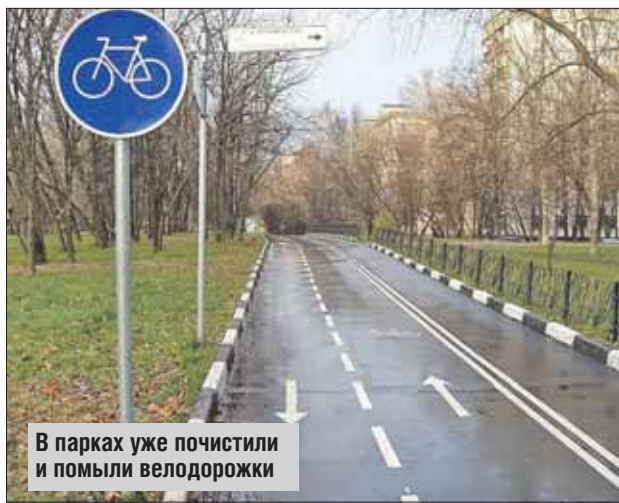
В парках уже почистили и помыли велодорожки

тивный велосипед, погонять на нём можно за 450 рублей в час. — Наши велодорожки сконцентрированы на Большом кругу и рядом с ним. Пункты проката можно найти на Главной