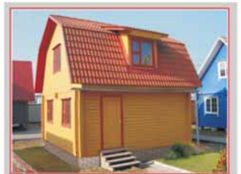
ДОМ 6x6 м от 318 600 руб.