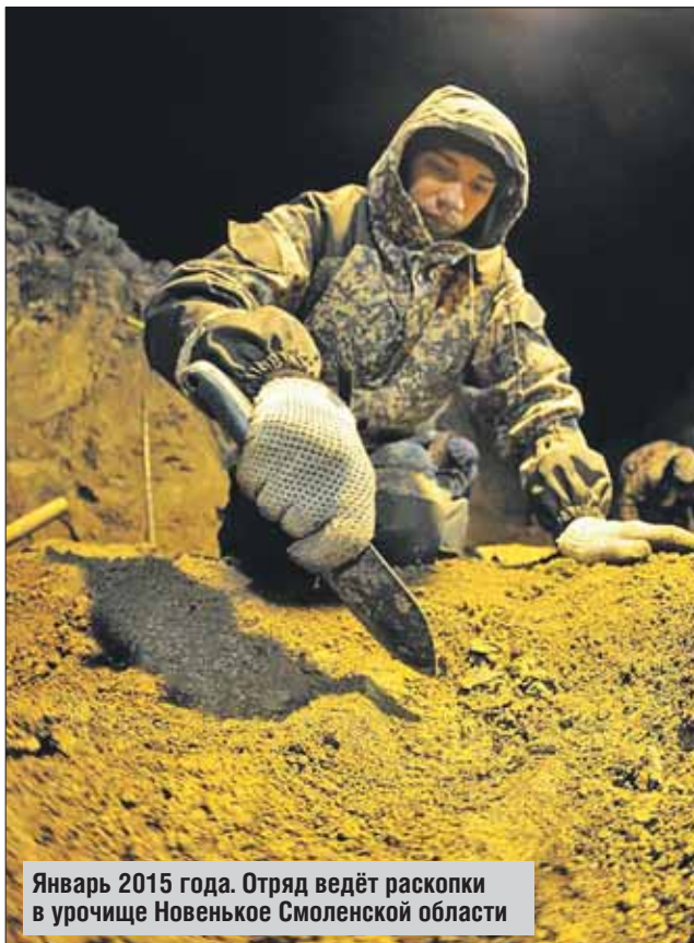
Январь 2015 года. Отряд ведёт раскопки в урочище Новенькое Смоленской области