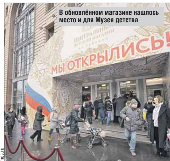
В обновлённом магазине нашлось место и для Музея детства

Сколько энергии сэкономил столице «Час Земли»