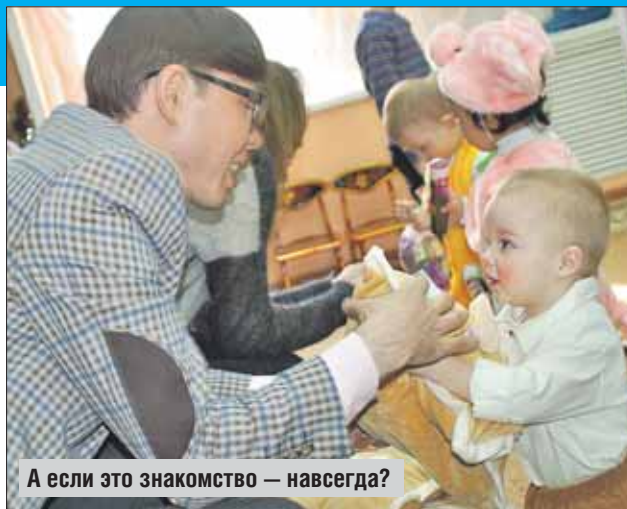
А если это знакомство — навсегда?