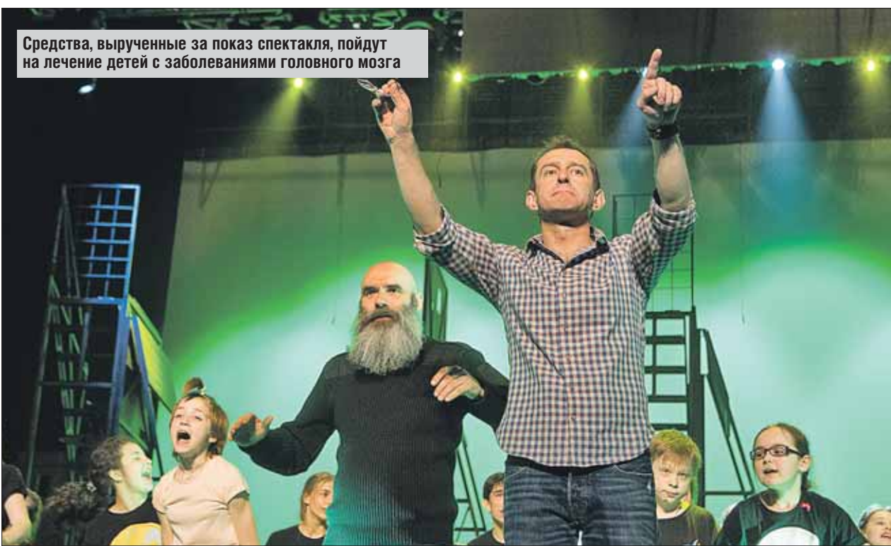
Средства, вырученные за показ спектакля, пойдут на лечение детей с заболеваниями головного мозга

— Маугли, вернись на исходную позицию. Бандерлоги, пожалуйста, всё