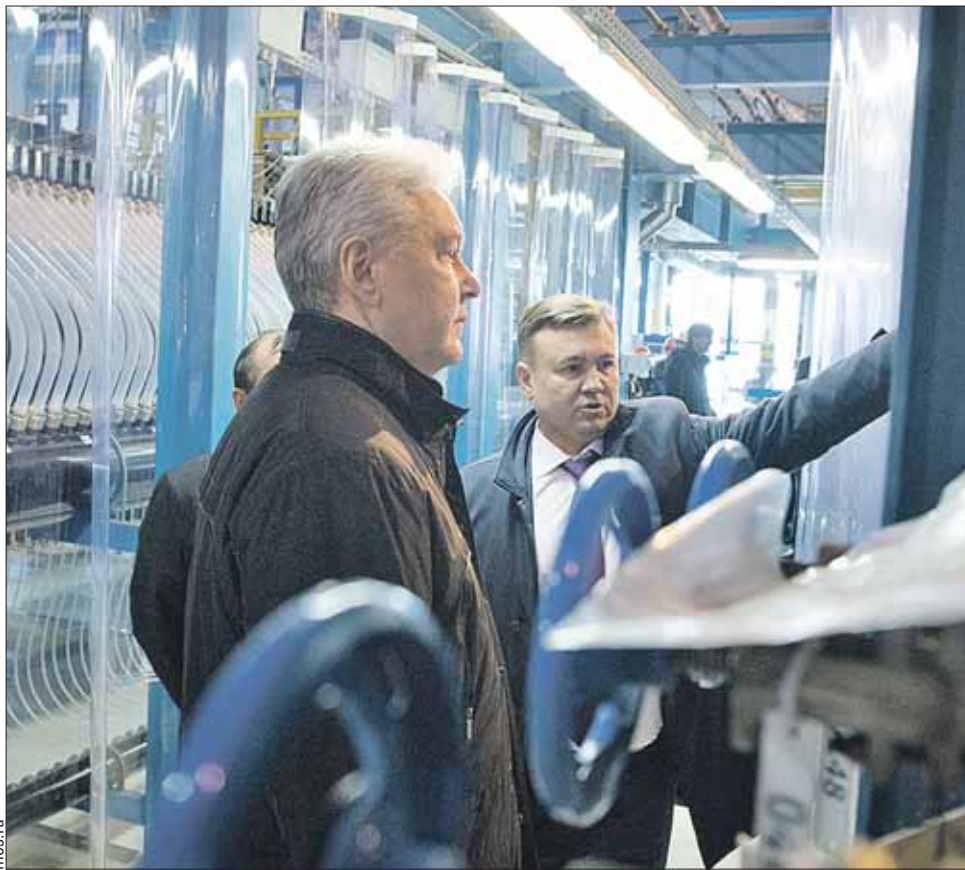
Завод полностью обеспечит Москву реагентами

В отличие от хлора, гипохлорит натрия невзрывоопасен и малотоксичен. Для человека вода, которую им очистили, безвредна. Гендиректор Мос-