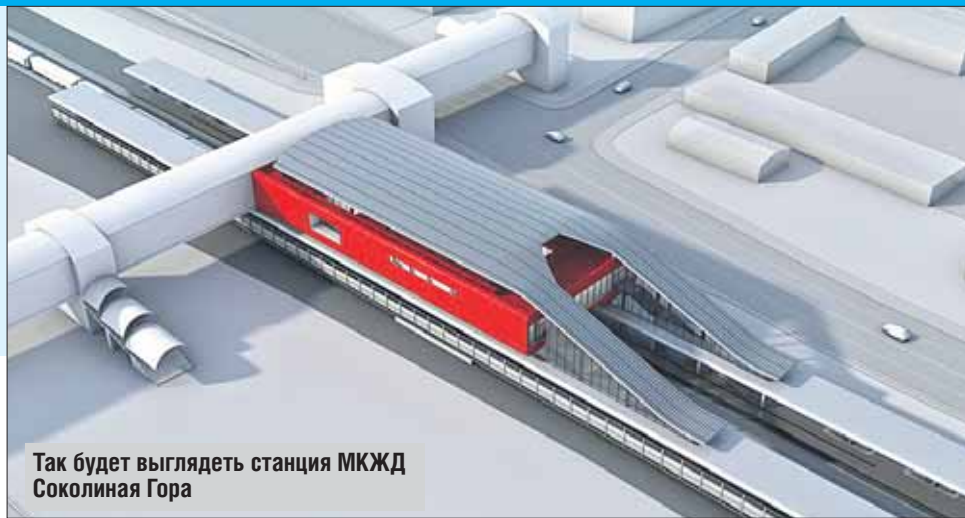
Так будет выглядеть станция МКЖД Соколиная Гора

Станцию «Лефортово» планируют построить в соседнем ЮВАО, примерно в одном километре на запад от станции Сортировочная Казанского направления железной дороги (по путям которого как