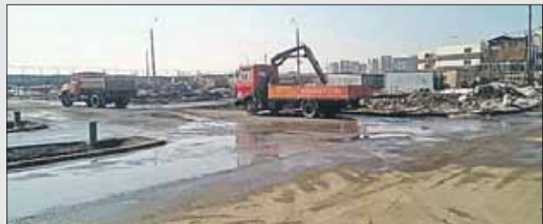
На Салтыковской улице чистили водоотстойные бассейны

Через неделю после обращения в управе Новокосино сообщили, что, оказывается, на этом участке ОАО «Мосводосток» проводило плановые мероприятия по очистке