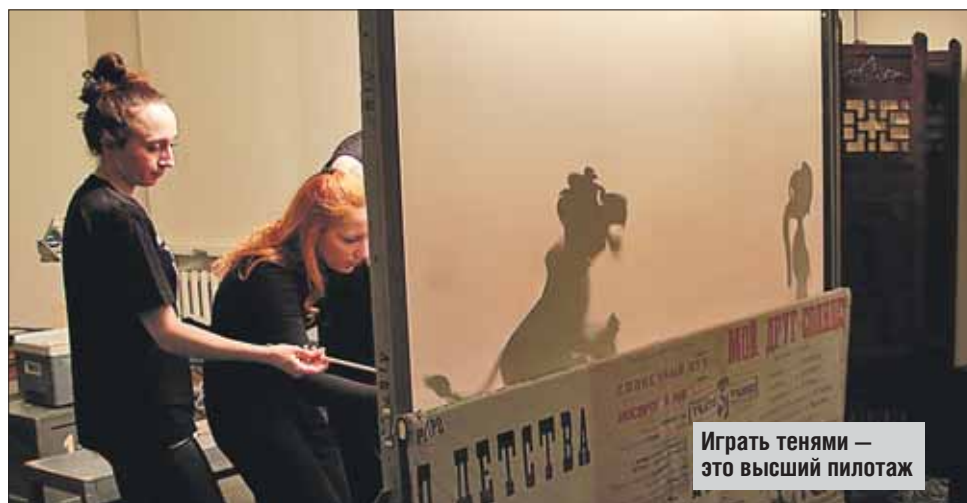
Играть тенями — это высший пилотаж

«Страшно видеть, — продолжает Антоний Сурожский, — что целый народ встречал Живого Бога, пришедшего с вестью о любви до конца, и отвернулся от Него». Именно об этом стоит вспомнить в Вербное воскресенье, чтобы тоже не отворнуться от главного ради сиюминутного.