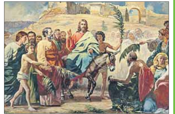
Жители Иерусалима встречали Иисуса как царя

Вот почему это действительно праздник со слезами на глазах.