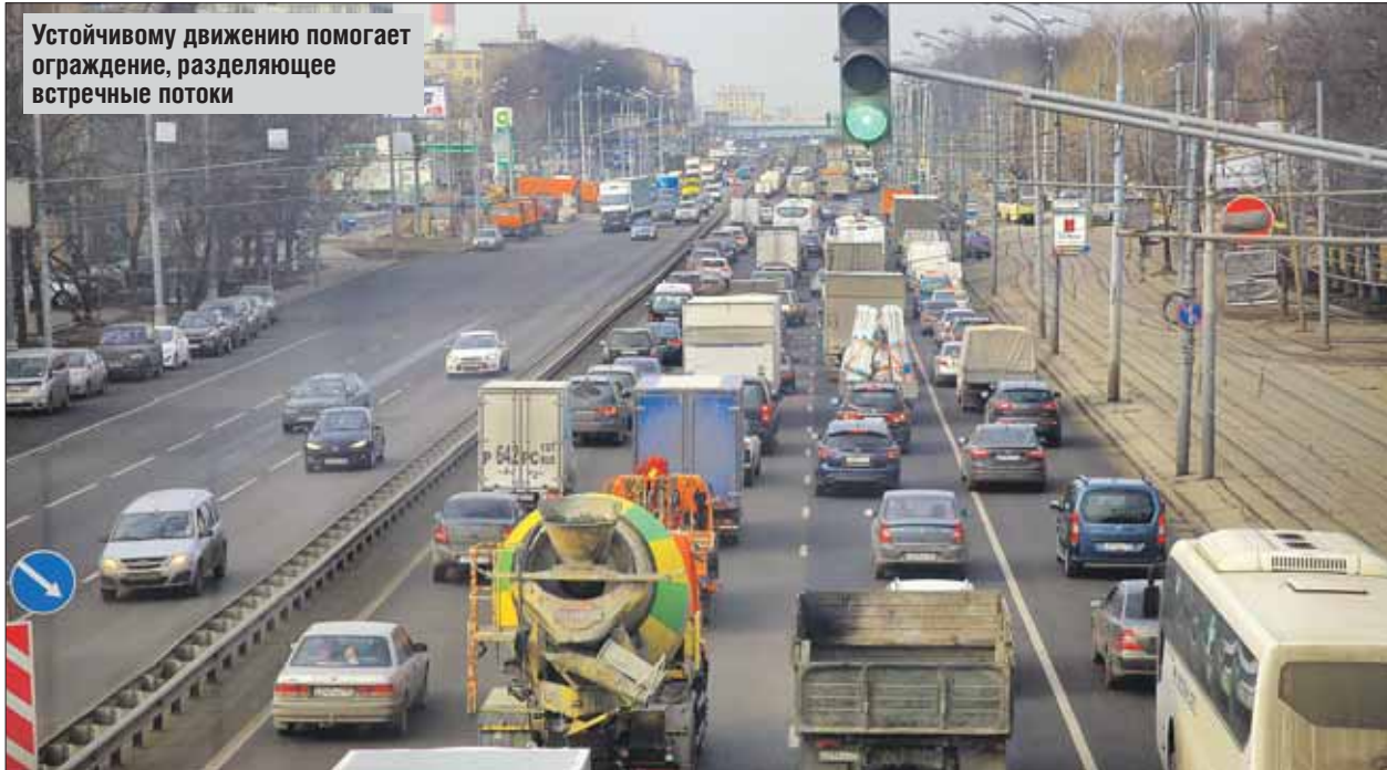
Устойчивому движению помогает ограждение, разделяющее встречные потоки

Сворачивая с ТТК на шоссе Энтузиастов в сторону области в самое пробочное время — в половине седьмого вечера. Вялотекущая пробка начинается почти сразу после развязки с ТТК. Впрочем, по субъективным ощущениям до реконструкции было ещё хуже. Во всяком случае, до метро «Авиамоторная» удаётся добраться за несколько минут. После загруженного перекрёстка у метро поток на короткое время ускоряется, но метров через двести — снова пробка. Тянется она около километра: возле дома 38 большая огороженная стройплощадка, из-за которой дорога сужена до двух с половиной рядов. Что строят? Табличек нет, но за ограждением угадываются очертания спуска в будущий подземный переход. На