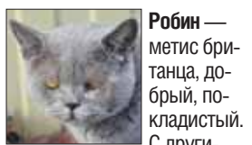
Робин — метис британца, добрый, покладистый. С другими животными ладит, в конфликтах не замечен.