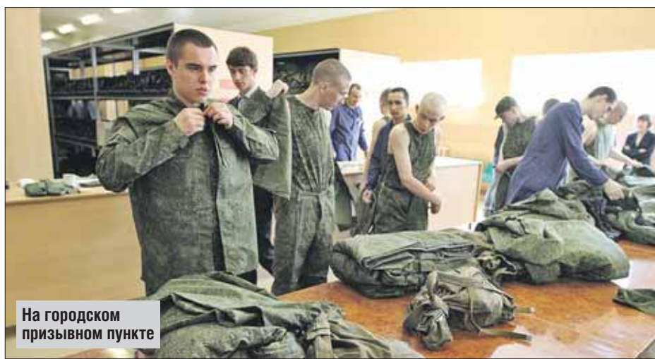
На городском призывном пункте