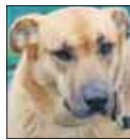
Райса Захаровна — живёт в приюте с 2009 года — с самого его открытия.

В Кожуховском приюте для бездомных животных (район Косино-Ухтомский, проектируемый проезд №265) содержится около 2500 собак и кошек. Волонтеры постоянно ухаживают за ними, общаются, чтобы те были готовы к встрече с потенциальными хозяевами. Ведь каждый пёс и кот хочет обрести дом.