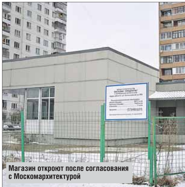
Магазин откроют после согласования с Москомархитектурой