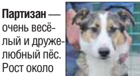
Партизан — очень весёлый и дружелюбный пёс. Рост около 50 см в холке.

К людям относится с огромной любовью. Подойдёт любой семье, но без других животных.