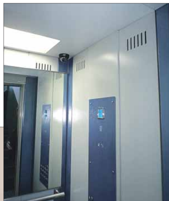
В новых лифтах стоят камеры видеонаблюдения

Вообще, льгот «правильному» ЖСК полагается много. Только не все о них знают. К примеру, в рекомендациях городского Департамента ЖКХ и благоустройства о примерной форме договора на поставку ресурсов есть