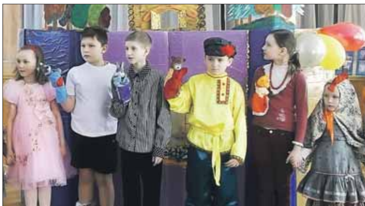
Труппа кукольного театра «Теремок»

Занятия в театральной студии «Талант» (Напольный пр., 16) проходят два раза в неделю. Сюда принимают детей от 4 лет. Ребята развивают внимание, учатся раскрепощению, изучают актёрское мастерство, сценическую речь.