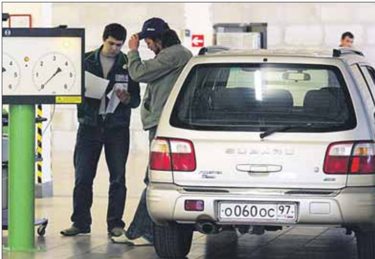
Теперь вместо талона ТО не выдают диагностическую карту

МОЖНО ЭКОНОМИТЬ НА ТЕХНИЧЕСКОМ ОСМОТРЕ АВТОМОБИЛЯ