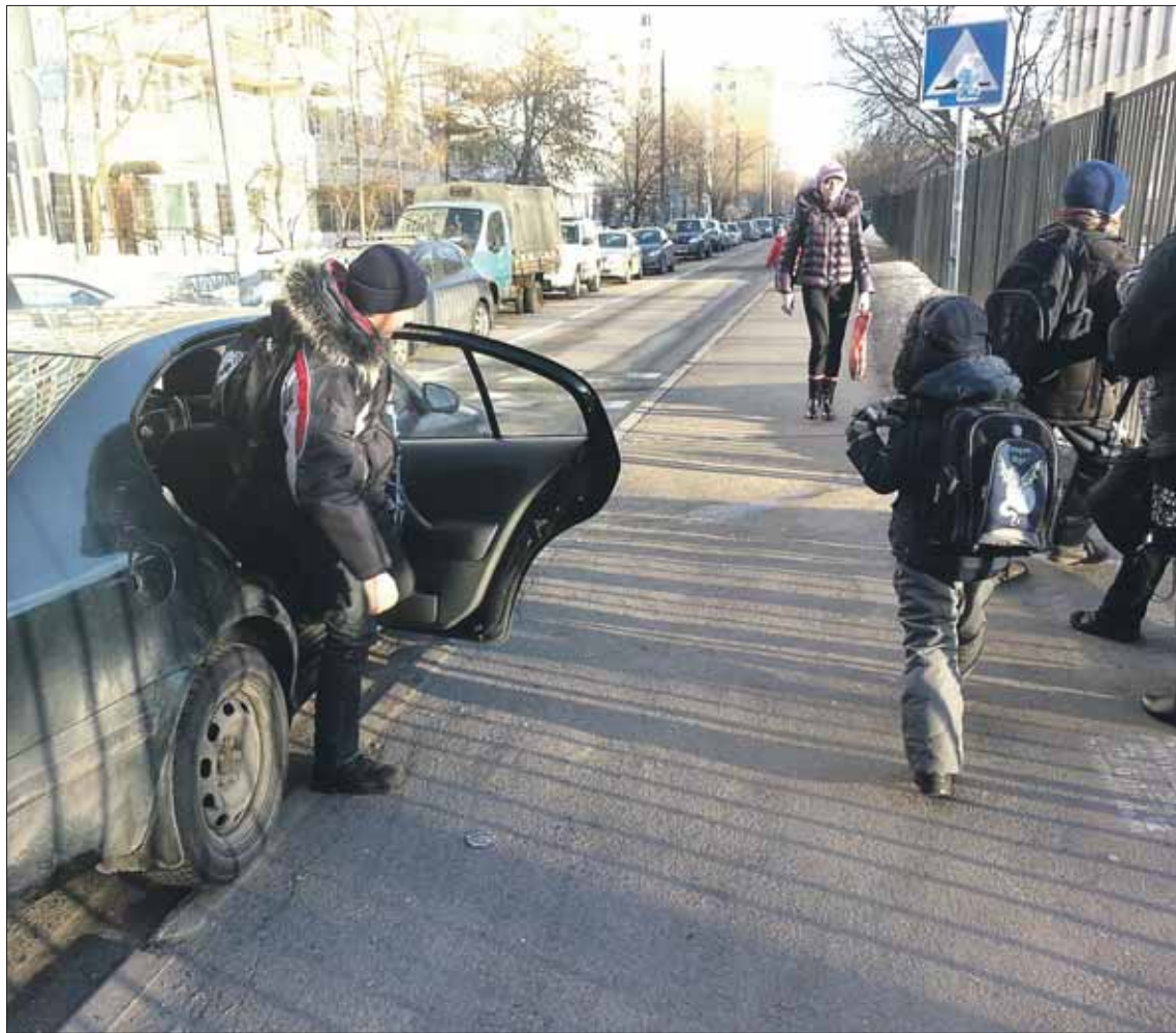
Школа №1080 по улице Знаменской, 12/4. Припарковать машину нигде