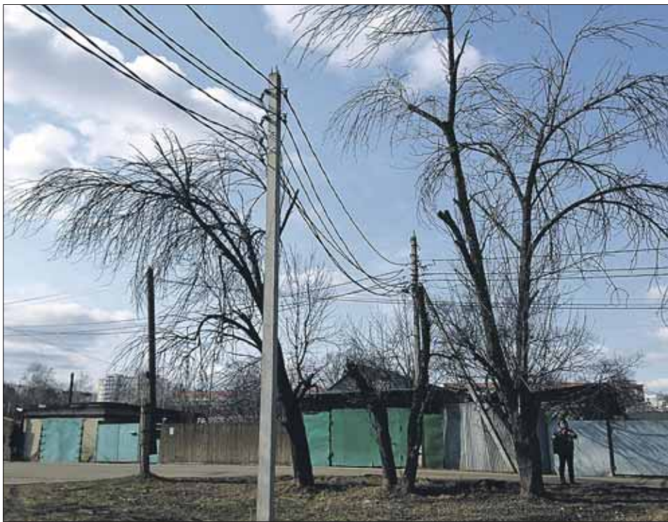
Ветки, нависающие над проводами, спиливают по предписанию Мосэнергo

Проезжую часть и прилегающую территорию на 1-м Красковском с 1 марта обслуживает ГБУ «Жилищник района Косино-Ухтомский». Однако рубить и пилить ветки,