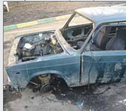
Этот автомобиль на Никитинской, 9, без сомнения, брошенный

ковать свои автомобили рядом, так как по ночам этот автомобиль кто-то разбивает всё больше и больше». Раскученную машину вывезли без разговоров.