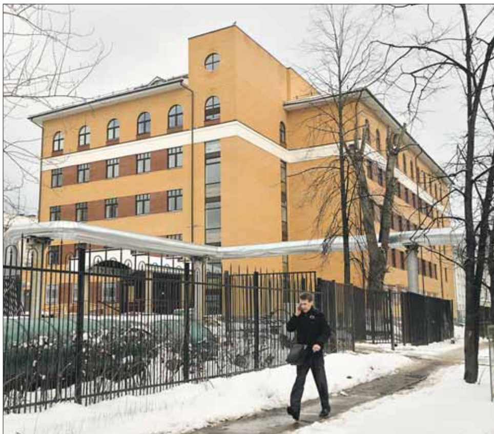
Лабораторно-диагностический корпус ДГКБ на Верхней Первомайской, вероятно, придётся снести