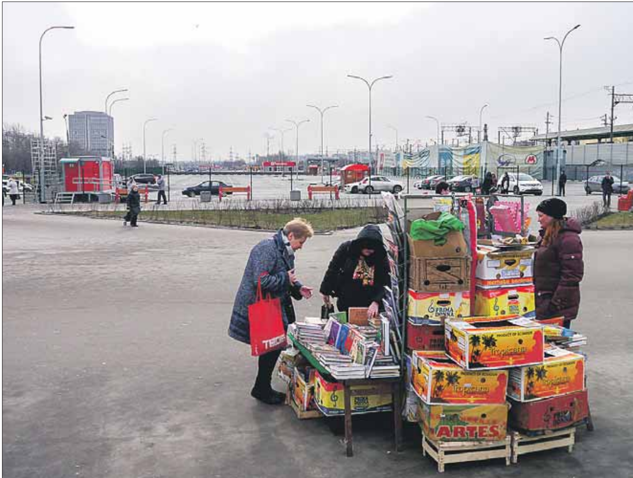
На эту торговлю есть разрешение

Охранники и примкнувшие к ним полицейские начинают зачи-