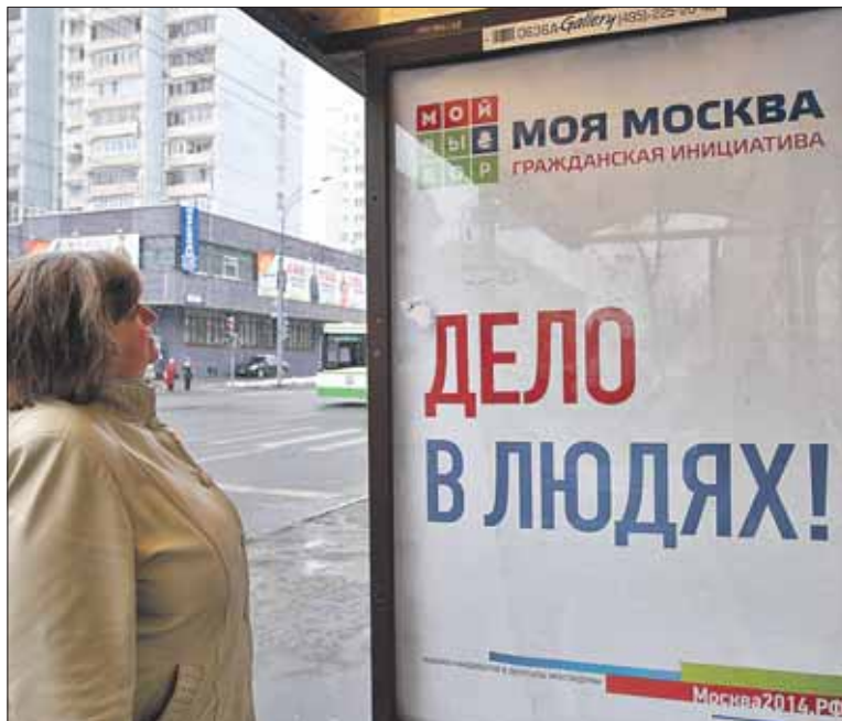
Информационный щит на улице Первомайской, 117 (остановка общественного транспорта «15-я Парковая»)

Выборщиком 8 июня может стать любой гражданин РФ от 18 лет и старше, имеющий постоянную регистрацию в Москве. Чтобы принять участие в голосовании, нужно начиная с 7 апреля и не позднее 3 июня подать заявление-анкету в один из пунктов оргкомитета по проведению