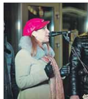
Депутат Мосгордумы Вера Степаненко

ли Департамента природопользования столицы и других организаций, а также глава комиссии по экологии в Московской городской думе Вера Степаненко.