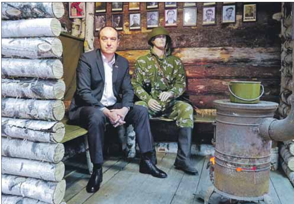
Мини-музей в фонде «Застава святого Ильи Муромца»

— За прошлый год, к примеру, мы подняли 350 солдат, считавшихся пропавшими без вести, 14 из