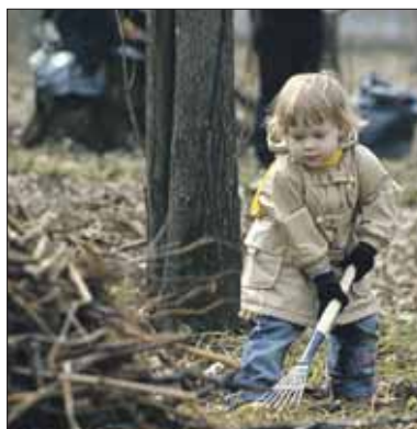
кольники. — Инвентарём всех обеспечим.

— По каждому из этих адресов ждём по 300 волонтеров, — сообщили в управе района Со-