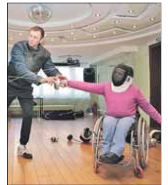
В секцию приглашают всех желающих

— Мы приглашаем всех желающих независимо от уровня начальной подготовки, — рассказывает он. — Оружие и снаряжение (маски, защитные куртки и т.д.) спортсмены получают бесплатно. Прежде всего цель нашей секции — социализация человека с заболеванием опорно-двигательного аппарата. А если в ходе тренировок возникнет желание, можно будет составить индивидуальную программу с прицелом на участие в паралимпийских соревнованиях.