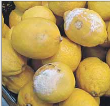
«Аппетитные» лимоны в магазине на Сиреневом бульваре