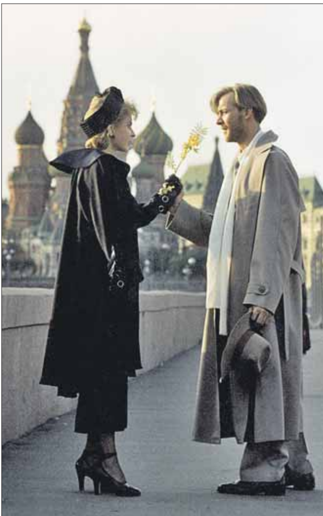
Мастер в фильме «Мастер и Маргарита»