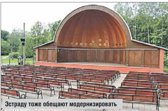
Эстраду тоже обещают модернизировать

лекторий, общественно-культурный центр, чайную и т.д., начнёт работу летом. Гостей примут также обновлённый «Краснодарский домик», где разместятся музей парка и контактный зоопарк (заработает в июле), обитателями которого станут ёжики, сурикаты, белки, морские свинки и другие живот-