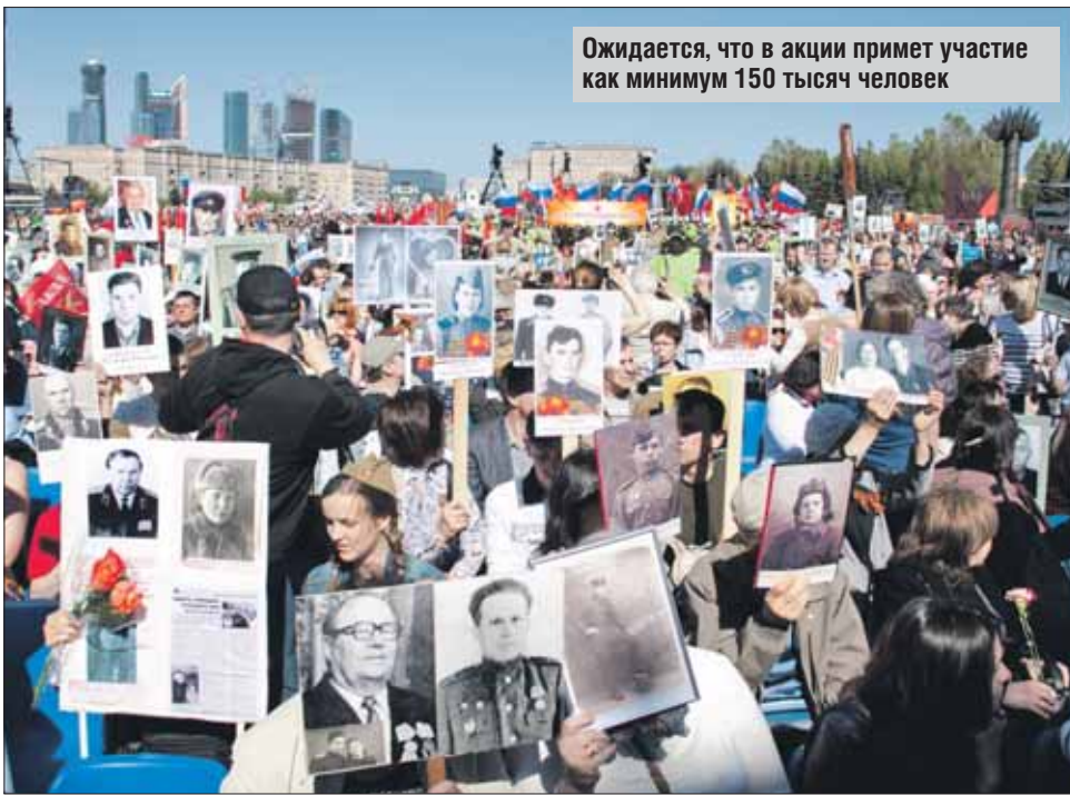
Ожидается, что в акции примет участие как минимум 150 тысяч человек

Важный момент: потенциальных участников демонстрации просят заранее зарегистрироваться на сайте www.parad-msk.ru . Те, кто заведомо заявит о своём участии, смогут получать информационную рассылку, где будут указаны точное время, место сбора и другие необходимые сведения.