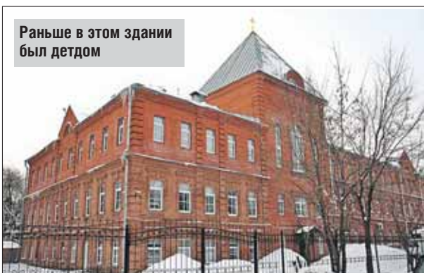
Раньше в этом здании был детдом

Поддержать дом сестринского ухода можно, сделав пожертвование на портале miloserdie.ru www.miloserdie.ru/friends/about/svjato-spiridonievskaja-bogadelnja/donate/