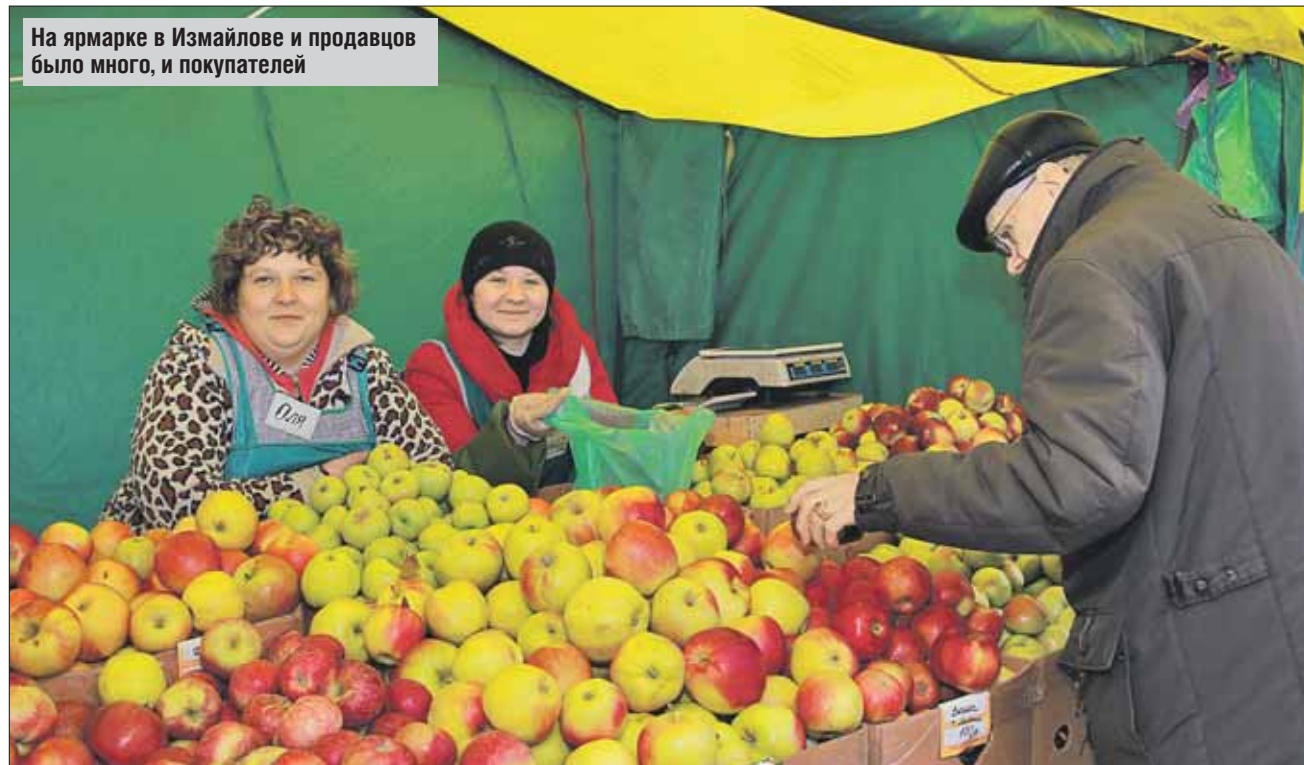
На ярмарке в Измайлове и продавцов было много, и покупателей