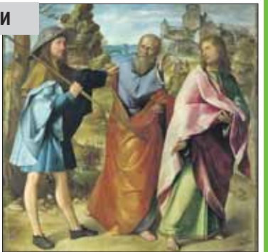
Альтобелло Мелоне. Дорога в Эммаус

В этом году Пасха у нас отмечается 12 апреля. Ночью в храмах зазвучат радостные восклицания: «Христос Воскресе!» И для многих людей на несколько дней эти слова станут повседневными приветствиями. А ведь даже апостолы не решались поначалу произнести эти привычные теперь для нас слова и поверить в них. Стоит вспомнить, как это было.