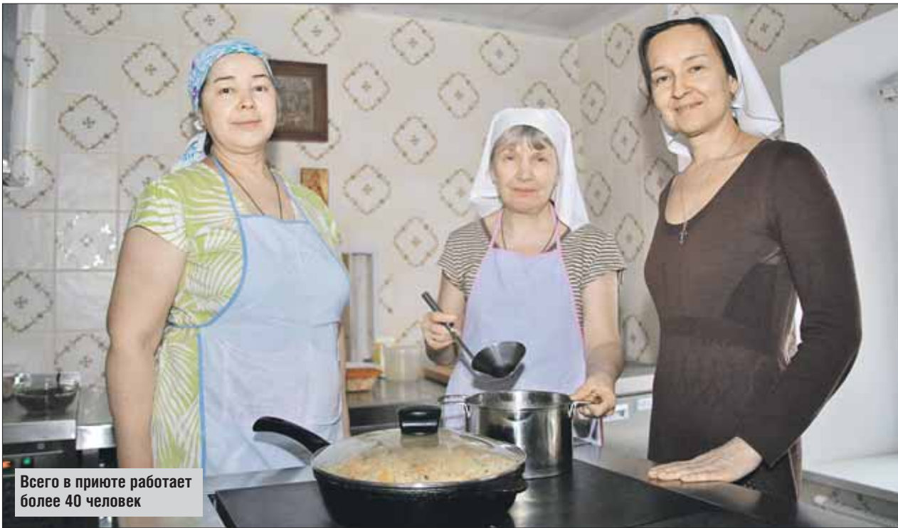
Всего в приюте работает более 40 человек