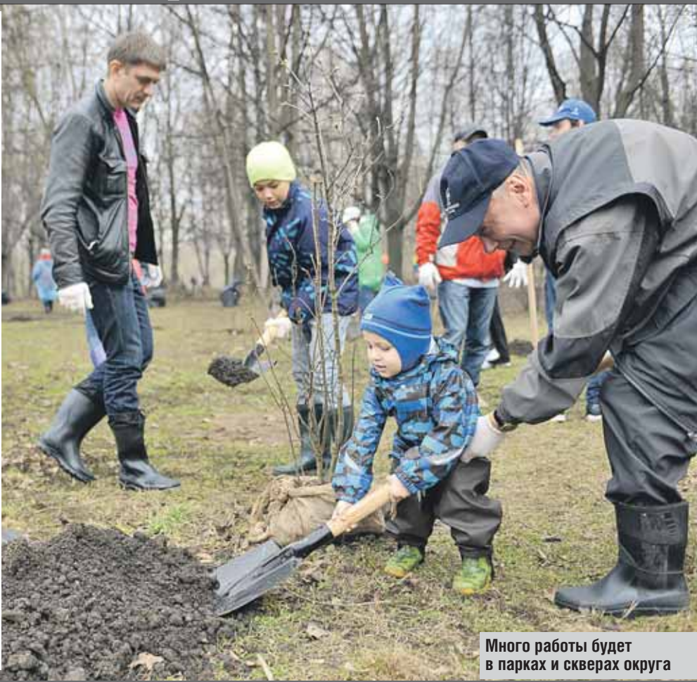
Много работы будет в парках и скверах округа