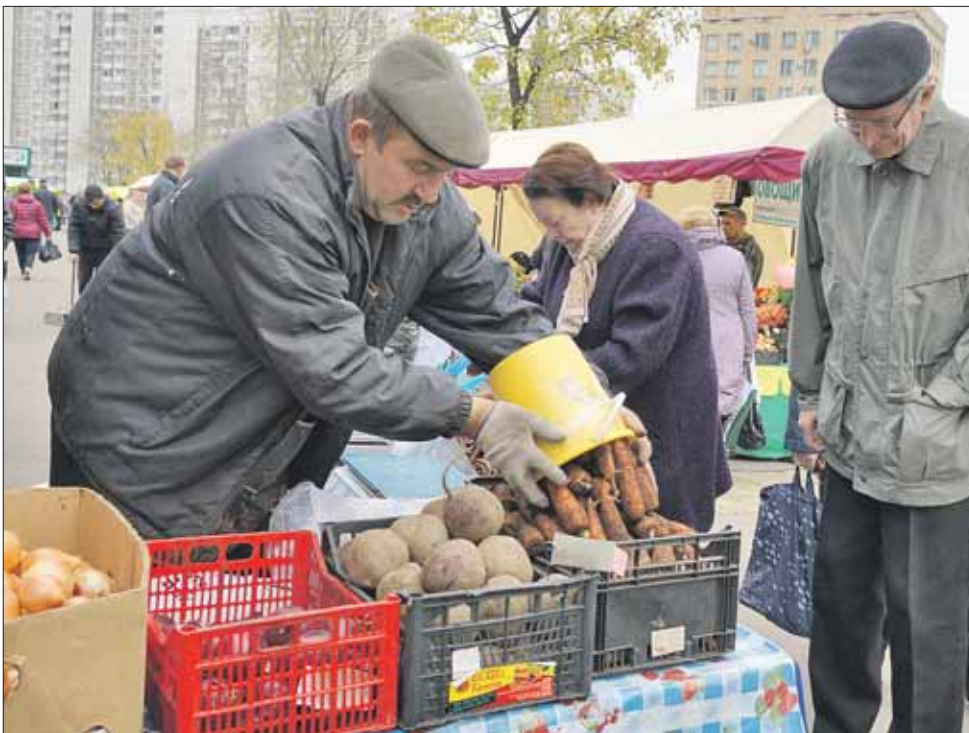
Люди соскучились по натуральным продуктам

— Фермерство — наше семейное дело. Ещё бабушки с бабушками передали нам свои секреты,