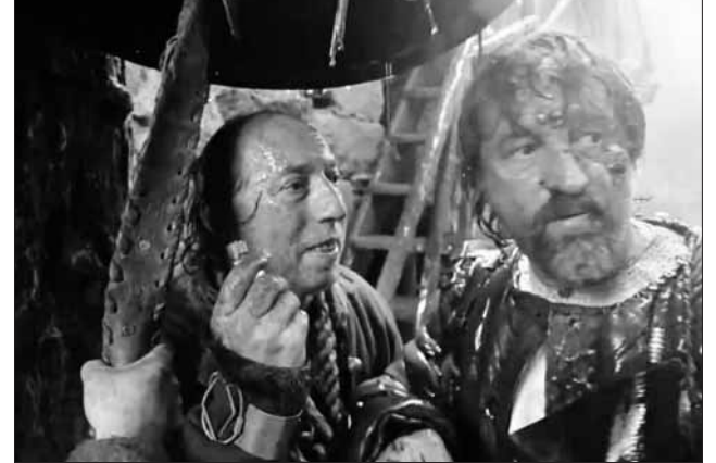
Кадр из фильма «Трудно быть богом»

— Первый фильм, в котором я снялся, — музыкальная сказка «Мама». Когда мама меня спросила, кто там ещё будет сниматься, я сказал, что Гурченко будет играть козу, а Боярский — волка. Мама