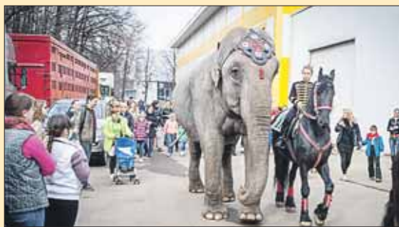
Слонов выведут на первую весеннюю прогулку