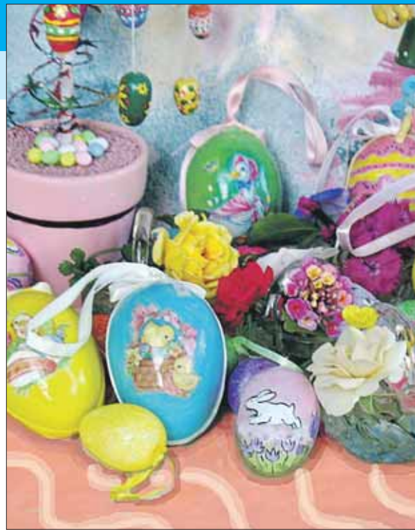
Пасхальные яйца как только не разрисовывают