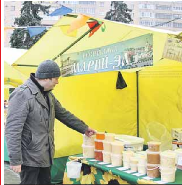
Марийские мёд и сало оценили многие