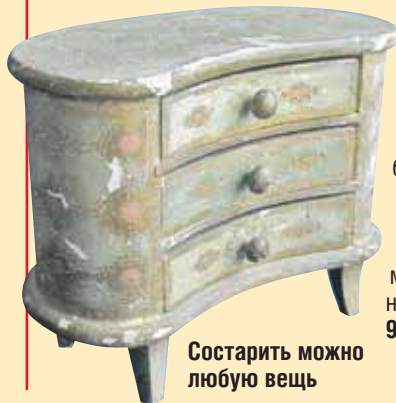
Состарить можно любую вещь