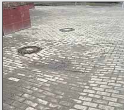
Провал в тротуаре на Первомайской, 42, ликвидировали

В течение марта 340 обращений поступило в раздел «Дороги». С наступлением весны стало увеличиваться количество жалоб на некачественную укладку тротуарной плитки. Так, житель округа пожаловался в конце марта, что «возле Щёлковского автовокзала дорога вся изрыта, в ямках и кочках. Плитка уложена в виде полосы, и по бокам плитки из этой полосы вываливаются. Из-за этого и пешком-то ходить не очень удобно, а если инвалид на коляске или пассажир с сумкой-тележкой, то вообще жуть». В префектуре ВАО сообщили, что на этой территории проводятся работы по рекон-