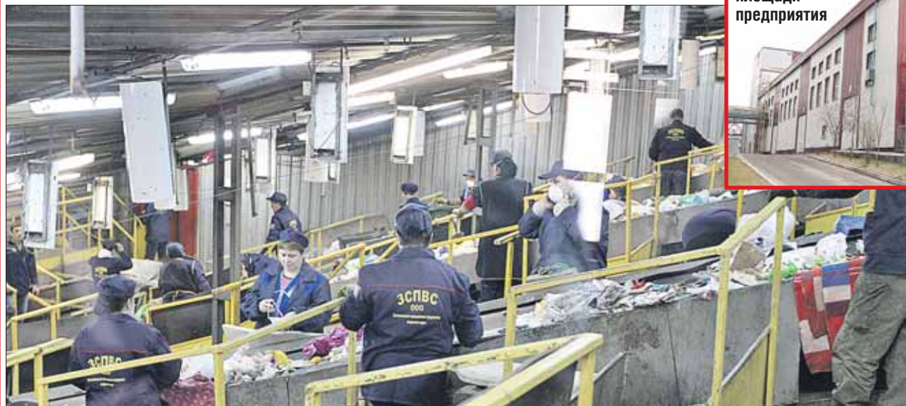
Сначала всё ценное на заводе сортируют

Корреспондент «ВО» увидела, как уничтожают отходы на мусоросжигательном заводе в «Руднёве»