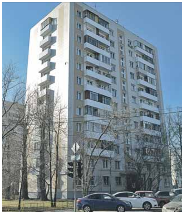
Дом 77 на Измайловском бульваре после капремонта выглядит свежо

Лучше обратиться к муниципальному депутату письменно и несколько