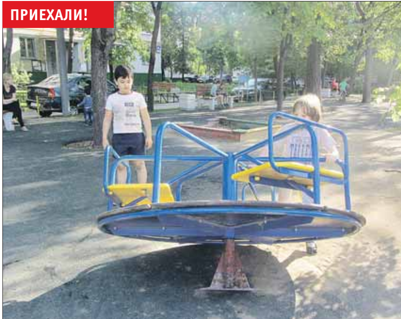
Наш корреспондент побывал на месте головотяпства. Факт, как говорится, налицо