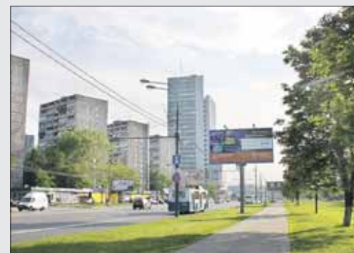
Газон привели в порядок

Обратите внимание: на портале в разделе «Ремонт» можно посмотреть информацию о текущем ремонте дорожного покрытия. Так, до 30 мая прод-