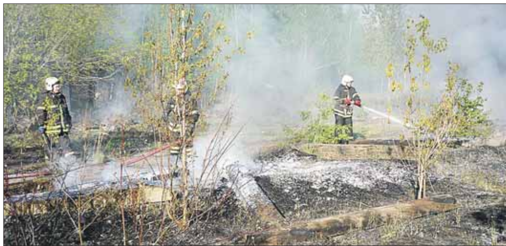
Пожар тушили караулы трёх пожарных частей плюс добровольцы