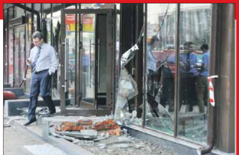
Жертв не было, а разрушения были