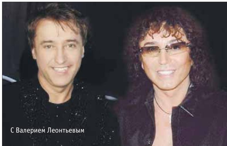
С Валерием Леонтьевым

— Музыкальные способности в вас открыли родители?