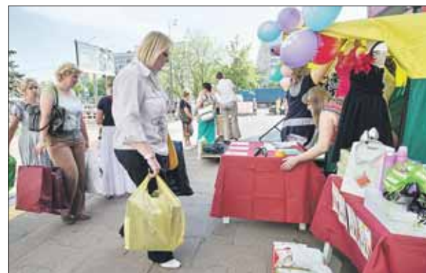
Собранные во время акции вещи передали детям

У общественного центра «Моссовет» на Преображенке состоялась окружной этап городской благотворительной акции «Поможем подготовиться к школьному балу!».