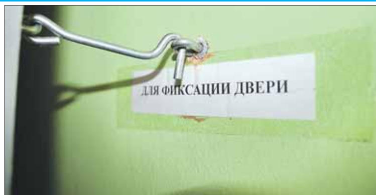
Обычный крючок — самый «умный» доводчик