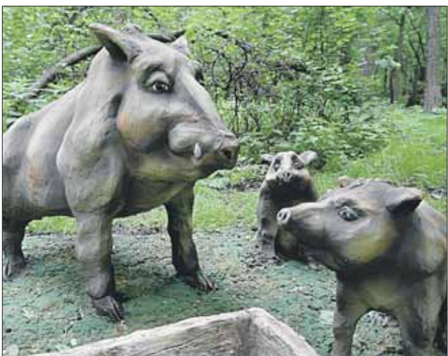
Бетонные кормушки выполнены в виде декоративных скульптур