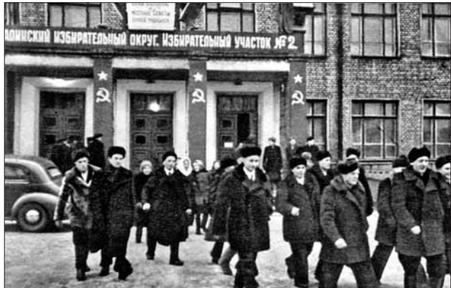
Так выглядела школа №446 в 1950 году

лось: в 1941-1942 годах здесь шло формирование полков Сталинской дивизии народного ополчения. Начиная с 1943 года в течение 10 лет школа поддерживала систему раздельного обучения, занимались здесь только девочки.