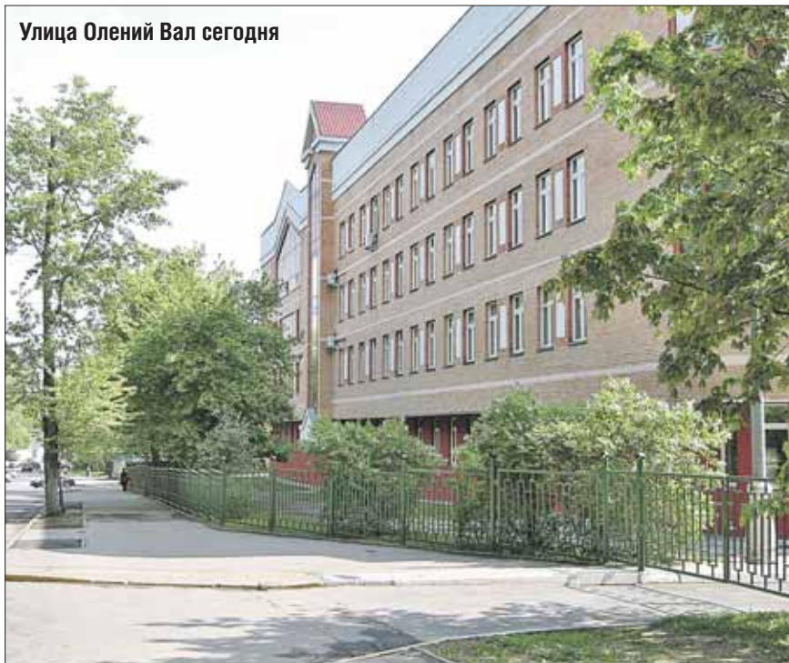
Улица Олений Вал сегодня