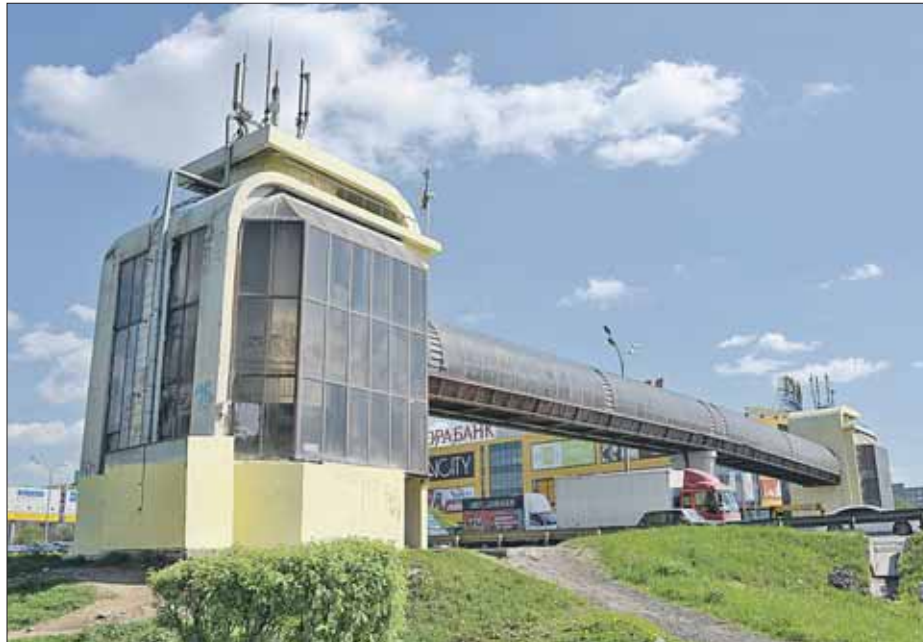
Переход сделали, а подходы к нему оборудовать забыли

В феврале этого года управа получила ответ, что устройство прохода к надземному переходу