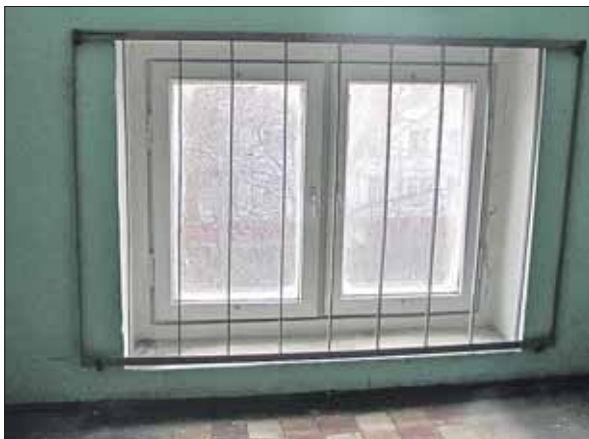
Теперь никакой опасности для детей окна не представляют