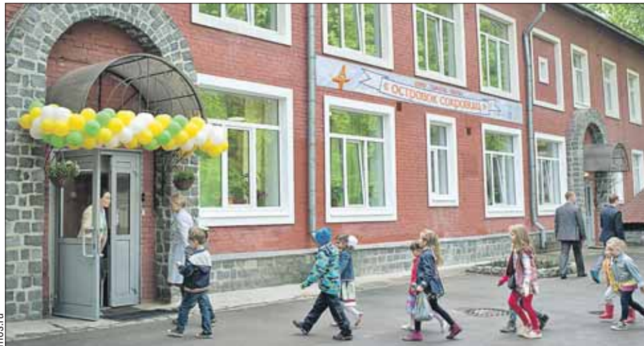
В садике на Бойцовой родители сами выбирают программы обучения

Сейчас детсад на Бойцовой улице посещают 25 детей, но их будет вдвое больше. Персонал — 28 человек. Упор в детсадовской программе сделан на