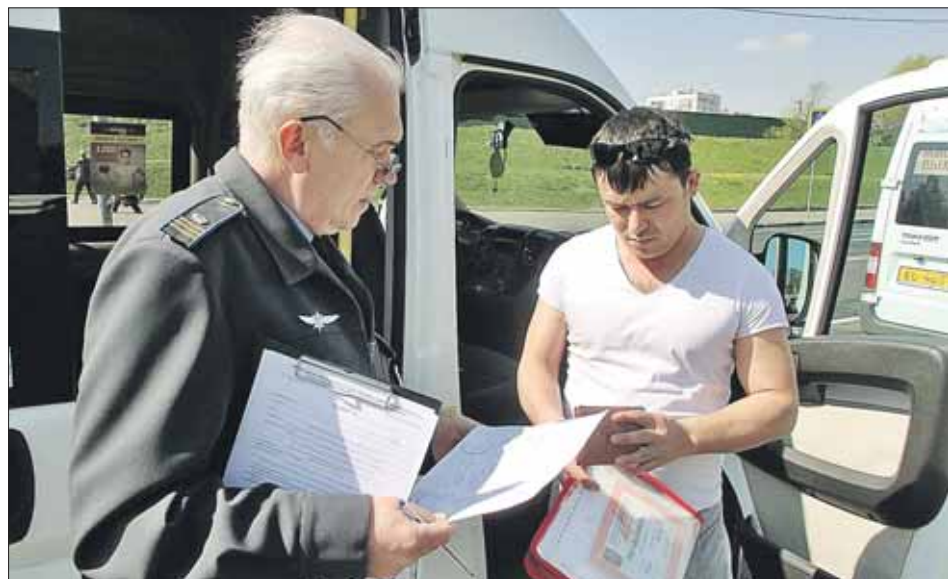
Инспекторы Госавтодорожного надзора проверяли и состояние машины, и документы водителя

Те же правила перевозок требуют, чтобы в машине была информация о перевозчике и контроли-