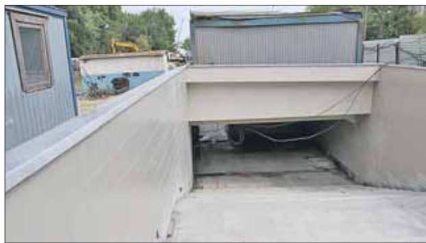
Подземный переход на шоссе Энтузиастов, 98, почти готов. В июле на шоссе Энтузиастов и 1-й Владимирской) станет длиннее, сейчас подрядчики копают котлован для возведения нового выхода. Открыть все переходы планируют в июле,

Подземный переход около кинотеатра «Слава» (пересечение шос-