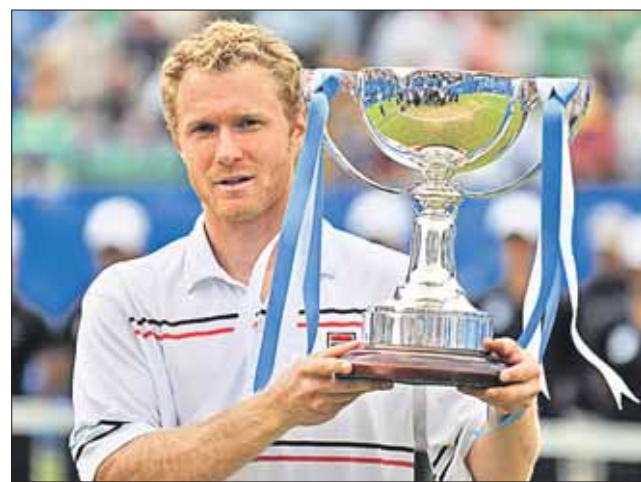
Дмитрий Турсунов выиграл 7 турниров ATP в одиночном разряде

— Мои самые родные и особенные места — это Измайловский и Сокольнический парки. Мы с мамой и папой очень часто приходили гулять в Измайловский парк. Ну а Сокольники вообще, по-моему, были моим местом жительства, когда я в четыре года начал заниматься теннисом.