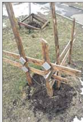
Массивная конструкция не придавливала, а поддерживала саженец на Руднёвке, 12

ПИШИТЕ НА ПОРТАЛ «НАШ ГОРОД»: GOROD.MOS.RU