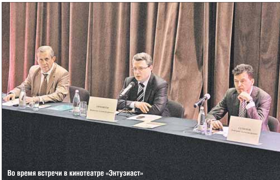
Во время встречи в кинотеатре «Энтузиаст»