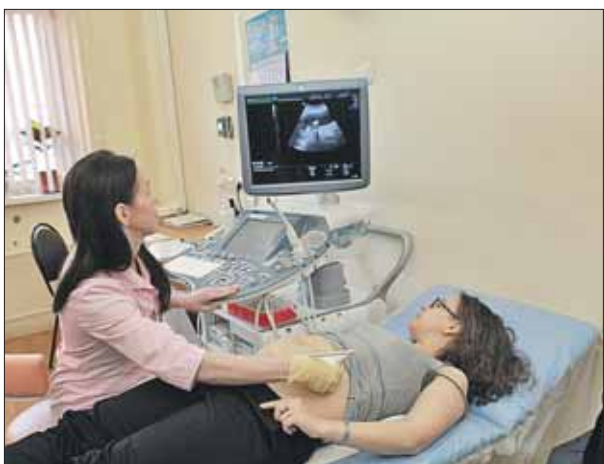
В кабинете установлено самое современное оборудование

По сути, кабинет представляет собой «клинику одного дня». Каждая будущая мама может пройти здесь углублённое обследование состояния плода, затем врачи оценят риск врождённых патологий развития и хромосомных аномалий. В новом подразделении есть кабинет УЗИ и собственный процедурный кабинет, где берут кровь на скрининг. Раньше, чтобы пройти эти про-