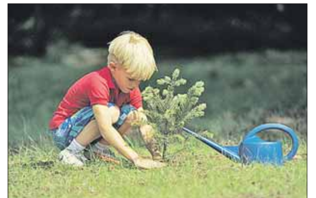
Если хочешь посадить дерево — сажай

На сайте Департамента природопользования и охраны окружающей среды (ДПиООС) есть раздел «Деревья и кустарники, предлагаемые для посадки на внутриквартальных территориях города Москвы» ( www.dpioos.ru/eco/ru/green_planting/n_272 ). Можно выбрать для своего двора разное количество саженцев (в указанном разделе предложе-