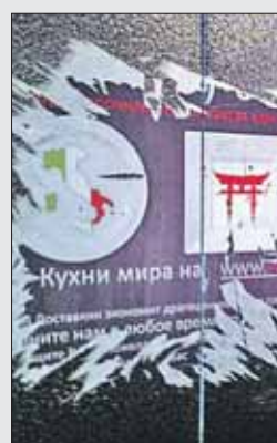
В доме 3 в Песочном переулке бесчинствуют расклейщики рекламы