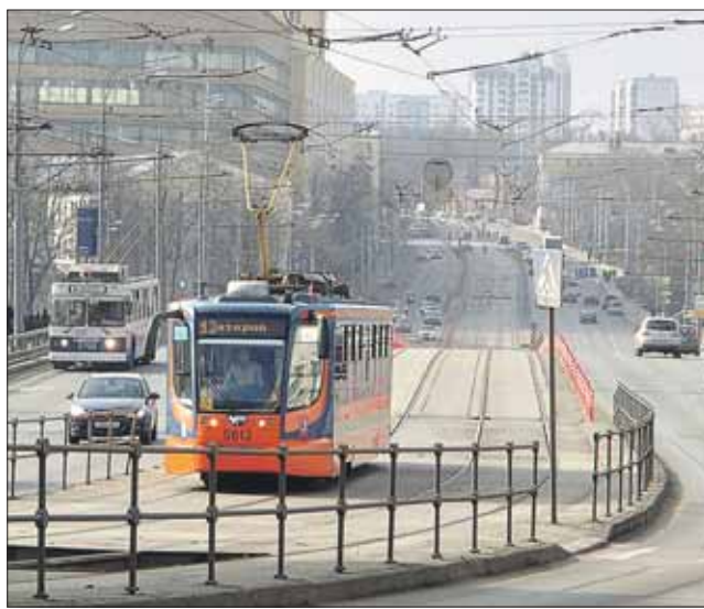
В трамваях теперь ездить и быстрее, и безопаснее

ний ПДД водителями легковушек. Однако, как сообщили в ГУП «Мосгортранс», после установки камер фотовидеофиксации нарушений над трамвайными путями возможность проезда автомобилей специальных служб будет полностью восстановлена.