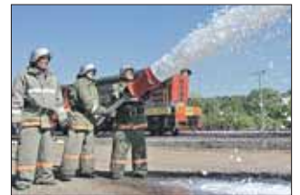
Учебный пожар потушили за полчаса

В 10 часов на пост пожарной охраны поступило сообщение о пожаре в парке «Лосинный Остров», недалеко от станции Белокаменная. В течение восьми минут на место прибыли две пожарные машины МЧС ВАО, пожарный автомобиль лесного хозяйства, две поливочные машины, трактор и даже пожарный поезд. Уже через полчаса на месте не было ни уголька. И хорошо, что это были учения.