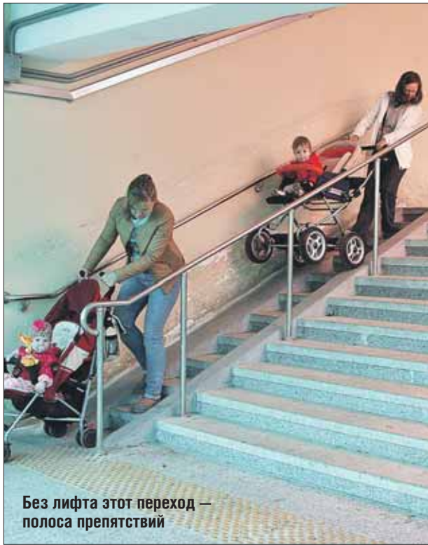
Без лифта этот переход — полоса препятствий

Отправляюсь к метро «Электровзаводская». Здесь оборудован лифтами подземный переход под оживлённой Большой Семёновской улицей. Лифты найти не-