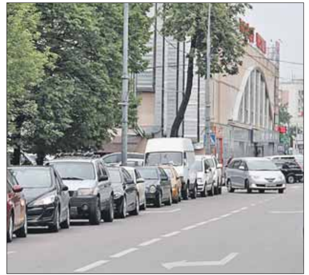
Рядом с «Сокольниками» даже в будни трудно припарковаться

Оказывается, и эта проблема имеет решение. Движение спецтранспорта по обособленному трамвайному полотну сейчас формально не запрещено, но «ямы» пришлось оборудовать в качестве заградительной меры из-за частых наруше-