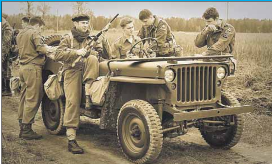
Ни дать ни взять — старое фото британских коммандос

— Мы с единомышленниками не ставим себе цель всё делать своими руками, а-ля предки, чтобы нож, к примеру, только самокованный, одежда — домотканая, как в движении «Живая история». И не останавливаемся на военной составляющей, как представители направления военно-исторических клубов. То, чем мы занимаемся, — именно исто-