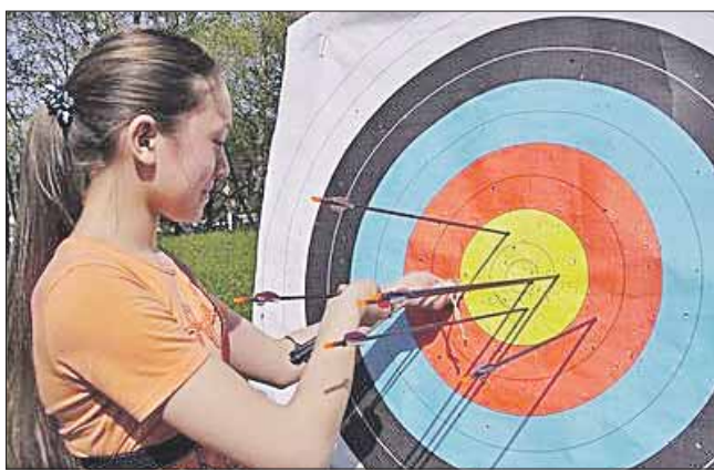
При стрельбе из лука важна интуиция

Адрес: ул. Новокошинская, 6А. Тел. 8-903-185-8706