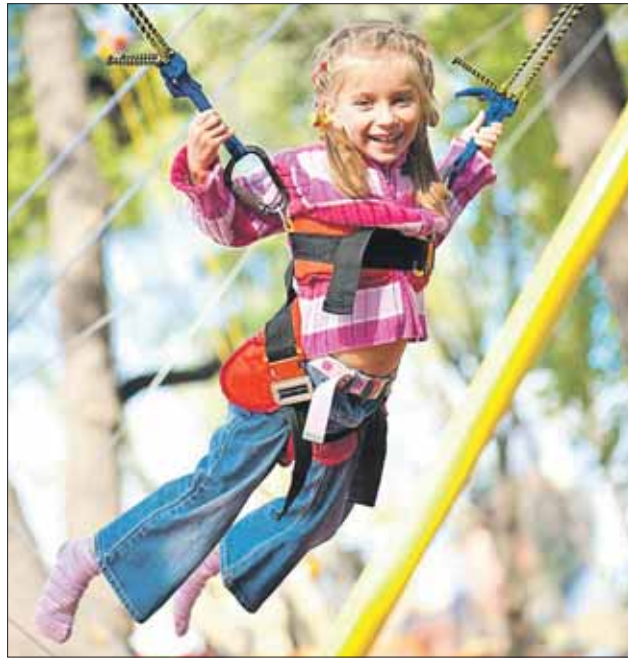
Почти все парковые новинки рассчитаны на детей

В августе-сентябре откроется летний кинотеатр на 380 мест. Он расположится на Митковском проезде, между 2-м и 3-м Лучевыми просеками. Это будет крытое строение, поэтому сеансы не отменят из-за дождя. Помимо прокатных фильмов, здесь можно будет посмотреть мировую классику или трансляции футбольных и хоккейных матчей. В парке может появиться первый в столице... велокинотеатр. Вместо обычных кресел в этом кинотеатре будут установлены велотренажёры. Пока