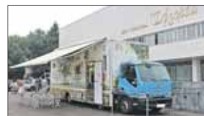
А это «Атоша»

Планируется проводить встречи с писателя-