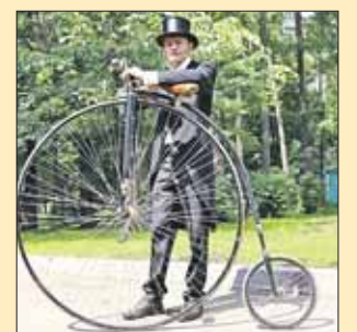
К старому велосипеду — исторический костюм