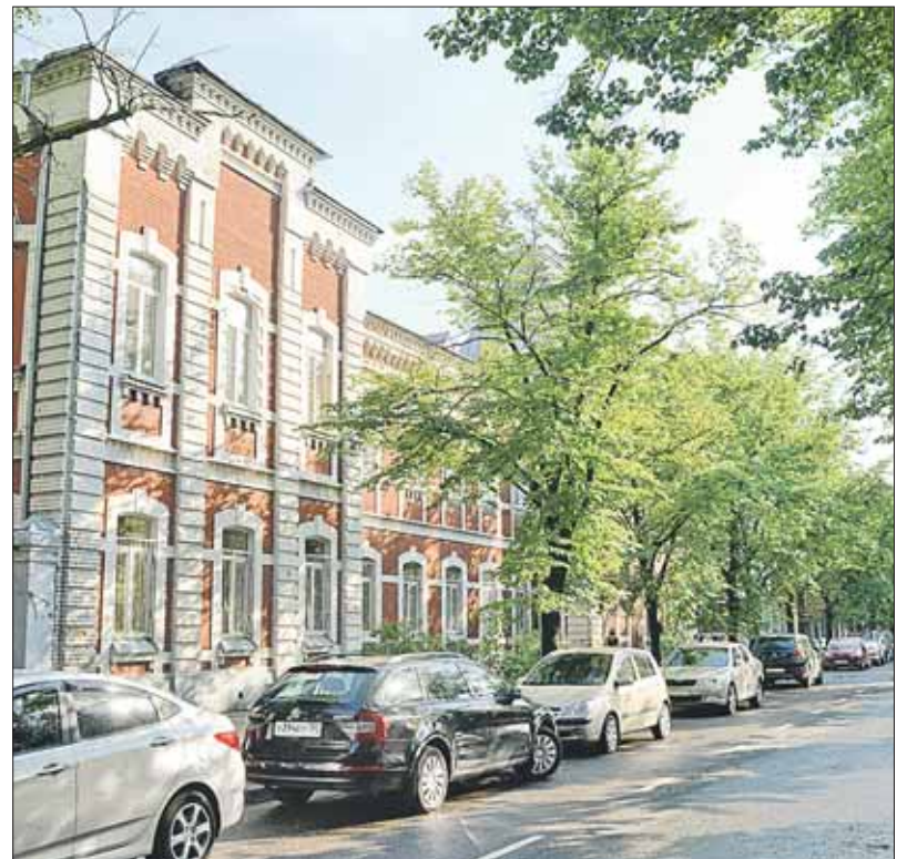
Улица 2-я Боевская сегодня