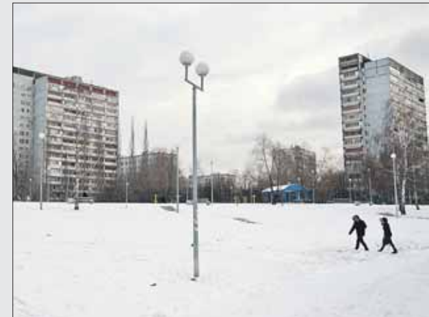
Фонари у Гольяновского пруда не работают несколько месяцев

Напоминаем, что срок для подготовки официальных ответов на обращения жителей на портале «Наш город» — 14 дней.