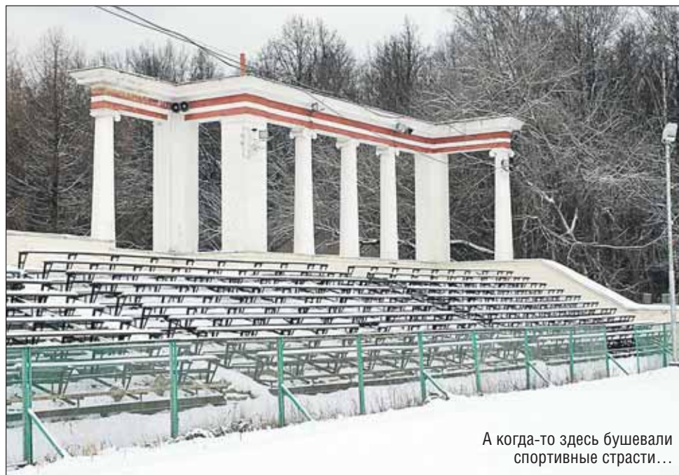
А когда-то здесь бушевали спортивные страсти...

Некогда популярный у местных жителей стадион «Авангард» располагается на ш. Энтузиастов, 33. На его официальном сайте москвичам предлагаются прокат лыж, каток в русском стиле, тёплые раздевалки, кафе, туалеты. Когда я туда приехала, на всей территории спортивного клуба было пусто. Даже отпечатков ног не было на