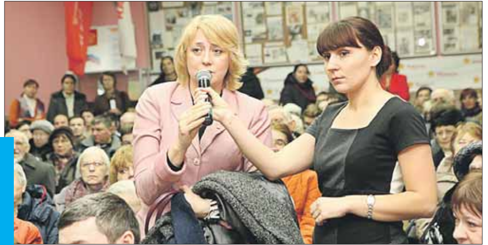
Судьба кинотеатра волнует многих жителей округа