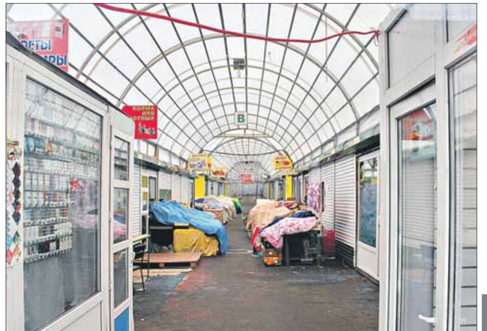
Измайловский рынок. Остатки былой роскоши