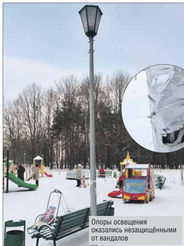
Опоры освещения оказались незащищёнными от вандалов

Можно ли как-то защитить новые фонари, пока их не подключат к элек-