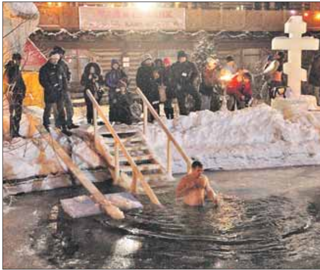
Купель «Вернисаж в Измайлово» (2013)

Крещенские купания пройдут в ночь с 18 на 19 января. На месте купания будут дежурить врачи, полиция, МЧС.