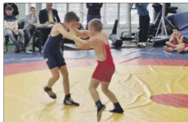
В секцию берут детей от 6 лет

Адрес: Хабаровская ул., 18, корп. 1. Тел. (495) 770-9515