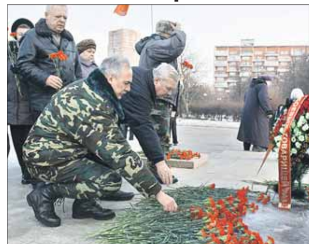
Возложение цветов к монументу «Скорбящие матери»

Торжественный митинг, в котором приняли участие ветераны боевых действий в Афганистане, Чечне и других горячих точках, прошёл на Зелёном проспекте, возле памятника «Скорбящие матери». Участники митинга возложили цветы к его подножию.