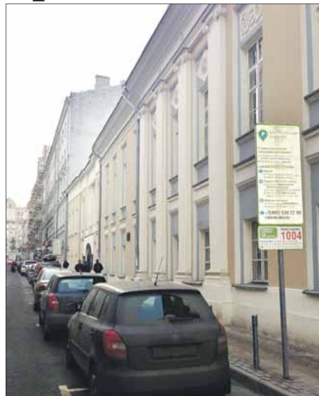
Парковка в Козицком переулке