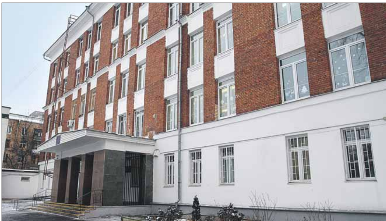
Школа №444 на Нижней Первомайской — самая популярная у родителей будущих первоклассников

Так, в школу №444 с углублённым изучением математики по основному списку уже записалось чуть меньше 100 человек, а вот по дополнительному — более 100. Это явный перебор, если учесть, что запись