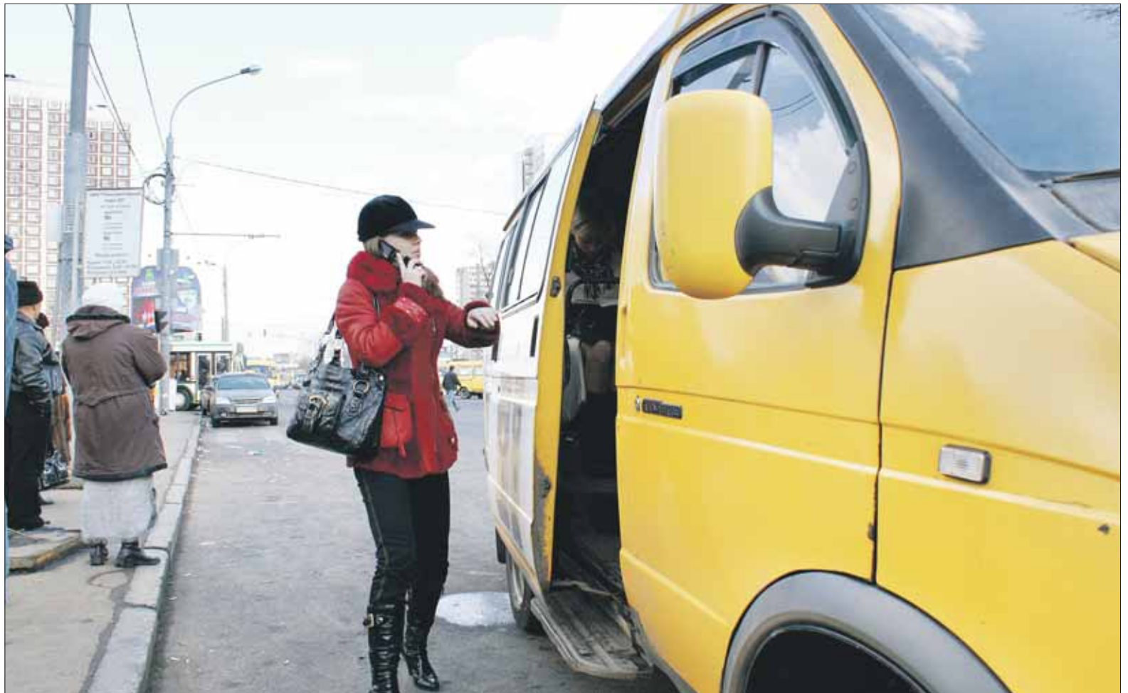
Садясь в маршрутку, надо быть готовым к неожиданностям

В салоне холодно, гуляет сквозняк. Сиденья явно помнят царя Гороха. Обивка во многих местах порвана, торчит поролон, ощутимо пахнет бензином. Водитель резко стартует с места. На первом же перекрёстке резко тормозим, едва не уткнувшись во впереди стоящий «Жигулёнок». Наш шофёр не заметил, как загорелся красный свет.