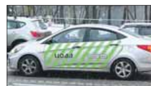
По улицам ВАО курсируют 20 машин с «Паркрайтами»

Количество автомобилей с МКФ (мобильными комплексами фотовидеофиксации нарушений ПДД) растёт. В декабре в Москве их было 110, но недавно начали вводить в строй новую партию «Паркрайтов». Как сообщили в ЦОДД, сейчас по Москве курсирует более 200 машин с «Паркрайтами», а вскоре их количество возрастёт до 310. В ВАО таких машин сейчас 20, но может стать больше. Предложения жителей по новым маршрутам принимаются через электронную приёмную на сайте www.gucodd.ru