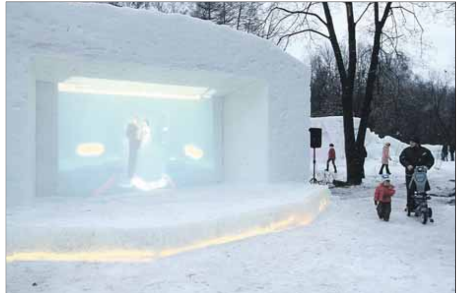
Кино здесь показывают на экране площадью 18 квадратных метров

ЗА РАСПИСАНИЕМ СЛЕДИТЕ НА САЙТЕ SNOWGRAD.RU/