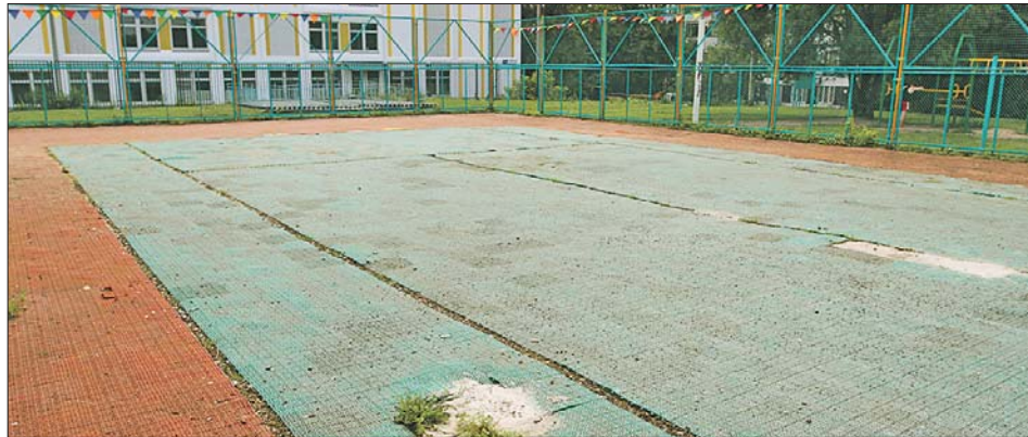
Здесь будет футбольная площадка

Выяснилось, что спортплощадка находится в ве-