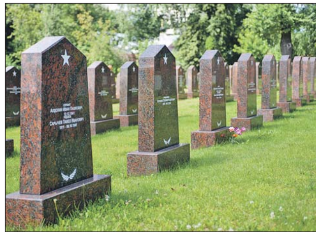
Могилы солдат Красной армии на Преображенском кладбище

В годы Великой Отечественной войны десятки тысяч раненых доставляли в московские госпитали. Многих не удавалось спасти. Власти определили два основных кладбища для воинских захоронений — Донское и Преображенское. На Донском тела кремировали, на Преображенском хоронили в гробах. Есть подобные могилы и на других московских кладбищах, но на Преображен-