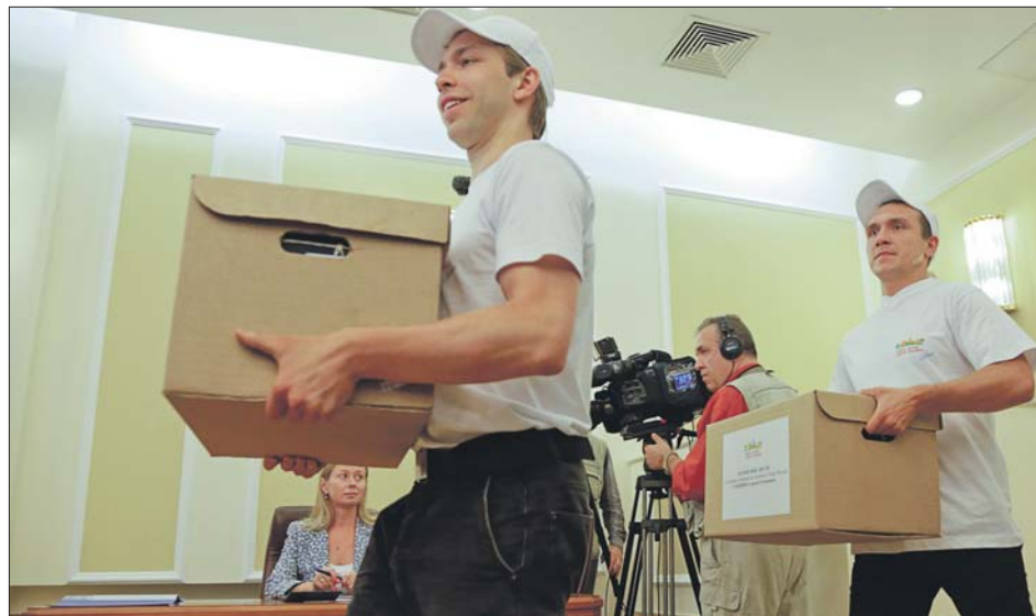
Кандидаты сдают подписи коробками

В среду же были опубликованы сведения о доходах и имуществе четырёх ранее зарегистрированных кандидатов. Михаил Дегтярёв заработал чуть менее 2 млн рублей. Из имущества у него — катер 1975 года выпуска. Николай Левичев имеет земельный участок в Подмосковье, жилой дом, автомобиль «Мерседес» 2011 года выпуска, а также три квартиры в Москве. Доход за 2012 год — около 3 млн рублей. Иван Мельников заработал чуть больше 2 млн. Сергей Собянин в прошлом году зарабо-