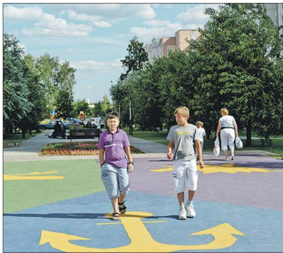
Пешеходная зона в районе Новокосинской улицы