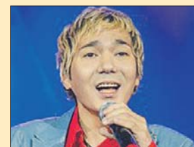
Олег Яковлев по-прежнему популярен

20 июля в 18.00 в Перовском парке (ул. Лазо, 7), а 26 июля в парковой зоне на Измайловском проспекте у дома 113 пройдут концерты «Мой район, мой округ». На нём жители района выступят с номерами в вокальном, инструментальном, хореографическом, театральном и свободном жанрах. Их поддержат профессиональные артисты. Так, в Перово выступит бывший вокалист группы «Ива-