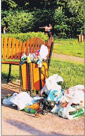
Мусор в Терлецком парке

Зоны отдыха стали убирать лучше, но не везде