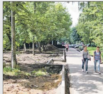
На газонах мусора нет

Всего с 1 июля на портал «Наш город» поступило 6 жалоб на неубранную проезжую часть вокруг метро «Новокосино», на 1-й и 2-й Парковых улицах, на Иркутской улице и мусор на газонах на Измайловском проспекте у домов 69, 71 и на Уральской улице у домов 3 и 3, стр. 3. Порядок на неубранных дорогах и газонах навели в срок от 2 до 4 рабочих дней, приложив подтверждающие фотографии. Причём, отвечая на жалобы на замусоренные газоны по адресам на Измайловском проспекте и Уральской улице, жителям разъяснили, что эти участки находятся в ведении ГКУ ИС, кото-