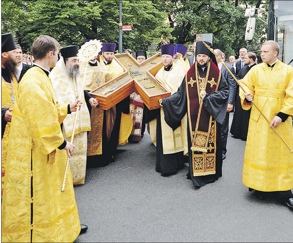
В руках монахов — ковчег с крестом Андрея Первозванного

Поклониться святыне можно в храме Христа Спасителя