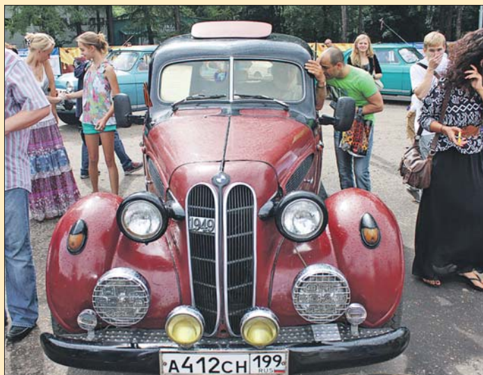
Все экспонаты можно потрогать

19, 20 и 21 июля в парке «Сокольники» — уникальная выставка коллекционных автомобилей под открытым небом «РетроФест». Оценить редкие виды автомашин и мотоциклов можно совершенно бесплатно. Фестиваль редкой техники собрал в прошлом году 50 тысяч зрителей. В центре внимания — 200 лучших образцов мирового автопрома, машины и мотоциклы давно забытых