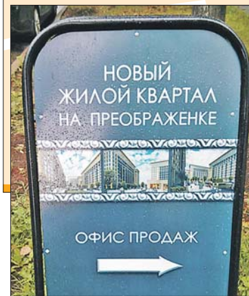
Офис продаж уже работает вовсю