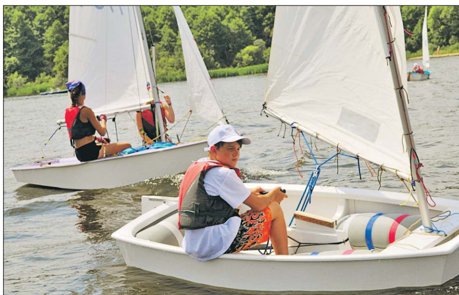
Гонка яхт класса «Оптимист»

Контакты: ул. Б.Косинская, 45. Тел. (495) 700-5005