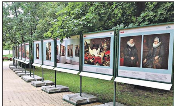
В картинную галерею вход свободный

Открытая выставка «Шедевры Государственного музея изобразительных искусств имени А.С.Пушкина» стартовала в парке «Сокольники». И сегодня каждый желающий сможет полюбоваться репродукциями картин известных мастеров — Клода Лоррена, Клода Моне, Ренуара, Поля Гогена. Кроме этого, в экс-