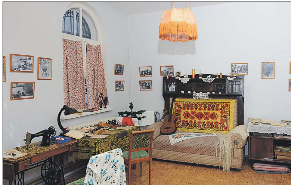
Коммуналка 50-х годов

Первая остановка экскурсии — кухня. Здесь себя хозяевами чувствуют самовар, чудо-кастрюля (советская прародительница пароварки) и керосинка. Далее по коридору жилая комната, где стоит железная кровать 20-х годов. Из общего ряда выбивается диван. «Подлокотники декорированы фигурками львов. Для страны Советов такое оформление было слишком нескромным. «Скорее всего, мебель сделана во времена нэпа», — объясняет экскурсовод. По соседству с этим «наследием буржуев» стоит типовой письменный стол с чернильницей-непро-