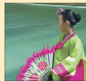
Яркие цвета Азии

танце живота, гости африканской площадки осваивают... танец уружа или технику охотника. Эффекта погружения в чужую культуру помогут достичь национальные мастерские, где можно освоить разные ремесла. На эстрадах «Центральной», «Северной» и «Солнечной» пройдут показательные выступления. Здесь же можно научиться танцевать по-