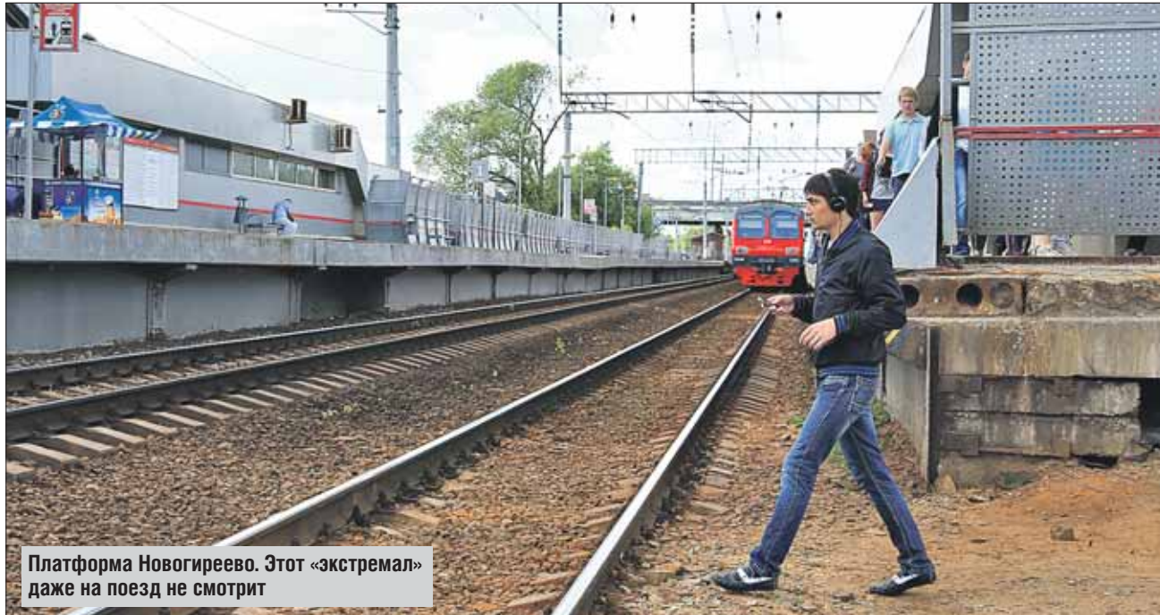
Платформа Новогиреево. Этот «экстремал» даже на поезд не смотрит