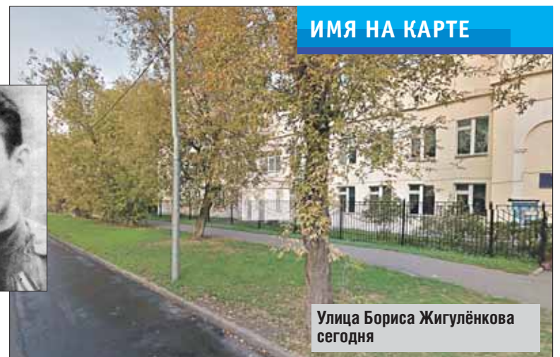
ИМЯ НА КАРТЕ