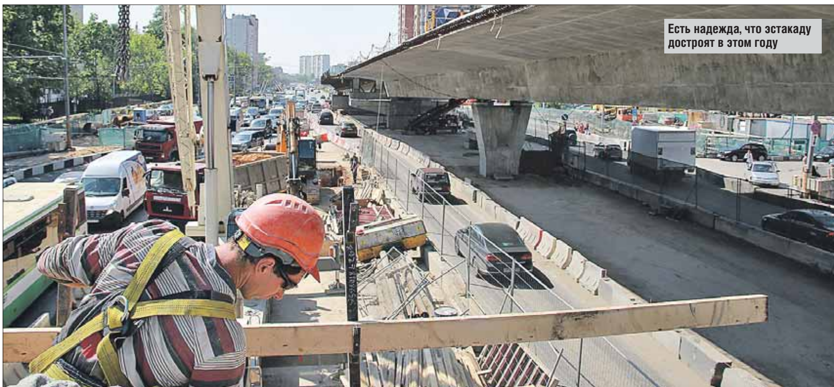
Есть надежда, что эстакаду достроят в этом году

Пожалуй, сегодня самое проблемное место, связанное с реконструкцией Щёлка, — это перекрёсток с Монтажной улицей. Здесь из-за стро-