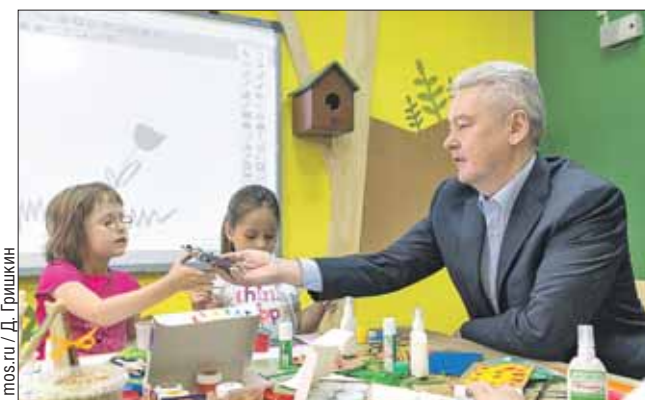
Изучать природу — занятие увлекательное

— Почти половина территории Москвы — это особо охраняемые территории, парки, скверы. Эти тысячи гектаров зелёных территорий требуют особого ухода, создания надлежащей инфраструктуры для отдыха горожан, — поделился с журналистами мэр Москвы Сергей Собянин.