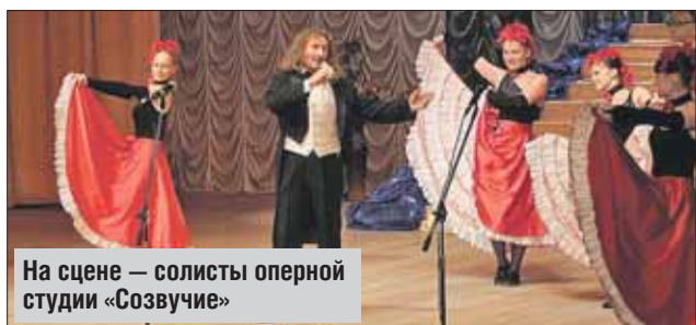
На сцене — солисты оперной студии «Созвучие»

➤ Пенсионерам, детям, компаниям от 5 чел. — скидки. С 10.00 до 20.00. Тел.: 8 (495) 641-7814, 8-926-112-9193. http://zhiclub.ru