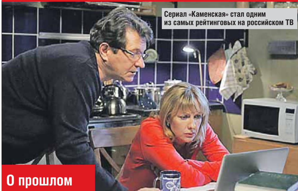
Сериал «Каменская» стал одним из самых рейтинговых на российском ТВ

Почему писательница Александра Маринина поселила свою героиню в Восточном округе?