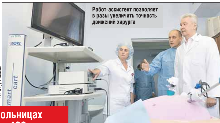
Робот-ассистент позволяет в разы увеличить точность движений хирурга

Наилучшего клинического эффекта с помощью робот-ассистированной эндовидеохирургии можно достичь при проведении кардиологических, урологических, гинекологических операций, а также операций на желудочно-кишечном тракте.