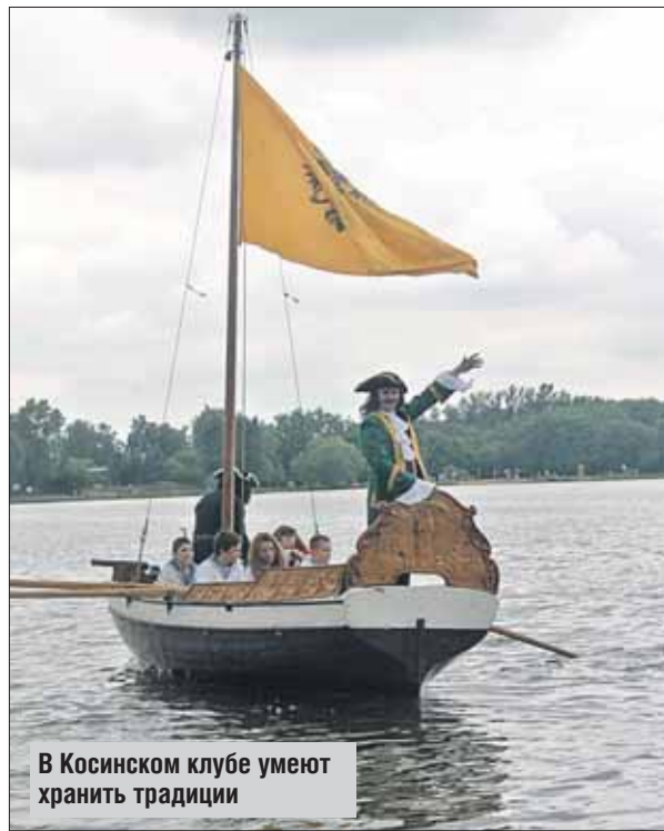
В Косинском клубе умеют хранить традиции

По давней традиции в Косинском детском морском клубе была спущена на воду Белого озера копия старинного ботика Петра I — «дедушки русского флота». Ботик спускали на воду уже в 26-й раз. Как обычно, это сопровождалось театрализованным представлением и выступлением творческих коллективов.