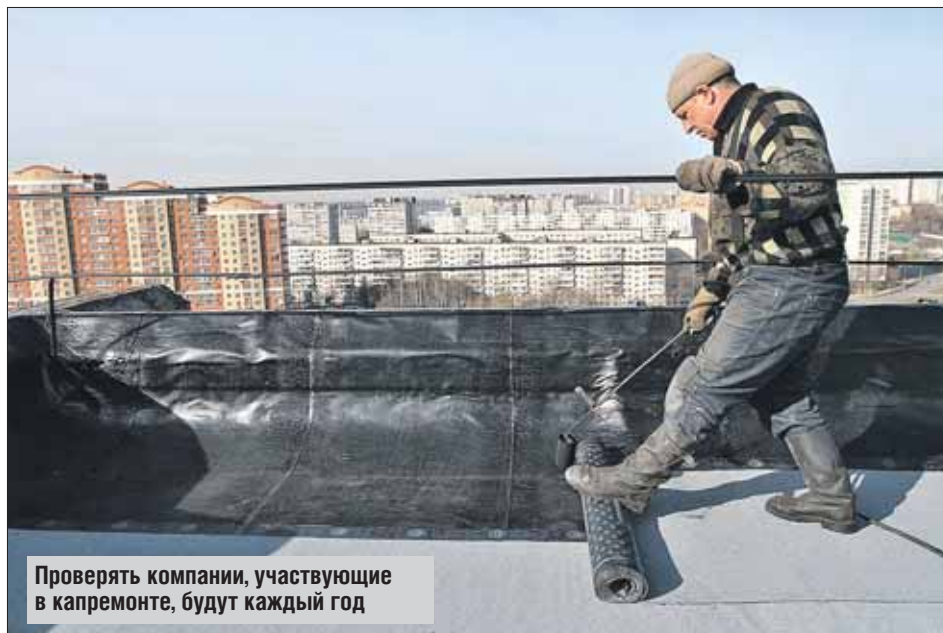
Проверять компании, участвующие в капремонте, будут каждый год

В список компаний, которые прошли предварительный отбор и получили право участвовать в конкурсах на проведение капитального ремонта в Москве, вошла 171 компания. Отбор шёл по нескольким параметрам.