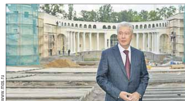
Мэр Москвы Сергей Собянин на ВДНХ

Рабочие уже приступили к восстановлению и ремонту старейших павильонов выставочного центра. Таких объектов на ВДНХ 118, и 47 из них являются объектами культурного наследия. Сер-