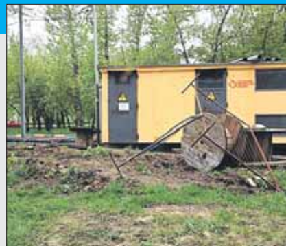
О строительном бардаке во дворе на аллее Жемчужовой в ОАТИ узнали от жителей