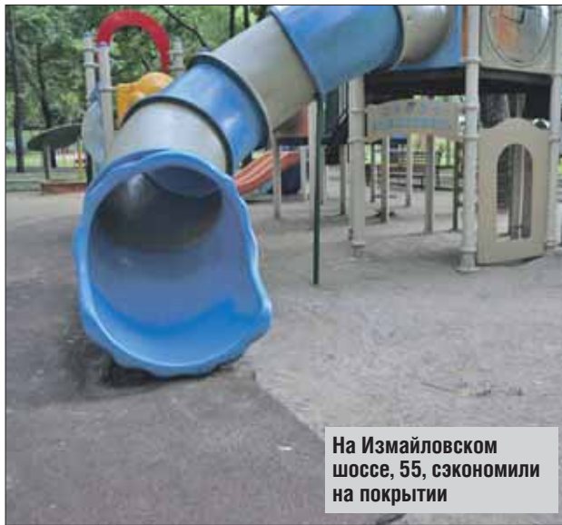
На Измайловском шоссе, 55, сэкономили на покрытии

Перемещаюсь в Гольяново, к дому 15 на Уральской улице, захожу во двор, а попадаю на