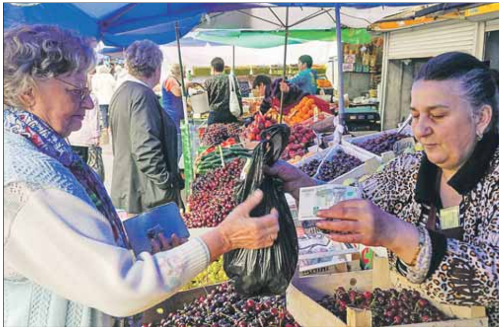
Сейчас на рынке ягодный бум

На рынке на меня сразу накатила ностальгия. Сейчас уже таких весёлых рынков под открытым небом с элементами традиционного базара почти не осталось в Москве.