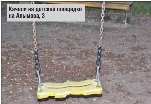
Качели на детской площадке на Алымова, 3

Зато цепи на качелях обмотаны прорезиненной оплёткой: руки малышей в безопасности. Поворачиваюсь — на соседней площадке за домом 37, корп. 2, прекрасное резиновое покрытие, но больше ничего нет — ни разметки, ни ворот.