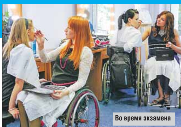
Во время экзамена