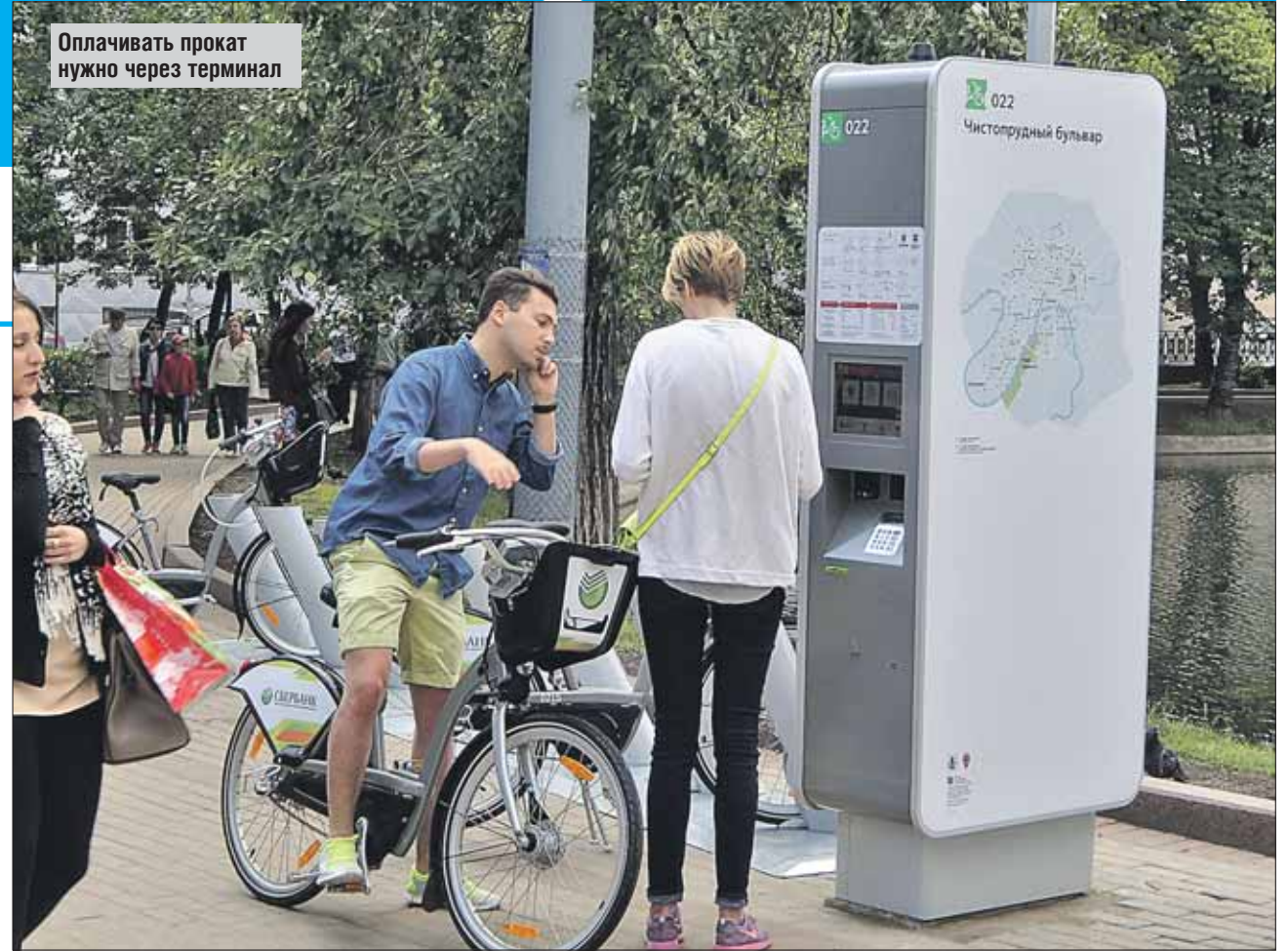
Оплатить прокат нужно через терминал

Поэтому пока тем, кто хочет воспользоваться велосипедом как транспор-