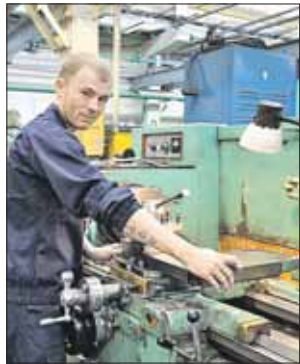
Один из участников конкурса

Заключительный этап городского конкурса «Московские мастера» по профессиям токарь, фрезеровщик, слесарь-инструментальщик прошёл в цехах ФГУП «ММП «Салют» (просп. Будённого, 16).