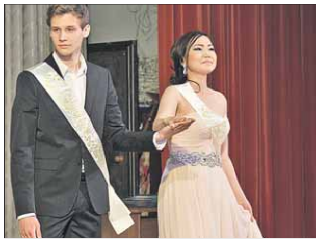
Выпускной в 1254-й школе

порой приходилось заниматься и по ночам.