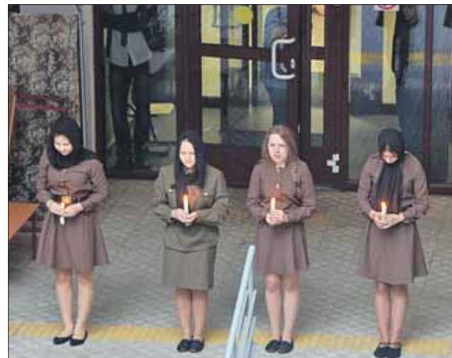
Была создана атмосфера июня 1941-го года

Акция «Вахта Памяти. Вечный огонь-2014» прошла 21 июня у школы №446 на площади Журавлёва. Именно здесь в 1941 году был штаб 2-й дивизии народного ополчения, шло формирование полков. В школу приходили добровольцы — работники расположенных