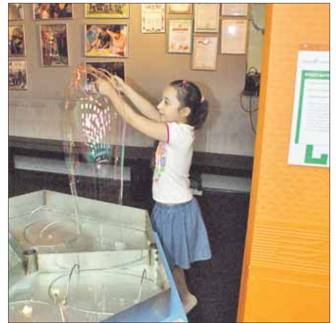
В этот музей рекомендуется ходить тем, кто с физикой не очень дружит

Ну и какой же детский музей без экспоната, у которого можно загадать самое заветное желание? На постаменте стоит древнекитайский таз желаний. Вы загадываете желание, опускаете руки в воду и проводите по ручкам таза. Если знать секрет, то вода в обычном медном тазу вдруг начнёт фонтани-