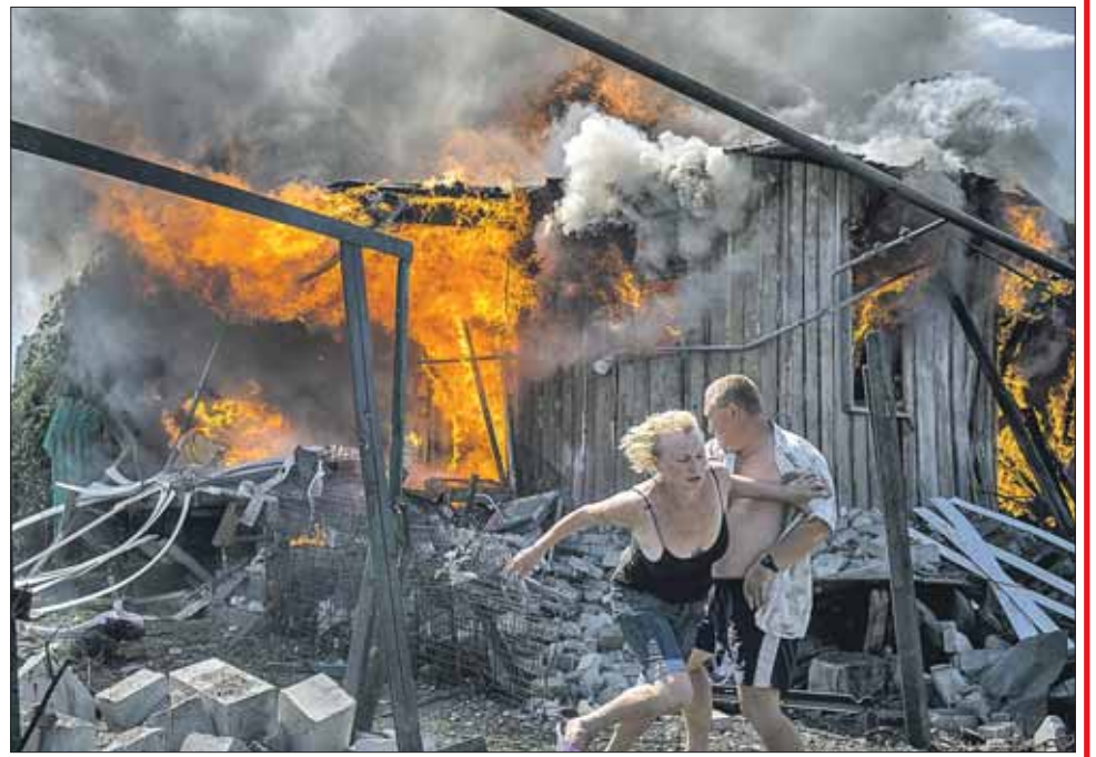
На войне можно потерять всё в одно мгновение