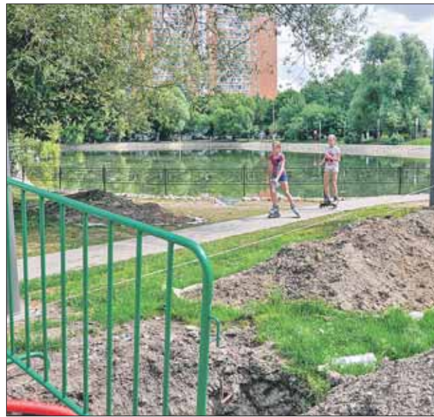
Траншеи временные: Перовский парк наращивает энергоёмкости

— Сейчас идут работы по устройству декоративного