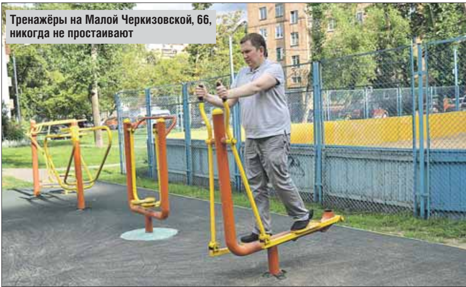
Тренажеры на Малой Черкизовской, 66, никогда не простаивают

Самая настоящая «тропа здоровья» проходит вдоль Измайловского лесопарка от 9-й Парковой, от сквера влюбленных. Тренажеров там очень много, и самых разных. В начале «тропы» — новенький, с иголки, комплекс на площадке с резиновым покрытием. «Качаются» несколько человек. По их словам, очень довольны, сломанных тренажеров ни разу не видели. Далее, примерно в трёх-четырёх десятках шагов друг от друга, располагаются разные тренажеры. Все — исправные. Только у многих выломаны резиновые амортизаторы, и работа устройств сопровождается металлическим лязгом.