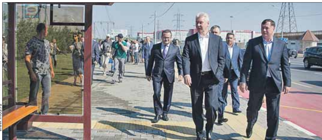
Сергей Собянин открыл новую эстакаду