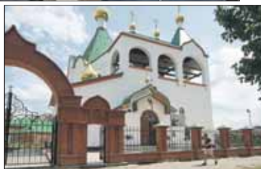
С начала программы «200 храмов» в Москве образовалось 100 новых приходов

— Он будет вмещать примерно 200 прихожан, рядом расположит-