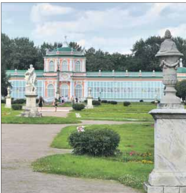
Большую каменную оранжерею реставрировали почти два года

— Укрепили фундамент и стены, реставрировали потолочную роспись, от оригинала которой оставался лишь небольшой кусочек. По нему и восстановили весь рисунок. Специальная работа шла и над наружными скульптурами. А вот окна пришлось поменять, поскольку старые