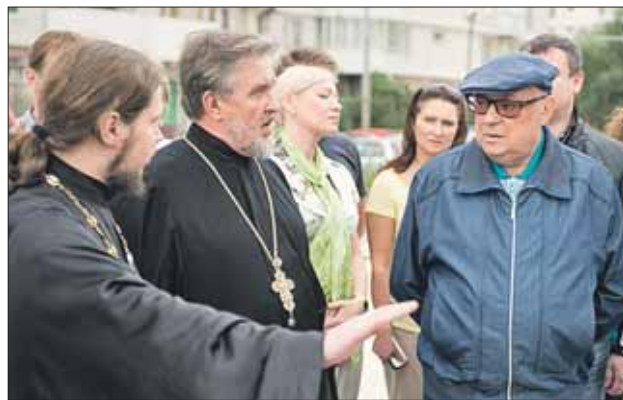
В храме на Суздальской благоустройство почти завершили

Он посетил ещё один строящийся в Новокосине храм — Новомучеников и исповедников Российских на Салты-