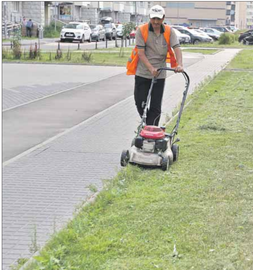
Прежде чем косить, нужно измерить высоту травы