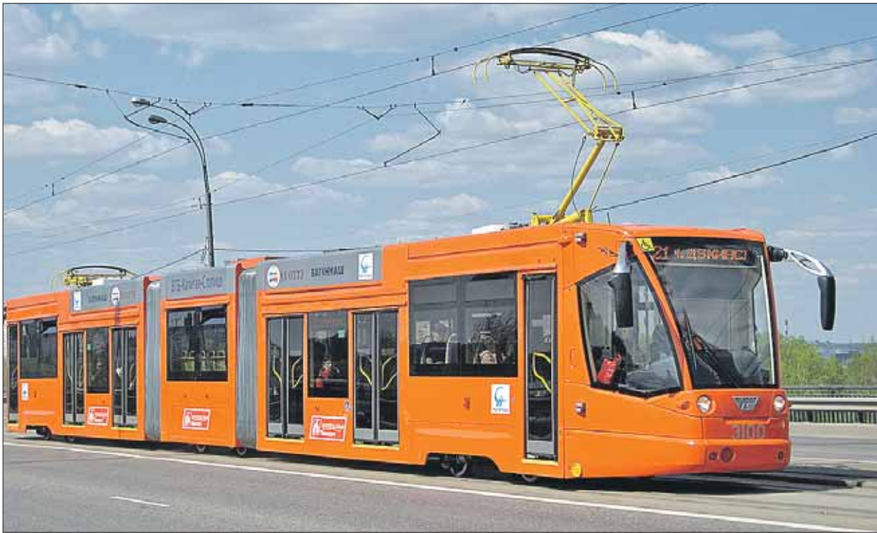
Минприроды решило, что Лосиный Остров — не место для трамвайной линии

Жители Гольянова сегодня, добираясь до подстанции, испытывают серьёзные трудности. Проживающий, например, на Курганской улице, может потратить около 40 минут, ехать на маршрутке до метро «Щёлковская», из-за пробок на одноимённом шоссе. Заторы ограничи-