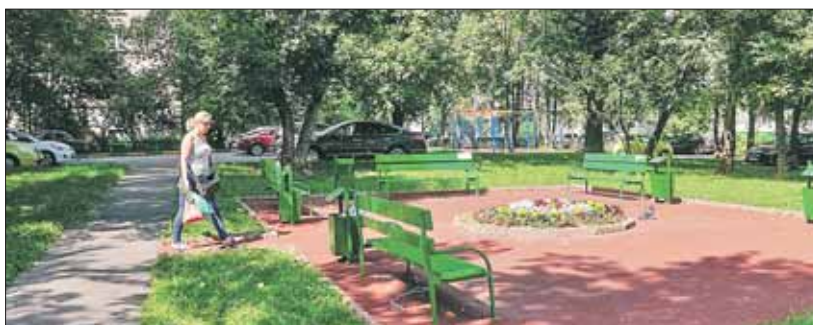
Благоустроенный двор на Большой Черкизовской, 22, корпуса 4, 5

Промежуточные итоги работы по благоустройству за июнь были подведены на заседании штаба по благоустройству, которое прошло в префектуре ВАО.