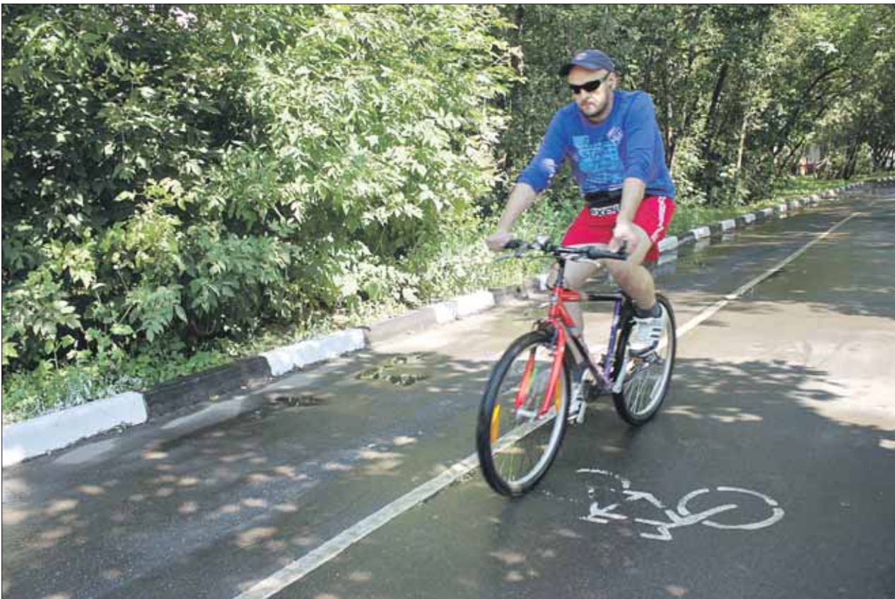
По утрам велодорожки свободны

Мамаша осыпала меня ругательствами. Тут и другая проблема всплыла. Дорожка очень узкая. Пришлось объезжать по траве. Еду дальше, впереди такой резкий поворот, что я едва не вылетаю напрямиком на детскую площадку. Отдельные детишки ещё и под колесо норовят попасть. Вдруг навстречу мне другой велосипедист. Кое-как разъехались, но едва не стукнулись рулями. К тому же пришлось притормаживать. Всего 7 минут езды, трасса пройдена. Её официально заявленная длина 3,5 километра, но мой счётчик показывает 2,6. Хорошо, но мало. Вот бы трассу продолжили дальше — к Абрамцевской просеке в парк «Лосиный Остров».