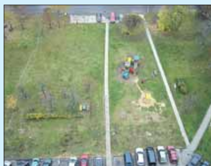
В районе Восточный на улице 9 Мая благоустроили двор

Чтобы ваше пожелание было учтено коммунальщиками, необходимо написать заявление с изложением просьбы и отправить его либо в управу на имя главы, либо в ГКУ ИС.