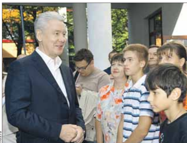
Врио мэра приехал проверить качество строительства