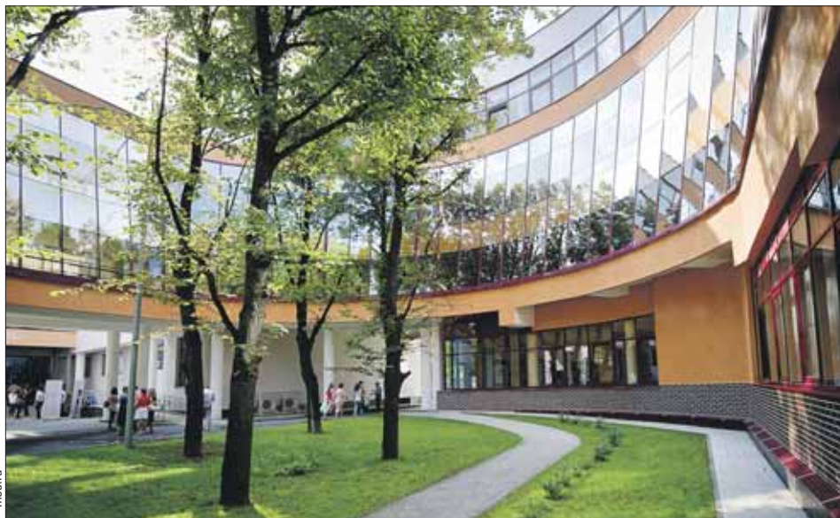
Школа №446 построена по единственному в России проекту

При строительстве была применена фасадная система «Тёплый