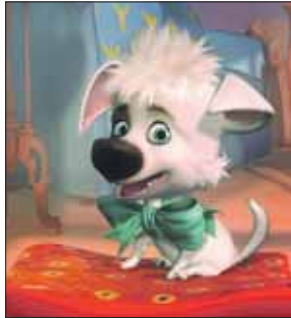
фильм в формате 3D. Вход свободный. Время сеансов можно уточнить по тел. (495) 302-0362.

Со 2 по 6 сентября в кинотеатре «Берёзка» (ул. Мартеновская, 25) пройдёт фестиваль «Московская премьера». Будут показаны новинки отечественного кинематографа. Фильм-сказка «Книга мастеров» повествует о волшебных приключениях крепостного сироты Ивана. Мультфильм «Белка и Стрелка» основан на реальных событиях — полёте двух беспородных собак в космос. Это первый российский