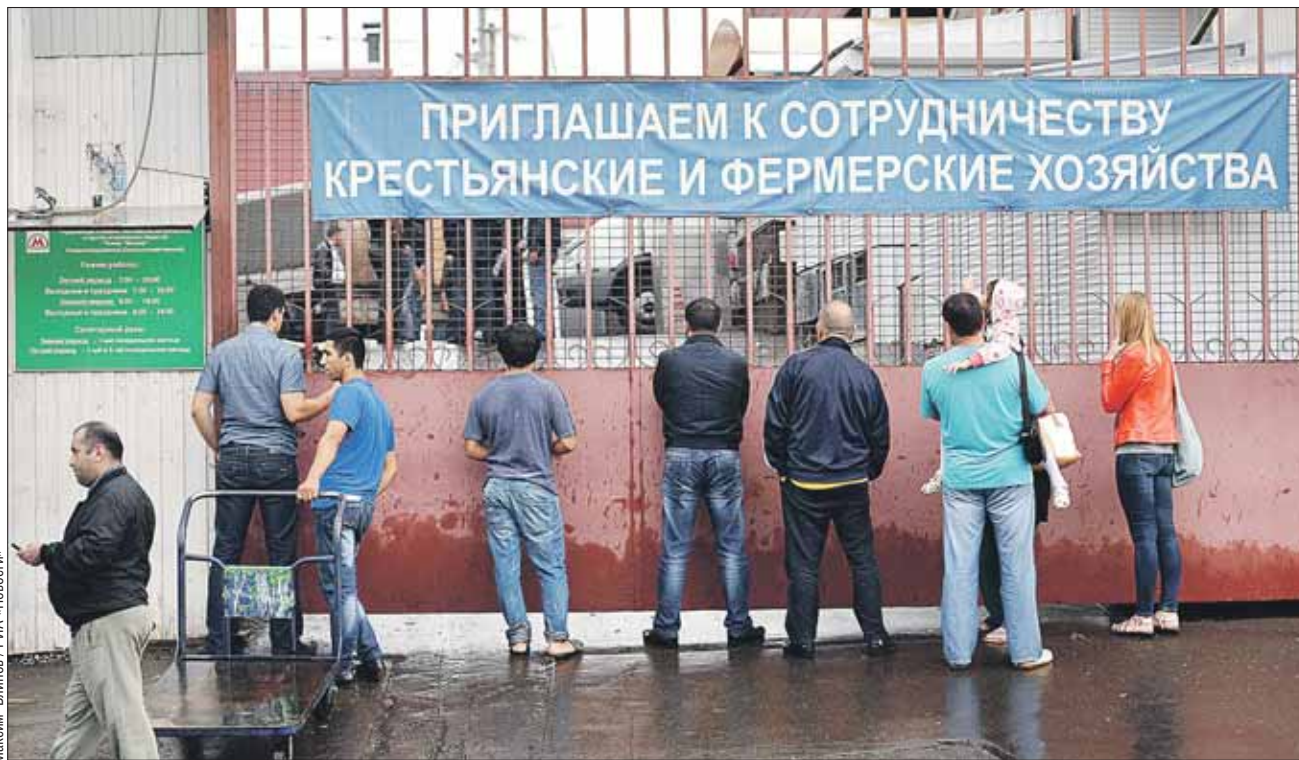
Рынок закрыли, проблемы остались

Читатели «ВО» обсуждают закрытие Выхинского рынка