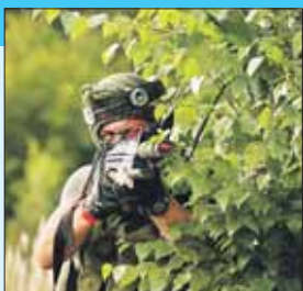
Стрелять лазером — не больно

Легкоатлетический кросс пройдёт 29 августа в 11.00 в НП «Лосиный Остров»: Открытое ш., 29, корп. 8. Желающие принять участие могут позвонить по тел. (909) 693-2491.