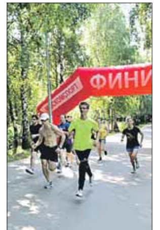
В Терлецком беговом клубе пока 20 человек