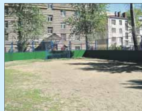
В районе Соколиная Гора на Мироновской улице капитально отремонтировали спортплощадку