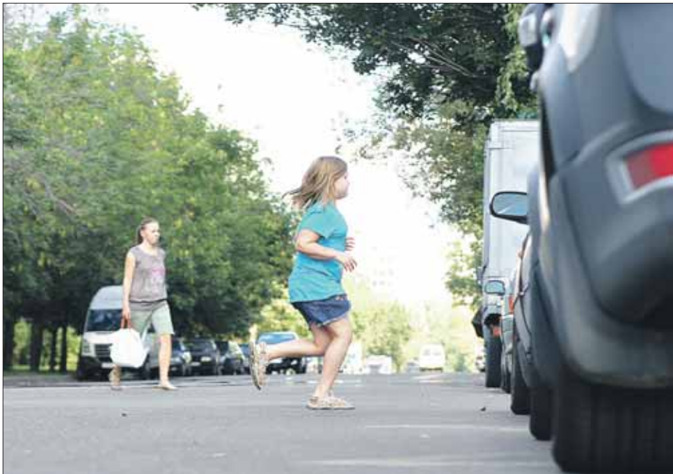
Детей нужно научить быть осторожными

Но из 10 детей, которые гуляли с родителями, по-