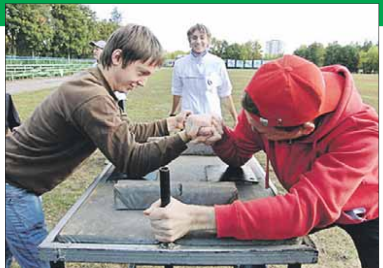
В секцию армрестлинга принимают с 13 лет

можно по адресу: ул. Лазо, 12, или по телефону (495) 306-4720