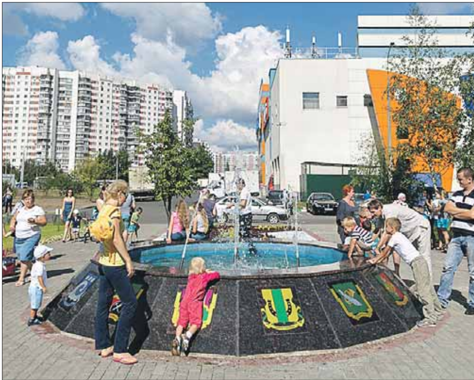
На борту фонтана — гербы 16 районов ВАО