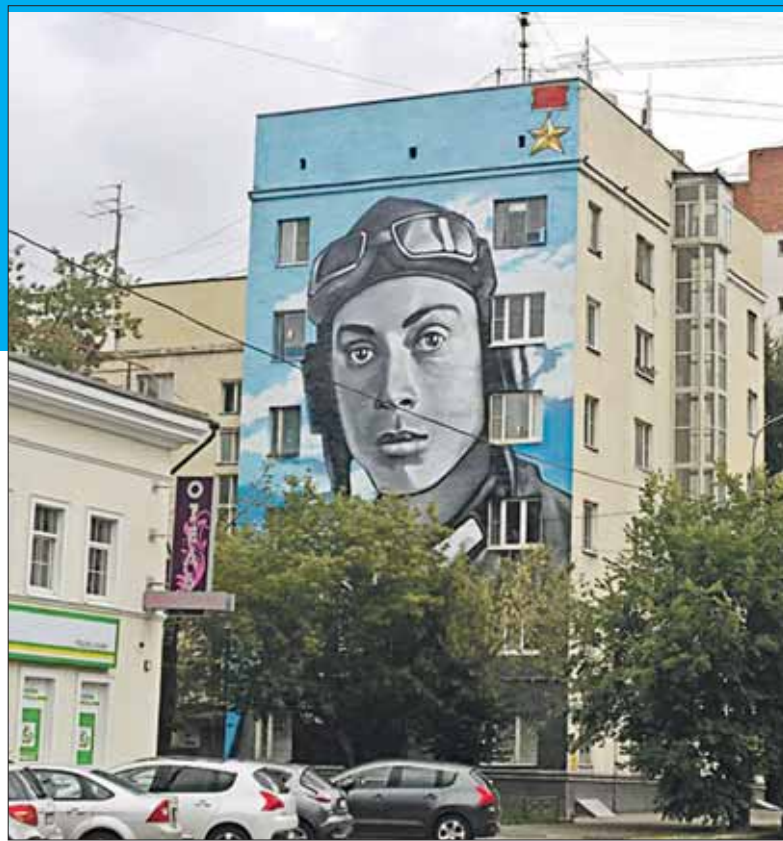
Автор портрета — Максим Торопов

П ортрет Героя Советского Союза Николая Гастелло появился на стене дома 2 на 4-й Сокольнической улице, неподалёку от улицы, названной именем этого лётчика. Граффити были сделаны в рамках проекта «Украсим город».