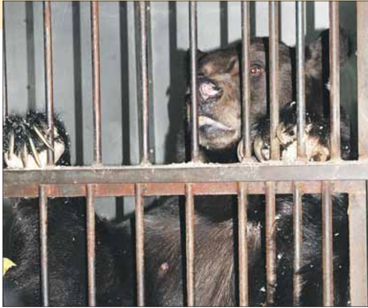
А это Малыш: хищный, но добрый