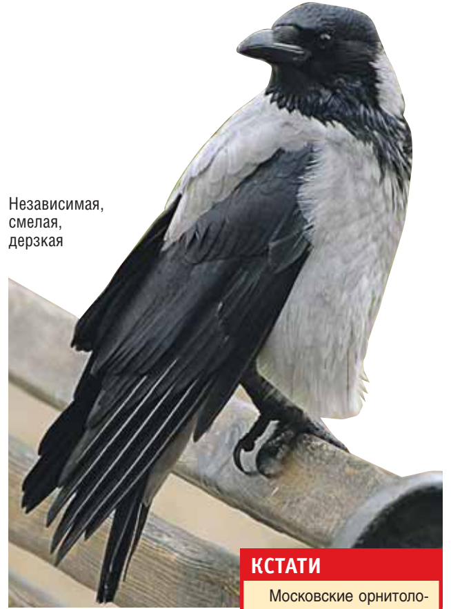
Независимая, смелая, дерзкая

— А ещё вороны очень злопамятны, — рассказывает Титков, — если человек, недовольный тем, что напротив его окна появилось гнездо, будет кидать в него камни или выстрелит из рогатки, пневматическо-