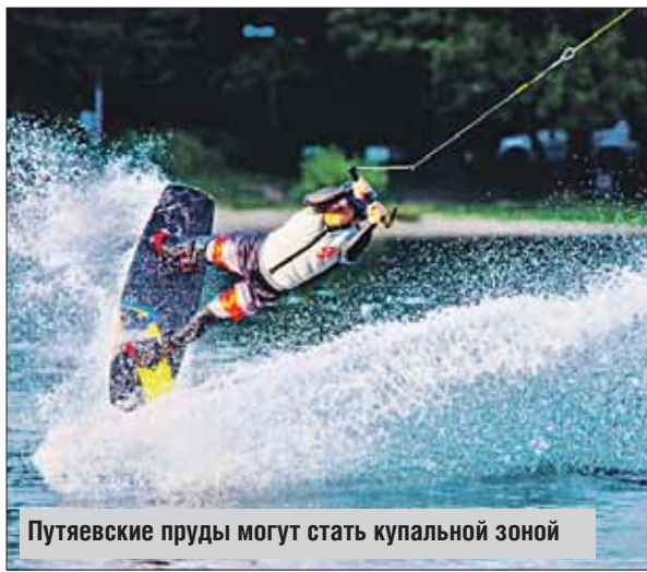
Путяевские пруды могут стать купальной зоной