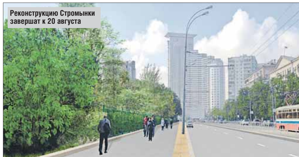
Реконструкцию Стромьнки завершат к 20 августа

В рамках проекта «Моя улица» на Стромьнке обновят 46 800 кв. метров асфальтового покрытия. Работы идут полным ходом и завершатся по плану городских властей уже к 20 августа. Кроме того, на улице отремонтируют фасады домов, с двух сторон, прилегающих к проезжей части, высадят молодые деревья и кустарники и разобьют клумбы.