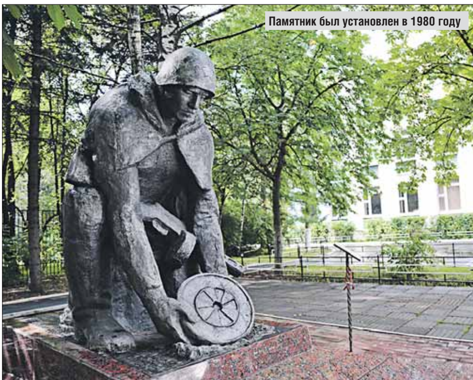
Памятник был установлен в 1980 году

— В нашей гимназии есть музей боевой славы 4-й инженерно-сапёрной Уманской Краснознамённой ордена Богда-