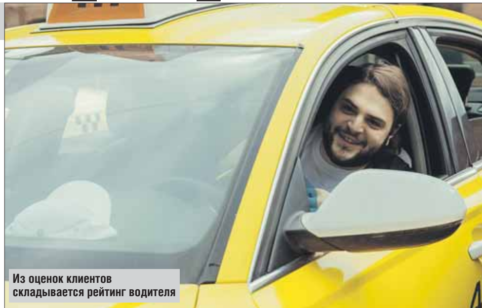
Из оценок клиентов складывается рейтинг водителя

«Что представлял собой рынок такси в Москве несколько лет назад? Множество компаний, каждая занята саморекламой, неплохая конкуренция. Что представляет сейчас? Монополист — одна штука, множество компаний, лишившихся бизнес-са-