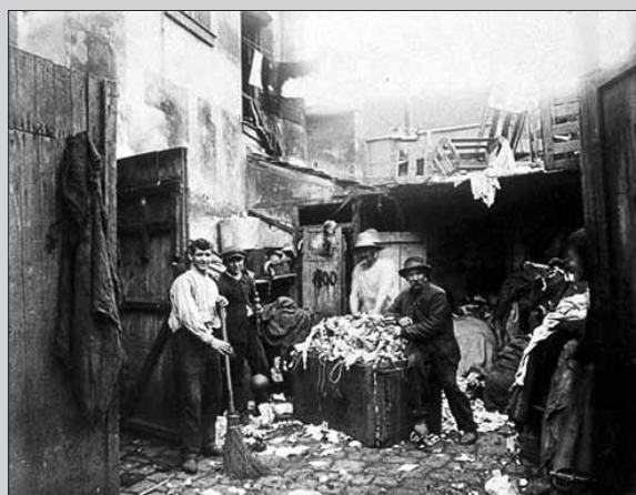
Французских домовладельцев обязали завести короба для мусора в конце XIX века

Благодаря ему мусорные ящики и корзинки французы стали в обиходе называть пубелями.