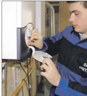
Установка счётчика окупится за несколько лет

С учётом того что с 1 июля газ подорожал до 50 рублей 13 копеек на человека в месяц (до 1 июля