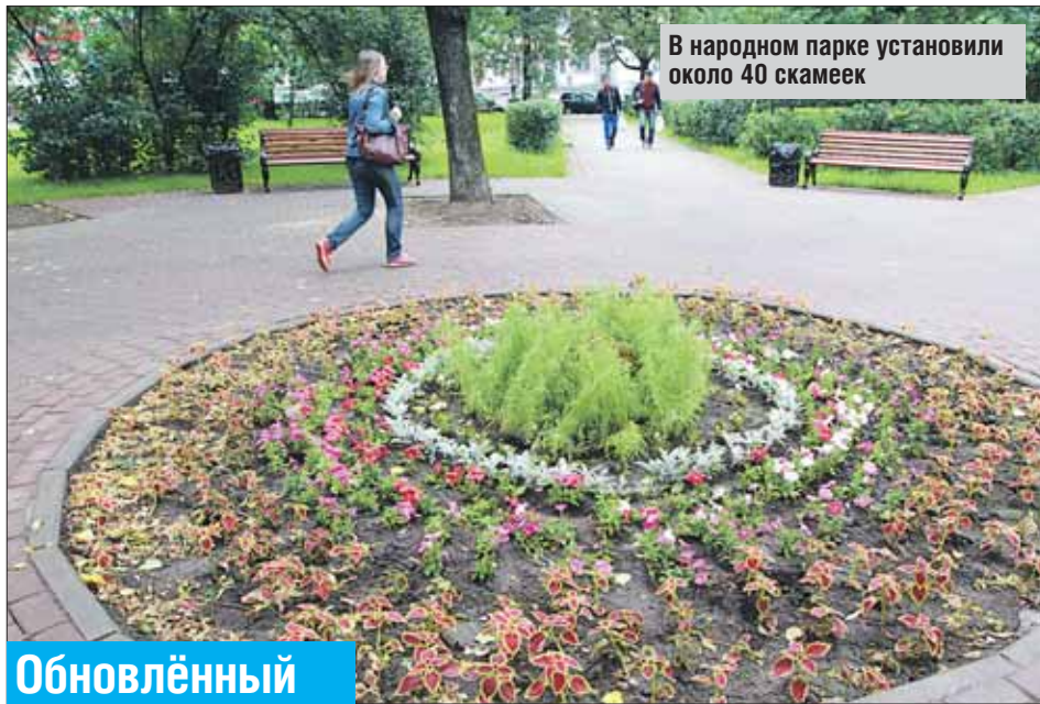
В народном парке установили около 40 скамеек

На днях работы по благоустройству завершились. По словам первого заместителя главы управ-