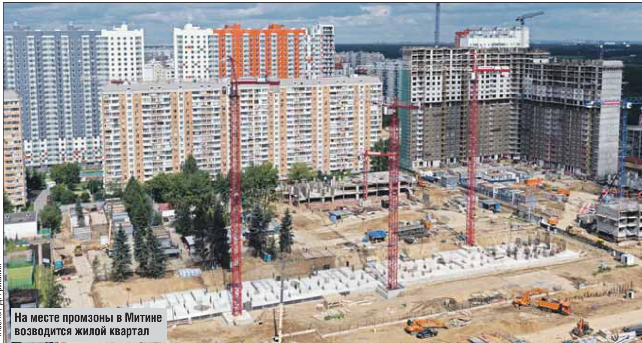
На месте промзоны в Митине возводится жилой квартал

Вместо заброшенной промышленной территории здесь вырос новый жилой квартал, возведённый с применением новейших градостроительных концепций. Возводимый рядом бизнес-центр создаст достаточное количество рабочих мест. В микрорайоне построены необходимая социальная инфраструктура и новая станция метро — «Пятницкое шоссе».