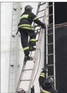
Подъём по лестнице для пожарных — привычная работа