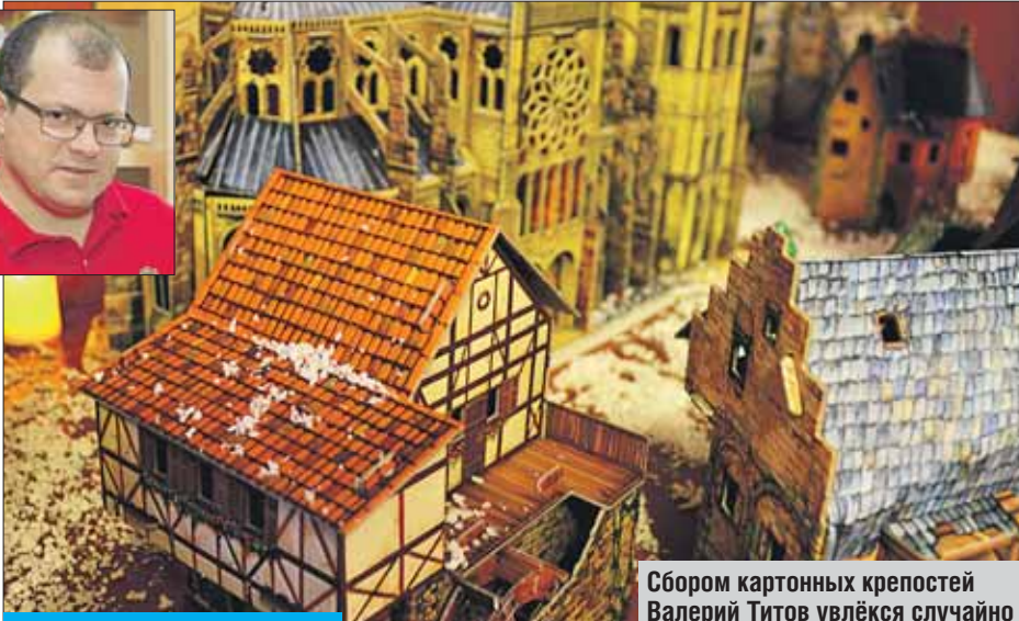
Сбором картонных крепостей Валерий Титов увлёкся случайно

На миниатюрах можно различить даже черепицу на крышах