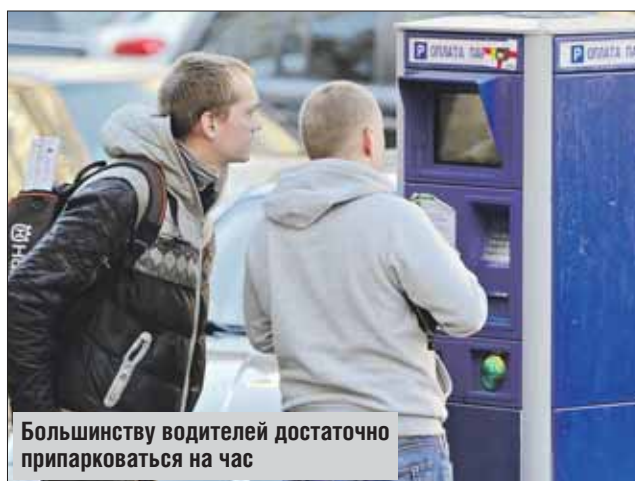
Большинству водителей достаточно припарковаться на час

Как считают эксперты, разгрузить парковки и улицы поможет введение новых тарифов. Стоимость первого часа парковки, по их мнению,