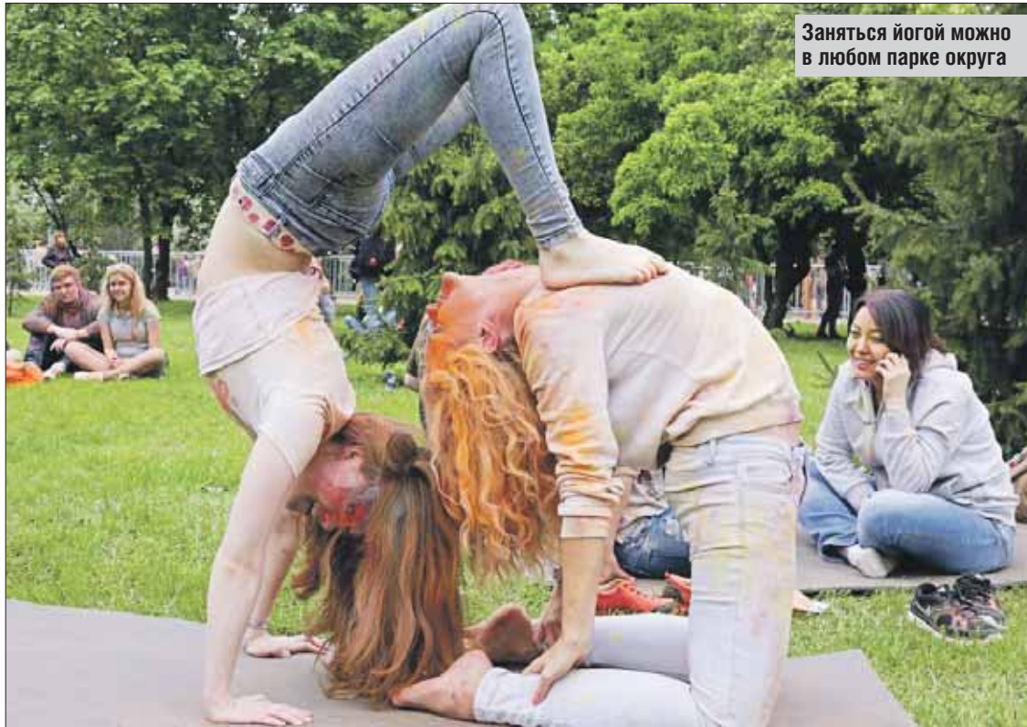
Заняться йогой можно в любом парке округа

За полтора часа занятий мне удалось попробовать себя во всех трёх ипостасях. Уходила с ощущениями, что я действительно летала. Да и уверенность в своих силах возросла. Подробнее о бесплатных занятиях йогой можно узнать на сайте parks.yogajournal.ru