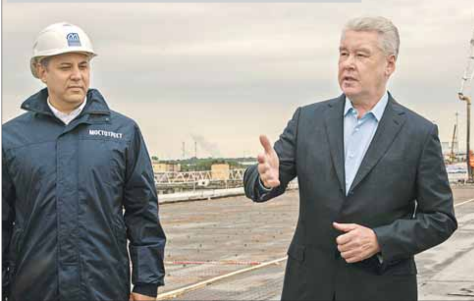
Сергей Собянин ознакомился с ходом строительства магистрали

тузиастов, Щёлковским, Дмитровкой, Ярославкой, — пояснил глава города.