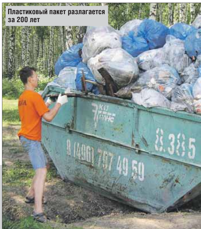
Пластиковый пакет разлагается за 200 лет

в 1957 году. Их использовали для фасовки хлеба, сэндвичей и других продуктов. В 1980-е годы в супермаркетах появились первые полиэтиленовые пакеты-сумки. И сегодня основной проблемой стала утилизация миллиардов произведённых за это время пластиковых пакетов, ведь срок их разложения около 200 лет!