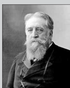
Чистотой в Париже озаботился префект Эжен Пубель

в обиход металлические ведра для сбора отходов, чтобы облегчить участь сборщиков мусора. А в конце XIX века префект департамента Сены, в состав которого входил тогда Париж, Эжен Пубель обязал домовладельцев приобретать специальные короба для хранения отходов. Наполненные ящики нужно было притаскивать в места общего пользования до прохода мусороуборщиков.