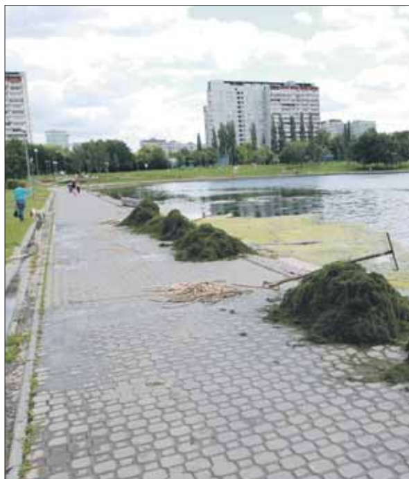
Мусор и растения из воды рабочие вытаскивали вручную