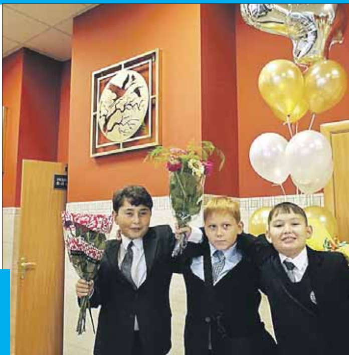
День знаний в новой школе №446 на площади Журавлёва

Причём 23 школы в округе набрали 100 и больше детей. Это центр образования №1811 (168 чел.), школа №2036 (151 чел.), гимназия №1748 (150 чел.). Также в числе лидеров по набору детей в первый класс школы №1504, 2026,