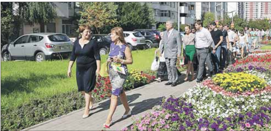
Дорожку выложили тротуарной плиткой