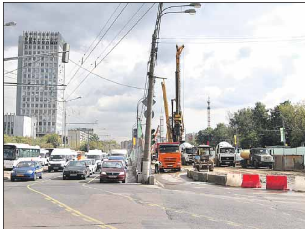
Идёт реконструкция Щёлковского шоссе у метро «Щёлковская»

— По утрам у меня почти все пассажиры выходят на Амурской, — рассказал мне водитель автобуса 3-го маршрута. — Только если идёт дождь, некоторые доезжают до метро — те, у кого нет зонтика. Идти от Амурской максимум три минуты, а я еду до метро минут 5-10, а то и дольше. Пробки на перекрёстке весь день. Утром трудно повернуть направо с Уральской на Щёл-