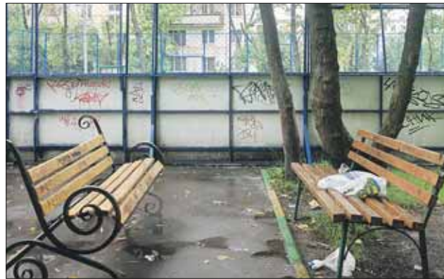
Пьяницы уходят, а следы остаются

В «ВО» №26 мы написали о Екатерине Реут из Богородского, которая защищает свою детскую площадку от пьяных компаний, в том числе регулярно вызывая полицейский патруль. После публикации в редакцию обратилась Мария Васильевна из района Перово. «На площадке у дома 29 на 3-й Владимирской улице днём и ночью собираются бомжи и алкоголики — безобразничают, передвигают скамейки, выдранные с корнем. По моей просьбе на площадке установлены таблички, запрещающие употреблять алкогольные напитки. Но на эту публику ничего не действует, даже регулярно вызываемые наряды полиции. Бомжи уходят на