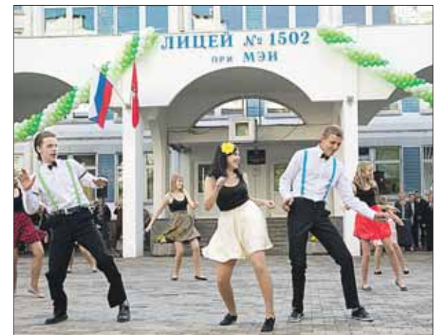
День знаний в лицее №1502