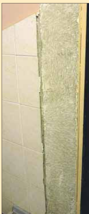
Так сейчас выглядят стены и крыльцо после так называемого капремонта в 2008 году