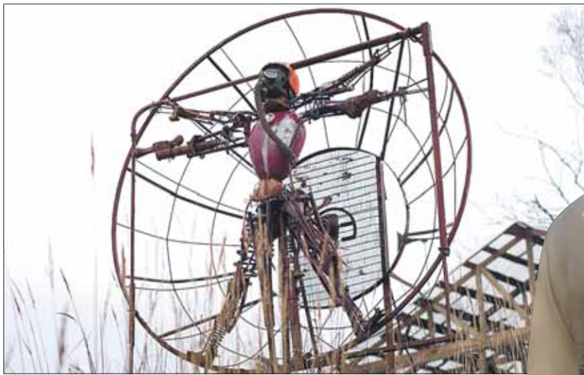
Кадр из фильма «Отдать концы»

скиным, который сыграл в твоём фильме одну из главных ролей. Не сложно работать вместе на съёмочной площадке? Или, наоборот, у вас творческий тандем?