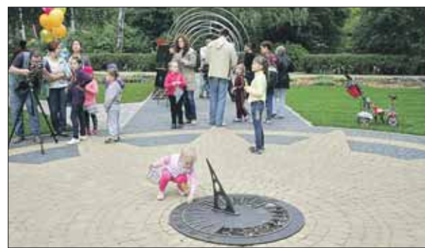
В центре экспозиции — солнечные часы

В «Сокольниках» открылся первый научно-популярный сад — Сад астрономов. Гости могут не только полюбоваться цветами, но и многое узнать об устройстве Солнечной системы. Чтобы попасть внутрь, нужно пройти через Астральные ворота — некую футуристическую конструкцию.