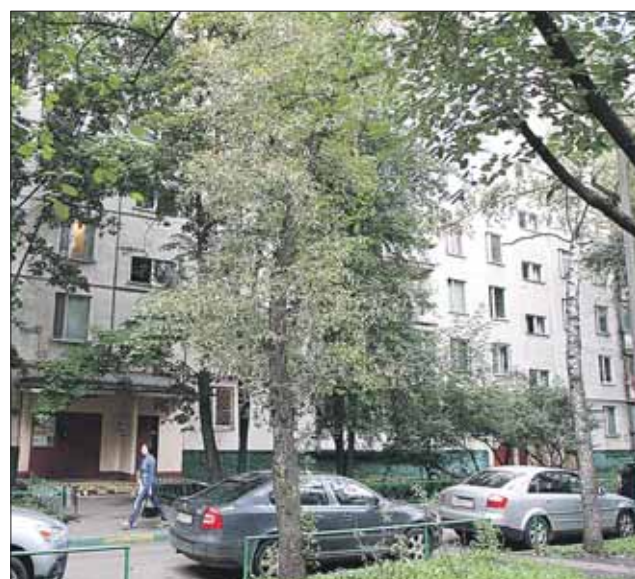
Понужовщина произошла в доме 13 по Снайперской улице