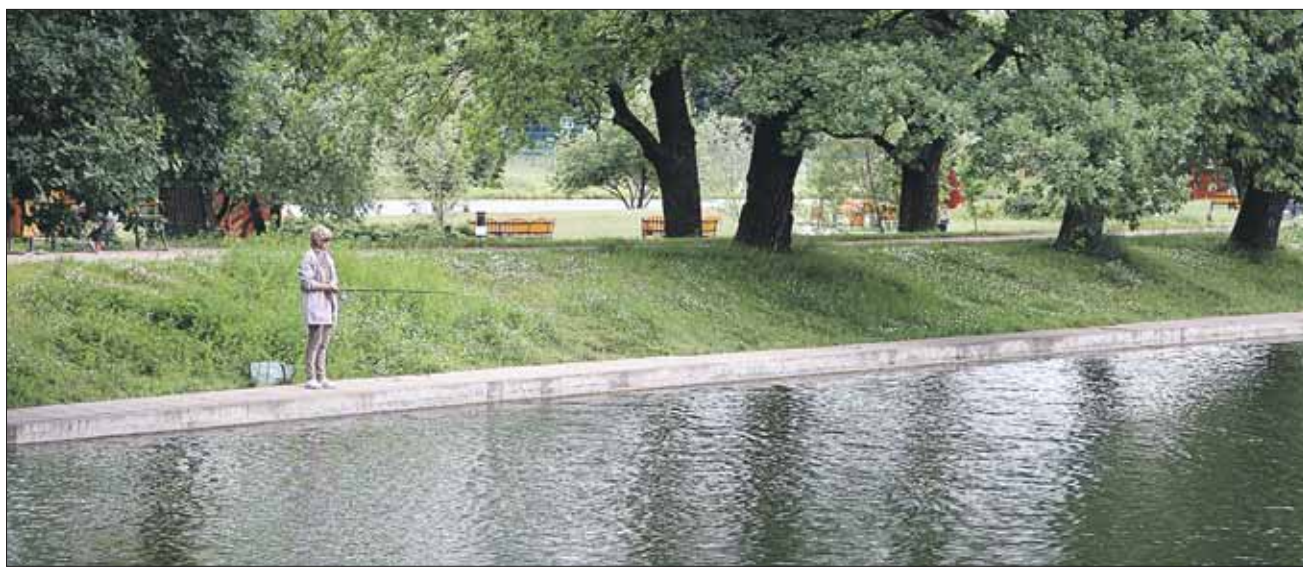
Терлецкие пруды сегодня