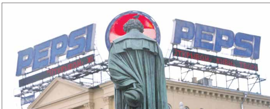
Пушкин на фоне известного бренда смотрелся странно

По его словам, на рекламном рынке Москвы существует хаос, порождённый последними полтора десяти-