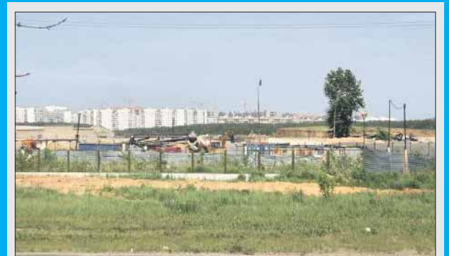
Бдительный житель заметил незаконную свалку мусора в промзоне на Салтыковской

Более 4 тыс. обращений жителей округа поступило на портал в июле. Недавно в разделе «Городская территория» появились новые рубрики: теперь можно сообщить о стихийных свалках мусора в рубрику «Захламление территории».