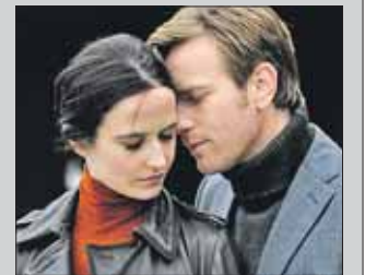
Кадр из фильма «Последняя любовь на Земле»

16 августа в летнем кинотеатре парка «Сокольники» можно увидеть фантастическую мелодраму британского режиссёра Дэвида Маккензи «Последняя любовь на Земле» (2011). Это история любви, которая разворачивается на фоне необычной эпидемии. На протяжении месяца человечество теряет одно чувство за другим: сначала обоняние, затем вкус. Начало сеанса в 22.00. Вход свободный. Летний кинотеатр находится на территории гайд-парка.