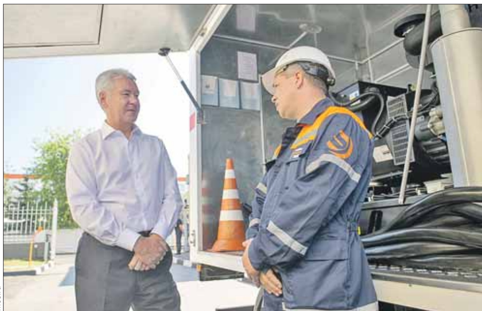
Подстанцию «Горьковская» сможет обслуживать всего один дежурный

Пуск подстанции «Горьковская» позволит частично решить проблему нехватки мощностей и ввести в строй