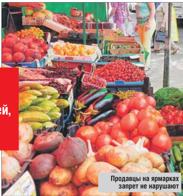
Продавцы на ярмарках запрет не нарушают

До ярмарки выходного дня в Гольянове на ул. Уссурийской, вл. 7, добрался уже ближе к вечеру. Там бойкая торговля. Уже наметанным взглядом оцениваю: 40 торговых мест, покупателей больше, чем обычно. Заветных мясомолочных лотков нет и в помине. Хотя замечаю несколько павильонов со сла-