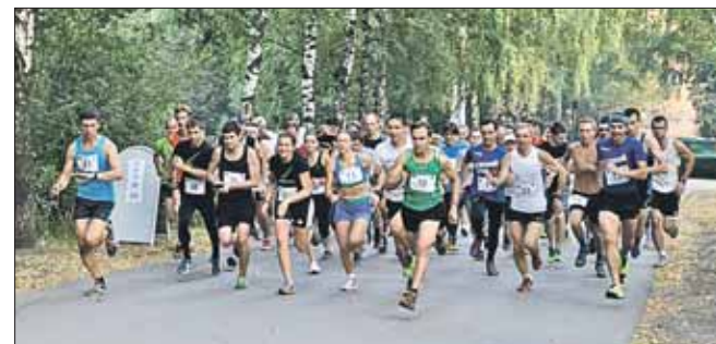
Сначала члены клуба пробежались, потом пошли танцевать

Свою первую годовщину отметил 30 июля беговой клуб «Терлецкий лесопарк». Несколько десятков спортсменов, не испугавшись жары, пришли побегать, потанцевать и поздравить друг друга.