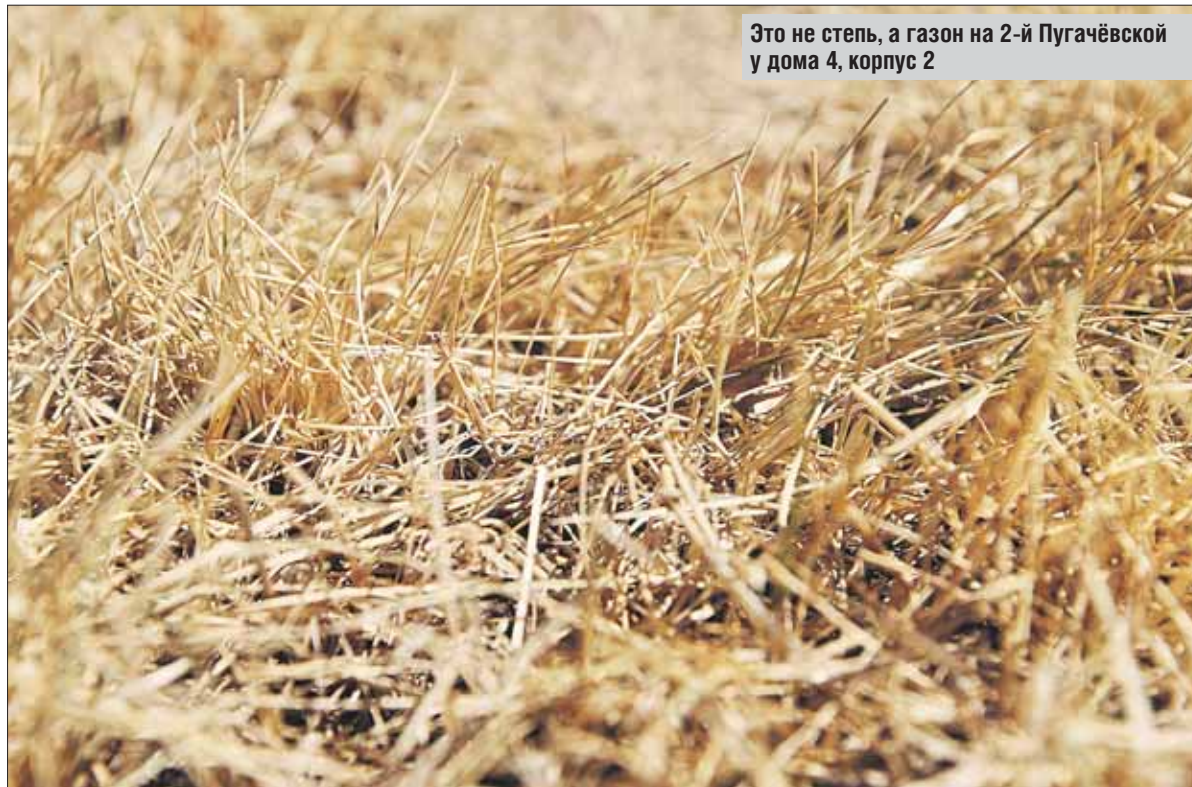
Это не степь, а газон на 2-й Пугачёвской у дома 4, корпус 2

Дальше, возле следующих подъездов, явно кто-