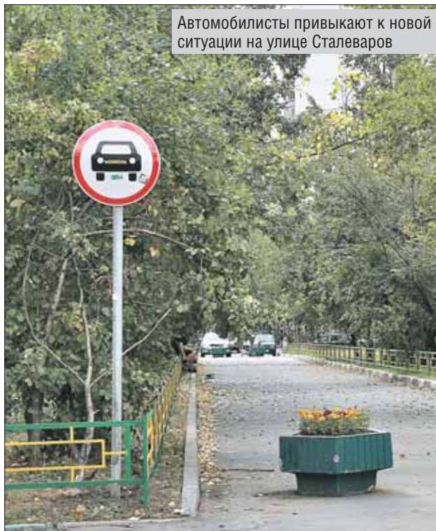
Автомобилисты привыкают к новой ситуации на улице Сталева-ров

Полностью закрыть проезд через зону отдыха пока нельзя