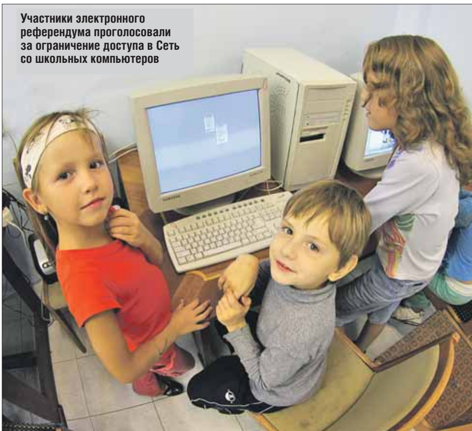
Участники электронного референдума проголосовали за ограничение доступа в Сеть со школьных компьютеров

Основные выводы: родители в целом выступают за то, чтобы домашних заданий стало меньше, чтобы на продлёнке было дополнительное обучение, а перед уроками проводились спортивно-оздоровительные мероприятия, чтобы в родительских собраниях можно было участвовать по скайпу. Ну и, конечно, уверенное «да» семьи сказали по поводу единого графика каникул. А не приветствуют папы и мамы, судя по результатам опроса, широкий доступ в Сеть со школьных компьютеров.