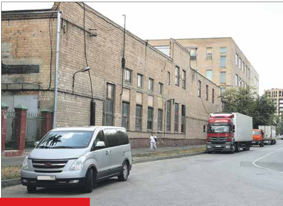
Развитием промзоны «Калошино» руководит управляющая компания

Хозяин конференции — генеральный директор ОАО «НПП Техно-