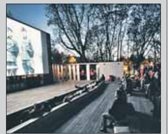
Киносеансы в Перовском парке начинаются в 10 вечера