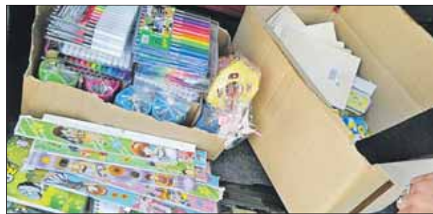
В 32 пунктах в ВАО будут принимать всё, что нужно для школы