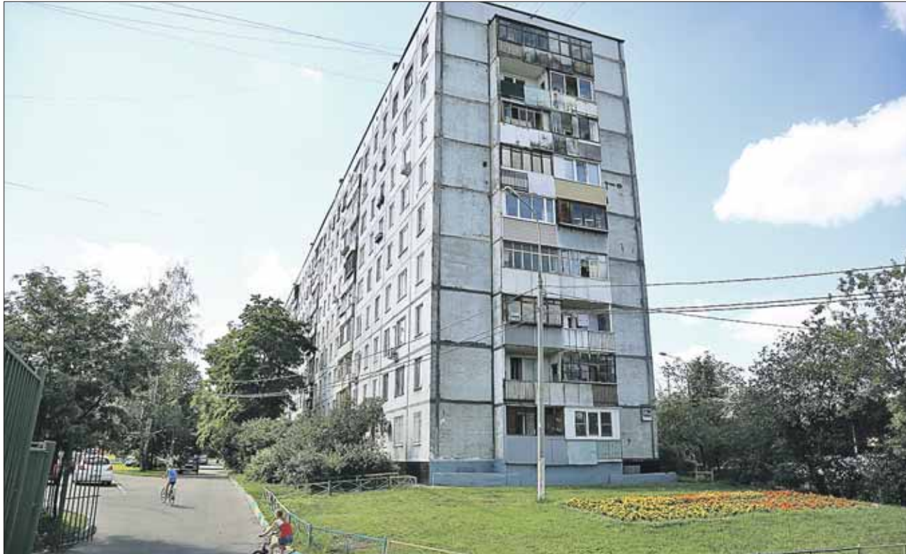
Девятиэтажка на улице Главной — самая старая в районе Восточный

— Во время прошлого капремонта, выборочно, в августе 2008 года при замене стояков горячей воды нам поставили пластиковые трубы без армированной — укрепленной