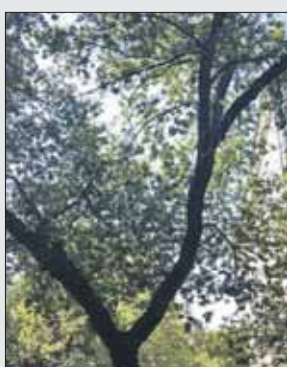
Аварийное дерево на улице Первомайской, 47/19

Жительница дома 47/19 на улице Первомайской сообщила на портал 1 августа: «Во дворе накренилось очень толстое дерево. На него повесили табличку «Дерево падает» и никаких мер не принимают уже долгое время. Также есть сухое дерево. Прошу решить данную проблему. Существует реальная угроза жизни граждан!» 5 августа в управе района Измайлово сообщили, что аварийное дерево удалено, а на дру-