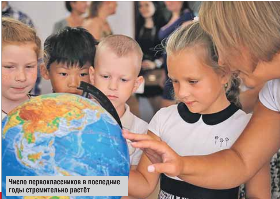
Число первоклассников в последние годы стремительно растёт

— За последние годы увеличилось число детей, поступающих в 1-е классы, поэтому сейчас все силы сосредоточены на том, чтобы построить новые блоки начальных классов в тех районах, где большая напряжённость со школами. Эта школа в Косине-Ухтомском полностью готова принять учащихся, — отметил столичный градоначальник. — За последние пять лет мы построили 63 новые школы, 22