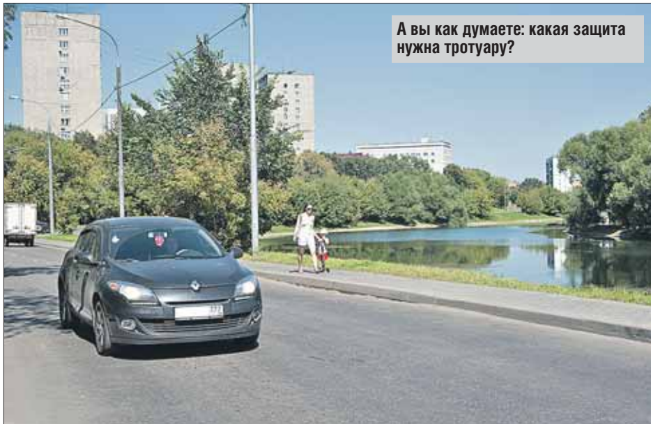
А вы как думаете: какая защита нужна тротуару?

Дорога снабжена всем необходимым, включая тот самый тротуар. Нельзя сказать, чтобы он не был защищён: тротуар отделён от проезжей части бортовым камнем, высо-