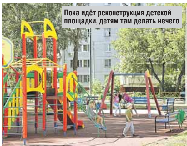
Пока идёт реконструкция детской площадки, детям там делать нечего