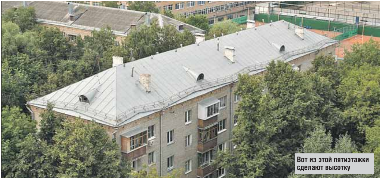
Вот из этой пятиэтажки сделают высотку