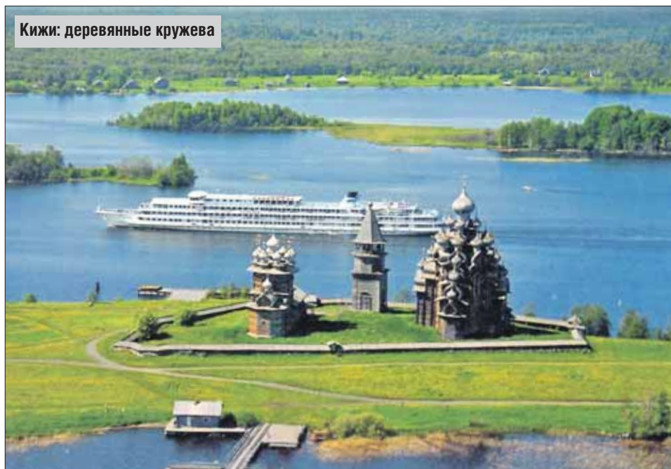
Киж: деревянные кружева

Теплоход «Русь Великая», которому предстояло на много дней стать моим домом, приятно удивил: современный, с удобными каютами. Я путешествовал в одиночестве, обитал, соответственно, в одной каюте. Всё новенькое, с иголочки, и очень приветливый персонал. Но, в конце концов, это не главное. Главное — величественная северная природа. Чистей-