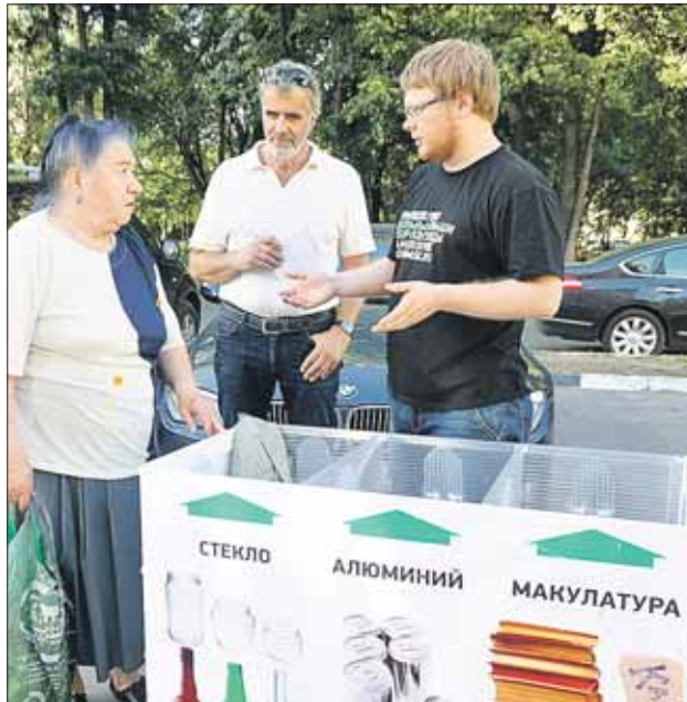
В прошлом году в акции приняли участие более 5 тысяч жителей столицы