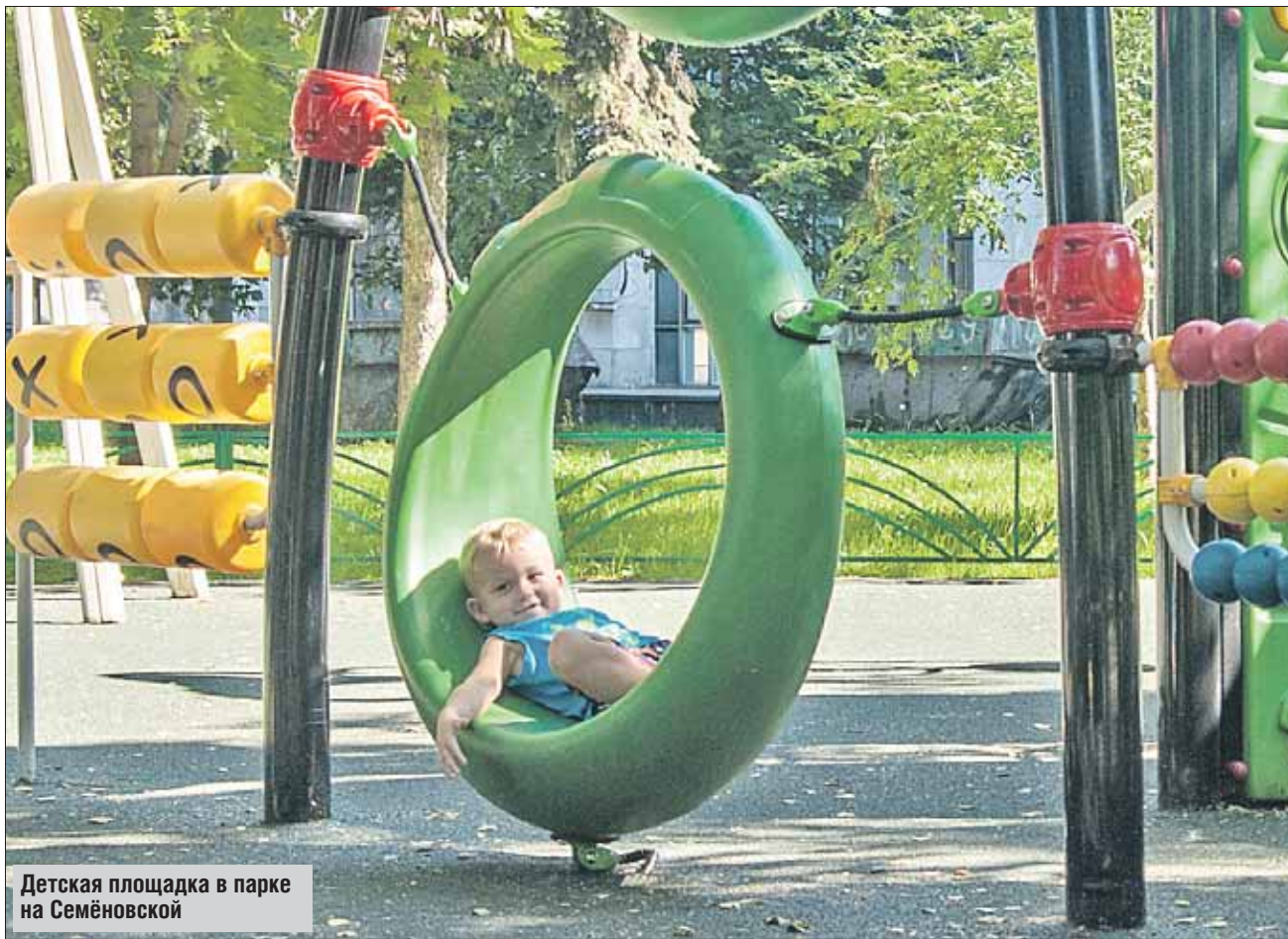
Детская площадка в парке на Семёновской

Обустройство народных парков в округе вышло на финишную прямую