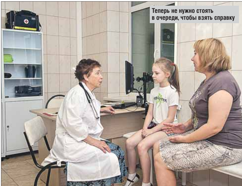
Теперь не нужно стоять в очереди, чтобы взять справку