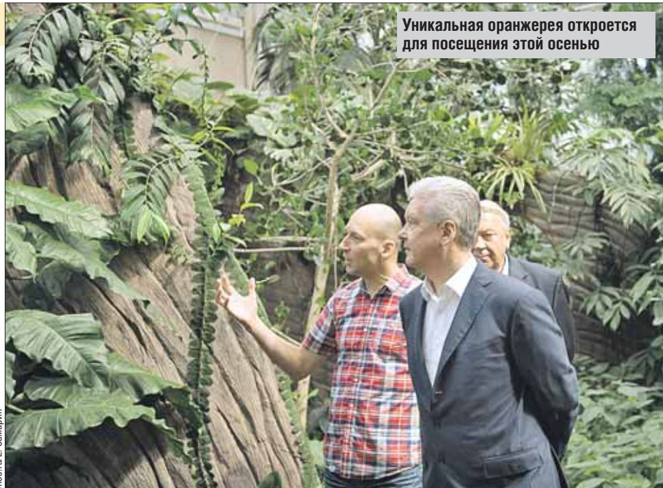
Уникальная оранжерея откроется для посещения этой осенью

Популярность ВДНХ среди москвичей и гостей города многократно возросла. В прошлом году именно главная выставка страны стала самой притягательной точкой для гуляний в День города. Тогда же снесли заборы между ВДНХ, Ботаническим садом и Останкинским парком — получилось единое пространство для комфортного отдыха. По статистике, каждые выходные там гуляют свыше полу-