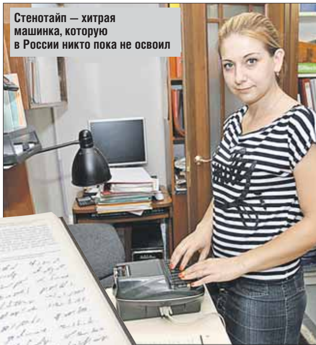
Стенотайп — хитрая машинка, которую в России никто пока не освоил