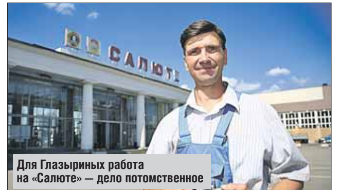
Для Глазыриных работа на «Салюте» — дело потомственное

В конкурсе 44-летний токарь участвует уже несколько лет, но добаться до вершины пьедестала удалось лишь сейчас.