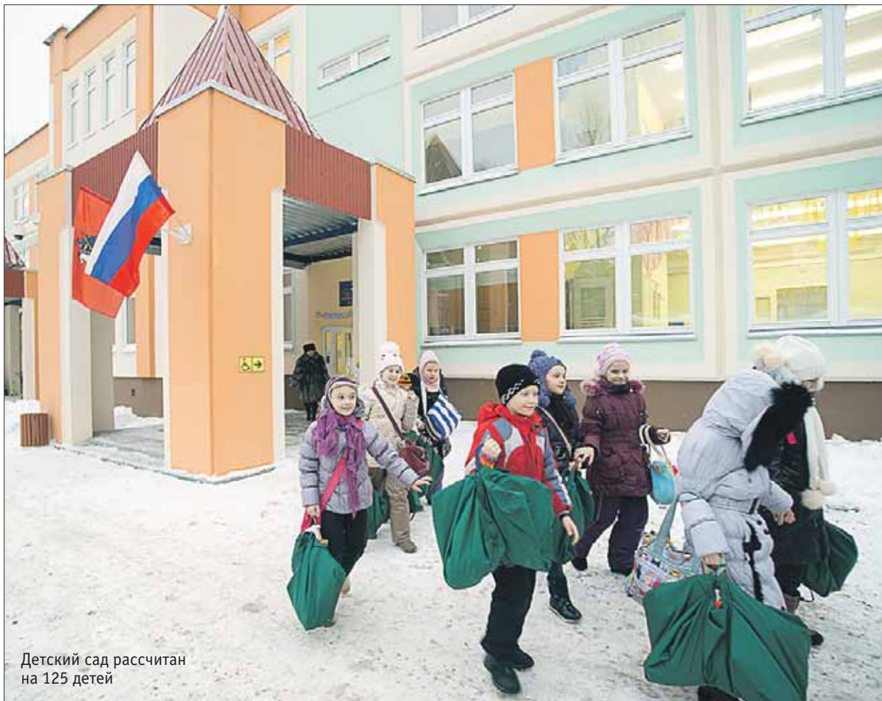
Детский сад рассчитан на 125 детей

Актёр Лев Прыгунов: Измайлово — отдельный прекрасный город стр. 14