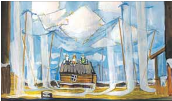
Декорация к спектаклю

Невеста появится только в конце спектакля. Простит ли девушка загулявшего парня — всегда загадка. Невеста каждый раз будет принимать новое реше-