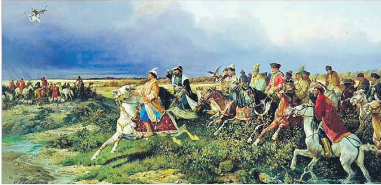
Царь Алексей Михайлович с боярами на соколиной охоте близ Москвы. Н.Е.Сверчков

В её честь названы две улицы и поле в парке «Сокольники»