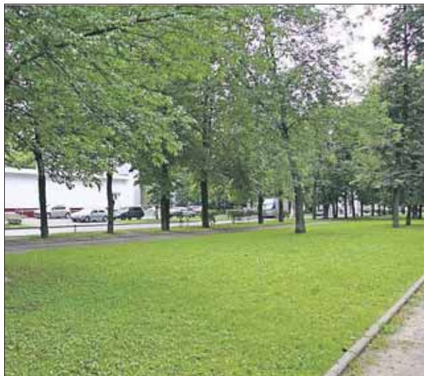
На бульваре оборудуют три детские площадки