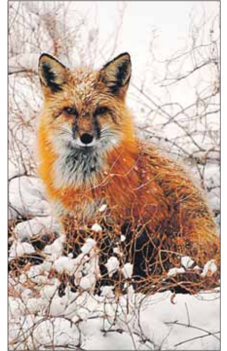
Лисы в лесу — размером с кошку