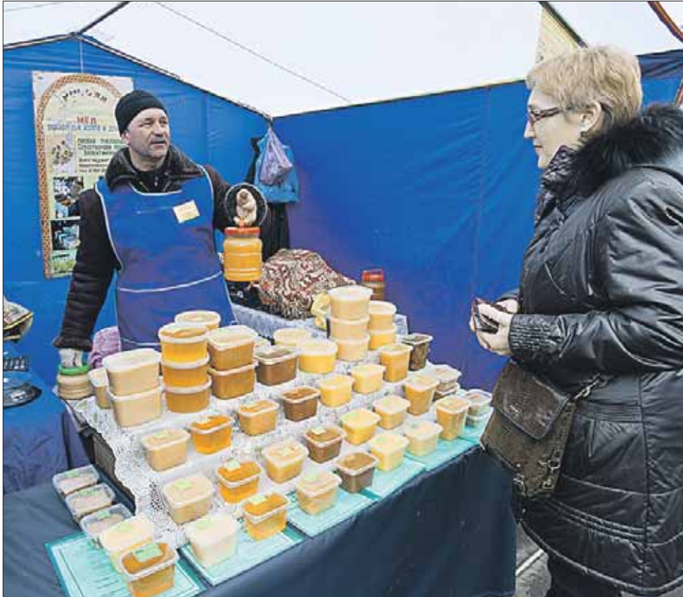
На ярмарках можно торговать только продовольственными товарами