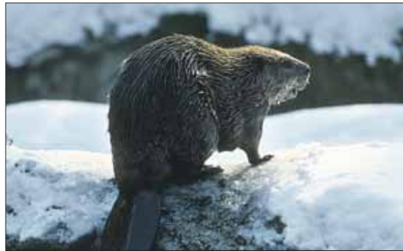
Бобров можно встретить на Ичке или Яузе