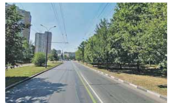
Старый Гай сегодня