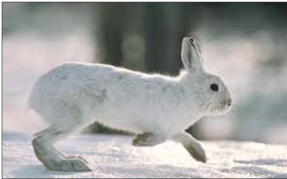
Зайцы надёжно прячутся