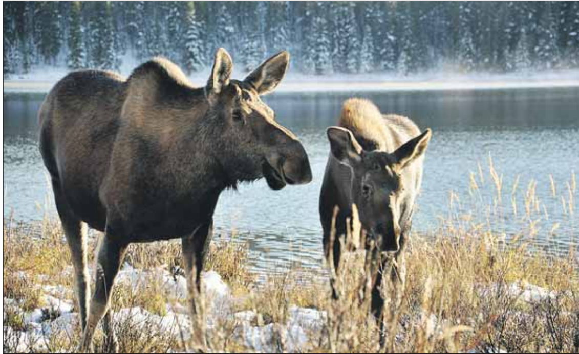
Лосей всего 70