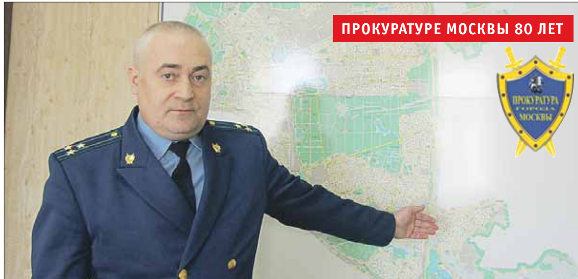
«Даже если люди хотят забрать заявление, мы доводим дело до конца»

— На сайте Прокуратуры г. Москвы в разделе «Обращения граждан» создан специальный раздел — «Игорный бизнес». Каждый может передать информацию о действующих игорных заведениях, эти данные оперативно проверяют.