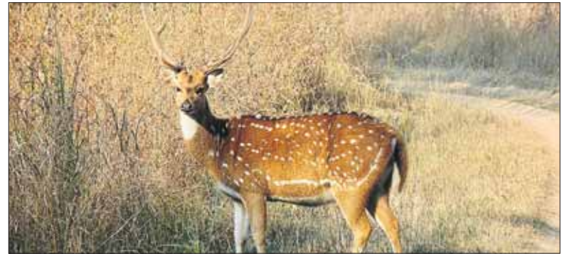
Летом олени скрываются в чаще