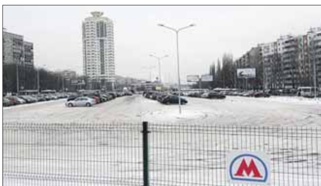
Такие же парковки планируется открыть у метро «Новокосино» и «Измайловская»