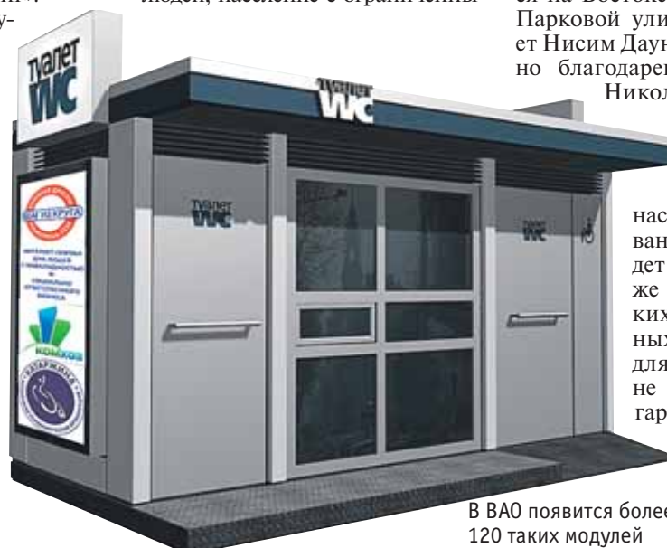
В ВАО появится более 120 таких модулей