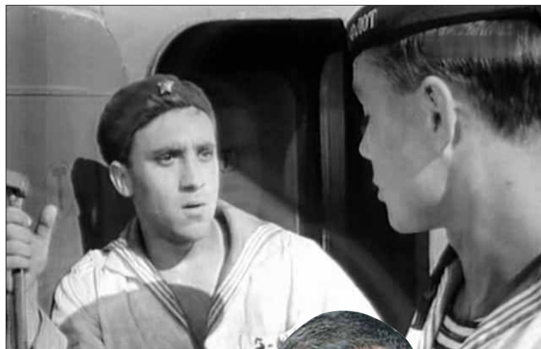
«Увольнение на берег» считают классикой советского неореализма