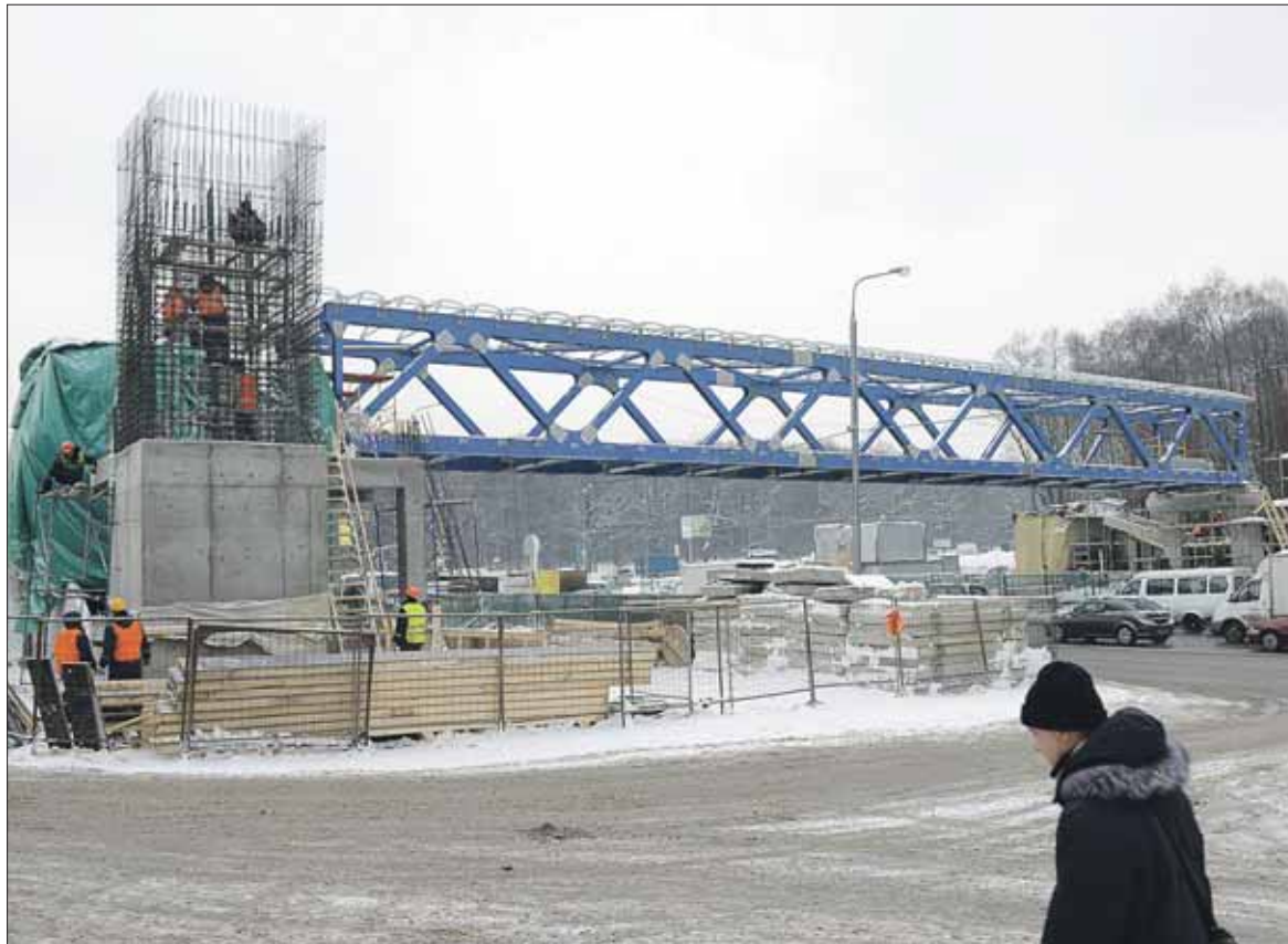
Один из надземных переходов сейчас сооружают на Магнитогорской

Сегодня слишком большая доля населения Москвы и области ездит на работу в центр города. Видимо, утренние пробки на пути в центр не исчезнут до тех пор, пока эта