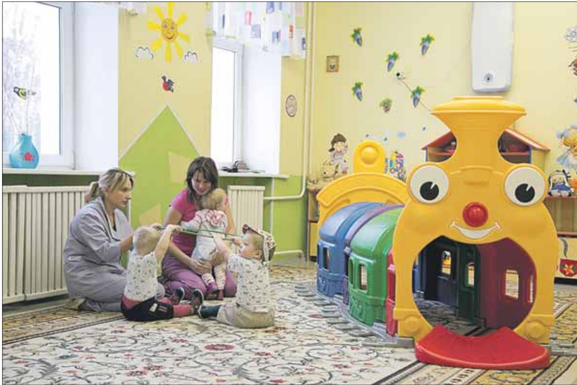
В игровой комнате воспитатели занимаются с детьми

За год 36 малышей из дома ребёнка в Сокольниках обрели новую семью