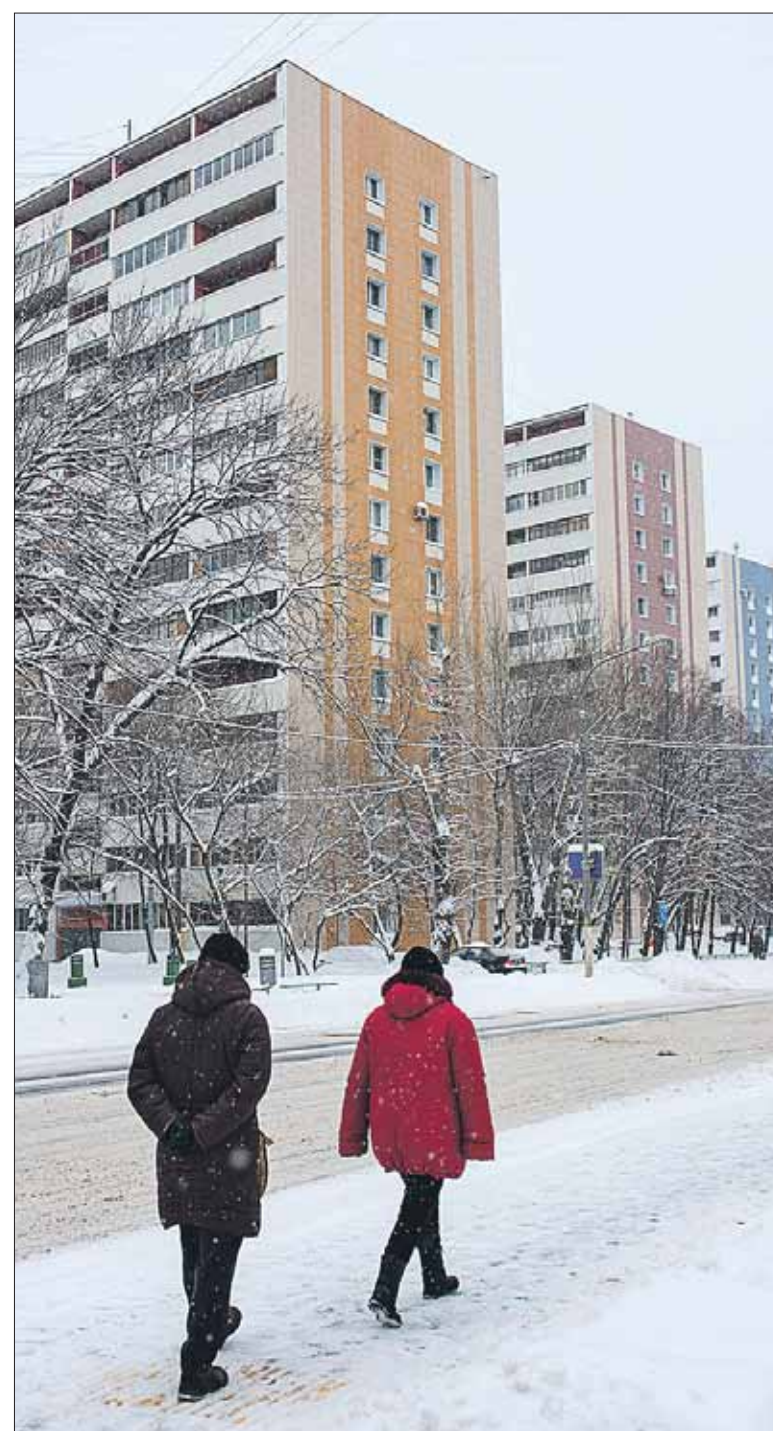
Дома на Измайловском шоссе вошли в программу капремонта