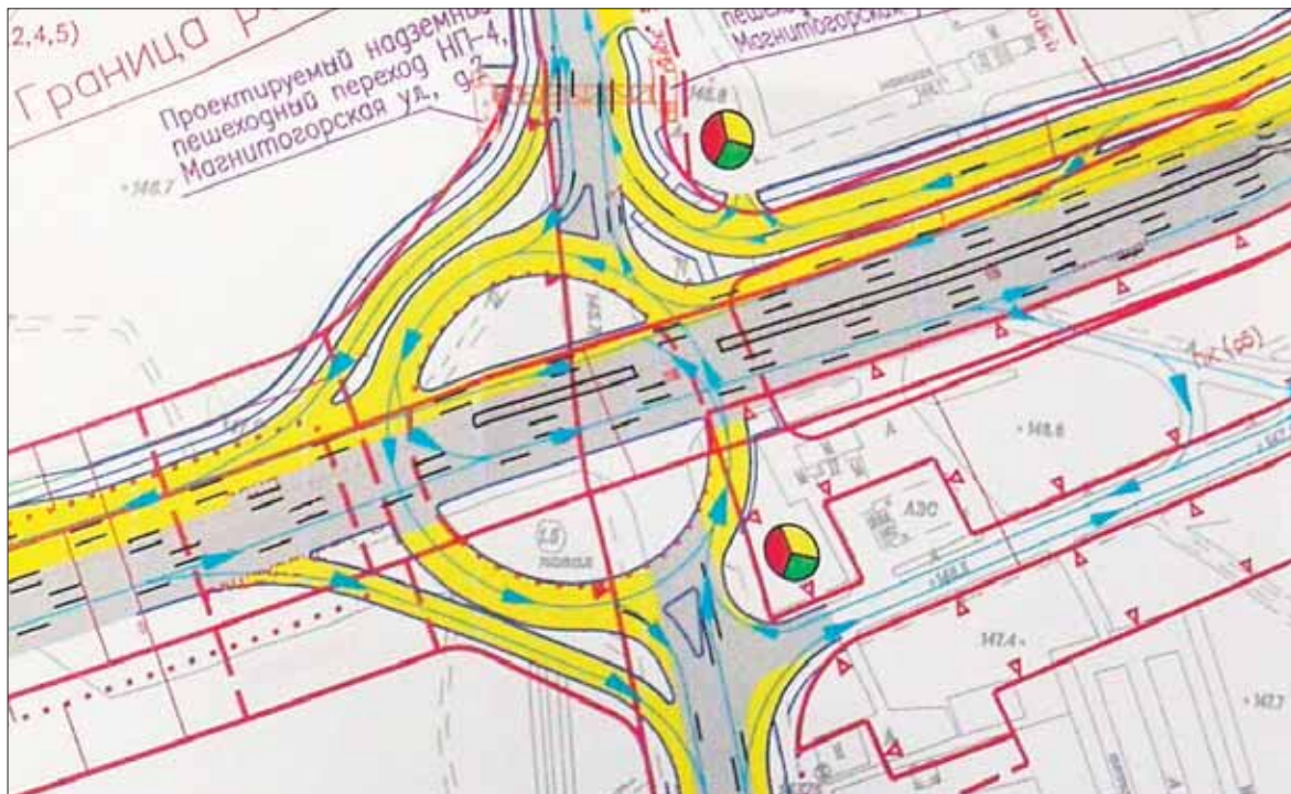
Круговое движение поможет разгрузить этот участок