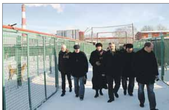
Зам. префекта осмотрел территорию приюта

В прошлом номере мы писали о Кожуховском приюте для бездомных животных.