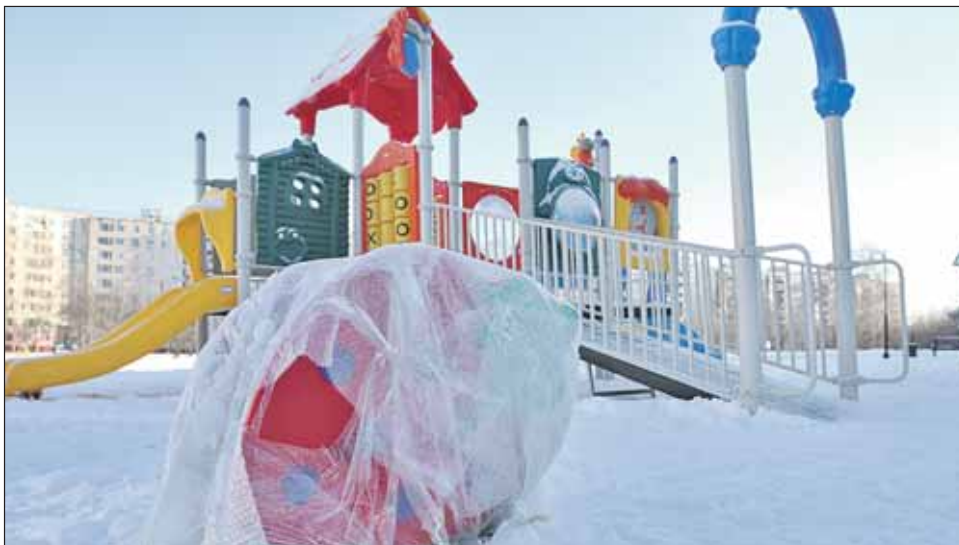
Часть игрового оборудования на детской площадке на шоссе Энтузиастов ещё не распаковали

На поверку всё оказывается не так страшно. В сквере напротив школы №400 (ш. Энтузиастов, 100) стоит новый игровой городок для детей: «кораблик» с лестницами и горками, теремок, качели и качалки. 20 января я проверил: сооружения собраны и смонтированы нормально, все гайки и шурупы на месте (не исключаю, что это действительно доделали местные жители). В общем, площадка производит впечатление не «безобразно собранной», а недоделанной. Так, и «кораблик», и теремок просто стоят на зем-