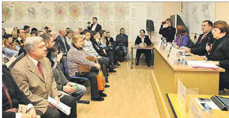
Кому-то нужны митинги, кому-то — ясность

Жители категорически возражали против строительства торгового центра с банкетным залом на 3-й Парковой улице. Эту принципиальную позицию поддержал префект, и строительство отменили.