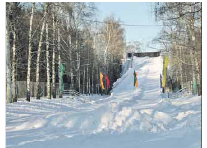
Длина горки — 200 метров