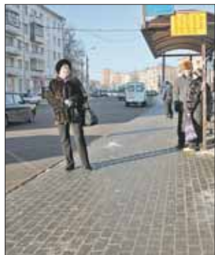
Опасных ям больше нет