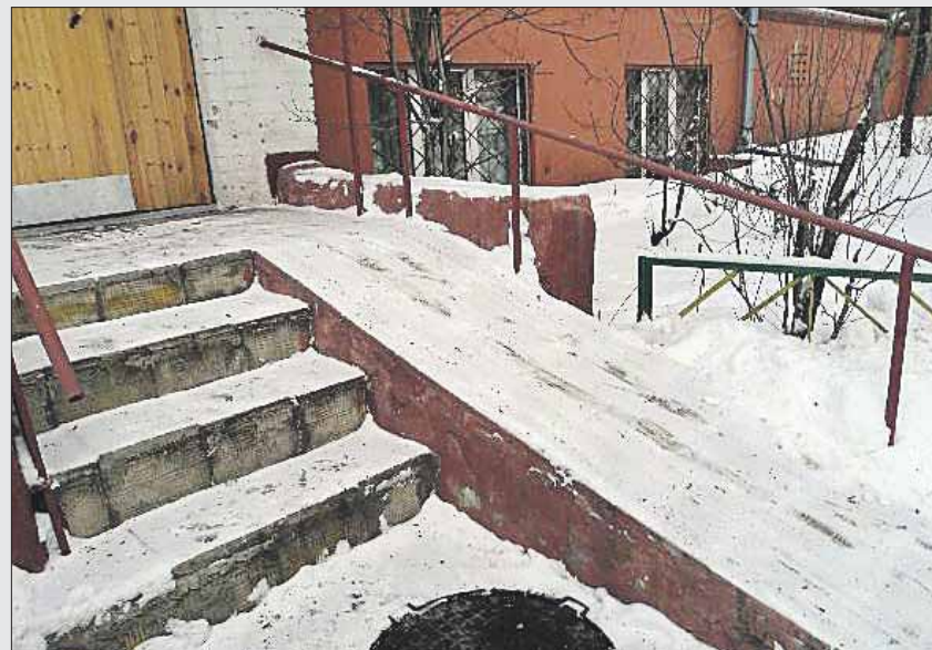
Пандус у подъезда на Измайловском проезде, 20, корпус 1

Всего поступило 18 обращений по поводу скользких ступеней и площадок у подъездных дверей. Как правило, меры по таким обращениям принимались в течение одного-трёх дней. На общем фоне выделяется официаль-