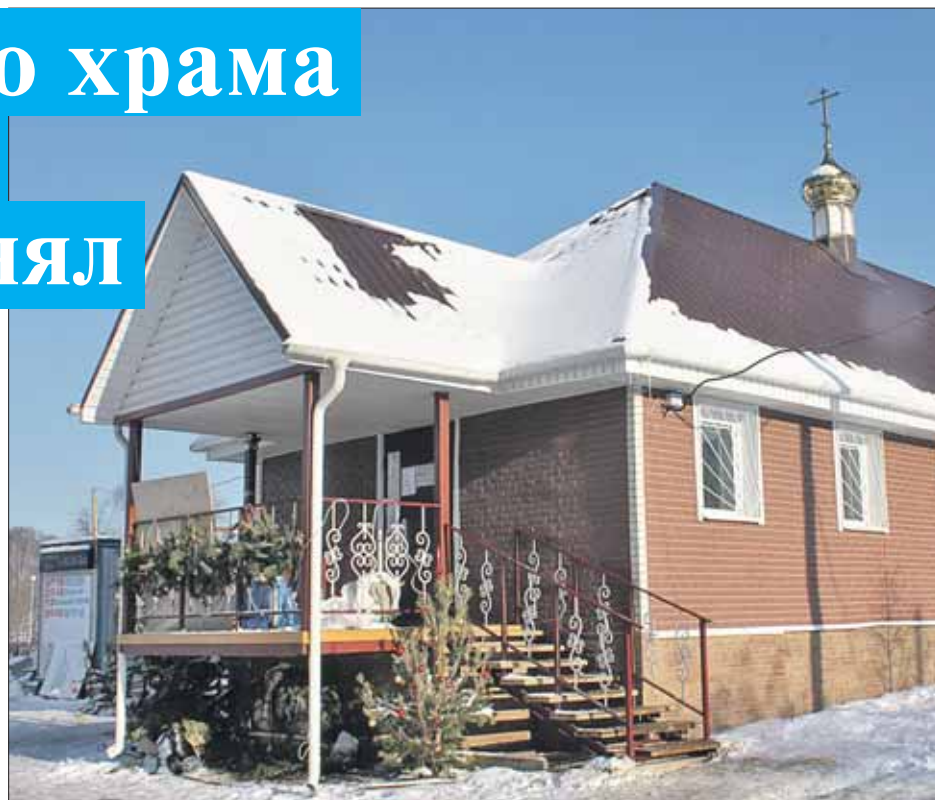
Пока на земельном участке на Уральской, владение 21, возведён временный небольшой храм