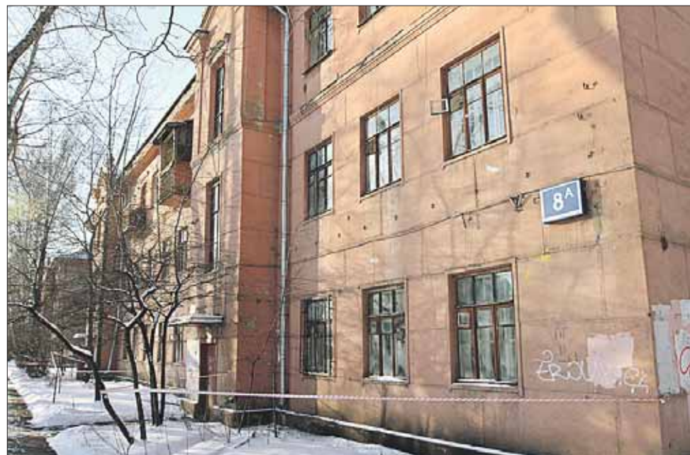
Издали дома кажутся нежилыми

Наворачиваю новый круг. Вижу: мальчик, уроженец Средней Азии, спешит куда-то с портфелем. Он, заметив меня, тушует-ся. Останавливается, делает вид, что ждёт кого-то. Я тоже хитрю. Якобы ухожу, а сам прячусь за углом. Мальчик бежит к дому, стучится в дверь, ему отпирают,