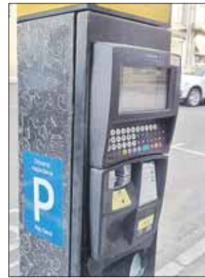
Паркоматы в центре Москвы пока останутся

Общественный референдум по вопросу о платных парковках не состоится. Для его проведения инициаторы плебисцита должны были за месяц собрать 143 531 подпись москвичей. Последним днём сбора было 18 января. Но именно в этот день выяснилось, что «миссия невыполнима».