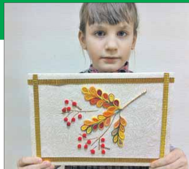
В кружок принимают детей с пяти лет

АДРЕС: Сиреневый бул., 46/35, корп. 4. Тел. (499) 464-1229