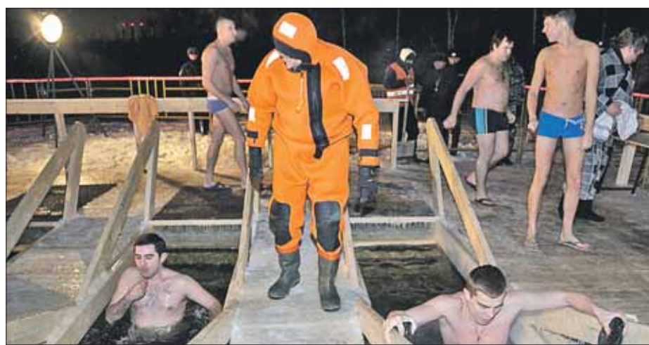
Помощь спасателей и медиков не понадобилась