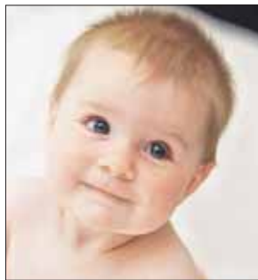
префектуры ВАО, родилось 17 941 ребёнок.

Всего же в округе в минувшем году, по данным