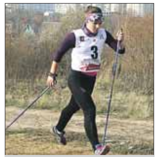
Скандинавская ходьба не имеет возрастных ограничений

На Metallургов открыта секция скандинавской ходьбы