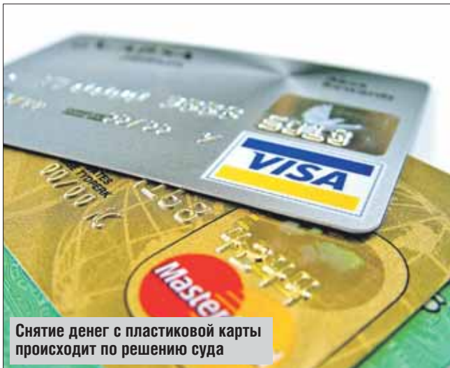
Снятие денег с пластиковой карты происходит по решению суда

Например, в Косино-Ухтомском у жителя Каскадной улицы с карточки списали больше 150 тыс. рублей. Подать в суд компания может и при относительно небольшой сумме долга, например у жительницы Горюховской улицы в Новокосине списали около 15 тыс. рублей. Самую же большую сумму в ВАО в 2014 году списали с банковских карт должников района Измайлово — более 8,5 млн руб-