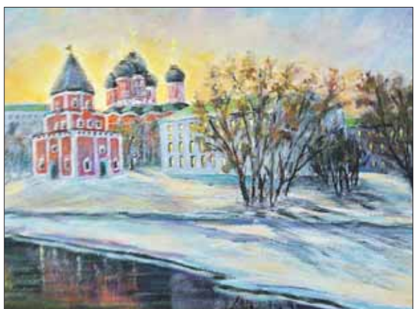
Д. Таубе, Измайлово, 2012