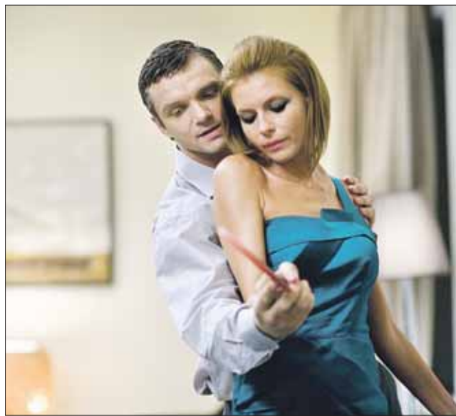
Кадр из фильма «Компенсация»

я проводила в деревне. В доме я частенько оставалась одна: бабушка уходила на скотный двор, а дедушка уезжал на работу. Он был водителем, отвозил доярок на ферму. Весь дом оставался на мне: вытряхнуть половики, перемыть полы и окна, приготовить что-то. В 12 лет я уже умела печь блины, пончики, сырники, варить супы и жарить картошку. Мне больше всего нравилось, когда дедушка ел приготовленный мною обед, а я в это время шла мыть окна в автобусе, выметать грязь из проходов. Я в дедушке души не чаяла — ни к кому я больше такого не испытыва-