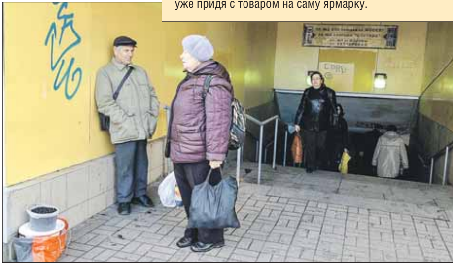
У платформы Новогиреево

Как пояснили в отделе торговли и услуг префектуры ВАО, дачники должны обратиться в управу района, где расположена ярмарка. У них должна быть как минимум справка из садоводческого товарищества о том, что они имеют дачный участок, или справка из сельсовета о наличии личного подсобного хозяйства, приусадебного участка. О своём желании торговать на ярмарке выходного дня дачникам и огородникам лучше сообщать в управу заранее, чтобы на ярмарке успели подготовить для них торговые места. А показать документы можно, уже придя с товаром на саму ярмарку.