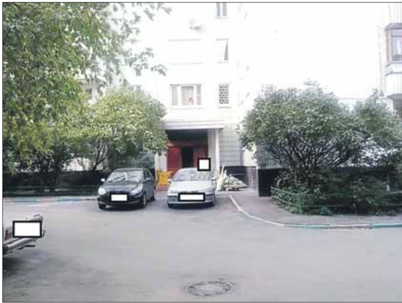
Фотоответ управы района Ивановское: «Лужа не обнаружена»

С начала сентября на портал «Наш город» поступило более 60 жалоб на подтопления во дворах округа. Больше всего — 9 — из Гольянова, по 7 — из Богородского и Ивановского, по 6 — из Новогиреева, Перова и Метрогородка. Анализ обращений и официальных ответов удивил тем, что многие управы отрицают наличие луж как таковых. Причём их несколько не смущало, что жители оставляли на портале жалобы с фотографиями огромных луж, сделанных во время или сразу после дождя. Тогда как чиновники подтверждали свои ответы, что «подтопление не обнаружено», фотографиями, сделанными в сухую погоду.