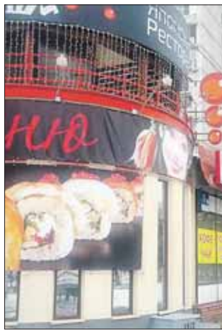
Было. Улица Саянская, 11а

— Понятно, что пока ещё рано говорить об успехах в этом деле, но это именно то, о чём я говорил, — отметил Всеволод Тимофеев.