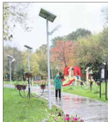
Пешеходная зона между 6-й и 9-й Парковыми улицами

Пешеходную зону «Бухта радости» на ул. Сталеваров, 4, корп. 4, в Ивановском решили проверить и вовсе в дождь. Оказалось, и там плитка себя оправдала. Лужи есть, но на порядок меньше, чем на асфальтовых дорожках, и не такие глу-