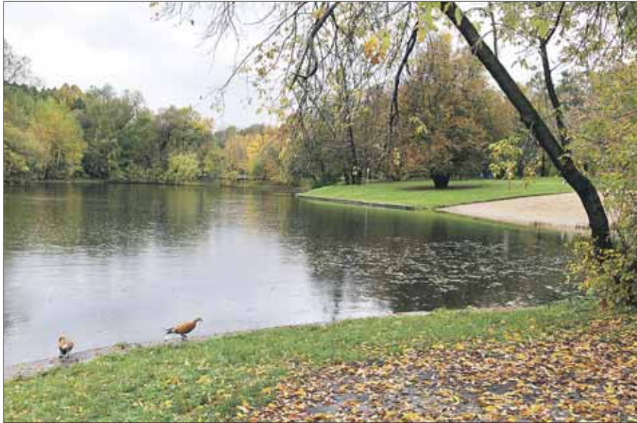
Олений пруд в Сокольниках

Правительство Москвы выделило 105 млн 53 тыс. рублей на очистку девяти прудов, расположенных в шести парковых зонах города. В нашем округе приведут в порядок два пруда — Олений в парке «Сокольники» и Советский в парке «Перовский».