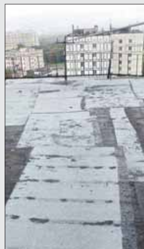
На крыше дома 14, корпус 1, на Утренней улице поставили «заплатки»

А.Смирнова с Глебовской ул., 8а, корп. 2 (район Богородское), написала 7 сентября на портал о протечке кровли на лестничной клетке