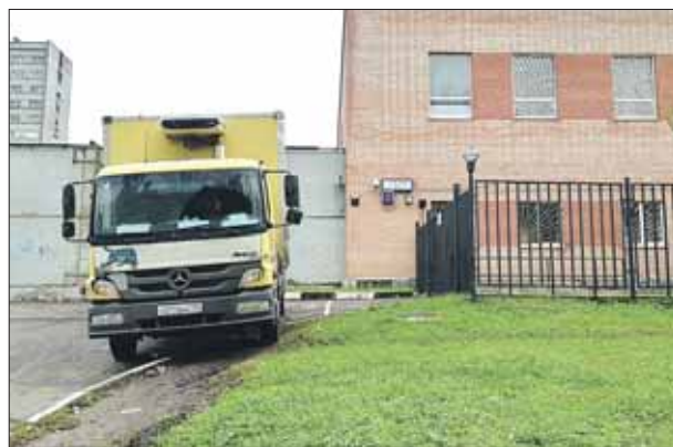
Улица Лазо, 1, район Перово