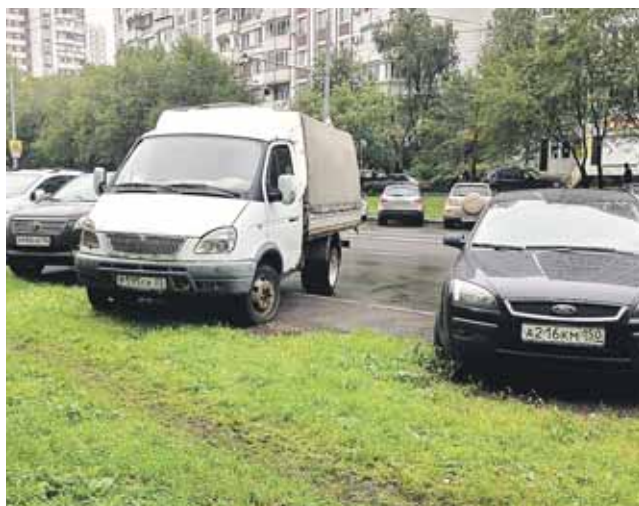
Улица Новокосинская, 38-42, район Новокосино