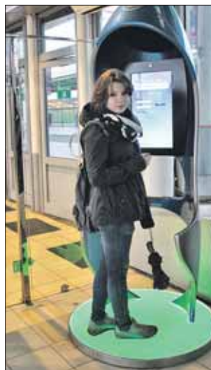
Скоро такие кабинки будут появляться на других станциях метро

По словам и.о. начальника Выхинского участка железной дороги Светланы Исайкиной, несмо-