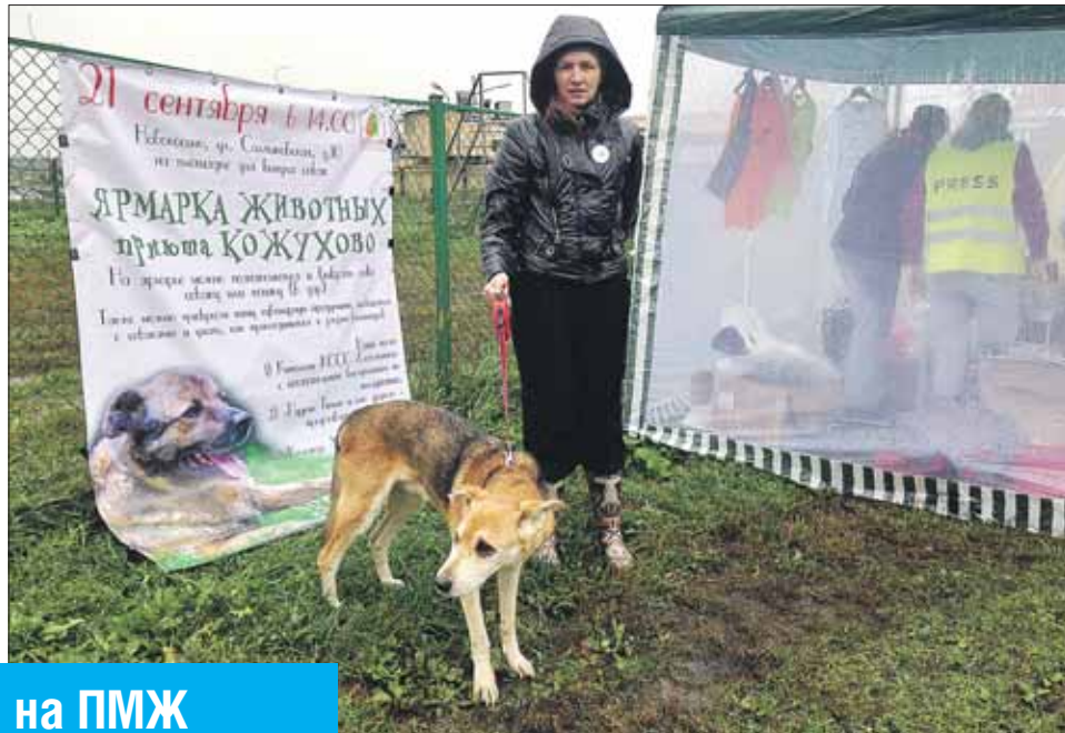
Можно было бесплатно забрать домой понравившуюся собачку

— У Джека была сильнейшая моральная травма. Полная апатия, — расска-