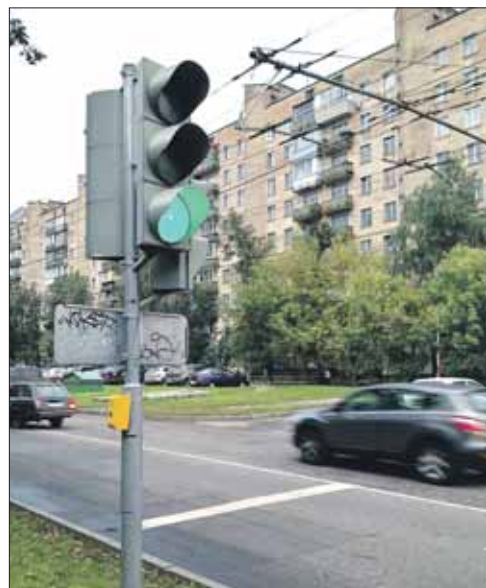
Кнопку для пешеходов у дома 62 на Сиреневом бульваре уже сделали

В последние годы при установке или переделке светофоров ориентируются в первую очередь на повышение безопасности пешеходов. И это понятно: наезды на них остаются одним из самых распространённых видов ДТП в Москве, при которых люди погибают или получают травмы. В 2012 году в городе произошло 11 707 ДТП с пострадавшими, из них 4361 наезд на людей.