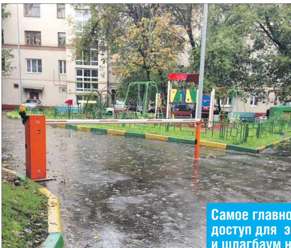
У дома 22 на улице Буженинова

Жильцы этого дома до сих пор ждут, когда появится новый шлагбаум. Однако теперь ни управа, ни ГКУ ИС не поставит им новое ограждение. По новому постановлению жильцы дома могут сами, за счёт собственных средств перегородить двор. Процедура установки серьёзно упрощена.