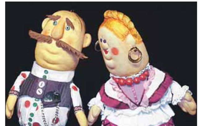
Сцена из спектакля «Добрый Иван»