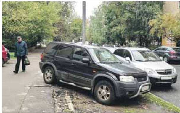
Улица Первомайская, 58б, район Измайлово

В редакцию обратилась Нина Ивановна с улицы Новокосинской: «На газонах вдоль Новокосинской улицы от остановки «Школа» до остановки «Универмаг» (дома 38, 40, 42) стоят машины. Эти газоны надо срочно огородить». Наш фотокорреспондент обнаружил, что эта проблема