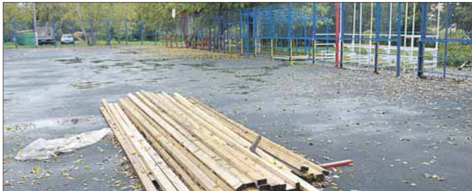
А досок становится все меньше

На минувшей неделе корреспондент «ВО» убедился: спортплощадка по указанному адресу в плачевном состоянии, в конце концов. По всему периметру сняты деревянные обшивки снизу, лавочки и пол с трибун. Само металлическое ограждение, однако, окрашено, и, судя по следам краски на асфальте, не так давно. Посреди поля лежит и мокнет сильно початый штабель половой доски. В одном месте рабочие даже начали класть пол на трибунах, положили метра 3-4, этим дело и кончилось. Насчёт освещения: присутствуют и прожекторы, и проводка, и рас-