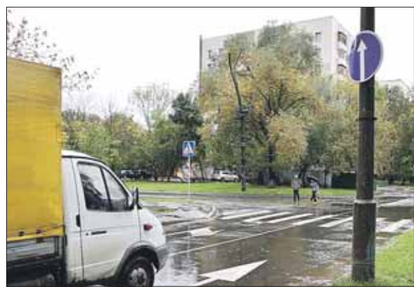
Жители хотят здесь поворачивать налево