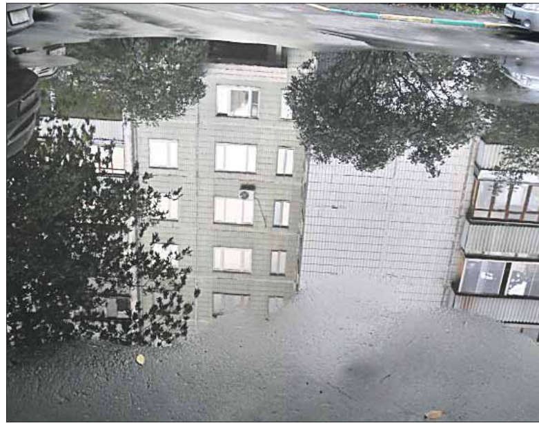
Лужа на Свободном проспекте, 1, корпус 2, сфотографированная жителем

Почему управы «не могут» найти подтопления в своих районах