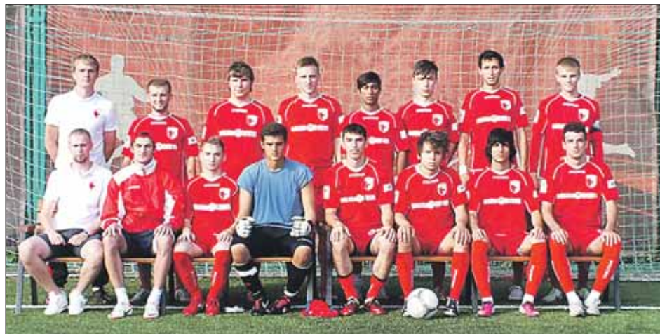
В команду принимают ребят от 16 лет

Сейчас ребята играют в 4-м дивизионе чемпионата России, принимают участие в турнирах, где их соперниками становятся команды из футбольных секций разных школ.