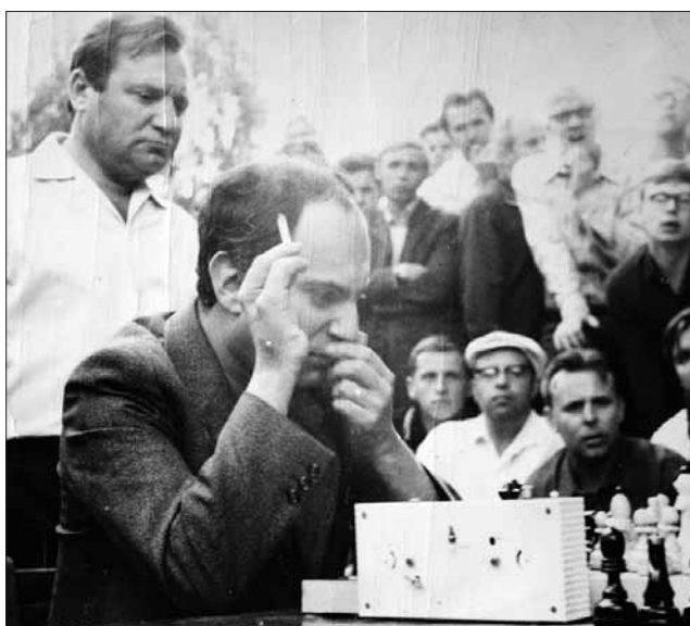
У Талья всегда было много болельщиков. Сокольники, 1971 год

— Эта история началась в Риге в 1967 году, — рассказывает Карл Соломонович. — Там в рижском шахматном клубе мы сыграли с Михаилом Талем партию вничью, и я до сих пор храню бланк, где записаны все ходы. Прекрасно помню тот день — ещё днём, играя в волейбол на пляже, я обратил внимание на очень красивую девушку, блондин-