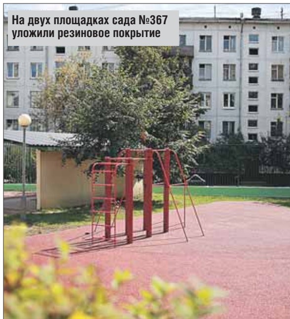
На двух площадках сада №367 уложили резиновое покрытие

Подрядчики обещали за свой счёт завести свежий грунт