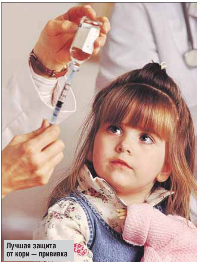
Лучшая защита от кори — прививка