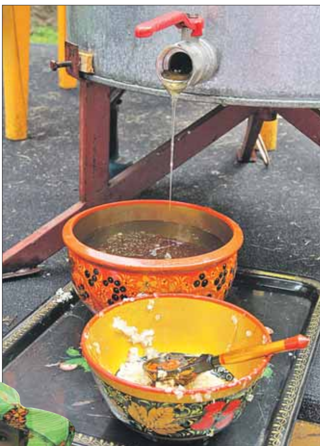
При «Царской пасеке» работают курсы пчеловодов

и размахивают руками. Это типичная ошибка. Пчёлы не атакуют людей, а всего лишь ищут нектар. Взмахи руками они воспринимают как