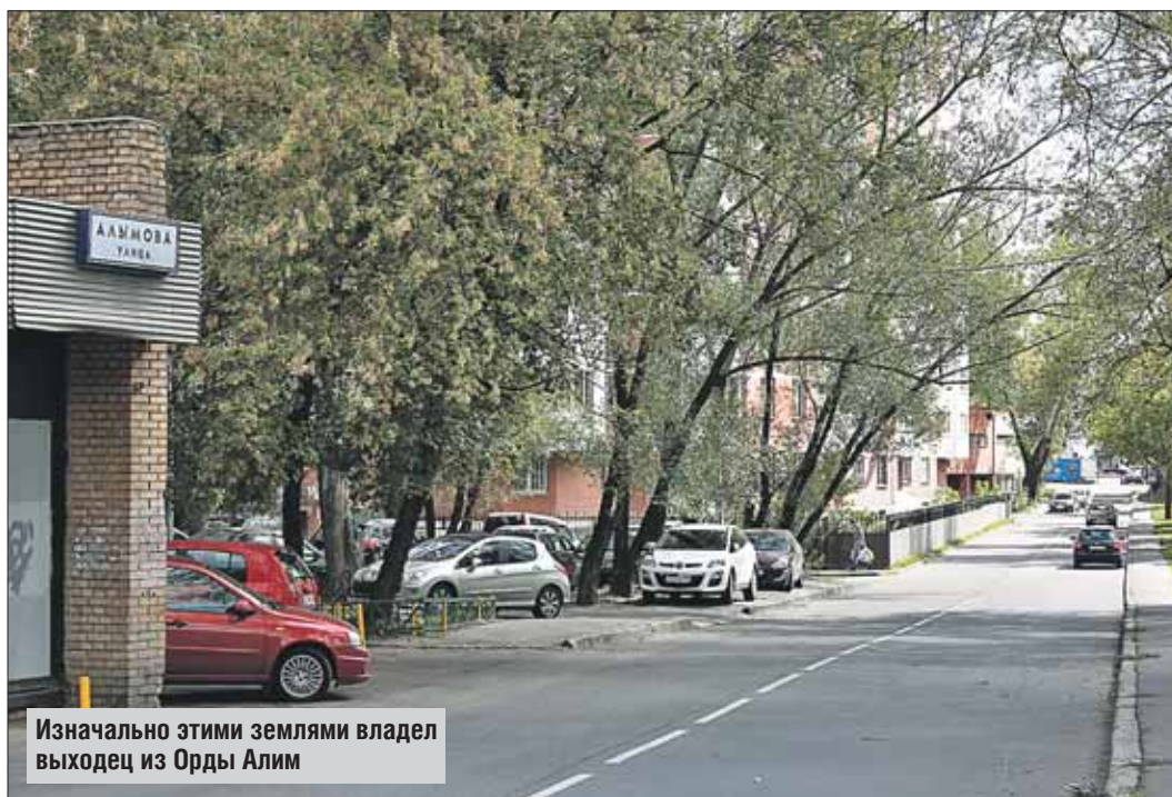
Изначально этими землями владел выходец из Орды Алим