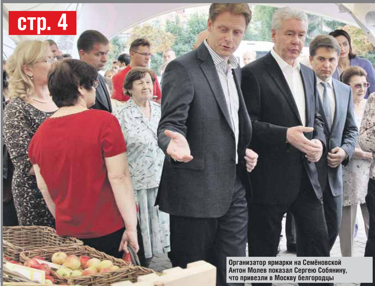
Организатор ярмарки на Семёновской Антон Молев показал Сергею Собянину, что привезли в Москву белгородцы