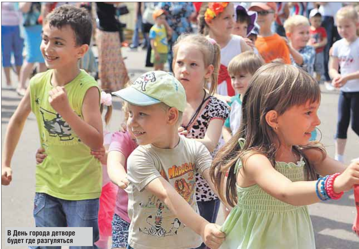
В День города детворе будет где разгуляться

6 сентября в каре Государева двора музея-усадьбы «Измайлово» (городок ул. Баумана, 2, стр. 14) состоится концерт «Тебе пою, любимый город!». Вы слушаете оркестр «Гусли-