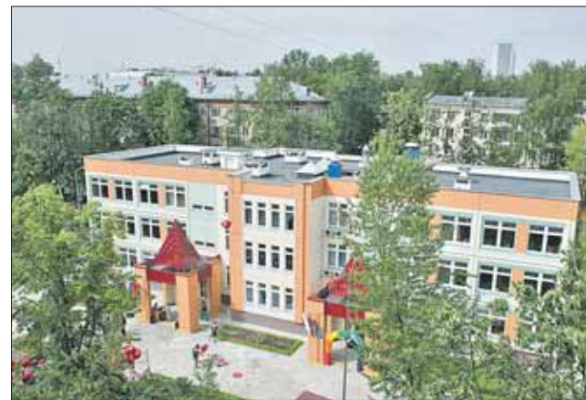
Детсад в Северном Измайлово сдали в этом году

Мэр также обратил внимание на то, каких успехов удалось достичь в столичном образовании в минувшем учебном году. Треть всех победителей всероссийских олимпиад составляют столичные школьники. При этом число москвичей-победителей по сравнению с 2013 годом выросло вдвое. Директор Московского