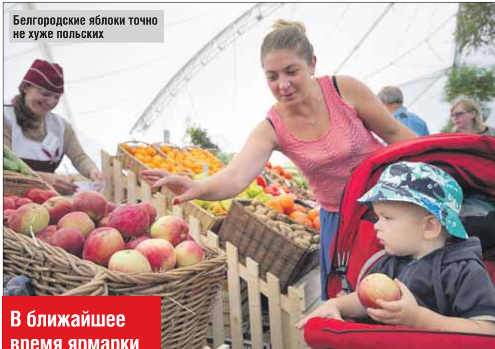
Белгородские яблоки точно не хуже польских

Уже в десять утра жители стали «стекаться» на ярмарку. Ассортимент широкий, все продукты аккуратно разложены по корзинам. Картошку можно найти в среднем по 30-35 рублей, кабачки около 40-45 рублей, лук по 35 рублей за килограмм. Столько же в среднем стоит свёкла, помидоры — по 80, огурчики — 70. С другой стороны крытого шатра можно приобрести мясо, птицу и молочные продукты. Филе грудки — от 280 до 380 рублей за килограмм. Сметана — 120 рублей за кило, творог на 40 рублей дороже.