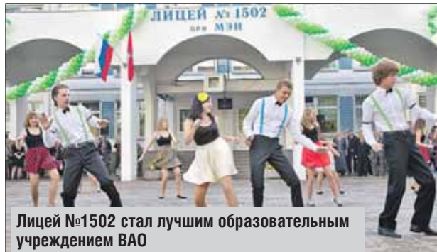
Лицей №1502 стал лучшим образовательным учреждением ВАО

Грант мэра Москвы 3-й степени — гимназия №1508 (Измайлово);