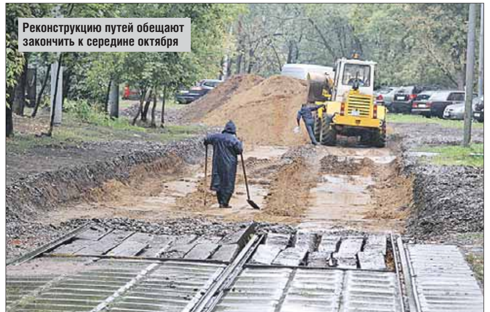
Реконструкцию путей обещают закончить к середине октября

Одновременно организуется маршрут автобуса №013 от Детского санатория до метро «Преображенская площадь» с трассой следования вдоль трамвайной линии: От-