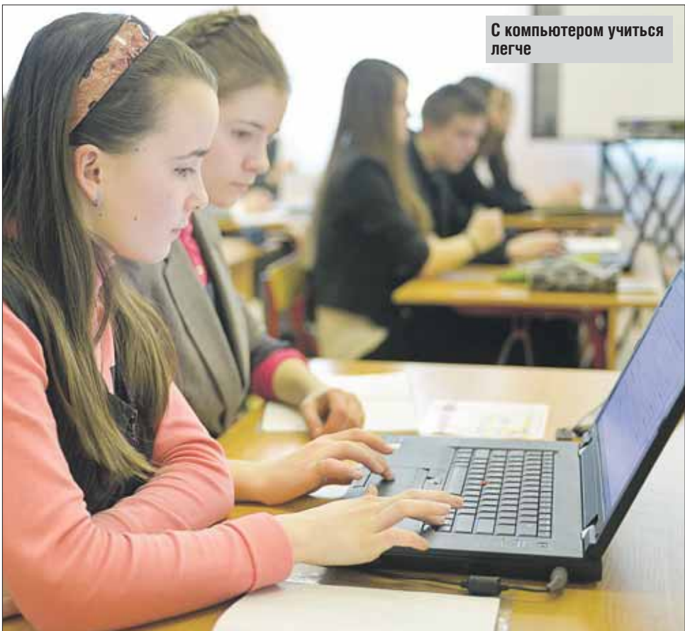
С компьютером учиться легче

— Весь год шло объединение школ в крупные образовательные комплексы. За-