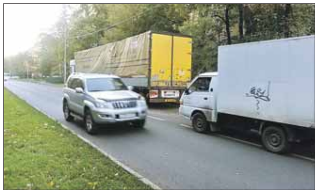
Эта фура уже два месяца стоит на улице Хромова, перекрывая одну полосу из двух и создавая пробки