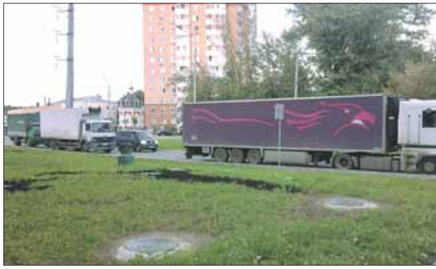
Парковка фур у жилых домов на Ивanteeвской улице, 4, корпуса 1 и 2, и Погонном проезде, 23, корпус 1