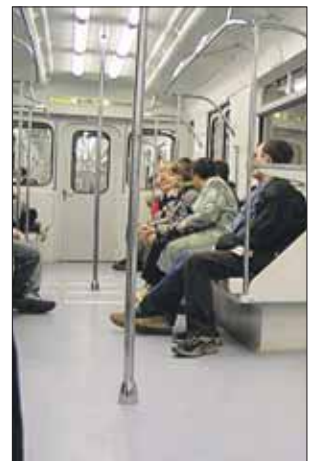
С помощью кнопок можно открывать нужные двери