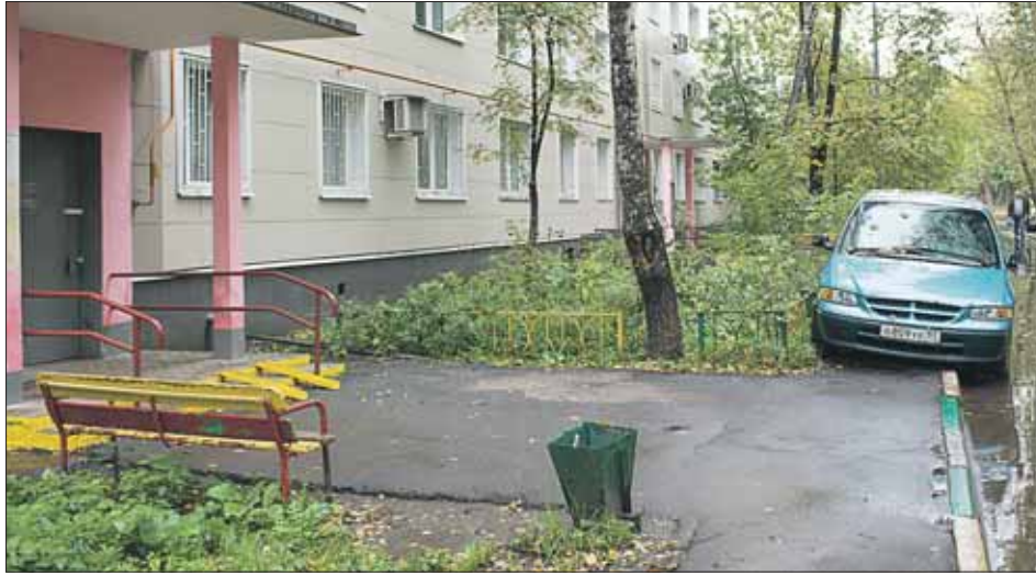
Ширина проезда и тротуара — около 4,5 метра