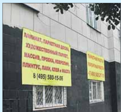
На улице Преображенской реклама теперь не загромождает окна