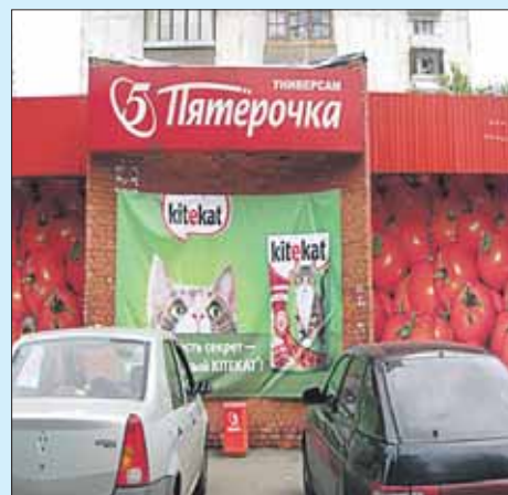
С «Пятёрочки» в Метрогородке сняли незаконную рекламу кошачьего корма