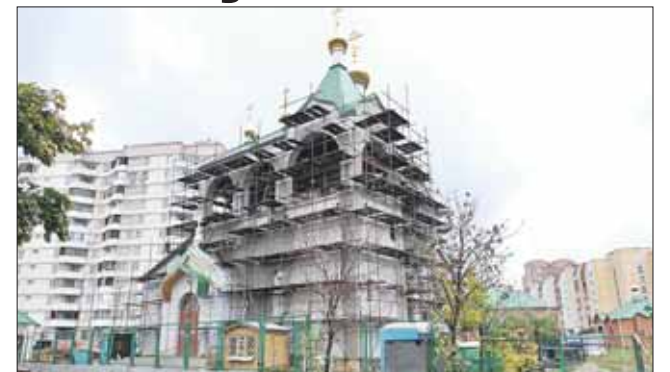
Храм на Суздальской