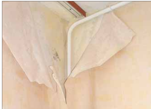
Штукатурка на стенах превратилась в желе

В квартире, расположенной на последнем этаже 12-этажного нового дома, действительно обширная протечка. Вода течёт по двум смежным углам соседних комнат, течёт уже давно — в этих местах полностью отош-