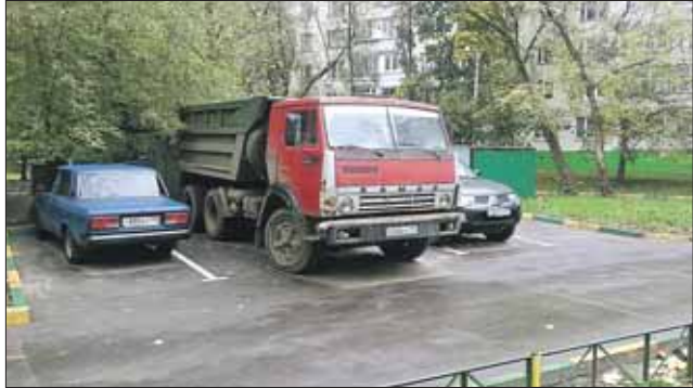
КамАЗ успешно переночевал на парковке у дома 4, корпус 2, на 2-й Пугачевской улице

В глубине жилых кварталов их водители облюбовали места стоянок