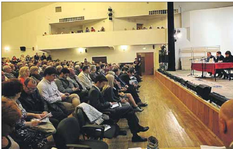
Жители интересовались и зарплатой преподавателей музыкальных школ, и судьбой кинотеатров