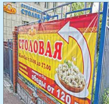
В районе Соколиная Гора с забора сняли рекламу столовой