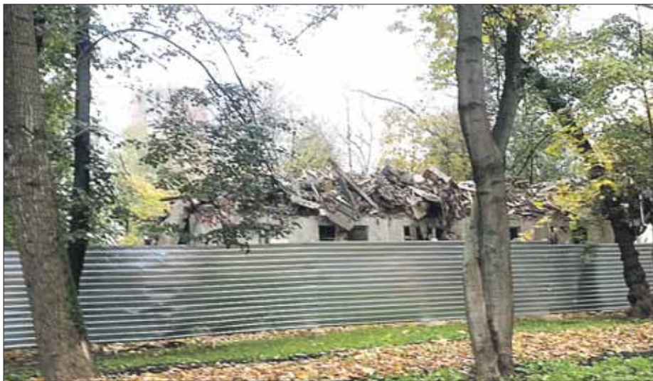
На днях снесли дом на Халтуринской, 9, корпус 1

Четыре дома — Щёлковское ш., 71, корп. 1, Измайловский просп., 63, 65, 67, в настоящее время отселены частично. Оставшиеся жители ждут сдачи новостройки на Амурской, 56, где идёт ликвидация недоделок и оформление квартир в собственность города. Смотровые ордера уже выдают, планируется, что до конца года жители переедут.