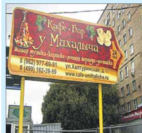
На Большой Черкизовской убрали рекламу кафе