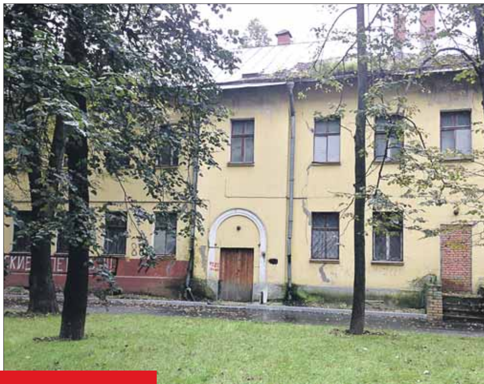
Земля под бывшим детсадом стала яблоком раздора

Неожиданной развязкой слушаний стало выступление независимого эксперта при Минюсте РФ Анатолия Реканта, кото-