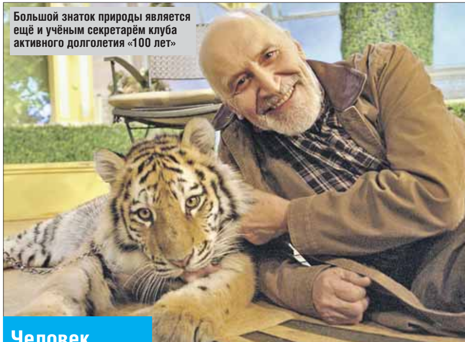
Большой знаток природы является ещё и учёным секретарём клуба активного долголетия «100 лет»

— У меня стояла задача — финансово себя обеспечить, а не сидеть у родителей на шее. И после семейного спора я взял и ушёл со 2-го курса на швейную фабрику №14. За год сшил пальто,