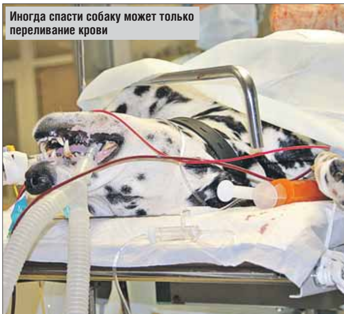
Иногда спасти собаку может только переливание крови

Переливание крови (или гемотрансфузия) домашним животным — процедура для россиян новая, но уже востребованная.