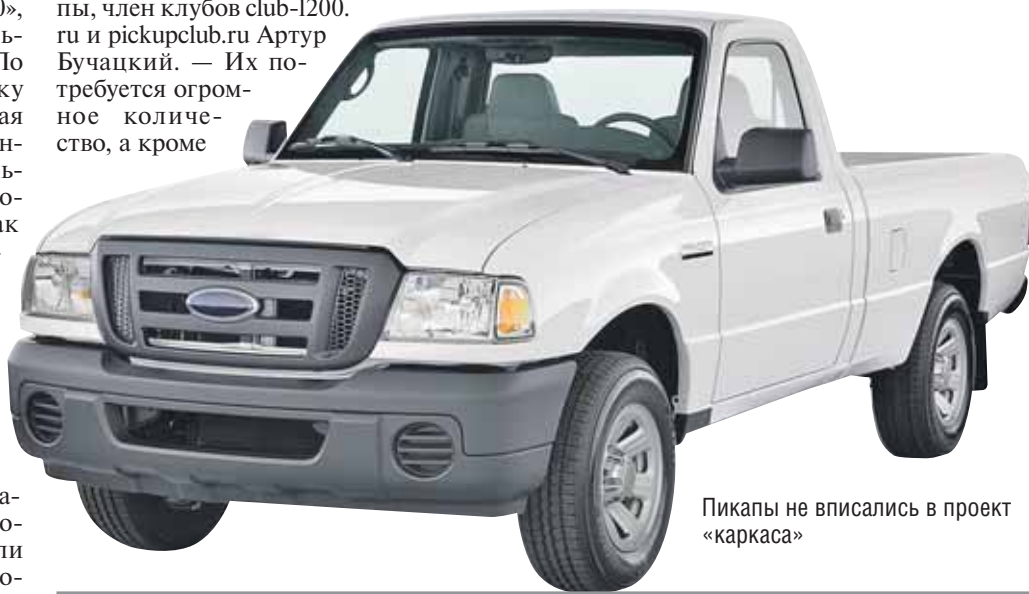
Пикапы не вписались в проект «каркаса»