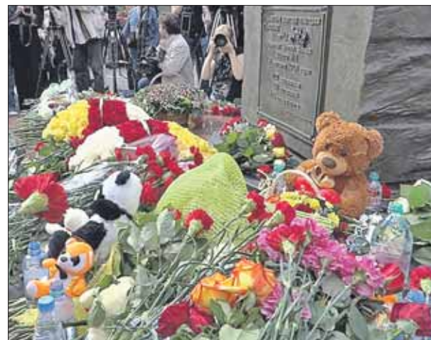
В Беслане 1 сентября — День скорби

Что террористы, захватив школу, согнали более тысячи учеников в спортзал, потом заминировали его. Голодные и испуганные дети сидели почти трое суток под дулами автоматов. На третьи сутки террористы взорвали спортзал, а спецподразделения начали спасательную операцию. Жертвами террористов оказались 334