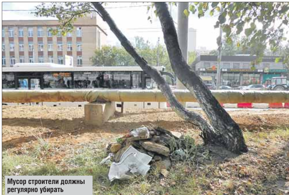
Мусор строители должны регулярно убирать

Побывав на месте, корреспондент «ВО» убедился, что читательница вовсе не преувеличивает. Тротуар как таковой вдоль Щёлковского шоссе на всём протяжении от метро «Щёлковская» до остановки «11-я Парковая» (нечётная сторона) отсутствует. Конечно, это обычные издержки реконструкции, но идти-то людям как-то надо. А пройти местами непросто. Ближе к остановке, вдоль упомянутого дома 79, пешеходы идут по проезду, проходящему параллельно шоссе, здесь ещё терпимо. Поток людей приличный. И действительно, многие бросают мусор прямо на газон, больше некуда. Газон равномерно покрыт бутылками, пакетами, есть и строительный мусор — груды старого асфальта. Местами всё это собрано в кучи, да так и лежит вдоль дороги.