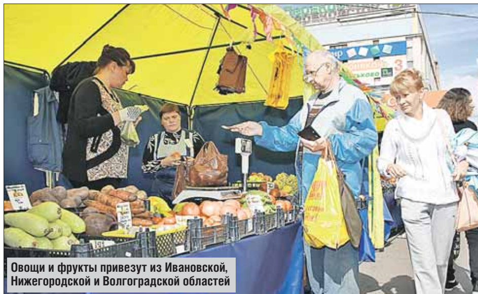
Овощи и фрукты привезут из Ивановской, Нижегородской и Волгоградской областей

Измайловском ш., 69, торгуют продуктами из Волгоградской области. В Новокосине на Новокосинской ул., вл. 31/4,