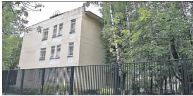
Измайловская больница весной стала филиалом Морозовской детской больницы

Как сообщили в пресс-службе Департамента здравоохранения г. Москвы, филиал №2 Морозовской больницы — бывшая Измайловская детская городская клиниче-