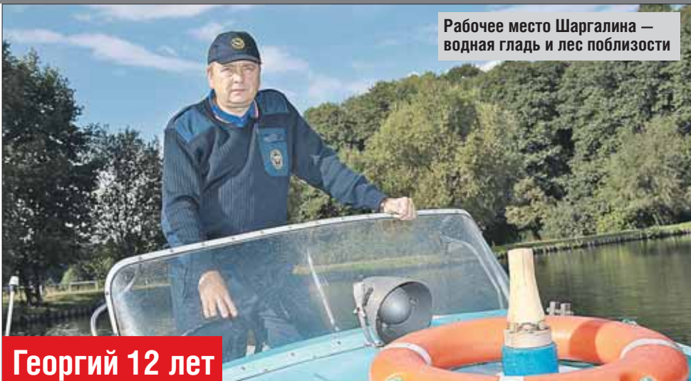
Рабочее место Шаргалина — водная гладь и лес поблизости

Кстати, помогают спасатели не только тем, кто тонет. Парк большой, травмы случаются разные. Кто-то с велосипеда