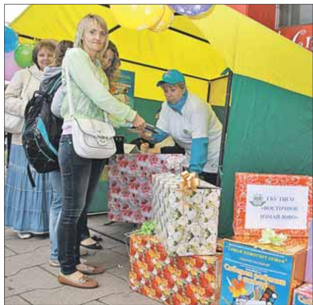
В акции приняли участие более 700 жителей округа