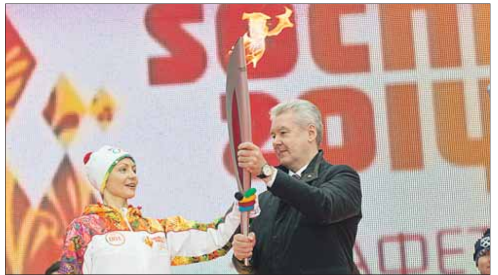
Старт эстафете олимпийского огня в Москве дал Сергей Собянин