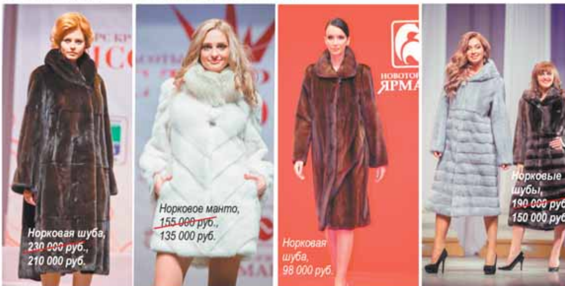
Норковая шуба, 230 000 руб., 210 000 руб.

Изготовление новоторжской норки — это целое искусство. Современные технологии потребуют не менее двух недель на пошив одного изделия! Для изготовления манто из 35 норок наборщик меха сортирует более 500 шкурок, прежде чем подберёт однородные по ворсу. Результат кропотливой работы — красивые норковые шубы по выгодной цене на Новоторжской ярмарке.