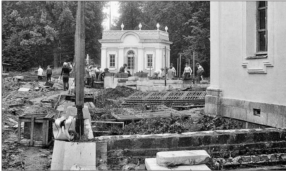
Кипит работа в Кускове. Снимок 1983 года

Н едavno в знаменитой шереметевской усадьбе на улице Юности прошла необычная акция. В воскресный день несколько десятков граждан весьма интеллигентного вида, лихо орудуя лопатами, до краёв наполнили контейнер строительным мусором, а затем, словно муравьи, таскали куски мрамора и белого камня. Некоторым помогали дети и внуки. Так ударным воскресником ветераны движения добровольных помощников реставраторов отметили свой юбилей.