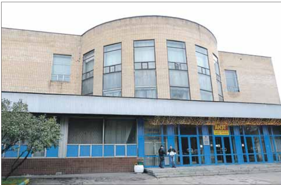
Здание не ремонтировалось около 30 лет

Н а сайте управы района Соколиная Гора в открытом доступе опубликованы «Материалы по обоснованию градостроительного плана земельного участка для строительства дворца водных видов спорта». Согласно этому документу на месте Московского олимпийского центра водного спорта (МОЦВС) на ул. Мироновской, вл. 27а, действительно должен появиться дворец водных видов спорта. Это будет четырёхэтажное Г-образное здание с подземной парковкой на 181 машино-место. Предусмотрены озеленение территории и приведение в порядок дорожек. Но предварительно необходим снос всех построек Олимпийского центра, за исключением двух исторических зданий.