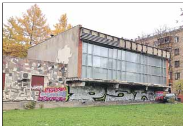
Самовольную постройку на Измайловском проспекте демонтируют