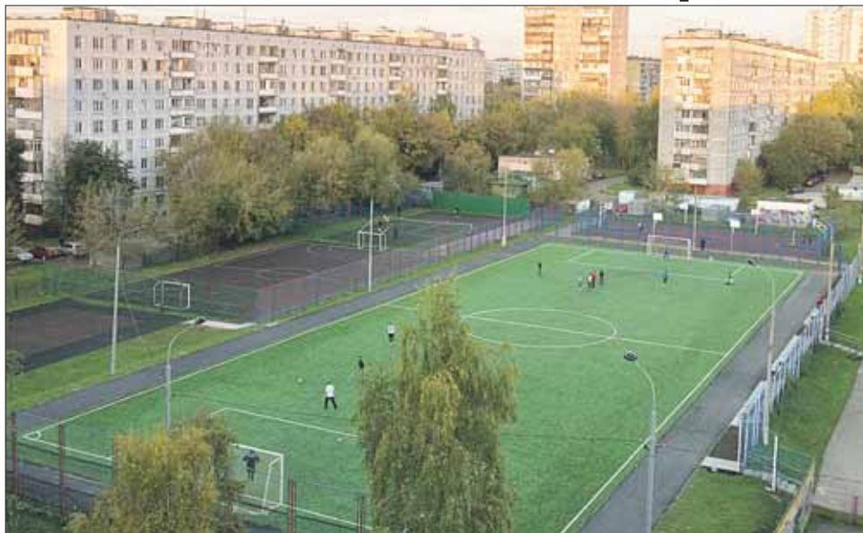
Подрядчики обещают, что на стадионе скоро появятся беговые дорожки