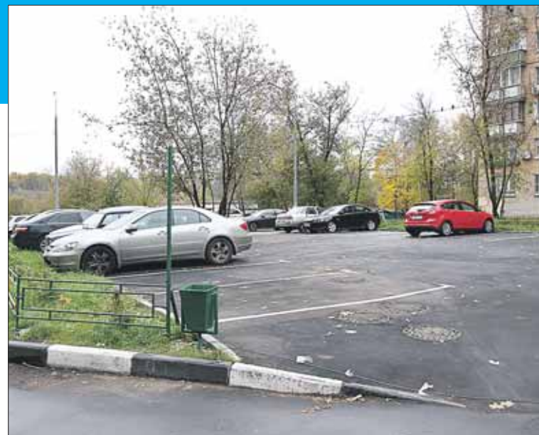
Теперь жители корпуса 2 борются за то, чтобы установить здесь шлагбаум

— И я буду просить депутатов повременить с согласованием установки шлагбаума до следующего года, пока мы не сделаем парковку у корпуса 3,