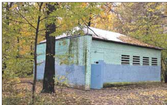
Торговля спайсами идёт здесь

Иду по Измайловскому проспекту. Ба! Да тут везде