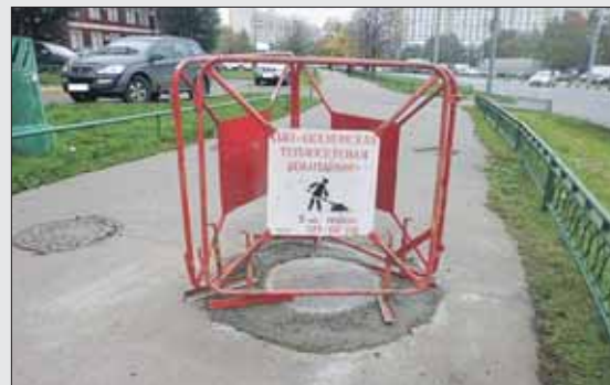
Люк на Вешняковской, 9, корпус 2, поднят

С начала октября на портал поступило более 600 обращений жителей ВАО, в том числе 40 сообщений о ямах на проезжей части. 15 раз пожаловались жители района Вешняки, 7 — из Сокольников. Активный житель района Вешняки С.Маркелов отправил на портал 7 сообщений о разнообразных ямах. Он сообщил, что провалился люк у дома 9, корп. 2, и у дома 5,