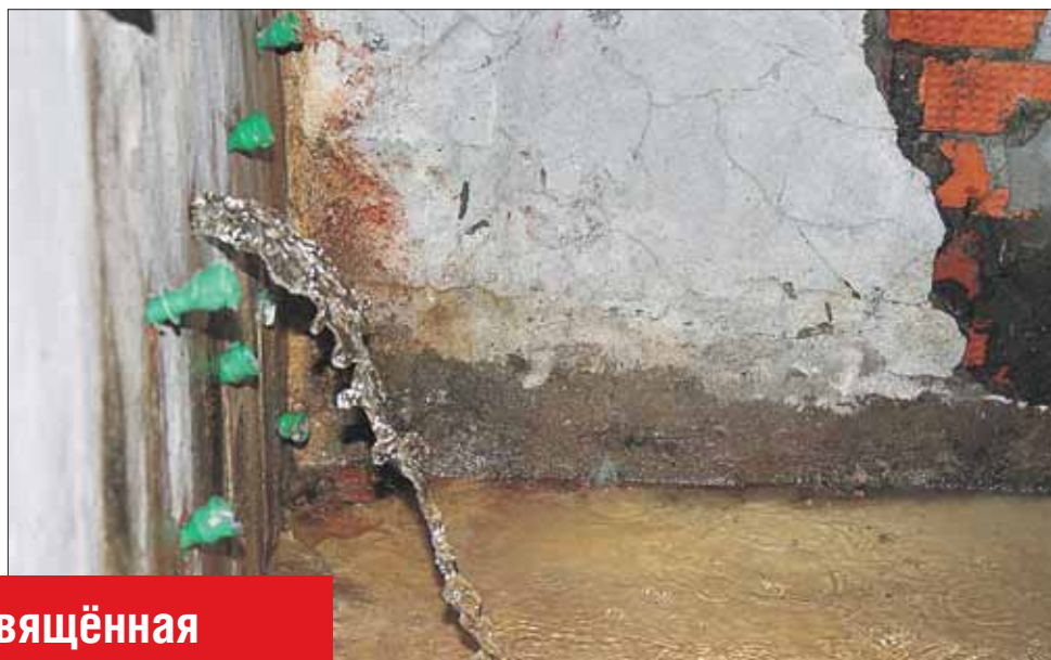
Из подземного гаража воду приходится постоянно откачивать

Экспертиза, посвящённая этому вопросу, занимает 150 листов судебного дела