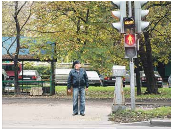
Этот светофор оборудуют кнопкой для пешеходов

В «ВО» №30 адрес «ул. Молдагуловой, 30» был указан в списке адресов регулируемых переходов, которые хотят оборудовать вызывной кнопкой для пешеходов. То есть таких, где пешеходные светофоры уже есть. Соответственно, речь идёт о том переходе, который ближе к дому 32. Как пояснили в ГИБДД, сроки оборудования конкретных светофоров вызывными кнопками зависят от темпов выделения средств. Другой переход оборудовать пешеходным светофо-