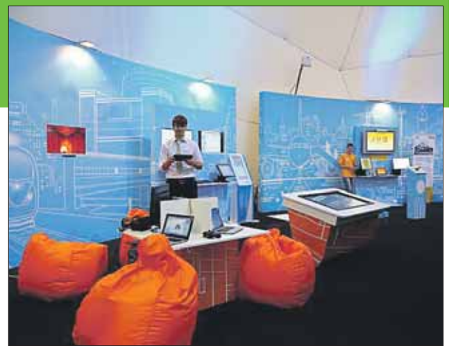
Разобраться в новинках техники вам помогут консультанты

Люди почтенного возраста тоже найдут на выставке много полезного для себя: смогут проработать давление через iPad, отдохнуть в кислородном