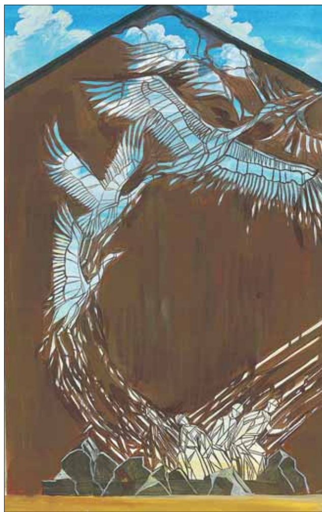
Эскиз будущего граффити на тему Великой Отечественной войны