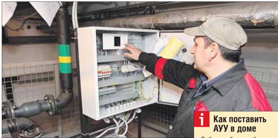
Умная система сама регулирует подачу тепла

— Как только на улице теплеет, хотя бы на градус, клапан, регулирующий подачу теплоносителя в трубы отопления, прикрывается, расход теплоносителя становится меньше, — объясняет начальник отдела эксплуатации компании «Спец-