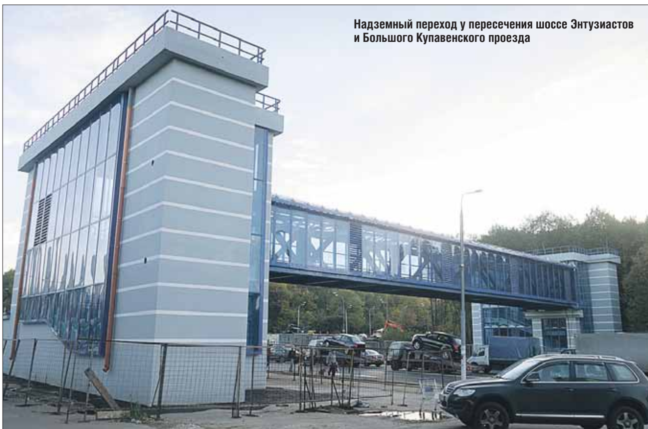
Надземный переход у пересечения шоссе Энтузиастов и Большого Купавенского проезда