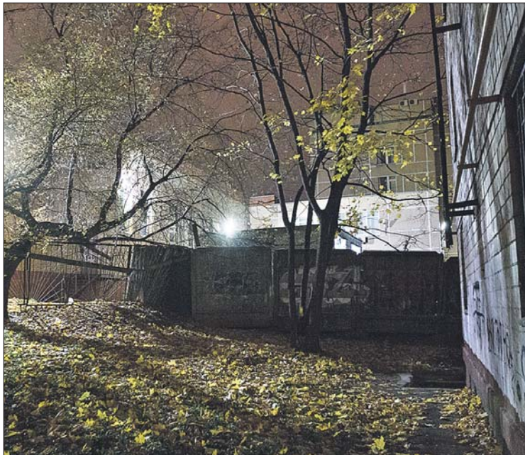
Светлым головам свет нужен и ночью

С уважением, жители улицы Н.Первомайской, район Измайлово