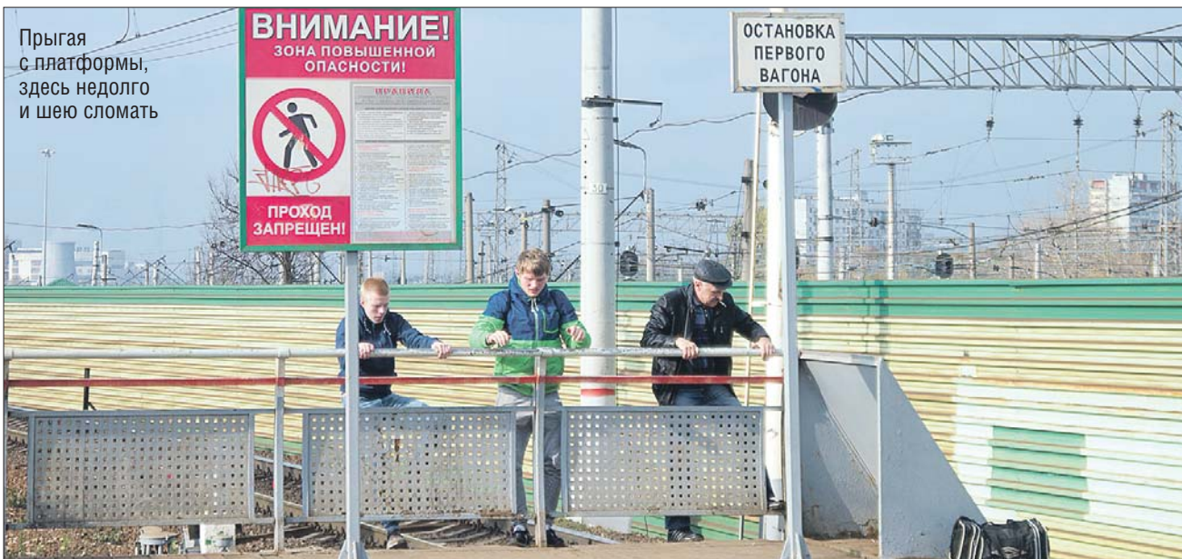
«Заячья тропа» не зарастает