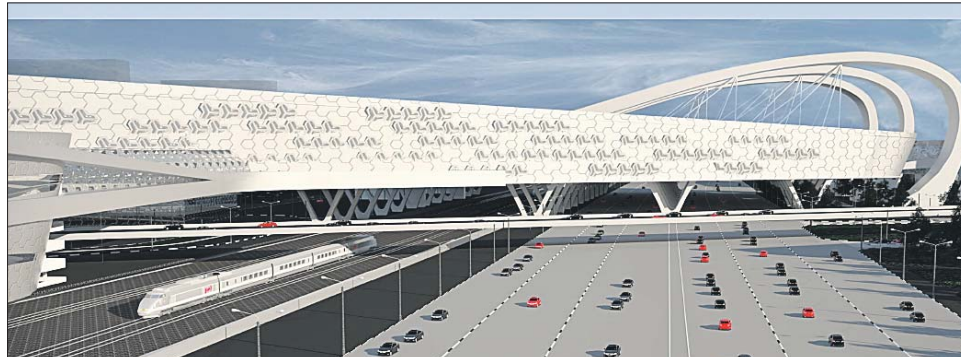
Один из дизайн-проектов ТПУ «Выхино»

тотранспорт, электричка и 121 маршрут общественного транспорта).