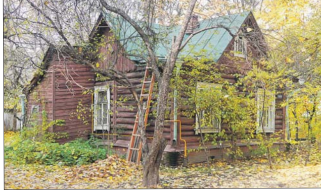
На даче Алексей Дикий выращивал яблоки