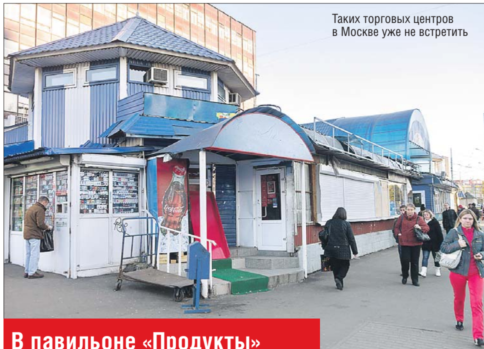
Таких торговых центров в Москве уже не встретить

Пытаюсь проникнуть внутрь постройки, на которой написано «Белорусские колбасы». Дёргаю дверь — закрыто. Вглядываюсь — внутри тот же «пейзаж»: обломки витрин, свисающие провода. После долгих поисков нахожу открытую дверь. Внутри нет света, при входе стоит одинокий ларёк. На полках