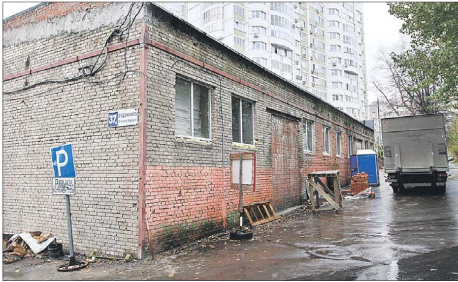
Шум отсюда мешает жителям отдыхать

Жильцы дома 37, корп. 2, на проспекте Будённого