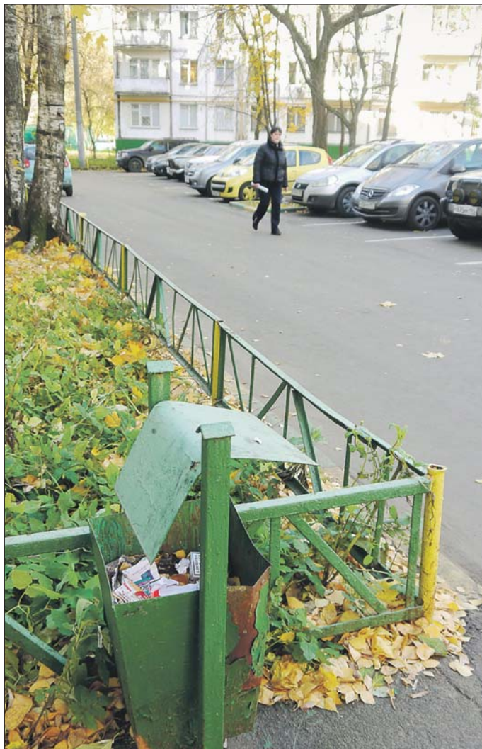
Урна на 2-й Пугачёвской, у дома 6, корпус 1, почти переполнена

Что касается урн на улицах и остановках, правила предписывают ставить их через каждые 50 метров. Причём на остановках — минимум по две. Такие бачки находятся на балансе ГКУ «Дирекция ЖКХиБ ВАО». Требова-