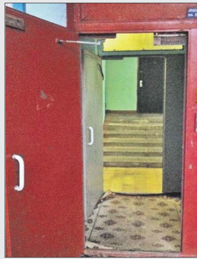
После обращения жителя полы на 1-м этаже дома 32 на улице Алтайской вымыли

Активнее остальных на плохую уборку в подъездах жаловались жители Гольянова. Так, 5 жалоб в течение одного дня отправил активный житель Н.Н.Колтун на свой подъезд на Алтайской, 32. «В подъезде отвратительный запах от крыс и помёта, всюду воняет тухлятиной. Исправьте ситуацию!», «Кнопка вызова лифта на 1-м этаже грязная, «Расклеены объявления, никто их не отмывает и не отдирает. На некоторых этажах два-три объявления удалили, а остальные так и остались висеть».