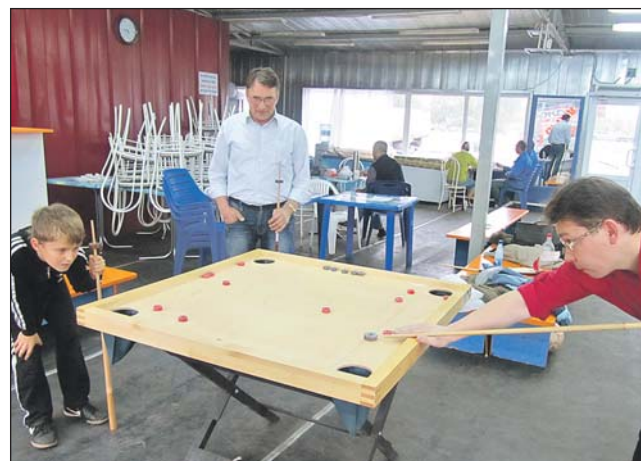
Эстонский бильярд немного помедленнее, чем обычный

Познакомиться с необычной игрой новус можно в центре культуры и спорта «Южное Измайлово», филиал на ш. Энтузиастов, 98, корп. 6. Там 25 октября в 18.00 пройдёт соревнование. Новус ещё называют эстонским или морским бильярдом. И действительно, правила новуса сходны с бильярдными: стол (правда, меньше, чем бильярдный, примерно 1х1 м), лузы, кий. Только вместо шаров — шайбы.