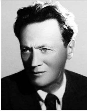
Актёр в трёх фильмах сыграл Сталина

— Когда был построен дом Диковых (Дикий — это псевдоним), точно не из-