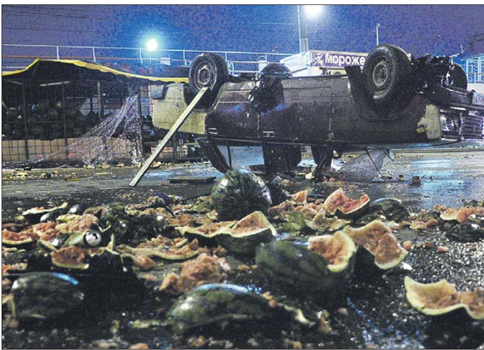
13 октября, вечер. Последствия беспорядков

Изначально акция в Западном Бирюлёве планировалась как мирный сход. В воскресенье днём несколько сотен человек собрались у ТЦ «Бирюза» с единственным требованием к властям — быстрее раскрыть убий-