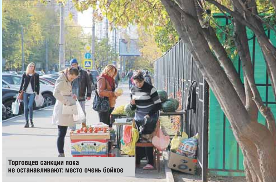
Торговцев санкции пока не останавливают: место очень бойкое

— Явление это сезонное, — пояснил начальник по-