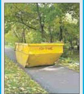
Для бункера нашли не самое удачное место

На Камчатской, 19, бункером перекрыли тротуар