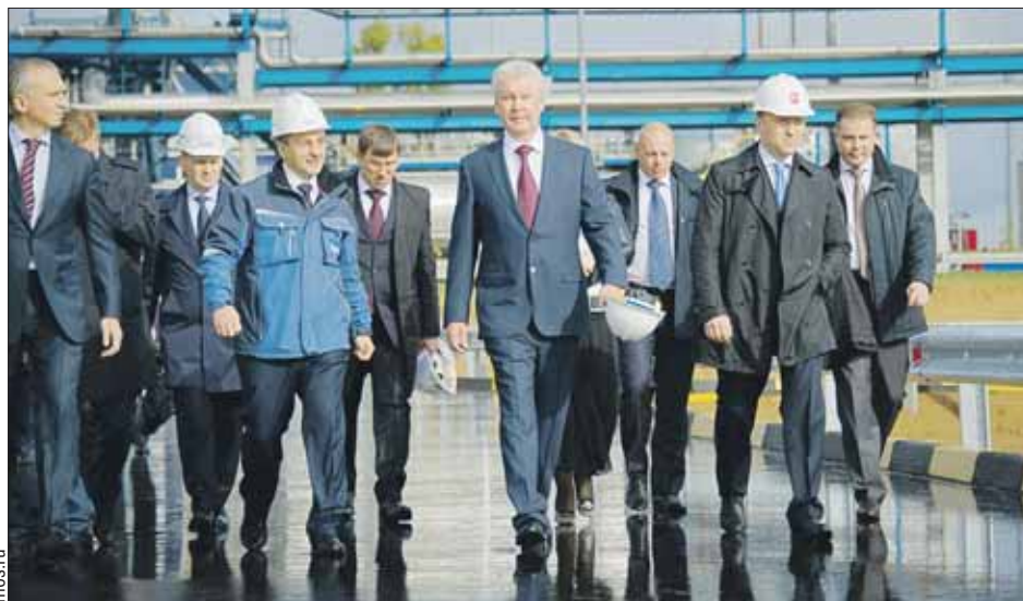
Модернизацию Московского НПЗ Сергей Собянин назвал экологической революцией

Сегодня завершена реконструкция очистных сооружений и механических отстойников, именно они и служили источником неприятного запаха. В 2013-м была реконструирована битумная установка. Ведутся строительство и реконструкция установок по производству серы, очищаются