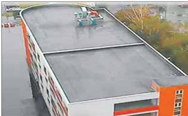
В этом году введён в строй паркинг на 13-й Парковой, вл. 28, на 663 места

Сейчас в округе насчитывается более 365 тысяч машино-мест. Большая часть (74%) расположена во дворах. На вто-