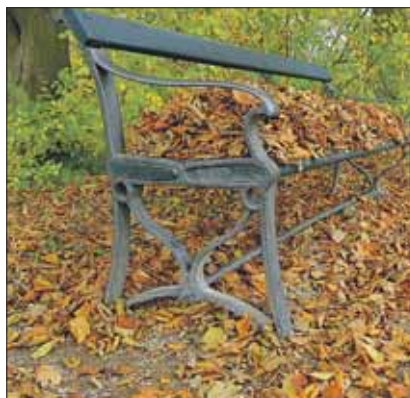
По регламенту опавшую листву должны убирать ежедневно