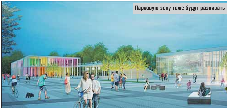
Парковую зону тоже будут развивать