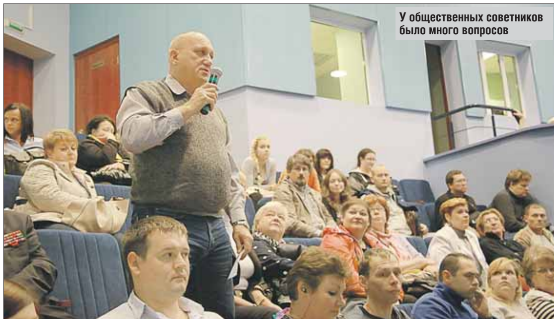
У общественных советников было много вопросов

— Для жителей нашего округа подготовят почти 400 дворовых и школьных спортивных площадок. Из них 180 будут приспособлены для игры в зимний футбол. Также появятся ледяные горки и снеж-