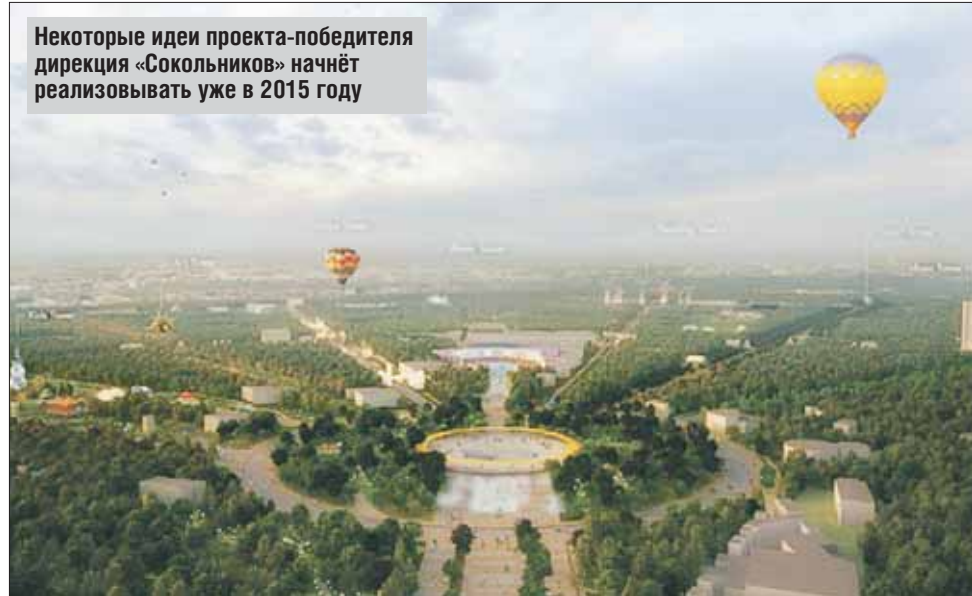
Некоторые идеи проекта-победителя дирекция «Сокольников» начнёт реализовывать уже в 2015 году

АДРЕС В СЕТИ www.museikino.ru , тел.: (495) 963-0332, (495) 963-0320