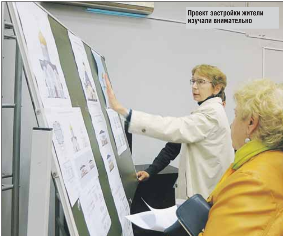
Проект застройки жители изучали внимательно

На собрание в школу №734 на Сиреневом бул., 58а, пришло около 150 человек, многим пришлось стоять. Большинство выступивших жителей поддержали строительство храма: «В Восточном Измайлове на весь район всего один храм! В праздники и по воскресеньям там яблоку негде упасть. Особенно тяжело приходится родителям с детьми», «У меня двое детей. Сейчас как никогда важно воспитывать их в любви к Родине, к своей культуре». Прозвучала