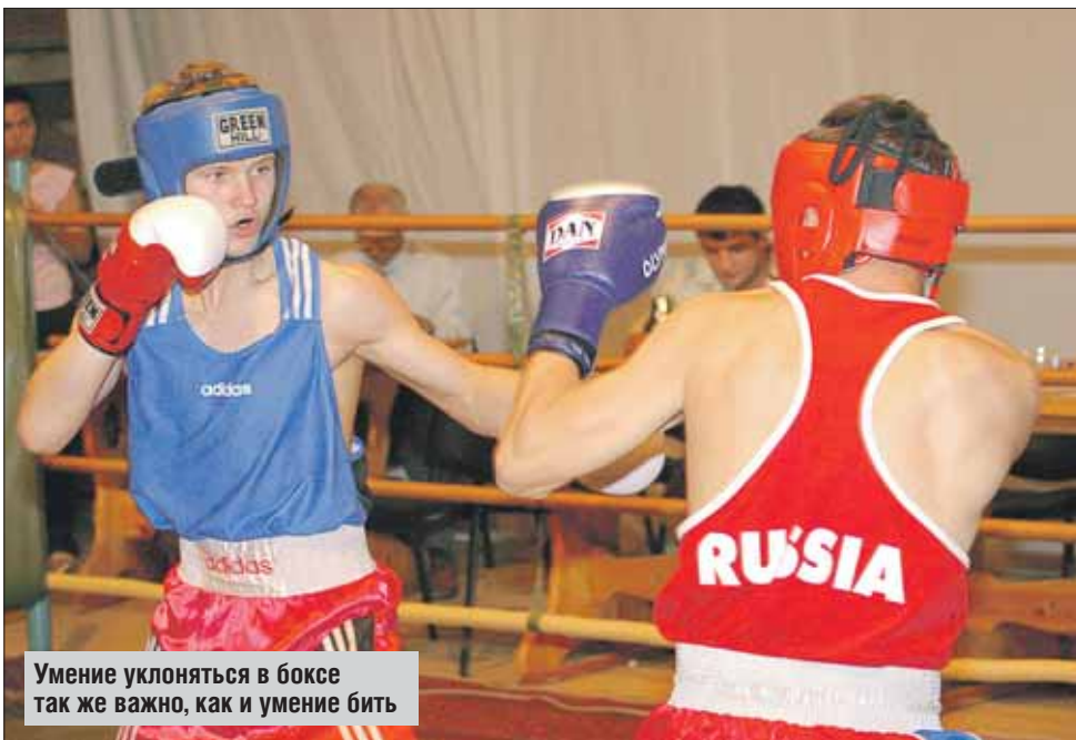
Умение уклоняться в боксе так же важно, как и умение бить