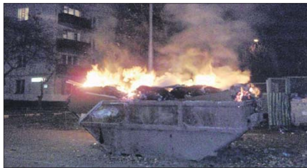
То ли мусора стало больше, то ли пироманов...

Я прошёлся по адресам той самой, специальной фотосессии. Где-то мусор уже успели вывезти, однако в большинстве случаев