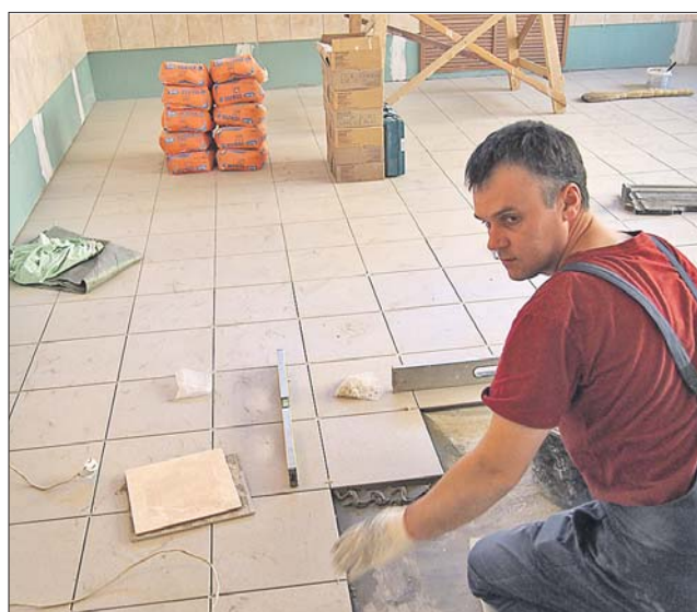
Ремонт в ГКБ №14 планируют закончить к новому году

Основной фронт ремонтных работ — в корпусе 9, здесь расположены отделения неврологии и нейрореанимации. Здание не ремонтировалось с 70-х годов прошлого века и сильно обветшало. Департамент здравоохранения г. Москвы включил здание в план текущих ремонтных работ. Сейчас здесь меняют полы, двери, окна, красят сте-