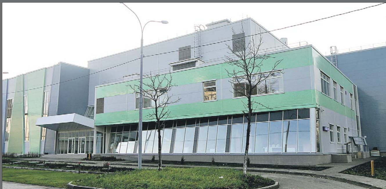
Площадь ФОКа на Ткацкой — 4,1 тыс. кв. метров

Но запись в секции начнётся в начале 2014 года