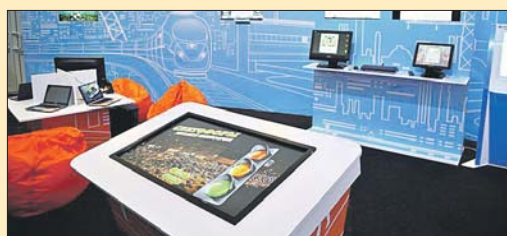
На этой выставке можно ещё и заработать

В ноябре по субботам (9, 16, 23 и 30) на интерактивной выставке «Электронная Москва» (Фестивальная площадь парка «Сокольники») будут проходить соревнования для дошкольников и ребят начальных классов. Дети смогут блеснуть знаниями и выиграть призы. Соревнования проводятся в игровой форме. Участники поделят на команды, и они будут работать с интерактивными доска-