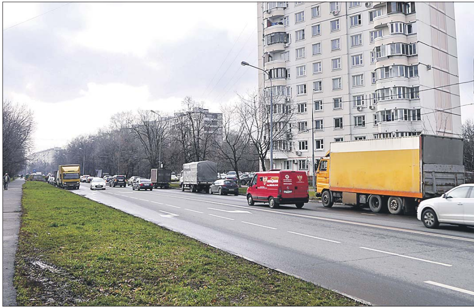
70 лет назад Вешняки стали центром целой системы подготовки советских снайперов