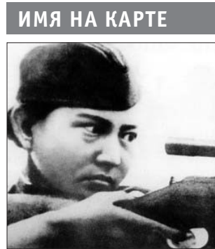
Имя на карте

Как в Вешняках появилась Снайперская улица