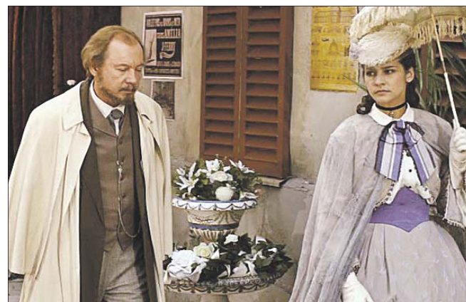
«Три женщины Достоевского»

Каждый раз во время беременности набираю лишние 20 килограммов