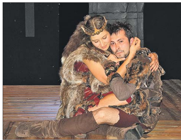
«Макбета» в Театре на Перовской играют молодые актёры