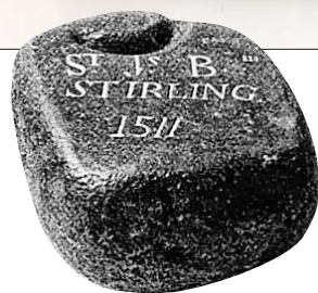
Камень для кёрлинга, датированный 1511 годом, с именем владельца