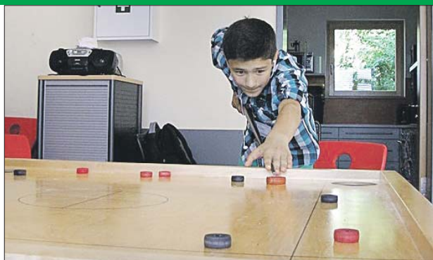
Новус — национальный вид спорта в Прибалтике

Новус имеет немало отличий от привычного нам бильярда. Здесь нет шаров, игроки должны попасть кием по битку (что-то наподобие крупной деревянной шашки), который в свою очередь бьёт по фишкам и загоняет их в лузы. Стол разделён на несколько зон, в том числе есть и так называемая чёрная зона, из которой выгнать фишку