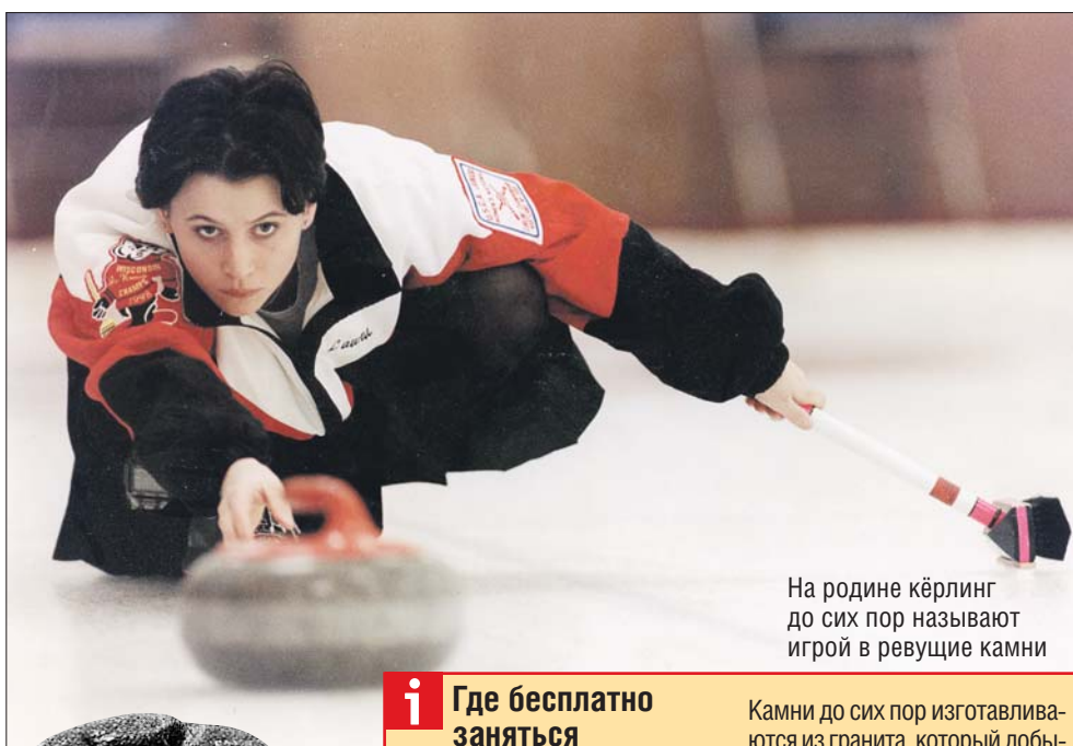
На родине кёрлинг до сих пор называют игрой в ревущие камни

Считается, что начинать играть в кёрлинг можно тогда, когда твой собственный вес минимум в два раза больше веса камня (а он весит 19,96 кг), — в 10-12 лет. Физические нагрузки здесь умеренные, достаточно просто держать себя в приличной для обычного человека форме. Скипы вообще играют в основном «головой». Так что и в 50, и в 60 лет можно играть в кёрлинг и даже выигрывать.