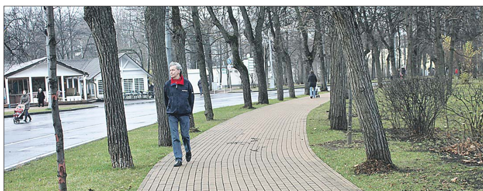
В Сокольниках чисто

— Сначала убирают места, где гуляет больше все-