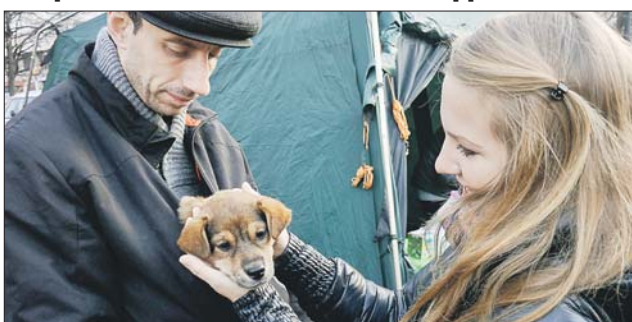
Все собаки привиты и ухожены — только бери

В субботу центральная аллея парка «Сокольники» превратилась в подиум для братьев наших меньших. Представлял животных муниципальный приют «Кожухово». Особой популярностью пользовался огромный метис Стив. Даже выстроилась очередь желающих сфотографироваться с ним.