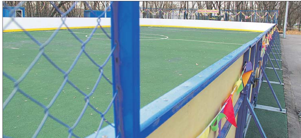
Пока на Кусковской, 47, спортплощадка, а скоро будет каток

То же самое сказали и в отделе благоустройства ГКУ «ИС района Новогиреево» про каток, расположенный на Кусковской ул., 47. На сегодня подготовительные работы закончены, инфраструктура в порядке, осталось только включить залив и холодильные установки. По идее, это планировали сделать 1 ноября, но погода в этом году «хулиганит».