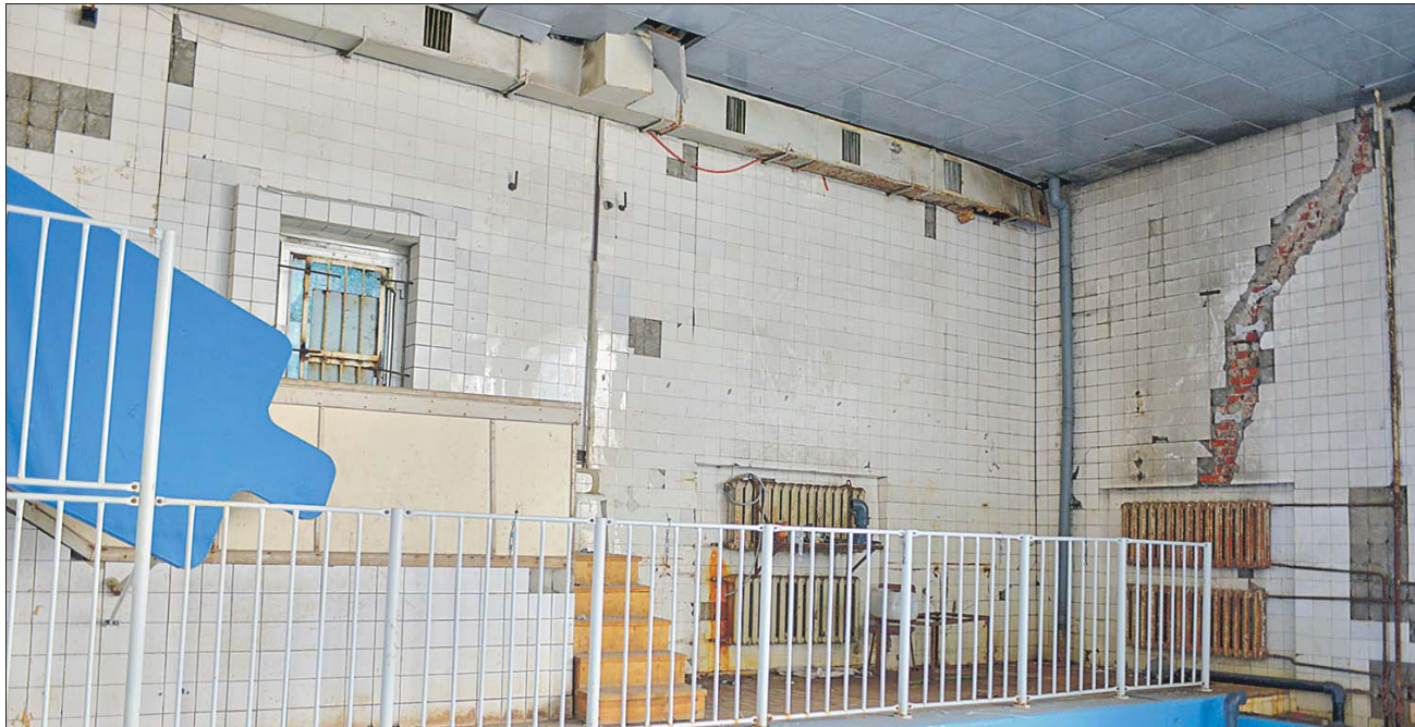
Стена «поползла», потому что солёная вода разъела конструкции бассейнов