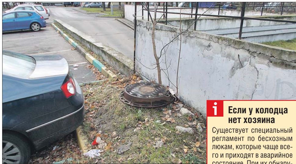
Найти хозяина люка часто становится неразрешимой проблемой

После печального инцидента ЖКУ «Салют» зава-