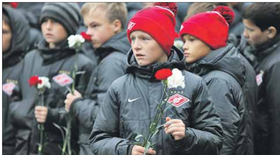
В церемонии прощания участвовали 15 тысяч человек