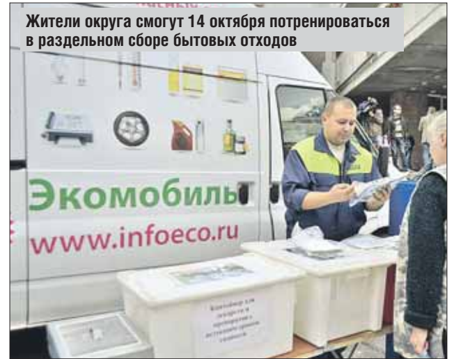
Жители округа смогут 14 октября потренироваться в раздельном сборе бытовых отходов

14 октября у жителей округа есть шанс грамотно расстаться с утилем