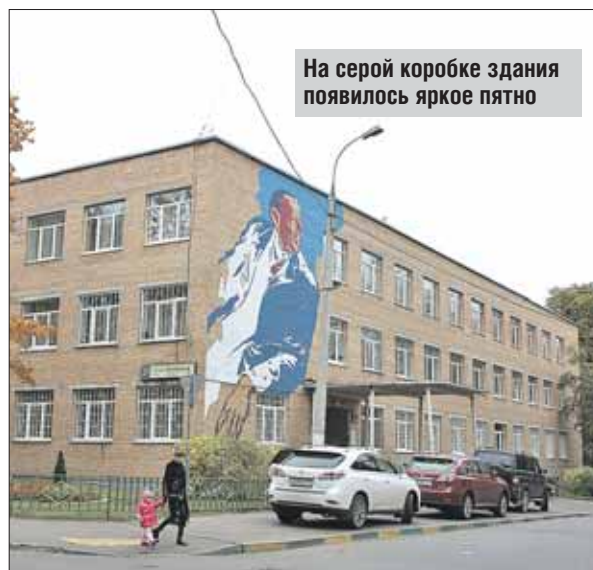
На серой коробке здания появилось яркое пятно