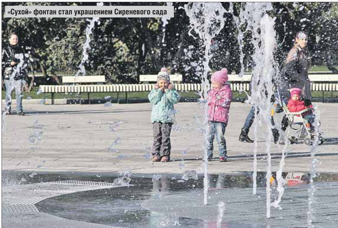
«Сухой» фонтан стал украшением Сиреневого сада