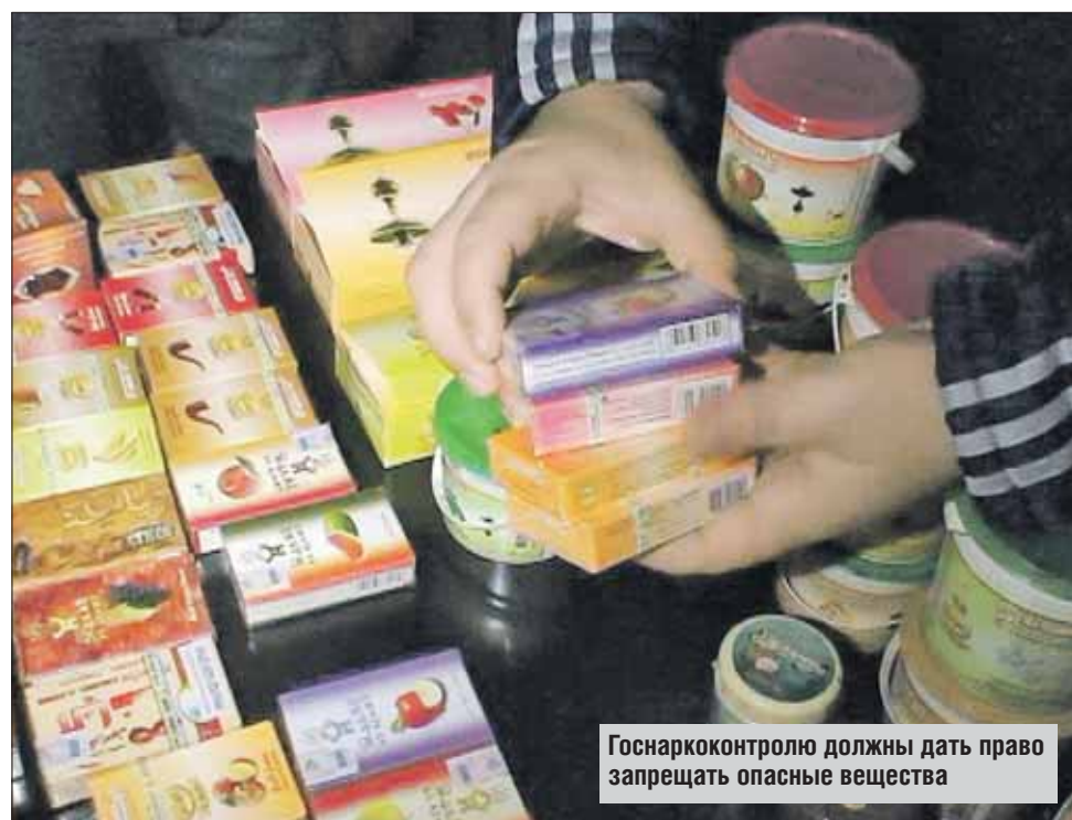
Госнарконтролю должны дать право запрещать опасные вещества

Всего более 200 уголовных дел возбуждены с начала года в отношении людей, которые хранили спайсы или торговали ими. В окружном УВД ситуацию с наркотиками отслеживает специальный отдел оперативно-разыскной части. Начальник от-