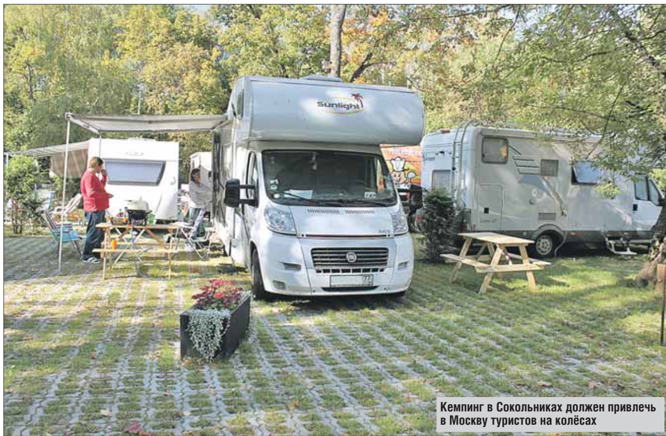
Кемпинг в Сокольниках должен привлечь в Москву туристов на колёсах