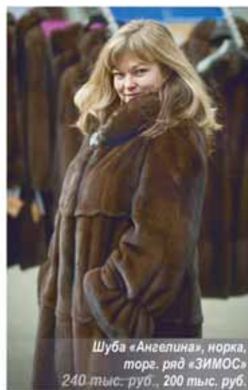
Шуба «Ангелина», норка, торг. ряд «ЗИМОС» 240 тыс. руб., 200 тыс. руб.

меры от 42 до 60. Цвета шуб разнообразны.