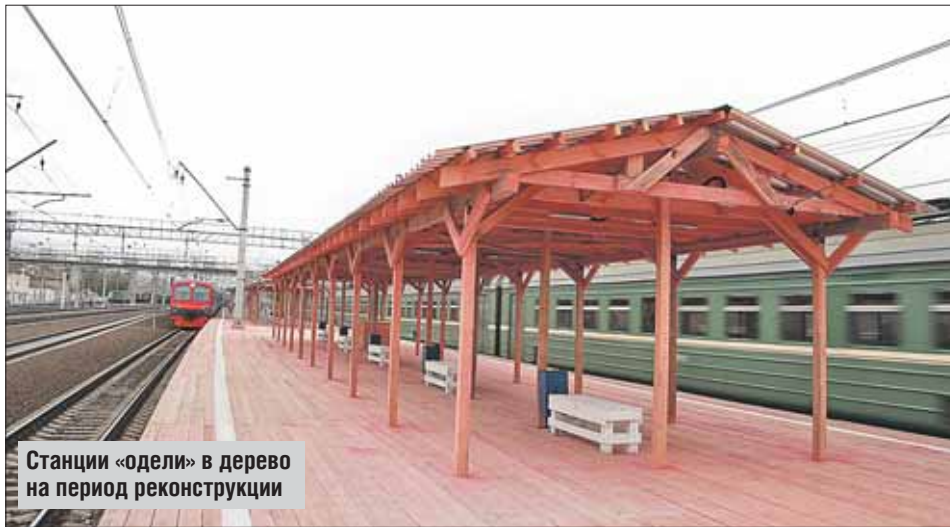
Станции «одели» в дерево на период реконструкции

Весной 2014 года «ВО» уже писал о работах по реконструкции и строительству объектов инфраструктуры на Горьковском направлении Московской железной дороги (МЖД). По информации Департамента строительства г. Москвы, запланированы строительство и реконструкция мостов, тоннелей, пешеходных переходов, 18 железнодорожных платформ, в том числе на станциях Кусково и Новогиреево.