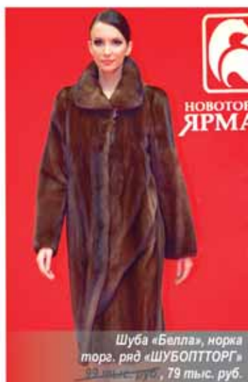
Шуба «Белла», норка, торг. ряд «ШУБОПТТОРГ» 79 тыс. руб.