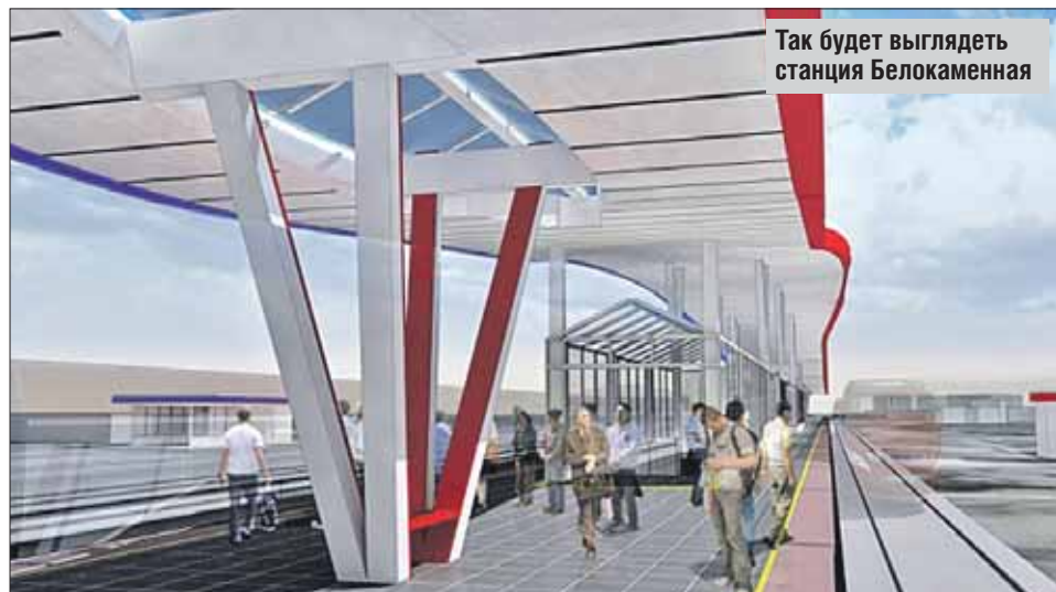
Так будет выглядеть станция Белокаменная

В ходе общественных обсуждений жители высказали два пожелания.