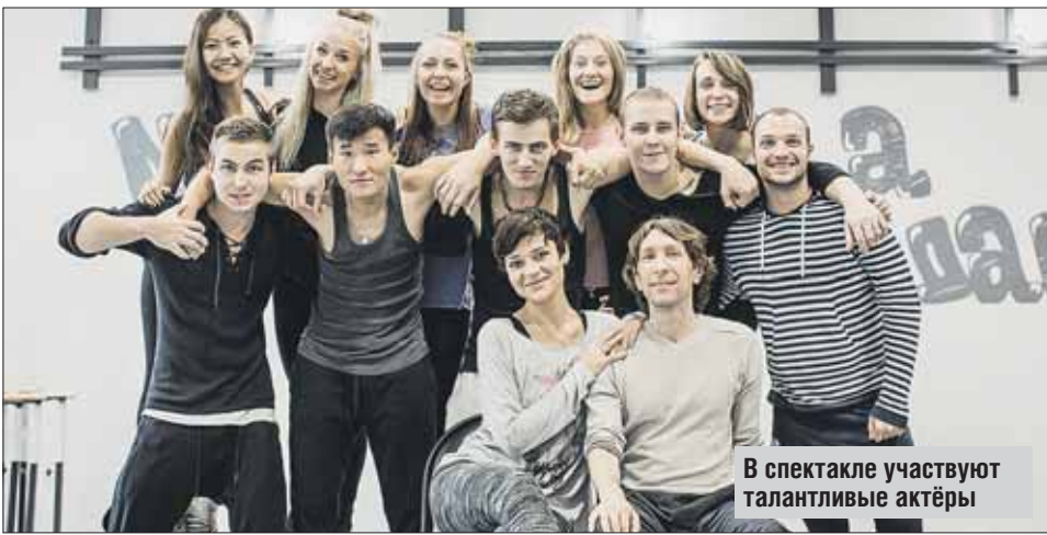
В спектакле участвуют талантливые актёры

становщиком выступил известный хореограф Константин Килин: ради репетиций он приехал в Измайлово из Италии, где живёт и работает уже 16 лет. В постановке использованы интересные театральные при-