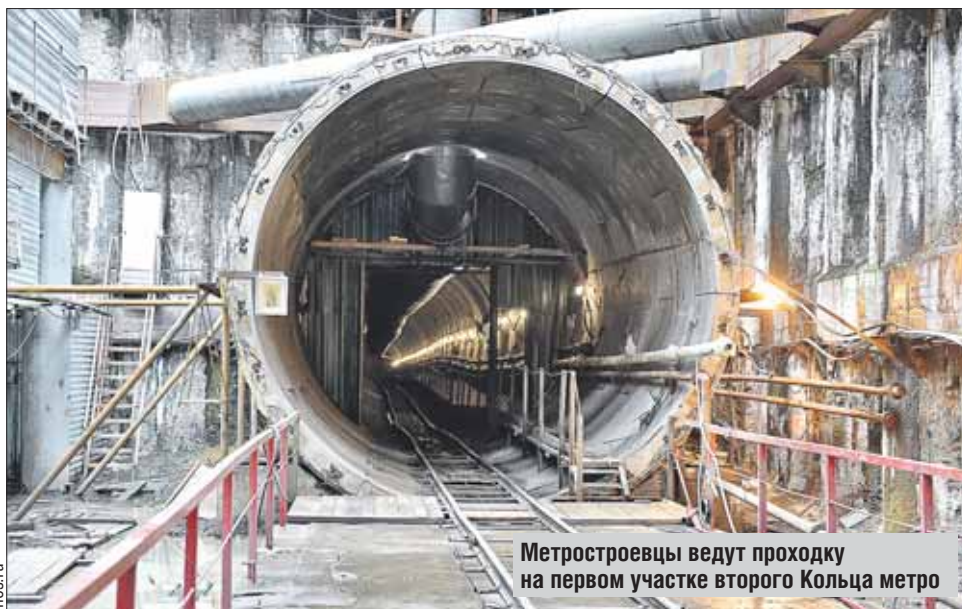
Метростроевцы ведут проходку на первом участке второго Кольца метро

— Мы приняли решение в следующем году прийти на все участки ТПК. Это обеспечит его ввод к 2019-2020 годам, — сказал мэр Москвы.