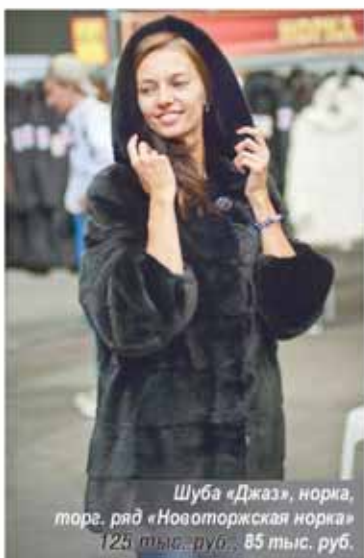
Шуба «Джаз», норка, торг. ряд «Новоторжская норка» 125 тыс. руб., 85 тыс. руб.

«Новоторжская норка» — собственный бренд Новоторжской ярмарки. Пошив этих изделий — целое искусство. На производство одной шубы требуется более двух недель кропотливой работы. Для этих изделий используется отборный мех с международных пушных аукционов. Это классические и модные норковые куртки, манто, длинные пальто для женщин. Они удобны и хорошо сидят. Представлены раз-