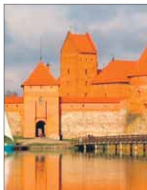
Эти замки сохранились со времён Ливонского ордена

Если нет желания уезжать так далеко, то в подмосковном лагере «Раду-