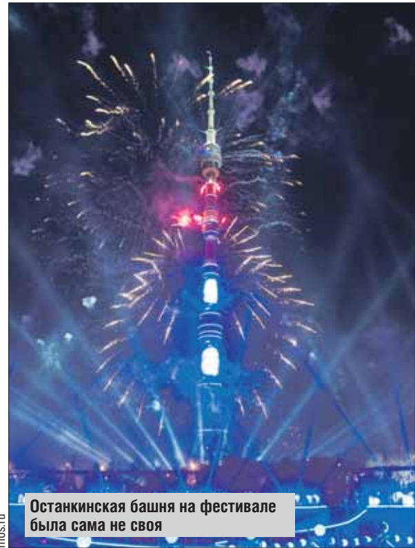
Останкинская башня на фестивале была сама не своя