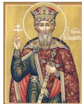
Первый киевский митрополит Михаил

Масштабы трудов владыки Михаила и его команды были необычайны. После массового крещения киев-