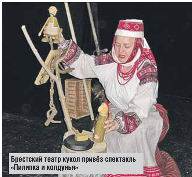
Брестский театр кукол привёз спектакль «Пилипка и колдунья»

Театр «ТриЛика» — московский гость фестиваля. А вот спектакль «Хрустальная сказка», который он представит на конкурсе, получился самый что ни на