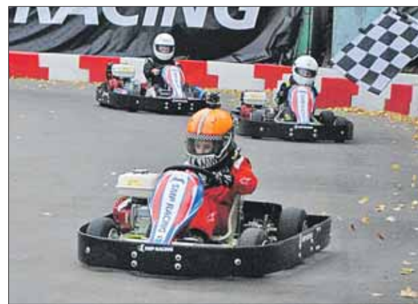
Отдавать на картинг можно ребёнка четырёх-пяти лет

Учебно-спортивный центр ДОСААФ «Перово»: ул. Новотётёрки, 1, usc-perovo.ru