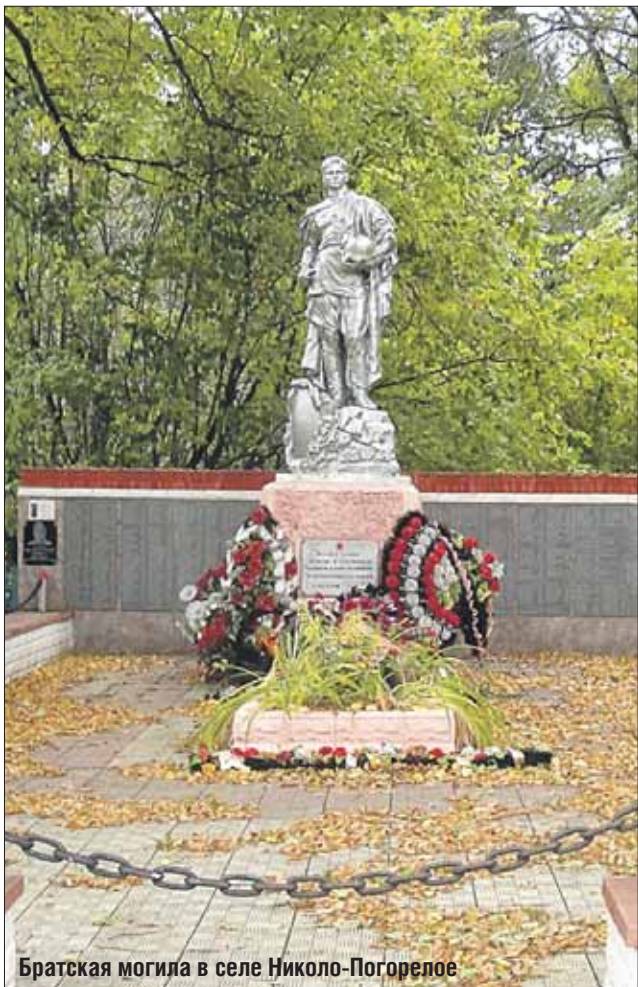
Братская могила в селе Николо-Погорелое

Залпы ружей проводили солдат в последний путь.