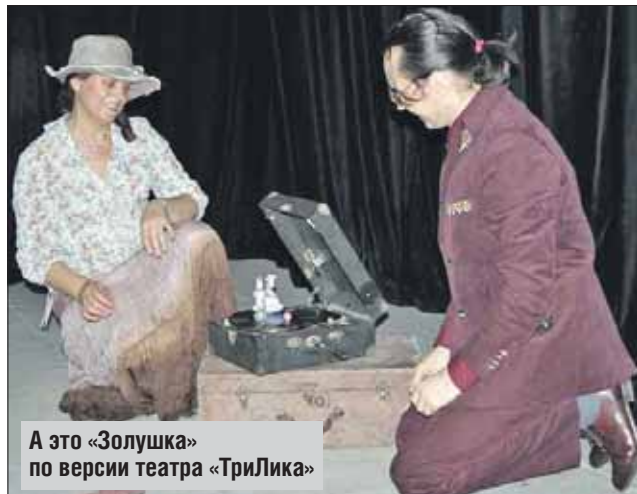
А это «Золушка» по версии театра «ТриЛика»

Спектакль финского театра неторопливый, как сами финны