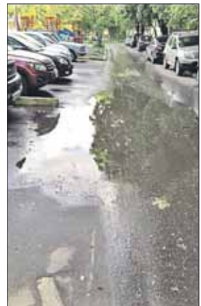
Житель сфотографировал лужу после дождя

В конце мая возмущённый такими ответами житель написал новую жалобу, где потребовал решать проблему, а не фотографировать сухой асфальт в солнечную погоду, и пригрозил обратиться непосредственно к мэру Москвы. После этого проблему сразу же