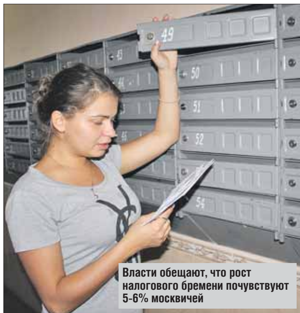
Власти обещают, что рост налогового бремени почувствуют 5-6% москвичей

Проект закона устанавливает следующие налоговые ставки в отношении жилых домов, квартир, других жилых помещений независимо от площади, а также хозяйственных построек площадью до 50 кв. метров: при кадастровой стоимости одного объекта до 10 миллионов рублей — 0,1%, от 10 до 20 миллионов рублей