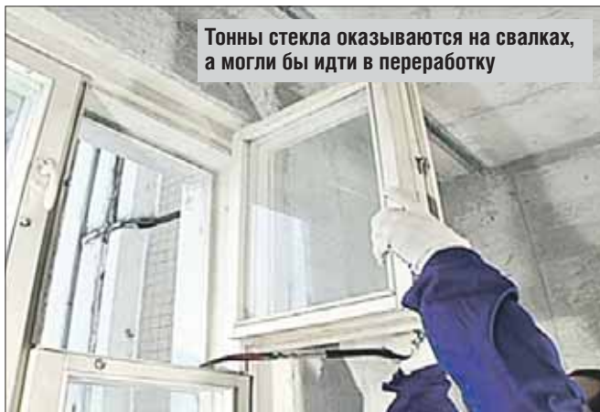
Тонны стекла оказываются на свалках, а могли бы идти в переработку

Большинство компаний по сбору вторсырья не берут старое стекло у жителей по той причине, что его некуда везти.