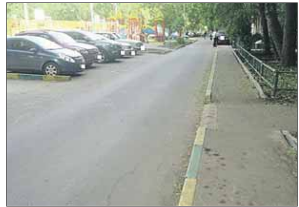
Управа отчиталась снимком в ясную солнечную погоду