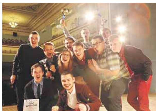
В этом году на Кубке — два победителя

В этом году он прошёл в двойном формате. Разыгрывались сразу два приза: среди «старичков» — Большой кубок и среди дебютантов — Малый кубок. В борьбе приняли участие 22 команды, а темой конкурса стала любовь к Москве. Жюри состояло из опытных кавээнщиков высшей и премьер-лиги. Самое сильное впечатление на них произвела команда EXpresso из колледжа автоматизации и информационных технологий №20, которая и забрала Большой кубок. А Малый