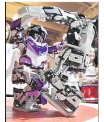
Прасковья — в «нарядном платье»

На проведённых впервые в столице Московских инженерно-спортивных соревнованиях студенты Машиностроительного университета (МАМИ) запрограммировали робота-андроида, который в итоге оказался лучшим. Точнее, лучшей. Дело в том, что робота звали Прасковьей. Она виртуозно двигалась в танце, крепко держалась на ногах, вставала на голову и на ринге билась, как заправский боец.