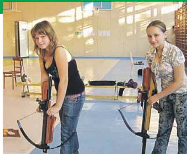
Главное — поднять арбалет, дальше — проще

АДРЕС: ул. 2-я Пугачёвская, 7. Контактный телефон (499) 161-9239