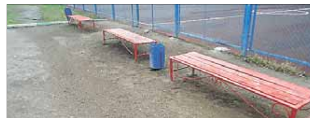
Спортплощадка на улице Сталеваров, 26, корпус 2: краску стёрли, ограду починили

Получен официальный ответ управы района Ивановское, что спортивная площадка приве-