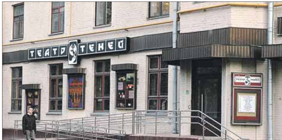
Театр будут ремонтировать около года

В театре надеются, что ремонт будет завершён к концу следующего года,