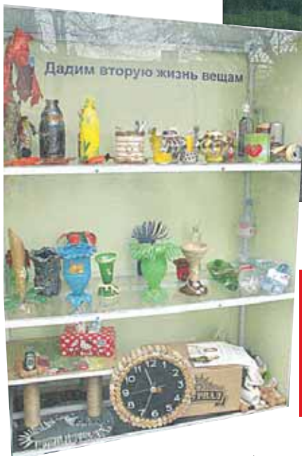
Эти вещи сделаны из отходов

— А ведь управляющие компании вполне могли бы зарабатывать на вывозе отсортированного мусора. Мы подсчитали: доходы таких предприятий сравнимы с расходами, а иногда даже превышают их. Если наладить отдельный сбор и вывоз