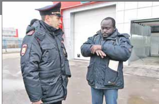
У ганийца из документов — просроченная справка об утере паспорта

— Что надо знать, чтобы быть хорошим участ-