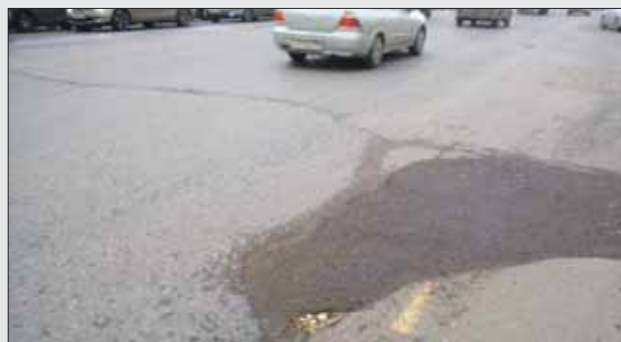
Яму на шоссе Энтузиастов залатали

15 жалоб на ямы на проезжей части поступило с начала ноября из района Перово. Из них восемь жалоб на проевшие люки, мешающие как пешеходам, так и безопасному проезду машин. Остальные — на провалы и выбоины в асфальте. Самое эмоциональное обращение пришло 11 ноября жительница района Перово О.Н.: «В миллионный раз пишу жалобу и продолжу писать, пока вы не отреагируете на неё. Ямы на проезжей части на шоссе Энтузиастов в область —