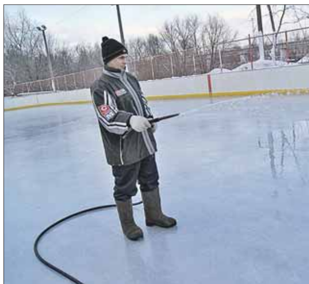
За эту воду жители платить не будут

При этом в префектуре особо подчёркивают: если каток заливают с использованием общедомовых коммуникаций, жи-