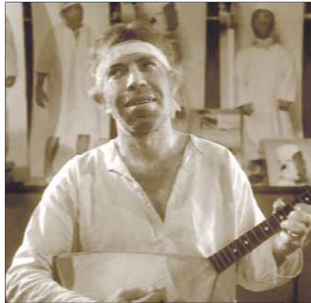
Кадр из фильма «Собачье сердце». Режиссёр В.Бортко

М ихаил Афанасьевич Булгаков очень любил Сокольники, Измайлово, Преображенское... Вторая жена писателя Любовь Евгеньевна Белозёрская в своей книге «О, мёд воспоминаний!» пишет: «Этой зимой мы ходили на лыжах с Художественным театром на горы близ деревни Гладышево и в Сокольники. Там была закусочная, где мы делали привал. На стене красовалась надпись: «Неприличными словами не выражаца». (Эту фразу писатель после подарил своему Шарикову. — Авт. ) Мы и не выражались. Мы просто с удовольствием уничтожали яичницу-глазунью с колбасой, запивая её пивом. Шутили: «Может, и в раю так будет...»