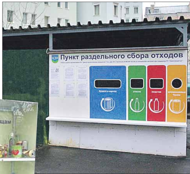
Контейнеры для сбора мусора в Замоскворечье. Нечто подобное предлагают внедрить в Кожухове

Примеры уже есть. ООО «Экоминус», работающее в Замоскворечье, вполне успешно и держится на плаву. Его пункты раздельного сбора мусора разительно отличаются от привычных площадок с громыхающими мусорными контейнерами. Это панель с разноцветными отсеками. На каждом отсеке словом и картинкой обозначен вид отходов. Например, на зелёном отсеке — надпись «Стекло» и рисунок бутылки, на оранжевом — надпись