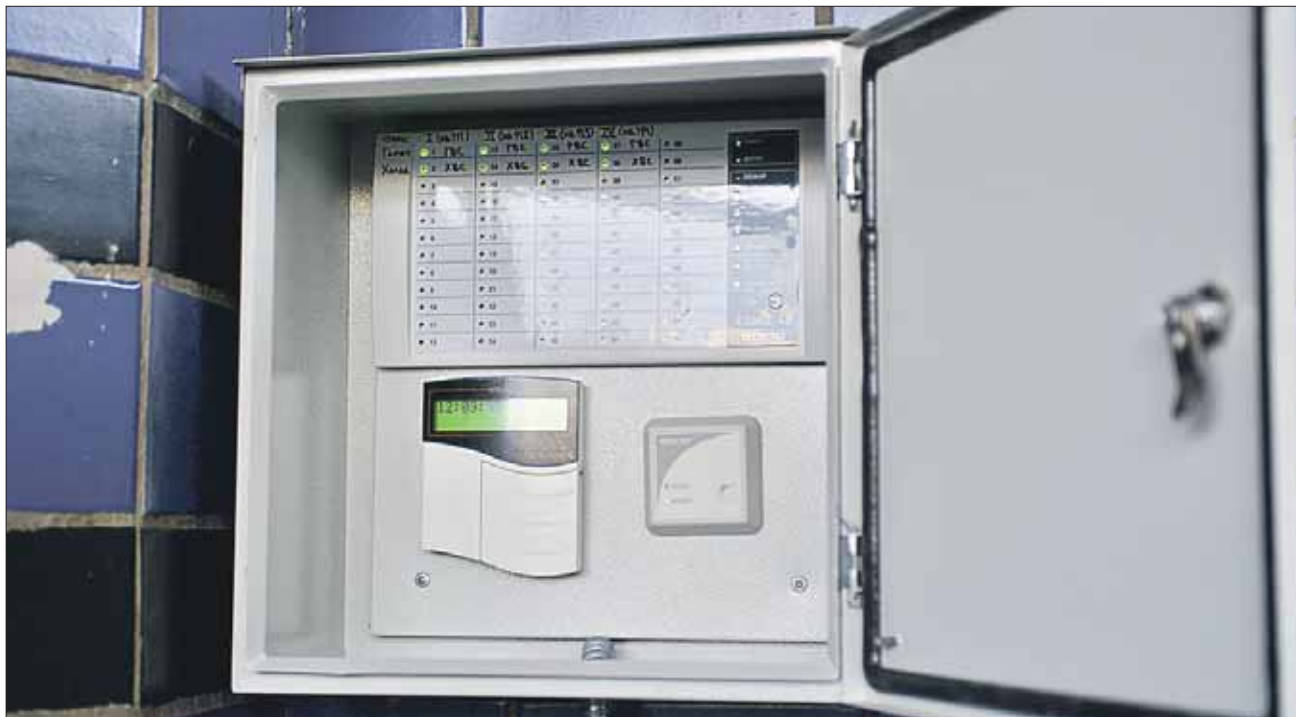
Обслуживание системы стоит 3 тысячи рублей в месяц

Доступ к магнитным ключам имеют в ТСЖ три человека