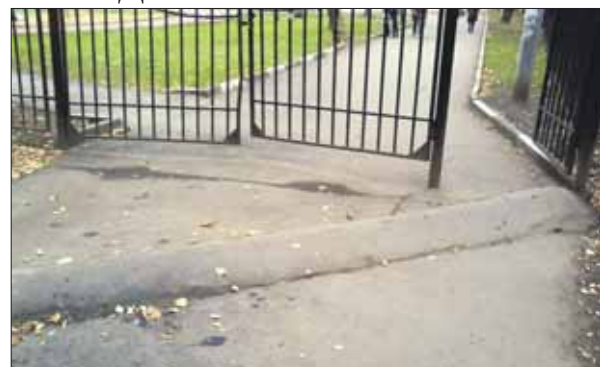
Пока от подтопления школьный двор защищает вот такой асфальтовый бугор

При входе на территорию школы №375 на Щёлковском шоссе расположена искусственная неровность из асфальта. Из-за неё сложно заходить на школьный двор с детскими колясками. А когда идёт дождь, то лужа стоит от жилого дома до данного места. Зимой же всё это замерзает, люди падают. Зачем нужен «лежачий полицейский», если из-за него такие проблемы?