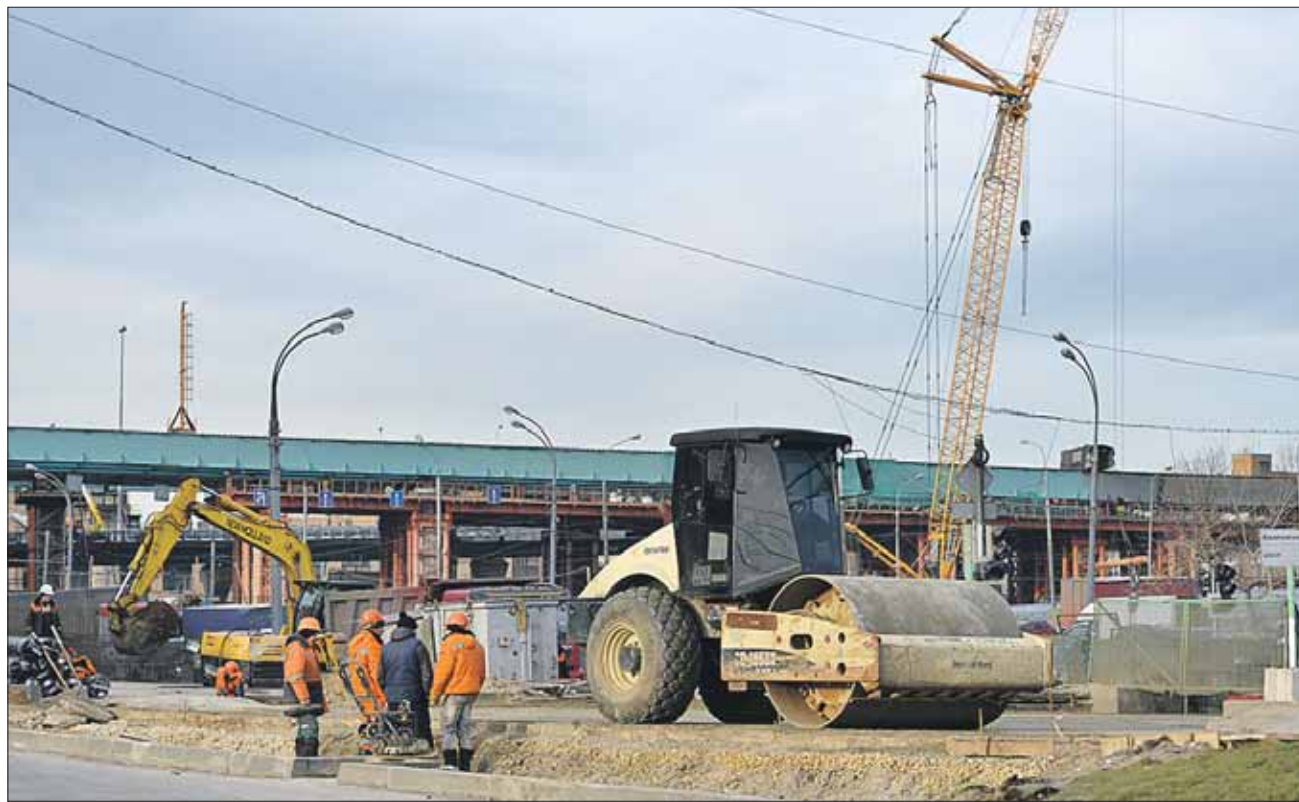
Проект реконструкции шоссе Энтузиастов был откорректирован по просьбам жителей

Марат Хуснуллин проинспектировал стройки округа