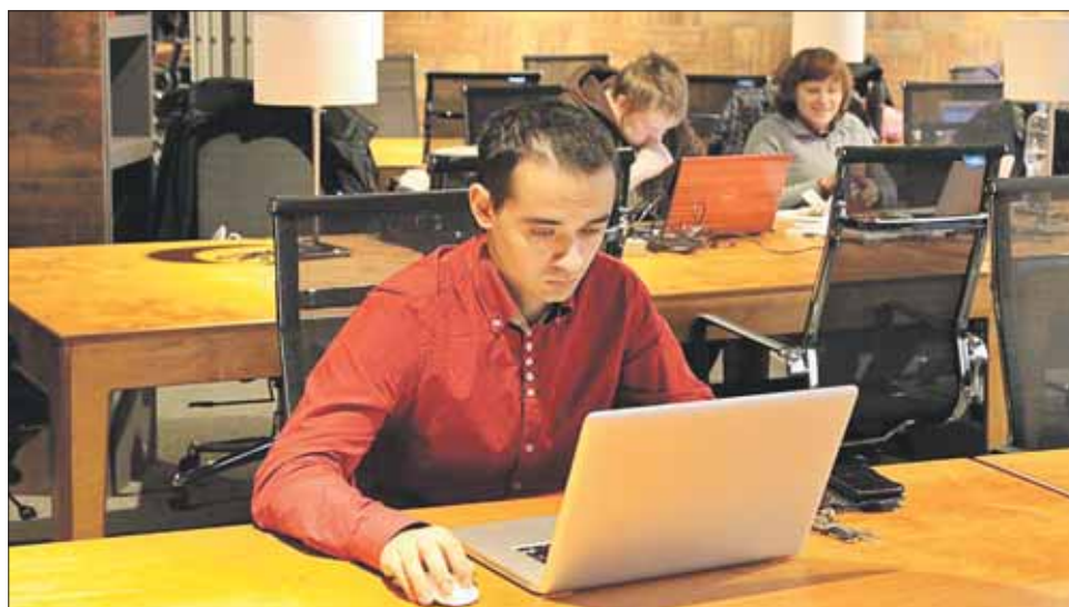
На Средней Первомайской есть всё для спокойной работы

Обширный зал коворкинга на Средней Первомайской улице разделён на две зоны, которые условно называются «громкая» и «тихая». В громкой — с 9.00 до 23.00 идут переговоры с партнёрами, звонки клиентам и заказчикам. Эта сторона пользуется популярностью у владельцев интернет-магазинов и работников мини-колл-центров. В тихой — сидят те, кому нужно сосредоточиться: фрилансеры, программисты, дизайнеры. Помимо этого, есть специ-