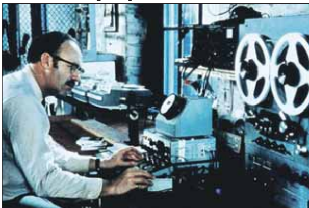
Кадр из фильма «Разговор»

25 ноября в малом зале Государственной библиотеки для молодёжи (ул. Большая Черкизовская, 4, корп. 1) пройдёт показ фильма легендарного Фрэнсиса Ф. Коппола «Разговор». Психологический триллер вышел на экраны в 1974 году и получил «Золотую пальмовую ветвь» Каннского кинофестиваля. Главный герой киноленты — Гарри Кол, специалист по прослушиванию. Запутавшись в шпионской деятельности, он пытается предотвратить убийство, которое, как ему кажется, должно произойти.