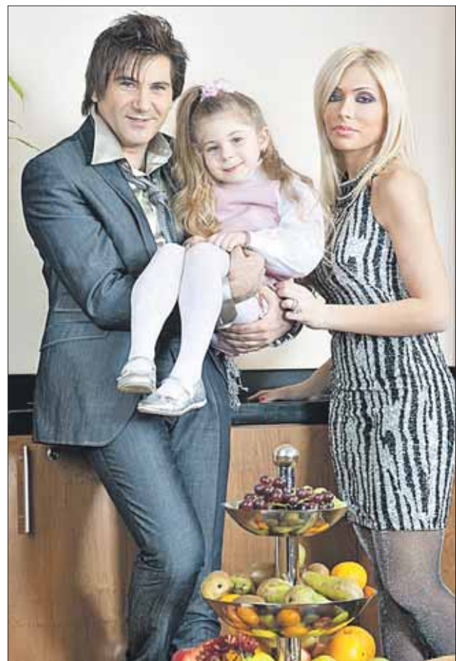
Авраам с женой и дочкой