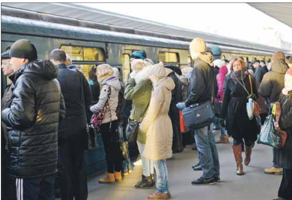
«Пробиться» в вагон можно силой или хитростью

Время 8.25. В метро с улицы Красный Казанец бесконечным потоком тянутся люди. Толчея уже в переходе. Огромная очередь к терминалам, выдающим билеты на одну-две поездки. Этим ловко пользуется верзила — два метра в плечах, лет ему под пятьдесят. В руках у него