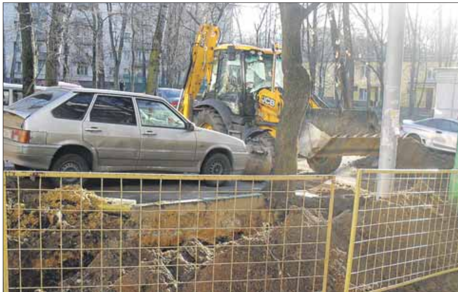
Во дворе на 3-й Парковой, 54, корпус 1, рюк под самыми окнами

— Суть работ в том, чтобы перенести силовые кабели из зоны расширения