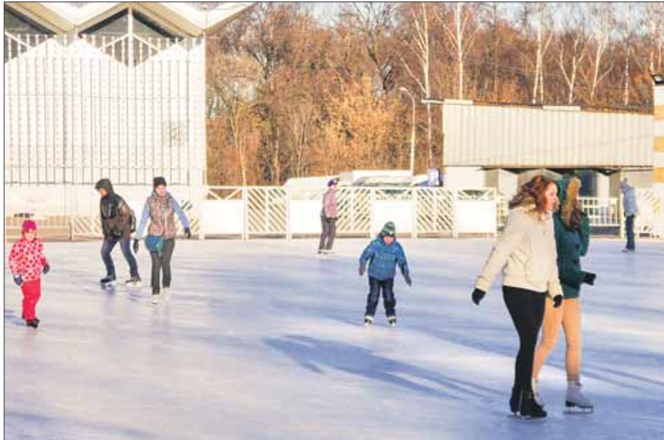
Билет на каток в «Сокольниках» можно купить через Интернет

— Пока парк закупил 10 велосипедов, — рассказывает PR-менеджер парка Анастасия Пикурова. — В декабре в прокате ещё появятся классические зимние велосипеды с шипованной резиной. Мы