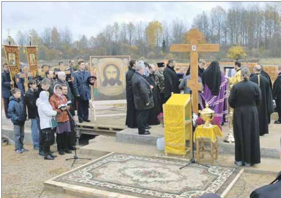
На месте гибели 2-й стрелковой дивизии строится монастырь