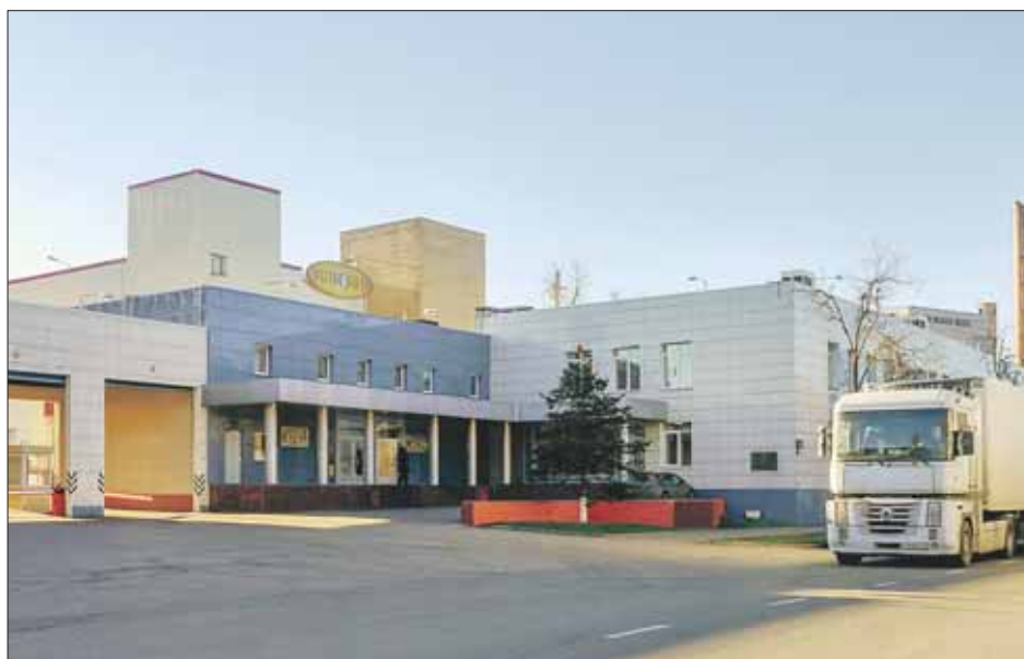
Черкизовский мясоперерабатывающий завод на улице Пермской — пример преуспевающей «пищевки»