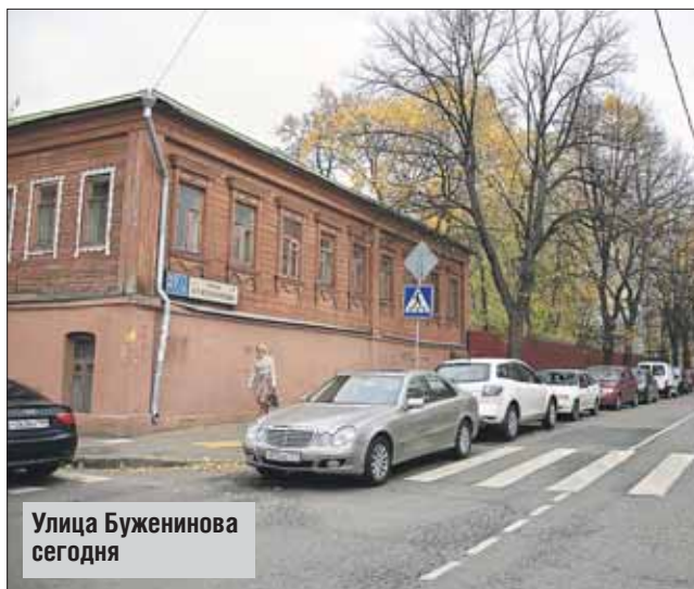
Улица Буженинова сегодня