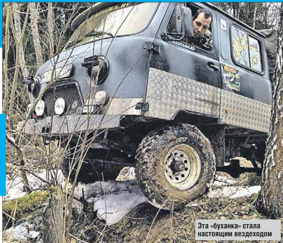
Эта «буханка» стала настоящим вездеходом