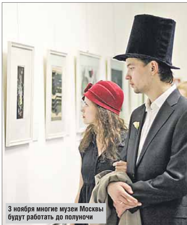
3 ноября многие музеи Москвы будут работать до полуночи

В 19.00 в галерее «Измайлово» (Измайловский пр., 4) запланирован мастер-класс от участников проекта ППЦ — группы молодых людей, кото-