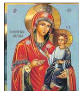
Иверская икона явилась монахам из моря

Иконой владела царская семья, а сейчас она хранится в Государственном историческом музее. Но уже с этой иконы был сделан ещё один список, который в 1669 году установили в часовне у Воскресенских ворот, и икону стали ещё называть Вратарница. Она прославилась многими чудесами, исцелениями и прослыла заступницей москвичей.