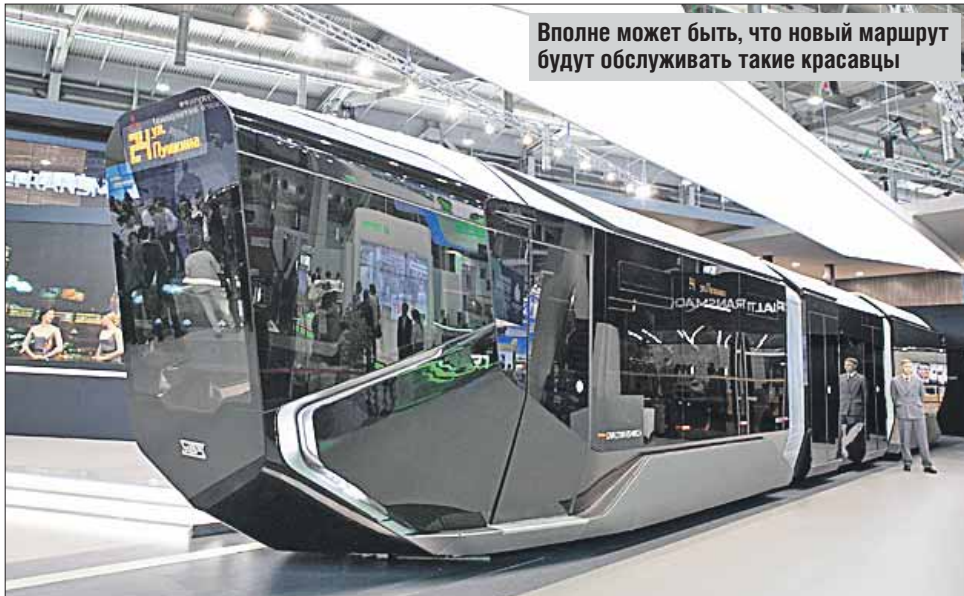
Вполне может быть, что новый маршрут будут обслуживать такие красавцы

На новой трамвайной линии планируется построить шесть остановок. Станция метро «Шоссе Энтузиастов» (вдоль шоссе Энтузиастов на участке между строящейся распределительной магистралью вдоль МКЖД и Электродным проездом), «Стадион «Авангард» (у примы-