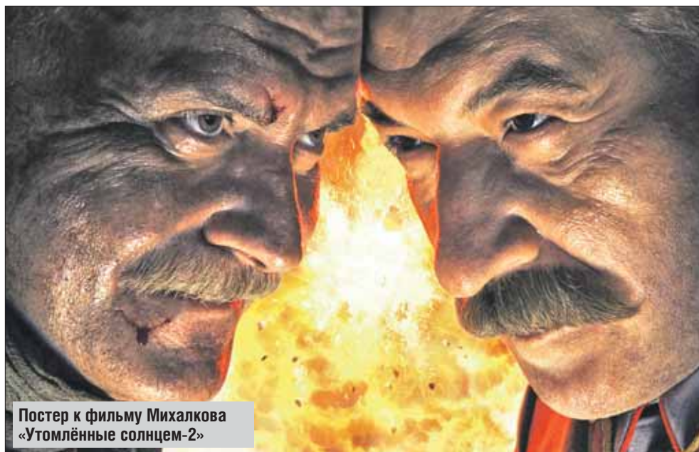
Постер к фильму Михалкова «Утомлённые солнцем-2»