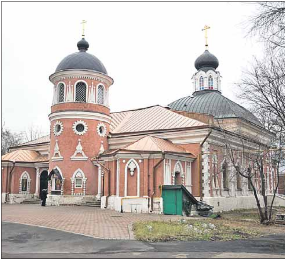
Никольский храм — часть исторического ансамбля Преображенского монастыря