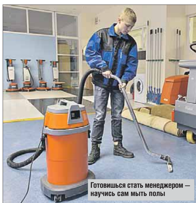
Готовишься стать менеджером — научись сам мыть полы

— У нас учатся дети с ДЦП, слабовидящие и сла-