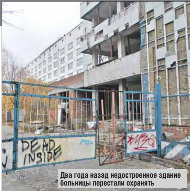
Два года назад недостроенное здание больницы перестали охранять