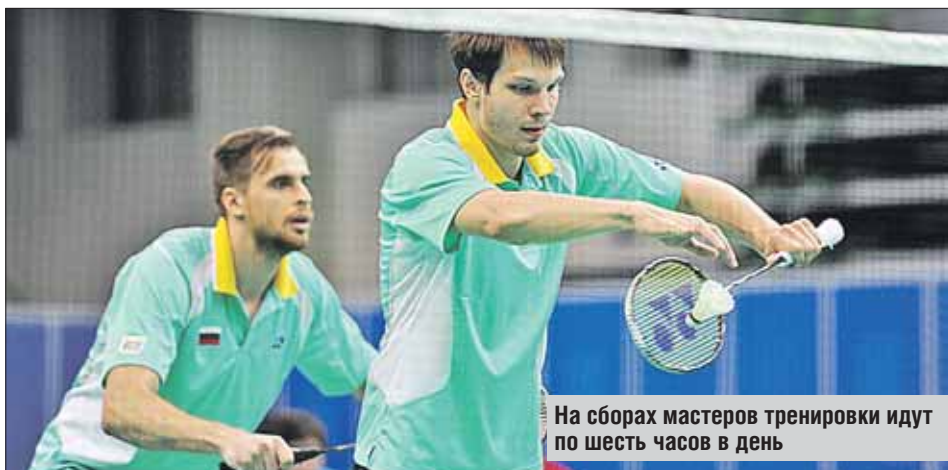
На сборах мастеров тренировки идут по шесть часов в день

— Бадминтон, к сожалению, сегодня собирает не очень много зрителей по ту сторону экрана. В этом вся проблема. Думаю, что со временем ситуация изменится к лучшему. Сейчас вся наша сборная готовится к Олимпиаде в Рио-де-Жанейро, которая будет через два года. Медаль на Олимпиаде — это вершина карьеры. Будем работать, стараться... Беседовала Маша ПАТИ