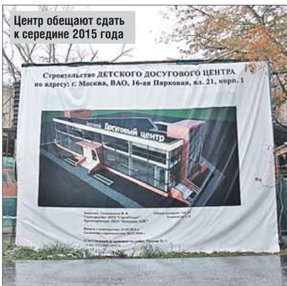
Центр обещают сдать к середине 2015 года