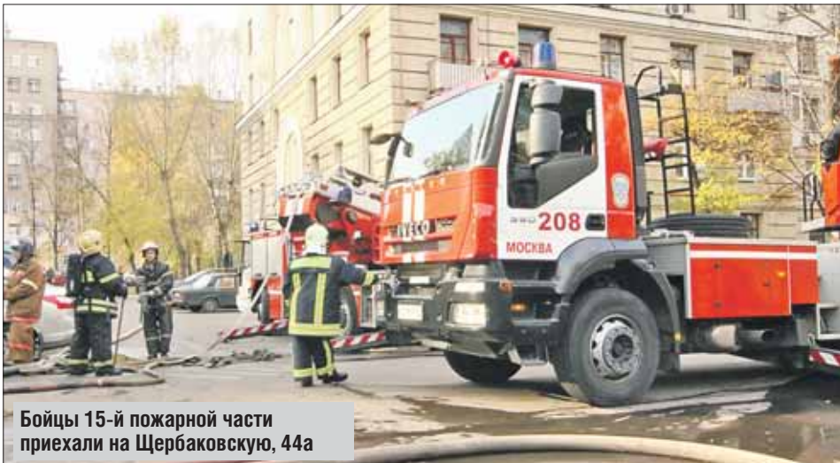
Бойцы 15-й пожарной части приехали на Щербаковскую, 44а