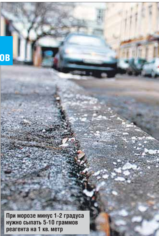
При морозе минус 1-2 градуса нужно сыпать 5-10 граммов реагента на 1 кв. метр

В общей сложности реагентом может быть обработано не более 30% территории двора. Сначала посыпают территорию у подъездов, потом тротуары, потом проходы к остановкам общественного транспорта, детским садам, школам, поликлиникам.