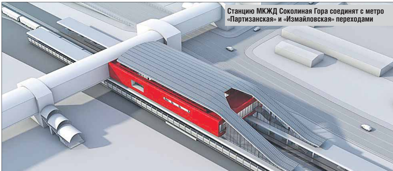
Станцию МКЖД Соколиная Гора соединят с метро «Партизанская» и «Измайловская» переходами

Транспортно-пересадочный узел «Соколиная Гора» станет 32-м остановочным пунктом Московской кольцевой железной дороги. ТПУ построят на пересечении Окружного проезда и 8-й улицы Соколиной Горы. Железнодорожная пассажирская станция расположится на равном удалении (примерно 1300 метров) от метро «Партизанская» и от «Измайловской». Естественно, в схему движения наземного городского транспорта внесут серьёзные коррективы.