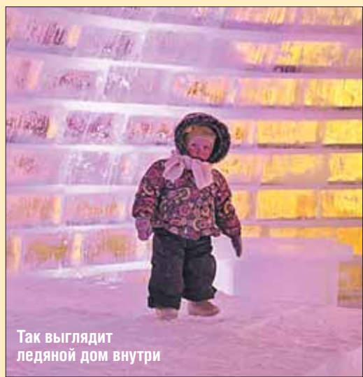
Так выглядит ледяной дом внутри