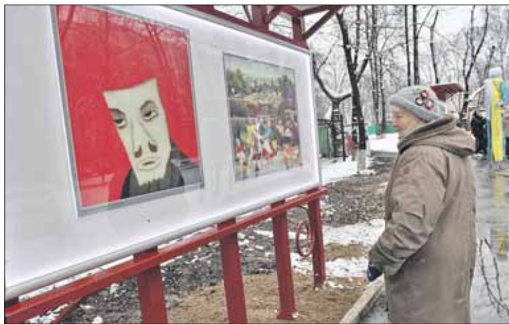
Экспозиции на уличных стендах будут меняться