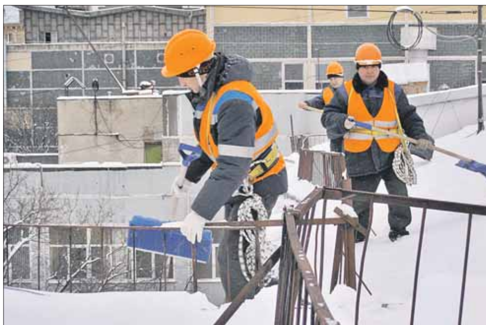
Чистить крыши должны после каждого снегопада

Юрий Кузьмин, старший мастер участка кро-