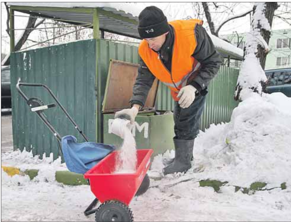
Вот из такой тележки с дозатором дворники должны рассыпать реагенты