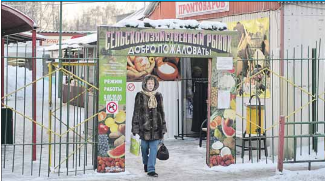
Рынок на пересечении Сиреневого бульвара и 15-й Парковой застрял во вчерашнем дне

Префектура ВАО совместно с городским Департаментом торговли и услуг приняла решение о закрытии с 1 января 2014 года двух рынков на территории ВАО — на пересечении Сиреневого бульвара и улицы 15-й Парковой (компания «Анжелика компани») и рынка «Измайловский комплекс» на 3-й Парковой, вл. 24.