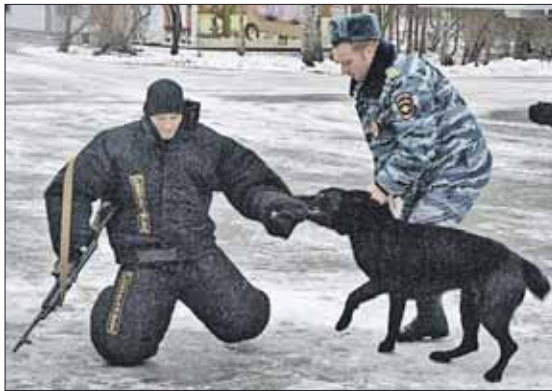
Служебные собаки хорошо знают своё дело