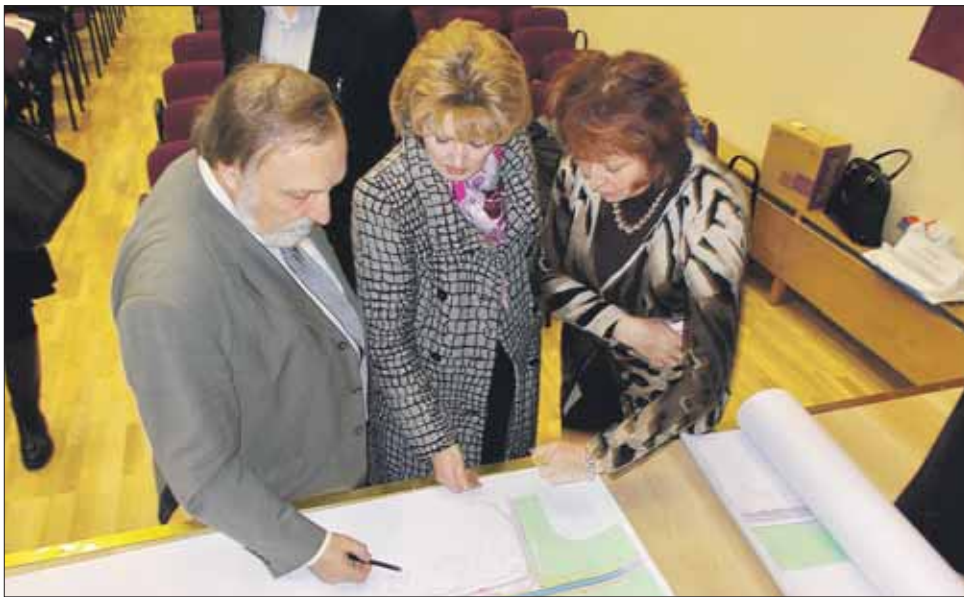
Во время публичных слушаний в районе Соколиная Гора

Не очень понравилось жителям и то, что из-за трамвая придется пожерт-