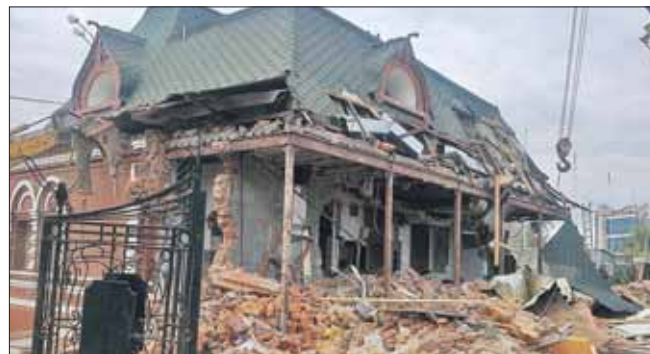
Ресторан на Измайловском проспекте был построен незаконно

Капитальные здания, даже если они построены без разрешения, можно снести только по реше-