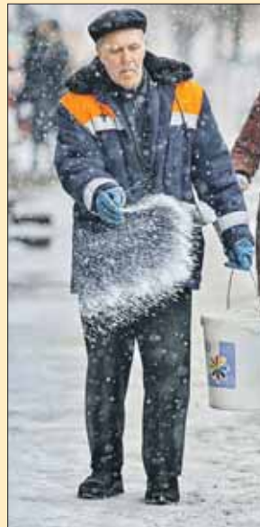
Так делать нельзя!