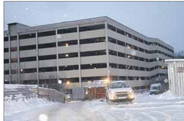
Гараж достроят с учётом современных требований

«Уют» обещала выделить в паркинге безвозмездно в собственность бывшим участникам ГСК 1885 машиномест. Однако «Уют» первую секцию гаража построил на 80%, а вторую — только на 40%, а потом, в связи с финансовыми трудностями, вообще бросил стройку.