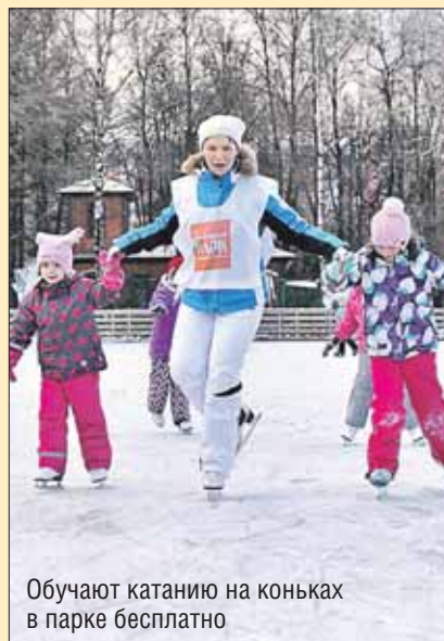
Обучают катанию на коньках в парке бесплатно