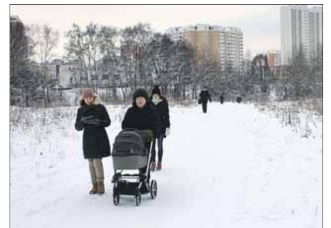
Дорожку обещают посыпать песком регулярно