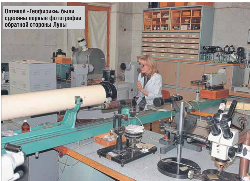
Оптикой «Геофизики» были сделаны первые фотографии обратной стороны Луны