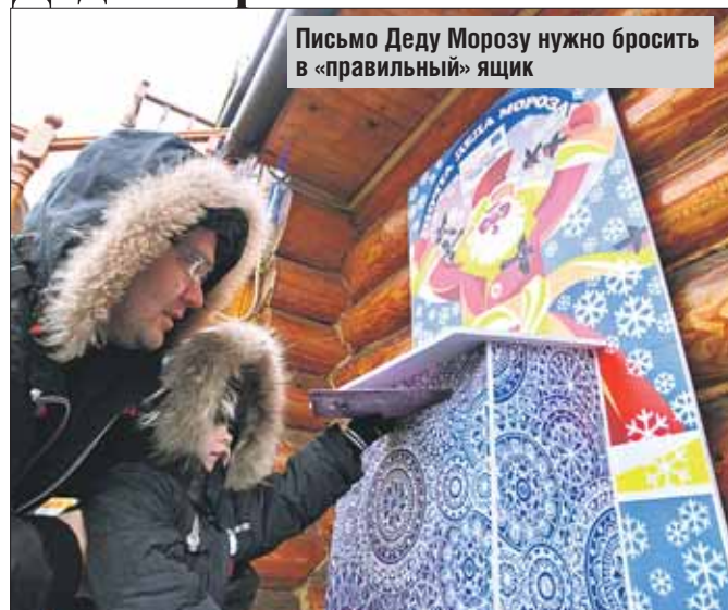
Письмо Деду Морозу нужно бросить в «правильный» ящик

В рамках городского фестиваля «Лучший город зимы» в столице установлены специальные почтовые ящики. Ежедневно их вскрывают работники почты и отправляют письма, написанные детьми, напрямую в Великий Устюг Дедушке Морозу. В ВАО специальные ящики появились в парке «Сокольники» (ул. Сокольнический Вал, вл. 1), Перовском (Лазо, вл. 7) и Измайловском ПКиО (Аллея большого круга, 7).