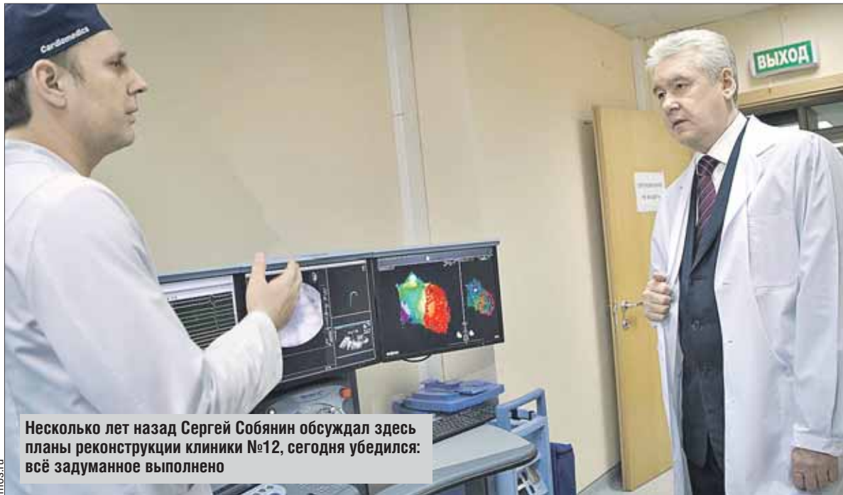
Несколько лет назад Сергей Собянин обсуждал здесь планы реконструкции клиники №12, сегодня убедился: всё задуманное выполнено