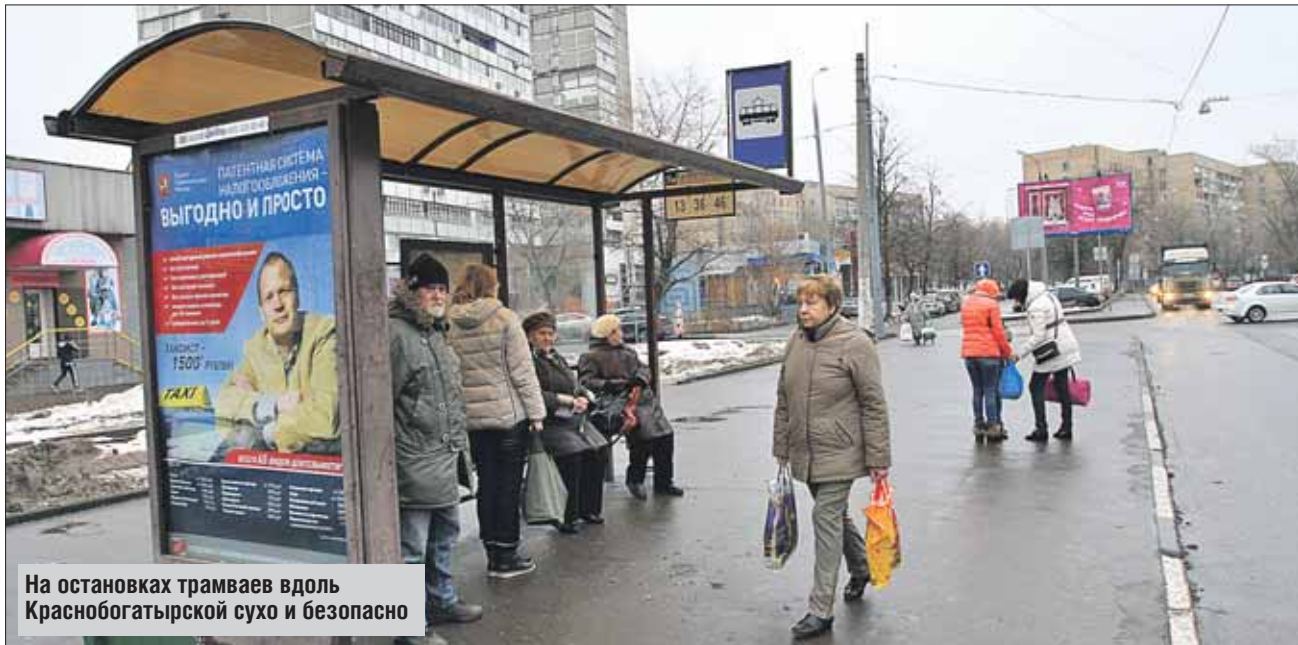
На остановках трамваев вдоль Краснобогатырской сухо и безопасно

Корреспондент «ВО» проверила, как в округе чистят остановки общественного транспорта