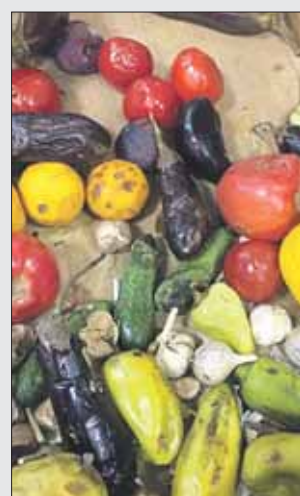
Вот такое «аппетитное» фруктово-овощное ассорти продавали на Вешняковской, 39

А вот самые рачительные хозяева, как выяснилось, у