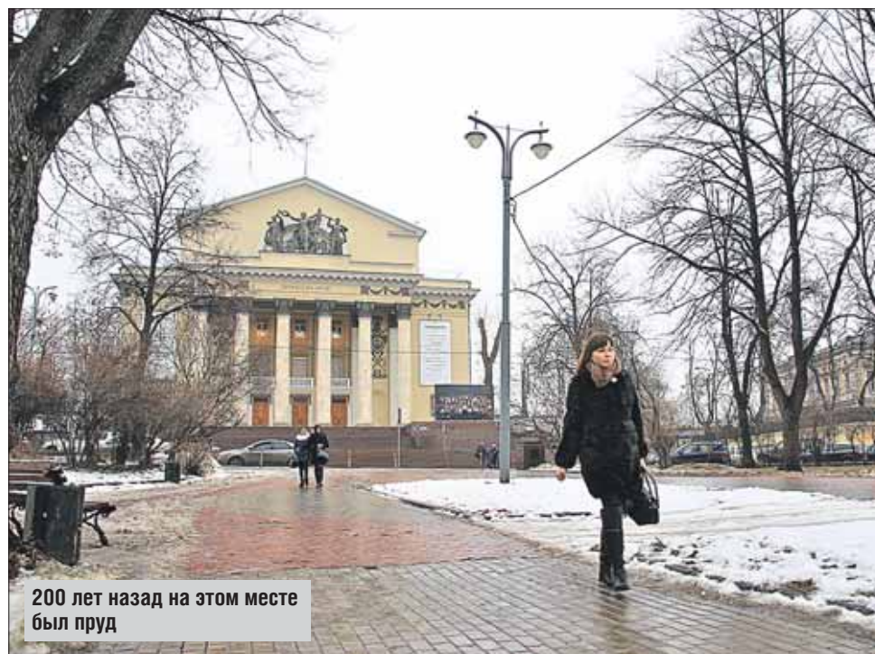
200 лет назад на этом месте был пруд