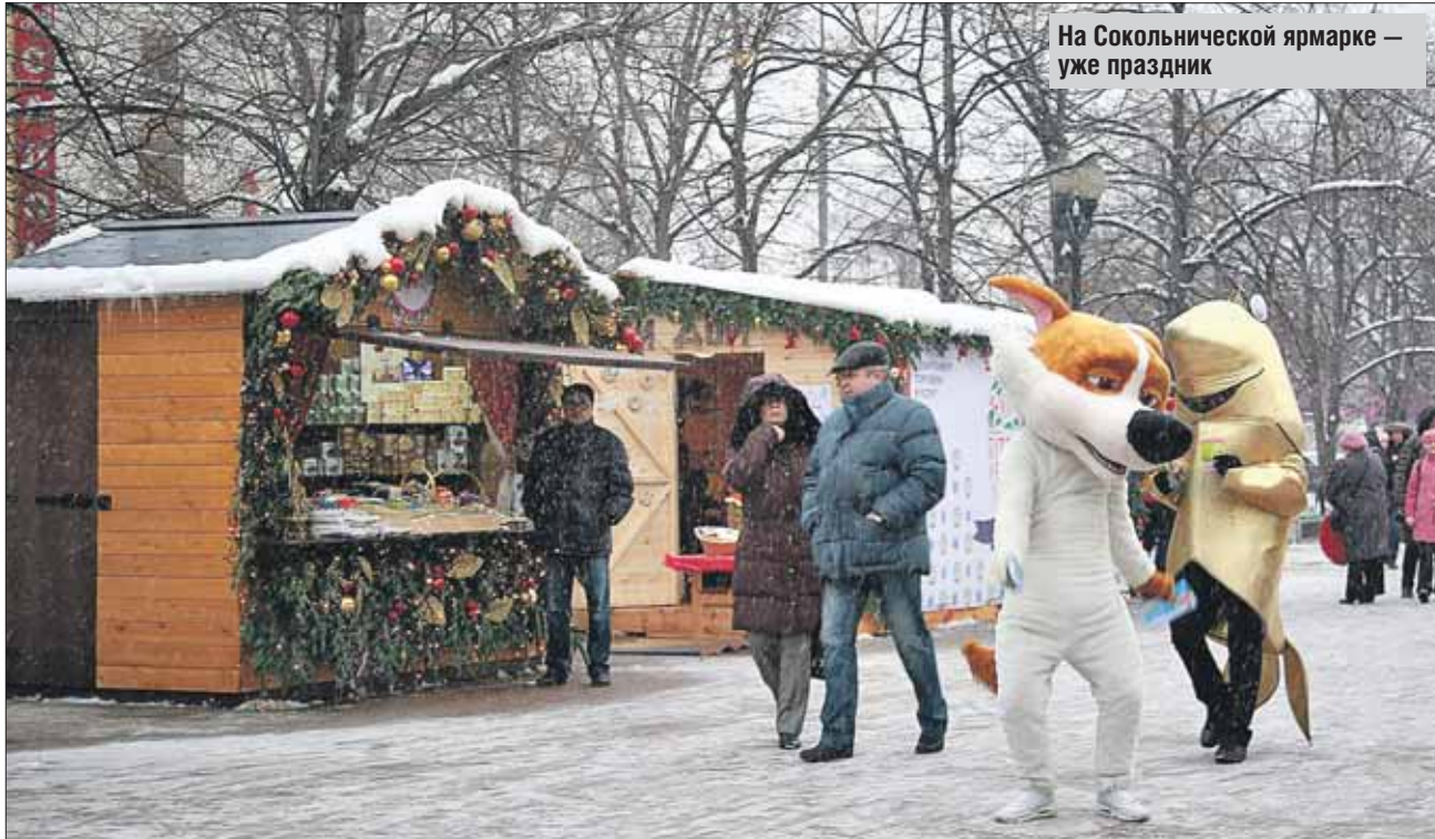
На Сокольнической ярмарке — уже праздник

На ярмарке в Сокольниках у нашего корреспондента разбежались глаза