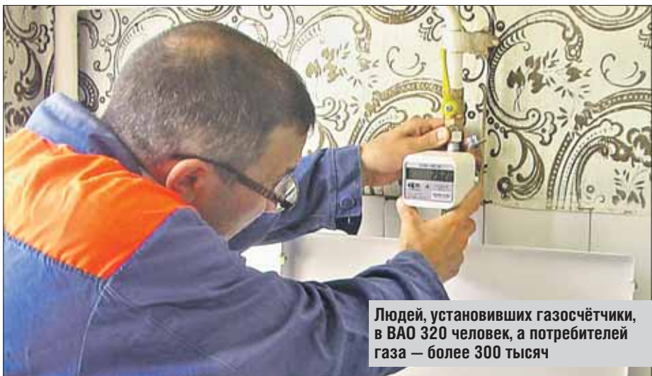
Людей, установивших газосчётчики, в ВАО 320 человек, а потребителей газа — более 300 тысяч

— Семья из трёх человек, если обедает-ужинает дома, расходует в среднем от 3 до 5 кубометров газа в месяц, цена одного кубометра — 4,03 рубля, — пояснили в компании по установке газосчётчиков. — Если платить по счётчику, траты составят 16-20 рублей в месяц. А без счётчика плата берётся по подушевой схеме — 46,65 рубля с человека в квартирах с плитой, 116, 90 рубля с человека в квартирах с водонагревательной колонкой. Расходы семьи из трёх человек вырастают до 139, 95 рубля в месяц.