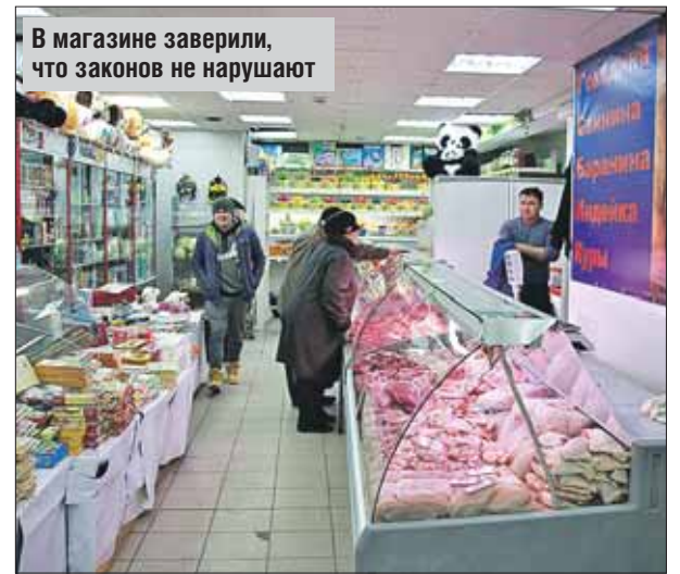
В магазине заверили, что законов не нарушают