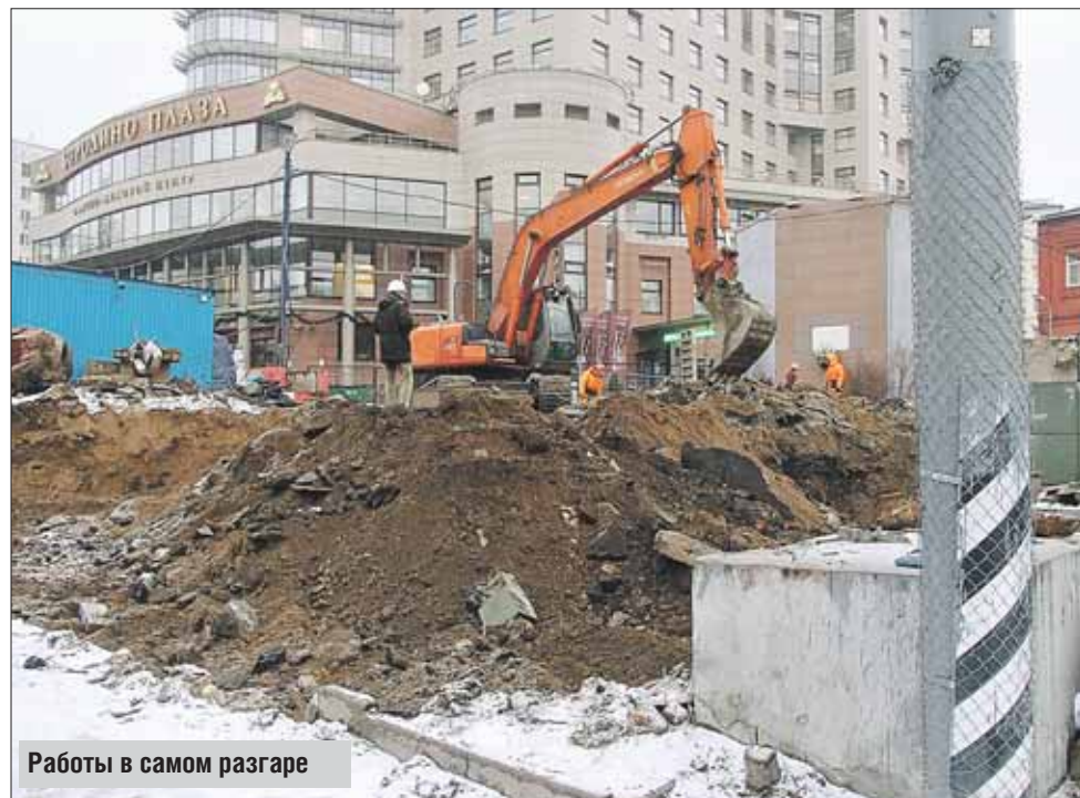
Работы в самом разгаре