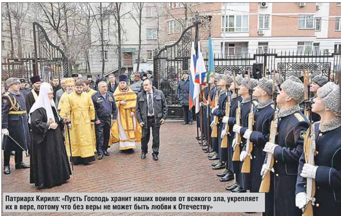
Патриарх Кирилл: «Пусть Господь хранит наших воинов от всякого зла, укрепляет их в вере, потому что без веры не может быть любви к Отечеству»

Около шести утра в Сокольники высадились рота десанта и сотня курсантов из Рязани. Без лишней суеты и шума десантура рассредоточилась у храма. На подступах и у въезда — боевое охранение и посты, по всем правилам военной науки. Ровно в восемь колокольный звон начал будить округу, а в храме уже негде было ступить. Ждали Патриарха. Повод не рядовой: высший иерарх Русской Церкви лично решил освятить храм и отслужить в нём литургию. Вообще-то храм старый, столетний. Но новое освящение необходимо, поскольку построенную специально для солдат сапёрного полка в 1906 году церковь Благо-