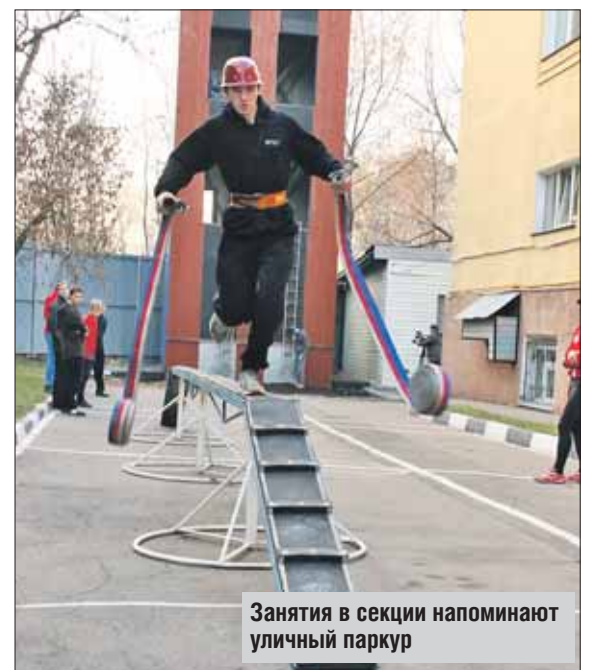
Занятия в секции напоминают уличный паркур