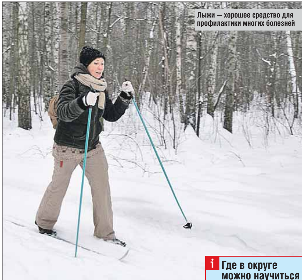
Лыжи — хорошее средство для профилактики многих болезней