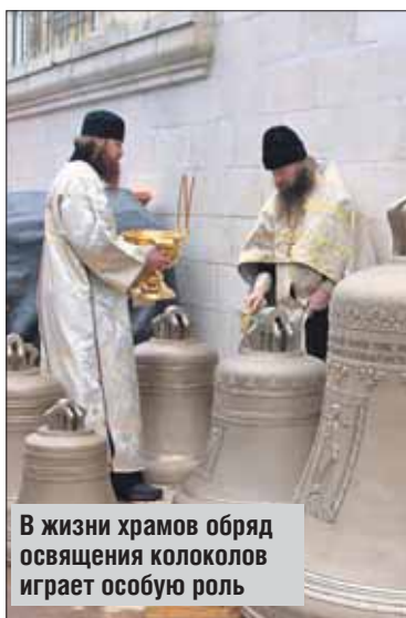
В жизни храмов обряд освящения колоколов играет особую роль

Десять колоколов сначала освятили, а на следующий день водрузили на колокольню Преображенского храма. Все они отлиты на воронежском колокольном заводе, а поставить им «голоса»