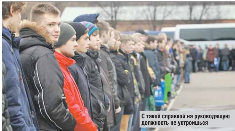
С такой справкой на руководящую должность не устроишься

Неприятной неожиданностью стало для 28 уклонистов из района Перово посещение Военного комиссариата. Оказалось, что заветный военный билет, равноценный тому, который выдают солдатам-срочникам после службы в армии, они уже не получают. По новому приказу министра обороны №495 уклони-