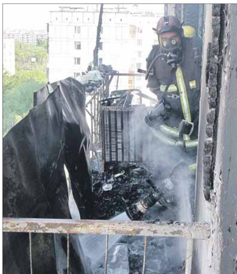
Балкон дома на Перовской улице загорелся из-за брошенного сверху окурка. Оперативная съёмка

Что мешает тушить пожары — Расскажите, пожалуйста, с какими проблемами сталкиваются в работе пожарные отряды?