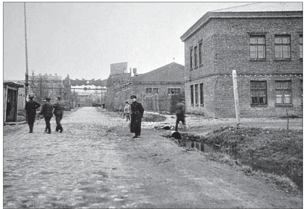
На фото конца 1940-х годов — Кусковский химзавод со стороны улицы Новотетёрки