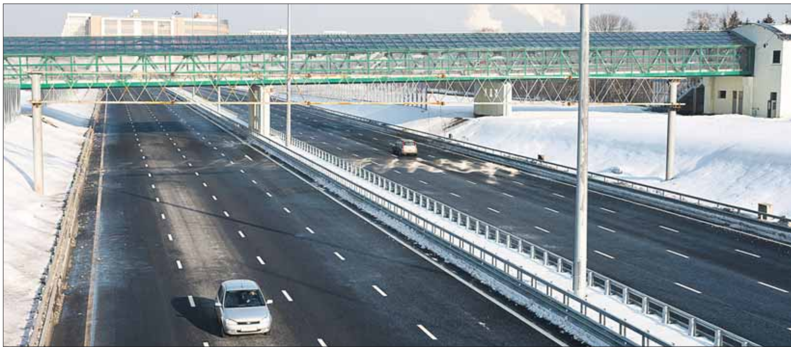
Участок Четвёртого транспортного кольца от шоссе Энтузиастов до Измайловского шоссе войдёт в состав хорды

В состав хорд включают уже построенные элементы ЧТК. С одной стороны, задачи, возлагаемые на хорды, шире: они должны не только замкнуть объезд вокруг центральной части города, но и пронизать его насквозь. С другой — должны стать «усечённым» вариантом ЧТК с точки зрения экономии средств. Цели эти непростые и даже противоречивые. Но словосочетание «Четвёртое транспортное кольцо» продолжает фигурировать в официальных документах.