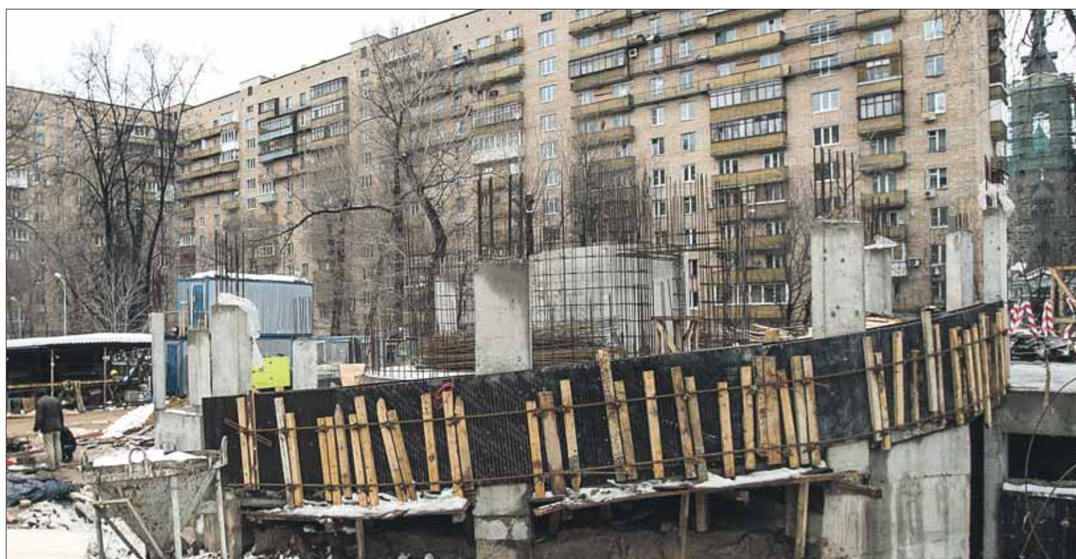
Недостроенный гараж на Щербаковской, 32/7, должен быть достроен к сентябрю

— Когда начнётся строительство детско-взрослой поликлиники в 9-м микрорайоне Кожухово?