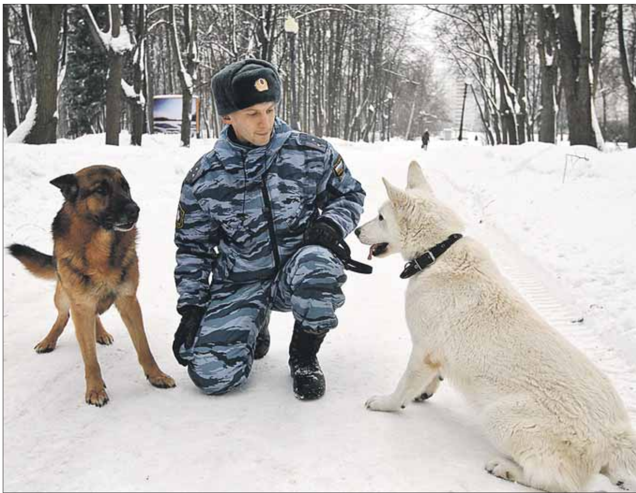
Немецкая овчарка Шаман — уже пенсионер, а белая швейцарская овчарка Дон — только учится