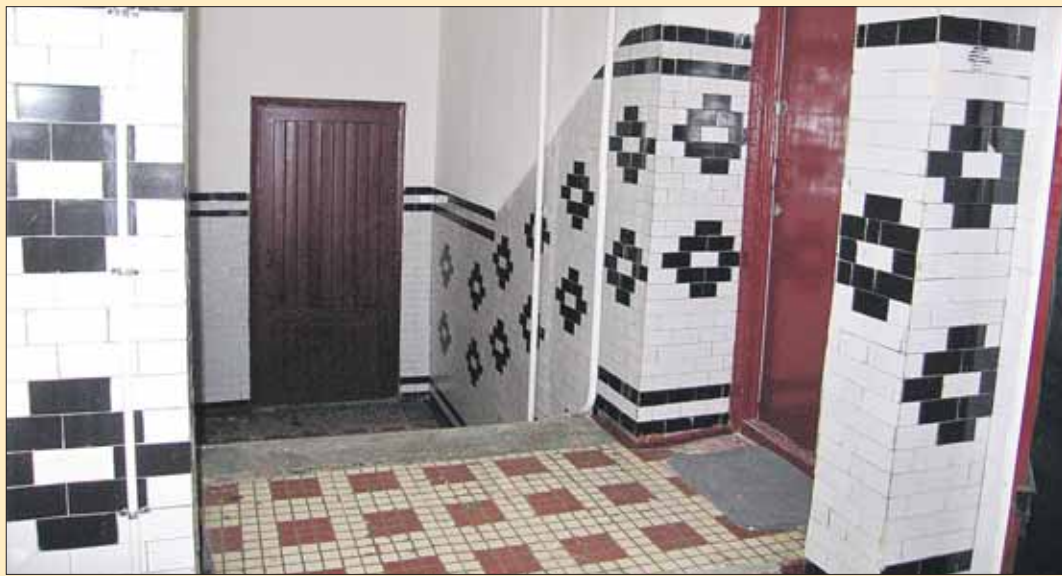
Подъезд дома 26, корпус 2, на улице Б.Черкизовской

панией какие-то спорные ситуации, у них есть ряд вариантов, — говорит Владимир Акимов. — Во-первых, обратиться в управу своего района. Именно она является контролирующей организацией, которая отслеживает качество текущего ремонта. Во-вторых, попросить помощи у муниципального Собрания. Районные депутаты наделены соответствующими полномочиями. В-третьих, обратиться в Мосжилинспекцию по телефону горячей линии: (495) 681-7780, (495) 681-2145, (495) 681-2054.