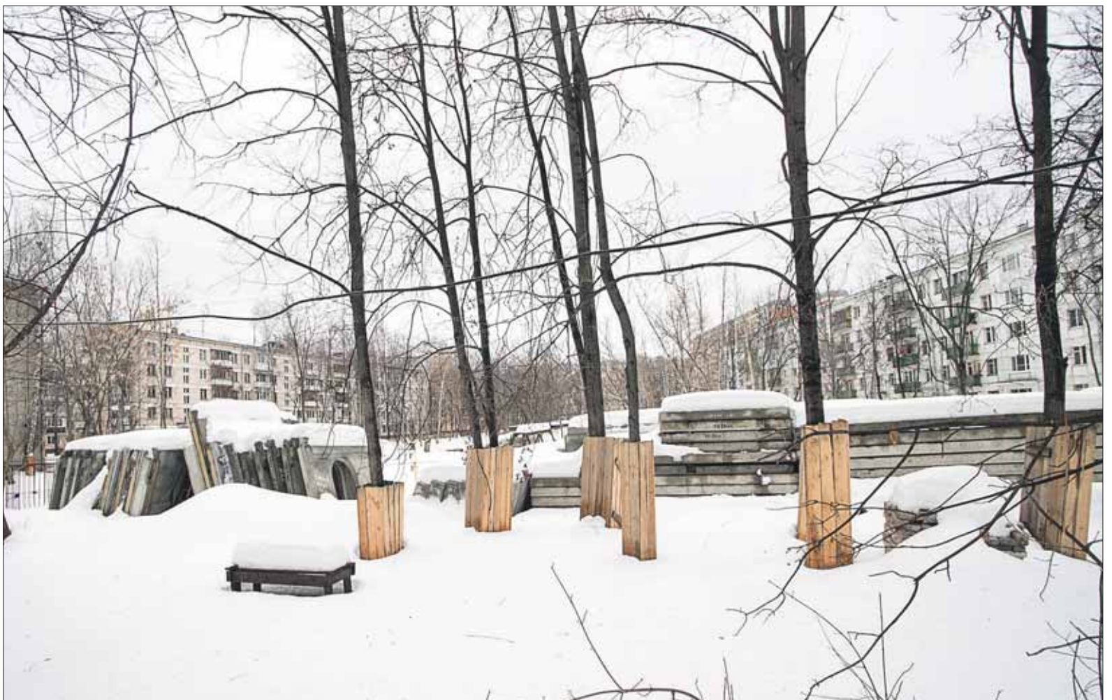
На Щёлковском проезде, 1а, будет детский сад

сторону: инвестор отказался от своих намерений. Но к тому времени эти дома в перечень на замену стеклопакетов уже не попали, поскольку предполагалось, что их снесут. Мы рассудили, что жители не должны страдать. Поэтому обратились в Правительство Москвы с просьбой решить вопрос, и нас поддержали. Так что не волнуйтесь, в этих домах также заменят окна на шумоизоляционные.