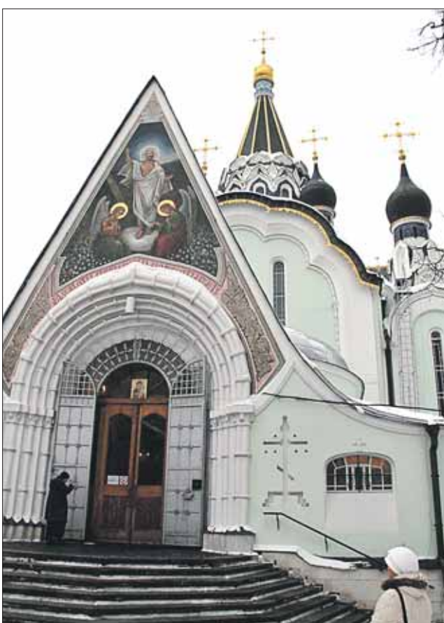
Храм Воскресения Христа в Сокольниках

рый стал монахом и закончил жизнь настоятелем русского храма в Риме.