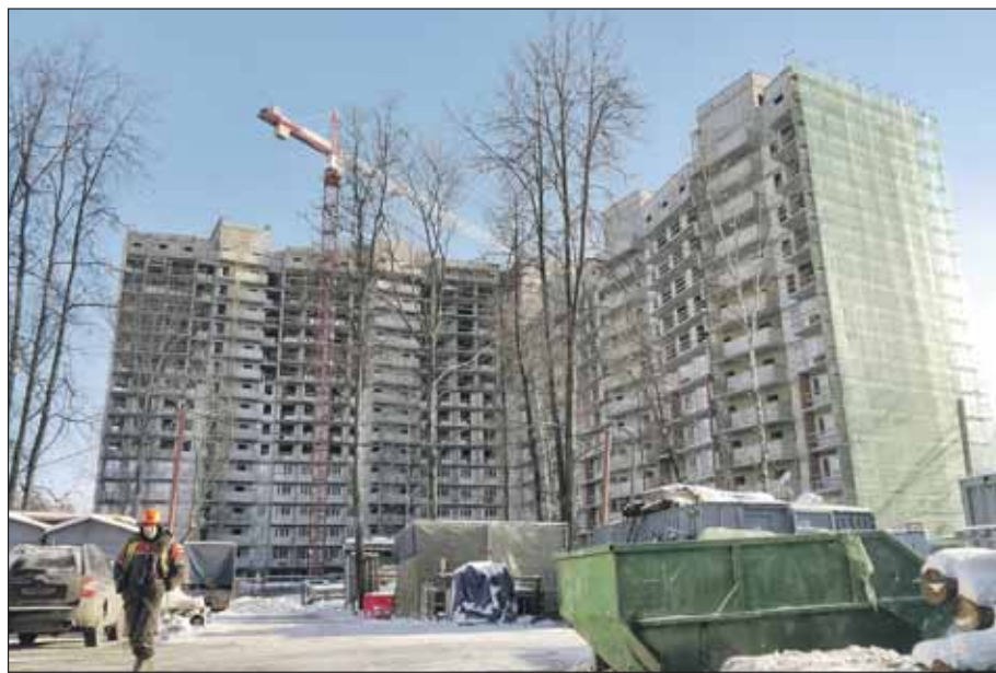
Новостройка в Северном Измайлове

В районе Богородское, на Краснобогатырской ул., мкр. 18Б, вл. 5, стр. 2, строится дом по индивидуальному проекту, высотой 25 этажей, с подземной автостоянкой на 220 машино-мест. Сдадут дом в октябре этого года.