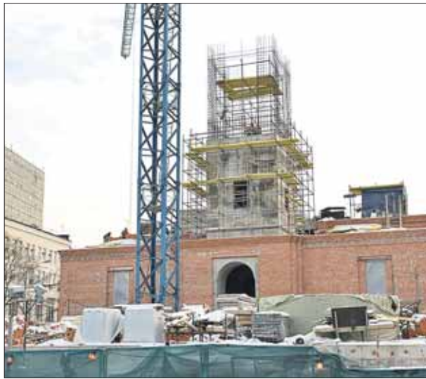
Храм смогут посещать одновременно 600 человек

По графику храм сдадут летом-осенью 2014 года, его смогут посещать до 600 человек одновременно.