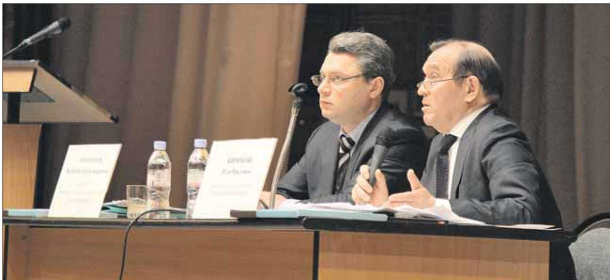
30 января. Дом творчества детей и молодёжи «Преображенское»

— Во многих районах Москвы уже есть жилищные ГБУ. Появится ли «Жилищник» в районе Новогиреево и какова цель создания такой организации?