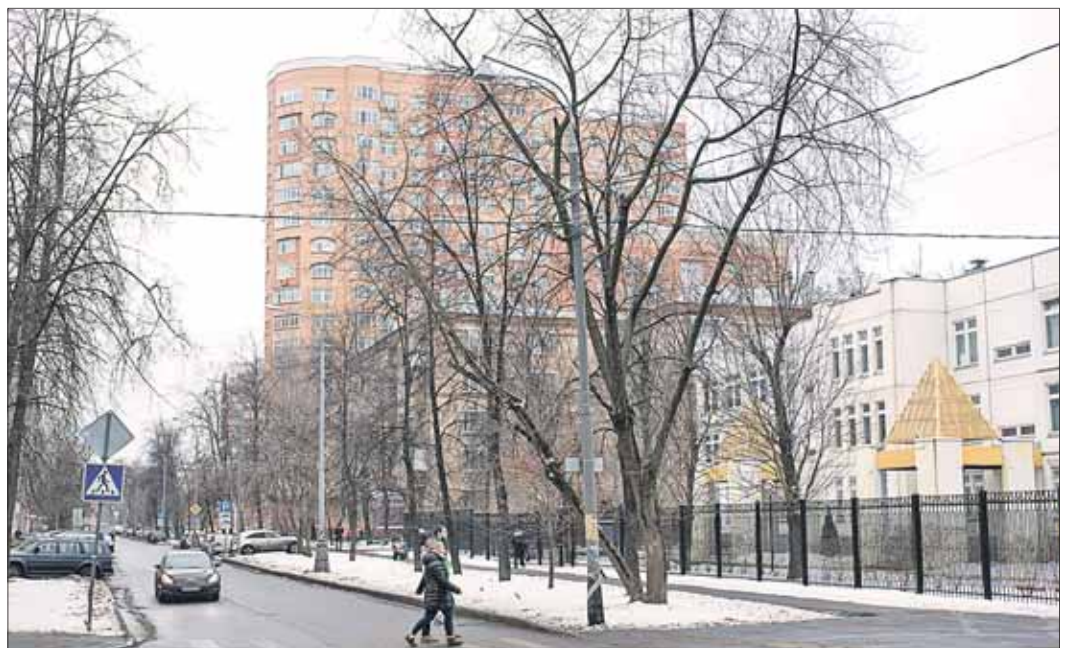
Свое название улица Зверинецкая получила в пылу классовой борьбы