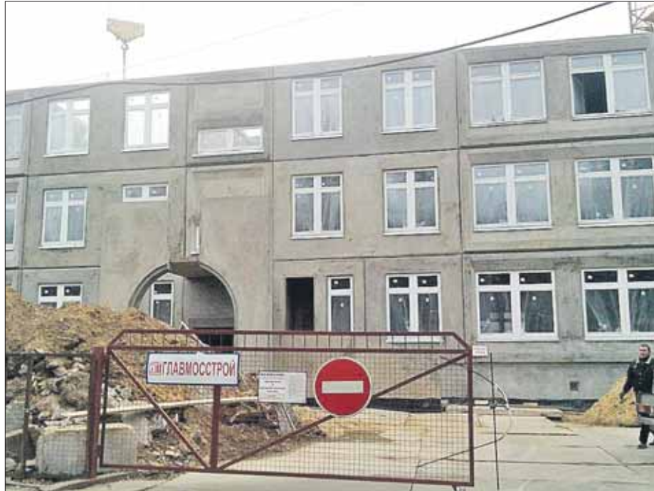
Детсад на Новогиреевской, владения 6А, 6Б, должны сдать летом этого года

Такой же садик с бассейном строится и в районе Северное Измайлово на Шёлковском ш., вл. 88, корп. 18. Здесь будут организованы шесть групп (125 мест), а сдать садик планируют в августе 2014 года. Сейчас ведутся монолитные работы на уровне 2-го этажа. Компания, которая строит садик, имеет большой опыт по строительству школ и садиков в городе и в нашем округе.