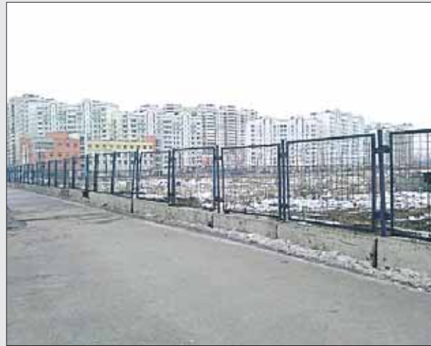
Владелец забора между улицами Руднёвкой и Святоозёрской неизвестен

Благодаря народному контролю были выявлены несанкционированные разрытия и ограждения. Так, А.С.Писарев из Косино-Ухтомского поинтересовался, для каких целей огорожен пустырь между ул. Руднёвкой, 9, — Святоозёрской ул., 4, — ул. Руднёвкой, 2. После чего выяснилось, что в Административно-технической инспек-