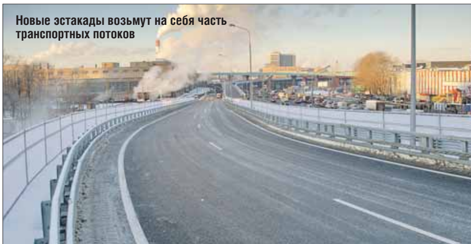
Новые эстакады возьмут на себя часть транспортных потоков

М эр Сергей Собянин открыл движение по двум эстакадам на шоссе Энтузиастов. Первая эстакада удобна для тех, кто едет на машине по Четвёртому транспортному кольцу со стороны Измайловского шоссе и собирается свернуть в сторону области. Теперь это можно сделать легко и просто, проехав поверх основного створа ЧТК. Вторая эстакада — для тех, кто едет по шоссе