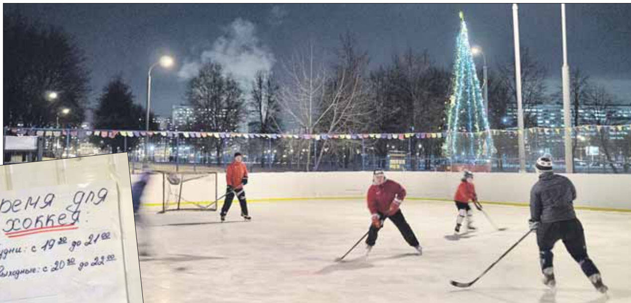
Каток на Вешняковской в самое популярное, вечернее, время занят хоккеистами

По информации ГКУ «ИС района Вешняки», с января 2014 года обслуживающая каток организация сменилась, одна-