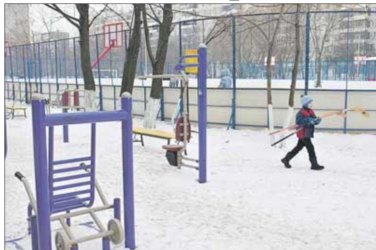
Спортплощадка на улице Сталеваров пользуется спросом у детей и взрослых