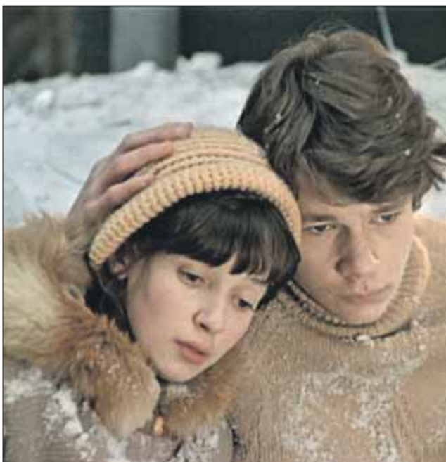
Кадр из фильма «Вам и не снилось...»

да было скорее случайно и немного возможностью заработать. Поэтому, когда после «Вам и не снилось...» мне стали звонить и предлагать роли разных девочек из деревни, я категорически отказывалась. Меня подкупило только предложение Александры Митты