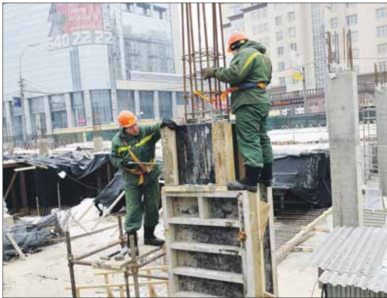
Строительство храма на Преображенской площади должны завершить в июле 2014 года