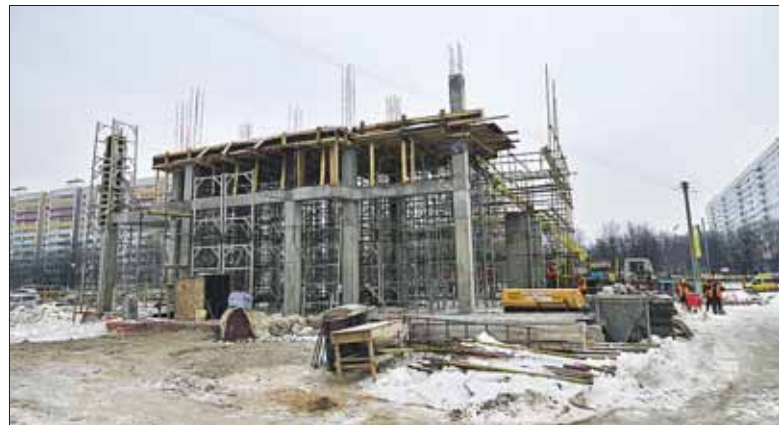
Завершён монтаж нулевого цикла Храма в честь святого праведного Алексия Московского (Мечева) на Вешняковской, 16

Во время объезда Владимир Ресин посетил ещё два строящихся храма: на Кетчерской, 2, — храм Введения во храм Пресвятой Богородицы и на Вешняковской, 16, — храм в честь святого праведного Алексия Московского (Мечева).