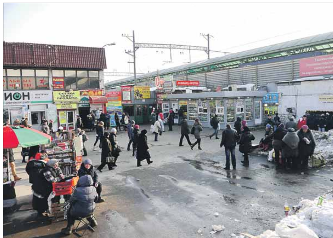
Рынок у метро «Выхино» снесут: здесь пройдёт Северо-Восточная хорда

— Например, по народному гаражу на ул. Снайперской, 4, такие публичные слушания проводились. Там предусмотрено строительство гаража на 100 машино-мест. Заявленный, насколько мне известно, собрано уже 120, — сообщил