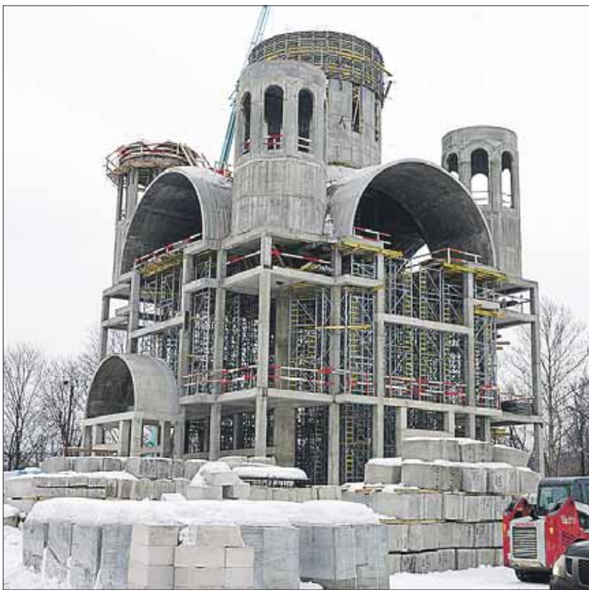
Церковь Введения во храм Пресвятой Богородицы на Кетчерской, 2, в этом году должны достроить

К середине февраля на стройплощадке завершены археологические раскопки, переложены коммуникации и устроена объездная до-