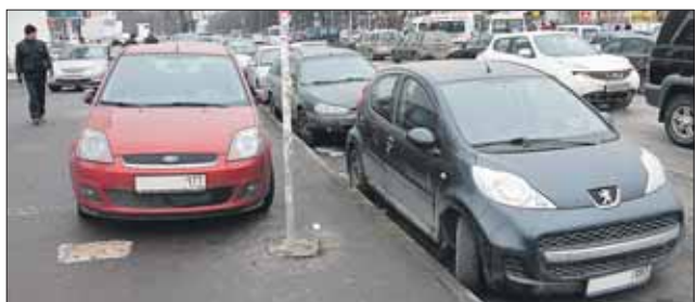
Выход к магазину «Билла» попадает в зону формирования транспортно-пересадочного узла