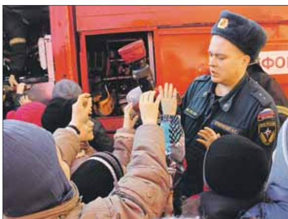
На экскурсии можно взять в руки пожарный шланг

Адрес: ул. РУКАВСКАЯ, 26, стр. 1. СБОР УЧАСТНИКОВ в 11.00