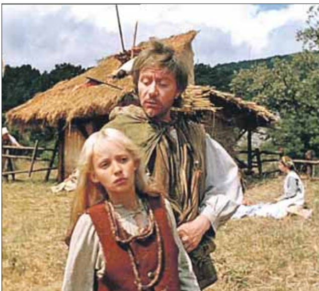
Кадр из фильма «Сказка странствий»