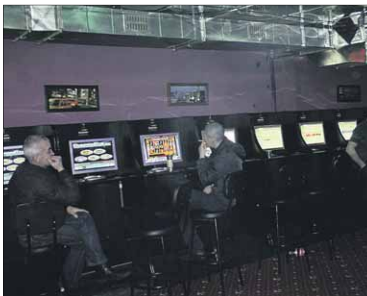
Оперативная съёмка окружного УВД в одном из подпольных клубов

Спустя несколько дней оперативники выявили ещё 3 заведения: на Щёлковском и Измайловском шоссе. Азартные игры там велись по Интернету: компьютеры оказались оборудованы специальными программами, аналогичными тем, что устанавливаются в игровые автоматы. Во время рейда изъято 118 единиц оборудования.