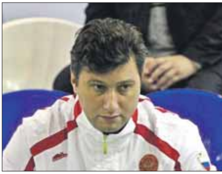
Мне стало интересно, как это — работать с женщинами