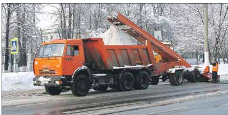
Уборка снега в ВАО

За нарушения, выявленные с помощью системы спутникового слежения ГЛОНАСС (простаивающая уборочная техника, неполный рабочий день) с начала года к подрядным организациям применены штрафные санкции в размере почти 3,5 млн рублей. Среди отстающих — подрядные организации, работающие в районах Косино-Ухтомский — сумма штрафов