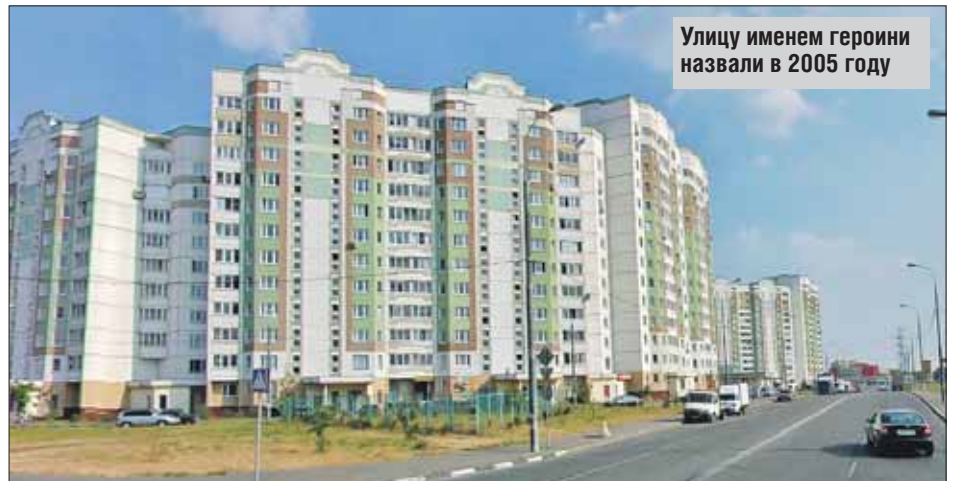
Улицу именем героини назвали в 2005 году