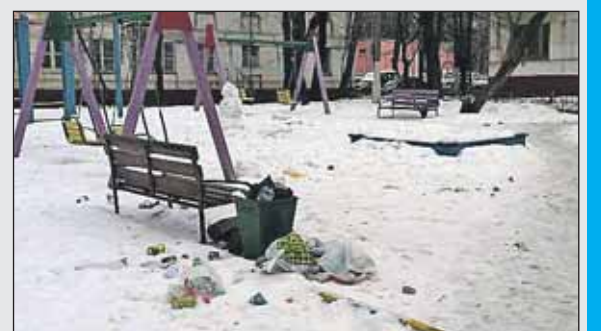
Вот так взрослые жители Богородского «любят» детскую площадку на Открытом шоссе, 1, корпус 3

А вот житель Богородского раскритиковал не только плохую работу коммунальщиков, забывших дорожку на детскую площадку на Открытом ш., 1, корп. 3, но и с досадой написал: «Отдельная «благодарность» гражданам, которые привели детскую площадку в такое состояние». Как видно на приложенных