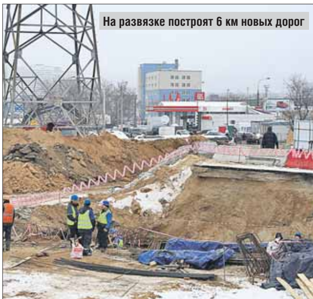
На развязке построят 6 км новых дорог

Реконструкция началась в сентябре 2014-го и завершится, по словам побывавшего на строительстве мэра Сергея Собянина, до конца этого года. Она предусматривает замену нынешней, порядком устаревшей клеверообразной развязки более современной, с направленными съездами. Согласно проекту, будут построены правоповоротная эстакада с внутренней стороны МКАД в центр, левоповоротный тоннель из области на внутреннюю сторону Кольцевой. Кроме того, предполагается реконструкция прилегающих к развязке участков МКАД, Рязанского и Лермонтовского проспектов. Всего здесь будет построено более 6 километров дорог.