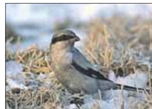
Птичка маленькая, но хищная

Летом сорокопут охотится на крупных насекомых, а зимой полностью переключается на мясной рацион. Примечательно, что добычу он нака-