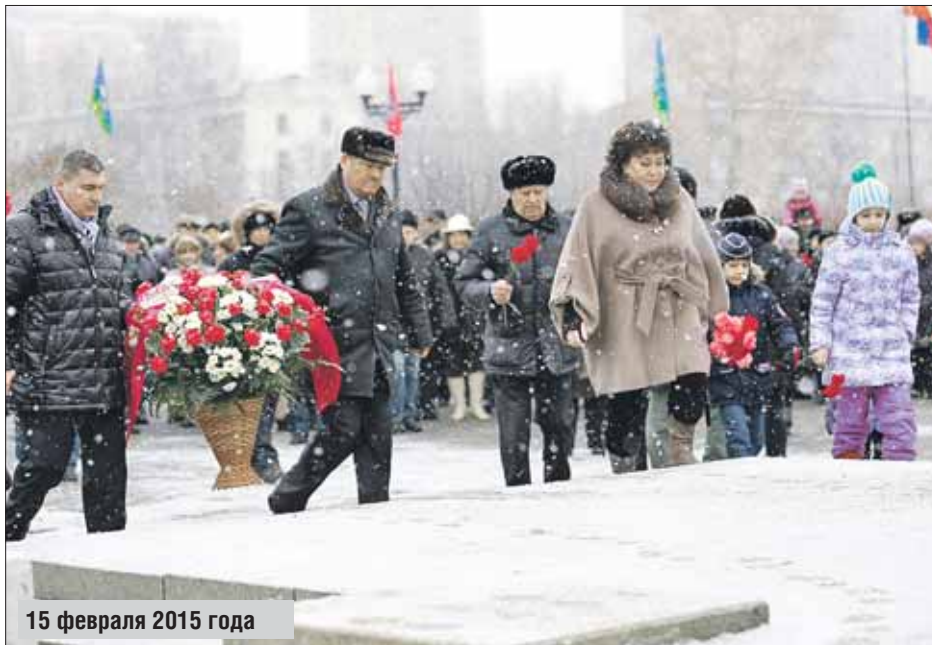
15 февраля 2015 года