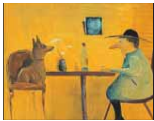
Одна из работ Бадри Шенгели

В это время в Музее наивного искусства (Союзный просп., 15а) можно полюбоваться картинами жизнерадостного художника Бадри Шенгели. На его картинах — знакомые городские пейзажи и фантастические сюжеты. Художник, который никогда не изучал живописных техник, больше всего любит создавать юмористические городские сценки из нашей жизни.