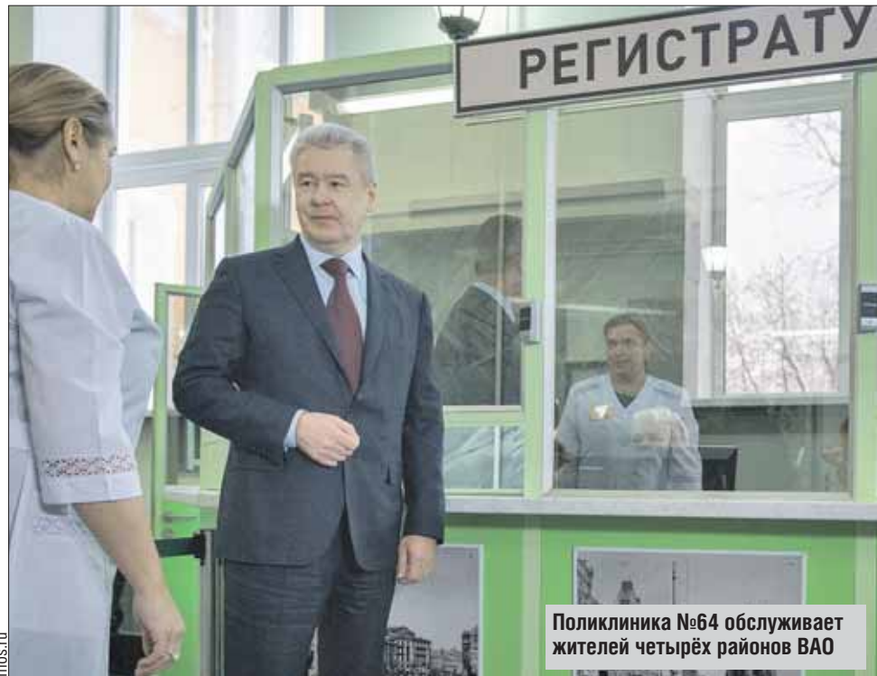
Поликлиника №64 обслуживает жителей четырёх районов ВАО

Именно в связи с задачами, которые ставит мэр сейчас, для посещения он выбрал 64-ю поликлинику, ведь многое из того, что было озвучено, здесь