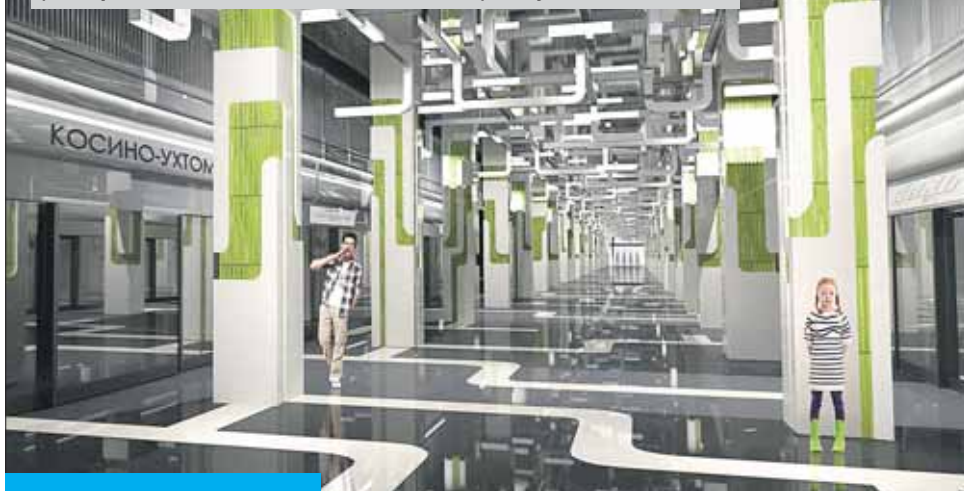
Так будет выглядеть станция «Лухмановская» (до переименования — «Косино-Ухтомская») Кожуховской ветки

Всего на Кожуховской линии будет девять станций