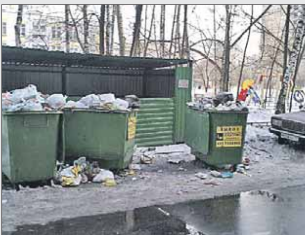
Переполненная мусорка на Сахалинской, 4, середь бела дня

Через 10 дней управа района Гольяново ответила, что площадку привели в порядок, а к работникам «Жилищника», обслуживающего этот участок, применены «меры экономического воздействия». В свою очередь Административно-техническая инспекция