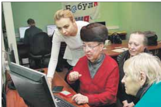
Средний возраст слушателей курсов — 60-70 лет