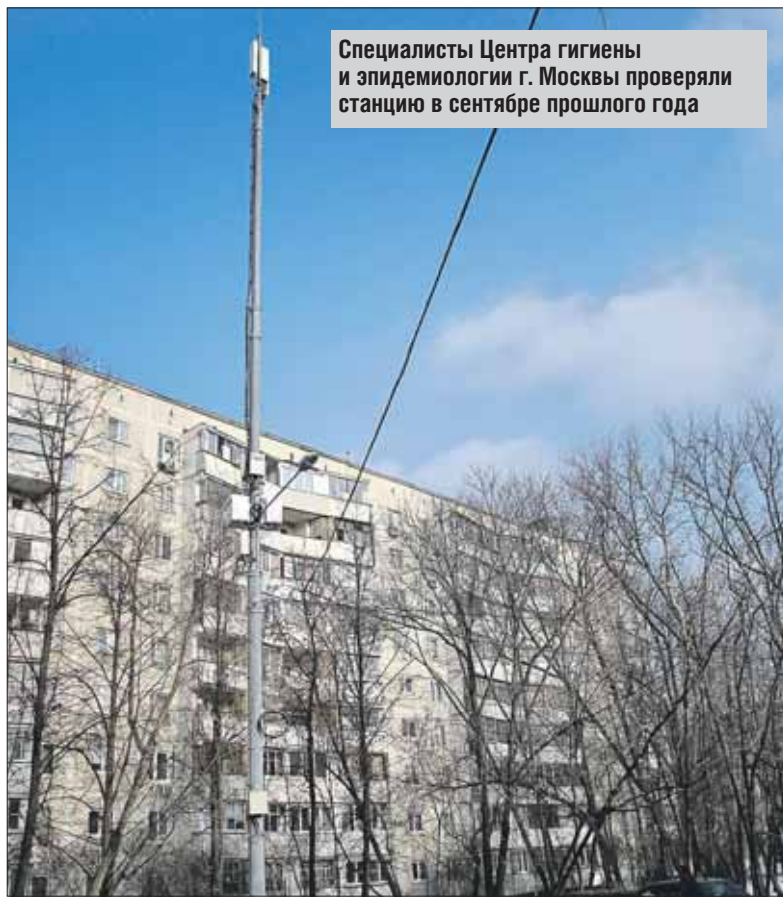
Специалисты Центра гигиены и эпидемиологии г. Москвы проверяли станцию в сентябре прошлого года