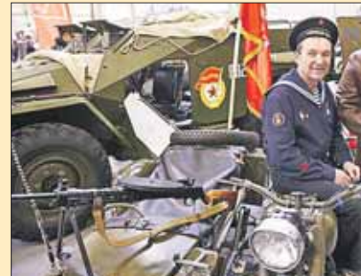
Выставка «Моторы Победы» — одно из крупнейших в Европе автошоу

На экспозиции «Моторы Победы» представлена военная техника времён Великой Отечественной войны, например машины, которые называли «бронесобакками». С помощью шлема виртуальной реальности Oculus Rift вы ощутите себя в роли пилота самолёта серии «Як» или штурмовика «Ил-2». Шлем не только проецирует картинку в формате 3D, он также реагирует на движения головы игрока, что позволяет осматриваться в виртуальном мире. На пло-