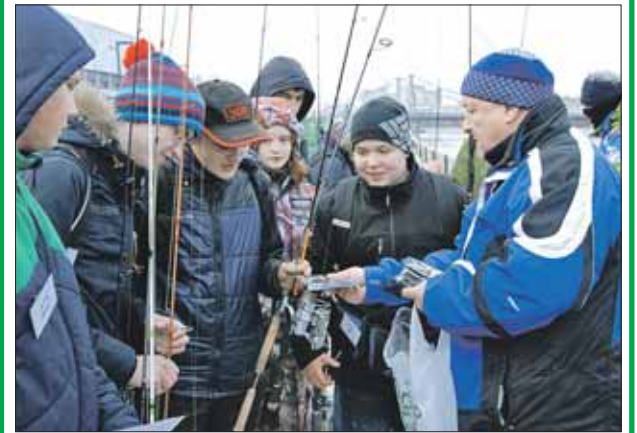
Мериться уловом — особый ритуал для рыбаков

В клубе сегодня представлены практически все виды рыбалки (разумеется, без использования браконьерских снастей вроде верш или электроудочек). Зимой это подлёдная ловля на мормышку, на другие