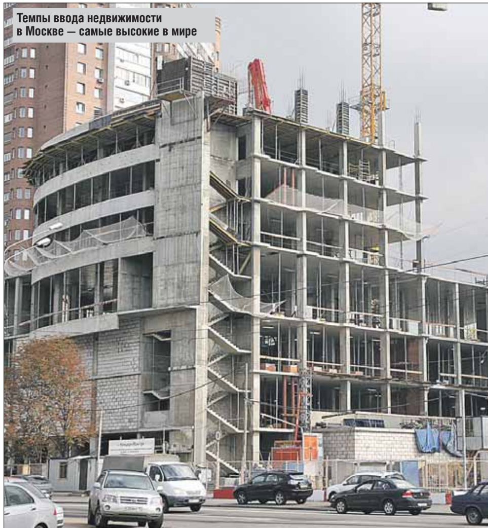
Темпы ввода недвижимости в Москве — самые высокие в мире

Всего за 2014 год введено 8,8 млн кв. метров недвижимости, из них более трети — жильё. Коммерческих объектов стали строить заметно больше. Это, по мнению властей, способствует появлению новых рабочих мест и «точек роста». А вот четыре с лишним млн кв. метров различных объектов, наоборот, зарубили. Речь о тех стройках, что заведомо вызвали протесты у москвичей и могли бы испортить облик города.