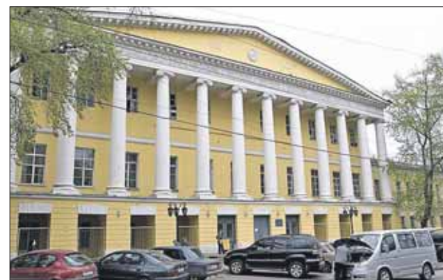
В здании усадьбы Гагариных будет городской общественный центр

Монументальное здание с 12-колонным портиком, которое было построено в XVIII веке, успело побыть и особняком Гагариных, и Английским клубом, и больницей. Оно подвер-