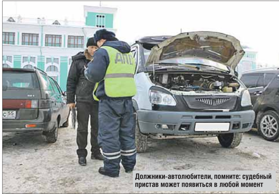
Должники-автолюбители, помните: судебный пристав может появиться в любой момент

— Самое распространённое ограничение — по