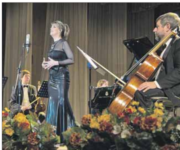
Любовь Казарновская шла поступать в МГУ, но зашла в консерваторию

исполнителям концерта «В рабочий полдень», который всегда слушала бабуля. Ещё не умея толком говорить, я пела песни из репертуара Зыкиной, «пролялякивала» мазурки Шопена... Поскольку папа был военным, нашей семье часто приходилось менять место жительства, а мне — детские сады и школы. И везде на утренниках я без стеснения заявляла: «Хочу петь». Куда бы мы ни переезжали, я моментально бежала в музыкальную школу. Правда, разбирать вокальные партии по нотам не любила, сразу пела на слух. Тем не менее в 10-м классе я стала готовиться на журналистику в Московский университет — у меня очень хорошо шли гуманитарные предметы. И не удивительно, мама была филологом-русистом, преподавала русский язык и литературу. Но когда мы с мамой шли по Поварской улице подавать документы в МГУ, она вдруг обратила моё внимание на Институт имени Гнесиных: «Смотри, идёт второй тур приёма на вокальное отделение актёров музыкального театра». Я и глазом моргнуть не успела, как вдруг мама впинула меня в зал, где шли прослушивания. Члены приёмной комиссии меня спросили: «Ноты есть?» Я честно ответила: «Нет. Я вообще шла подавать документы в университет». Все рассмеялись и попросили меня спеть. Я затянула: «То не ветер ветку клонит...» И услыша-