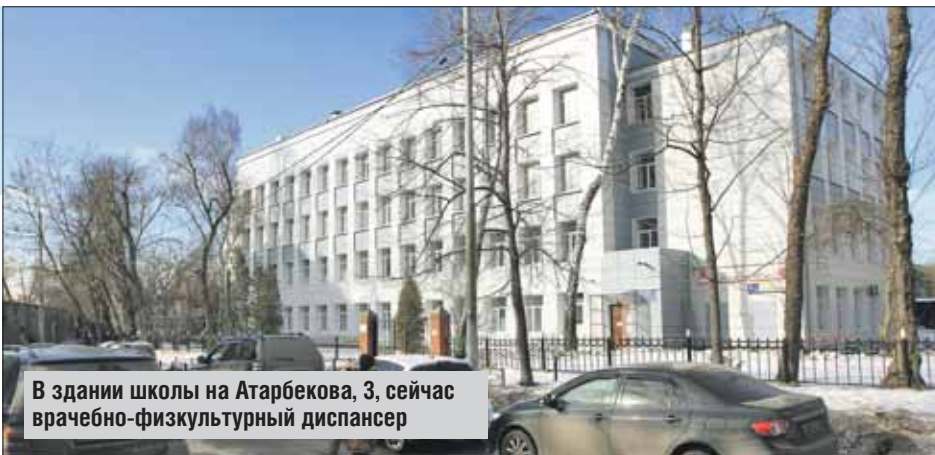
В здании школы на Атарбекова, 3, сейчас врачебно-физкультурный диспансер