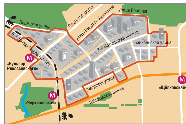
Промзона «Калошино» — самая крупная в округе

На сегодня промзона «Калошино», расположенная в районах Гольяново и Метрогородок, — самая большая в Восточном округе, здесь действуют 52 промышленных организации, 8 научных, 20 транспортных и 37 торгово-