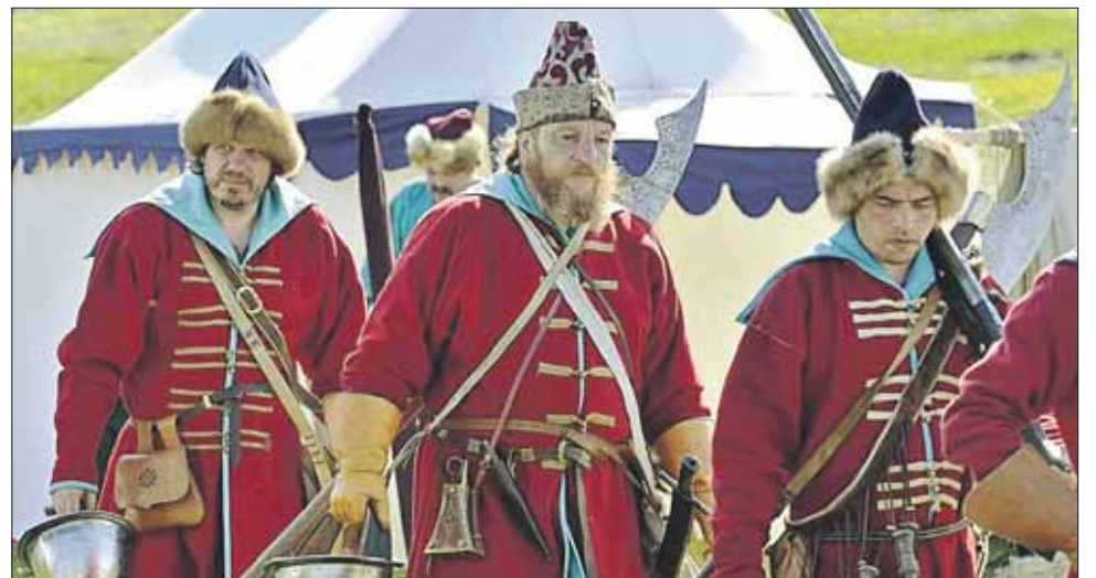
Царь Алексей Михайлович был бы горд такими вояками

СТАТЬ ЧЛЕНОМ КЛУБА МОЖЕТ любой желающий старше 18 лет; с 16 лет можно вступать на правах стажёра. Справки по тел. 8-916-774-0730, адрес «ВКонтакте» vk.com/5prikaz