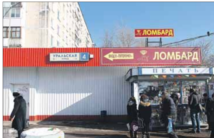
Сотрудник ДПС оформлял протокол, когда к нему подбежал прохожий с криком: «Человека бьют!»

СОТРУДНИКИ ПОЛИЦИИ ПРИЗЫВАЮТ ТЕХ, КТО ПОСТРАДАЛ ПРИ АНАЛОГИЧНЫХ ОБСТОЯТЕЛЬСТВАХ ОТ ДЕЙСТВИЙ ЗЛОУМЫШЛЕННИКОВ, ЗВОНИТЬ ПО ТЕЛЕФОНАМ: (495) 467-6347, (495) 965-2248 или 02