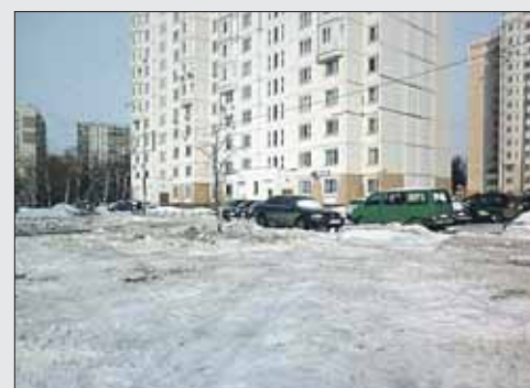
Снег всё-таки вывезли