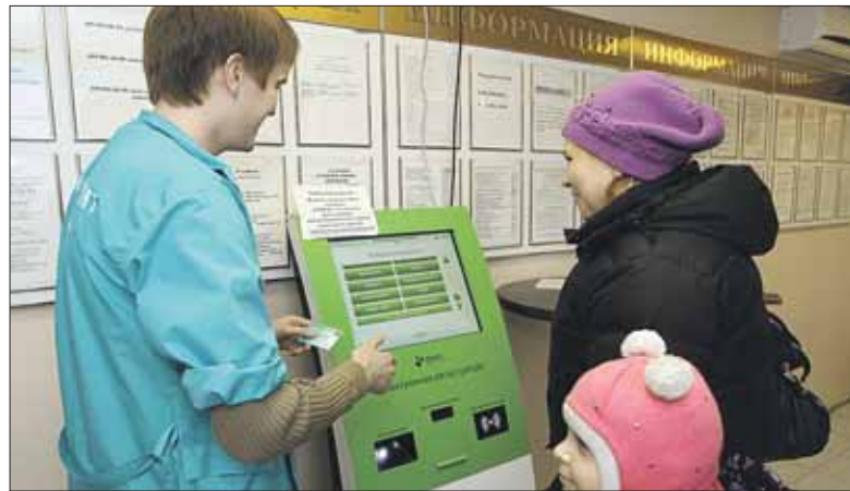
Система записи через инфокиоски нужная, но иногда она зависает

не прогрессивная система должна была сделать запись на приём простой и прозрачной, а многочасовое ожидание в поликлинике — остаться в прошлом. Так ли это, постарались узнать мы, посетив несколько поликлиник округа.