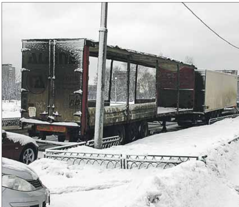
Особенно тяжело развезаться с автобусами