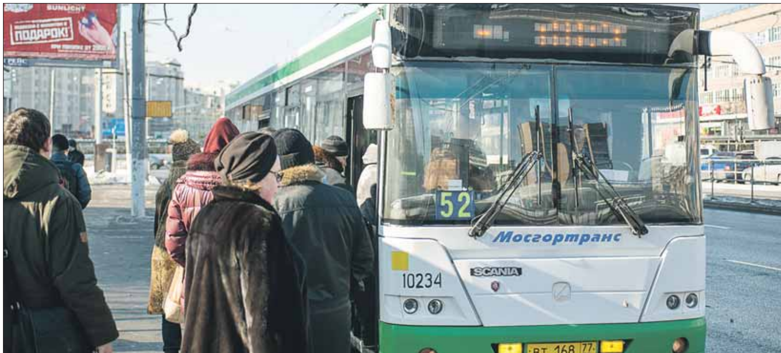
На 52-м маршруте ни один автобус не уходит полупустым в час пик

Наш корреспондент проехал в час пик по выделенной полосе