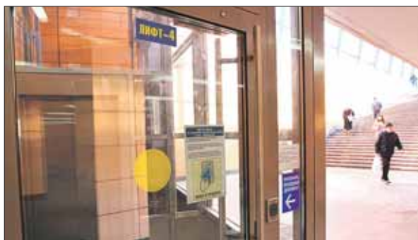
Причина простоя заключалась в низкой температуре в лифтовых шахтах

В эскалаторной службе Московского метрополитена сообщили, что 26 февраля все лифты на станции метро «Новокосино», предназначенные для маломобильных групп граждан, запустили. Причина их длительного простоя — низкая температура в лифтовых шахтах: ниже +5 °С. При