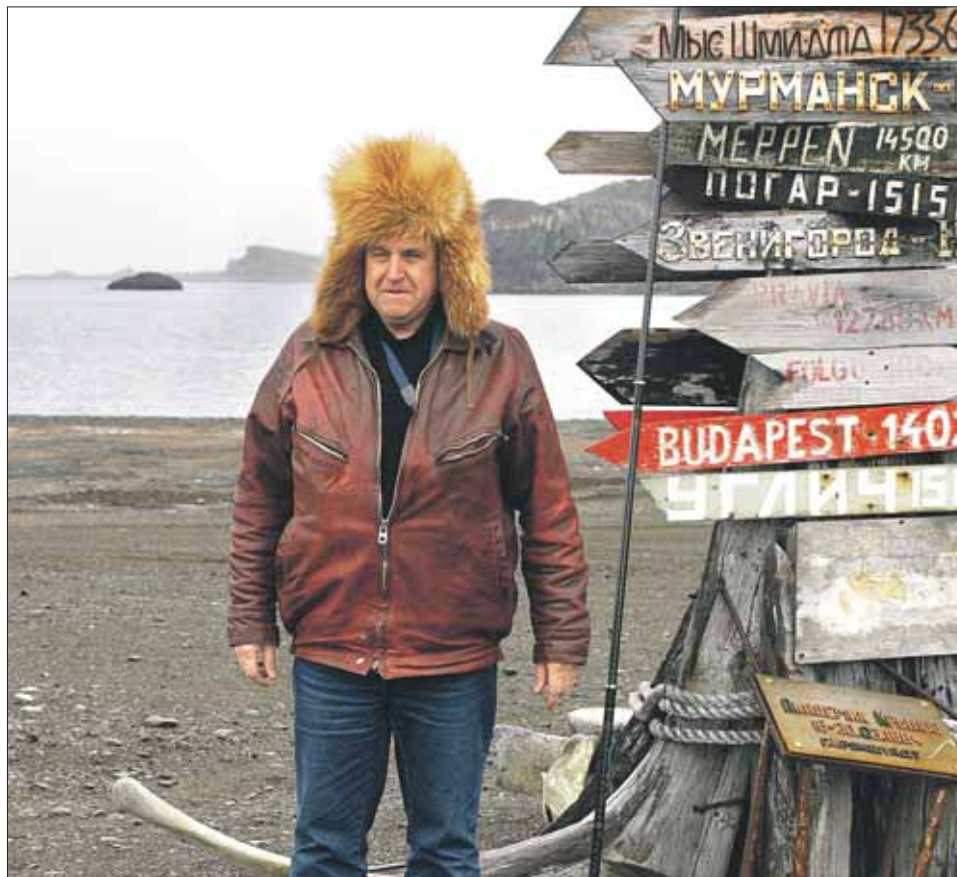
Кошелев не обидел собак, так что Брижит Бардо зря волновалась

Дело в том, что «СП-32» стала прорывом в российской истории освоения Арктики, а для него