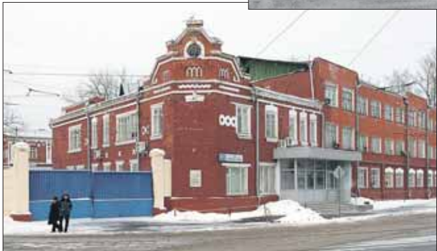
Здесь по-прежнему находится Сокольнический вагоноремонтно-строительный завод

В 1771 году фабрику перенесли в Новгород, а на её месте в перестроенных зданиях разместили Екатерининский, или Матросский, богадельный дом, где жили старые или увечные матросы. По местному преданию, специальным царским указом здесь запретили ездить на каретах и повозках, отсюда якобы и вторая часть названия — «Тишина». Есть и более прозаическое объяснение: местность была действительно тихой и безлюдной. Впрочем, такой она и осталась.