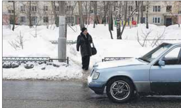
Жители нарушают правила на свой страх и риск