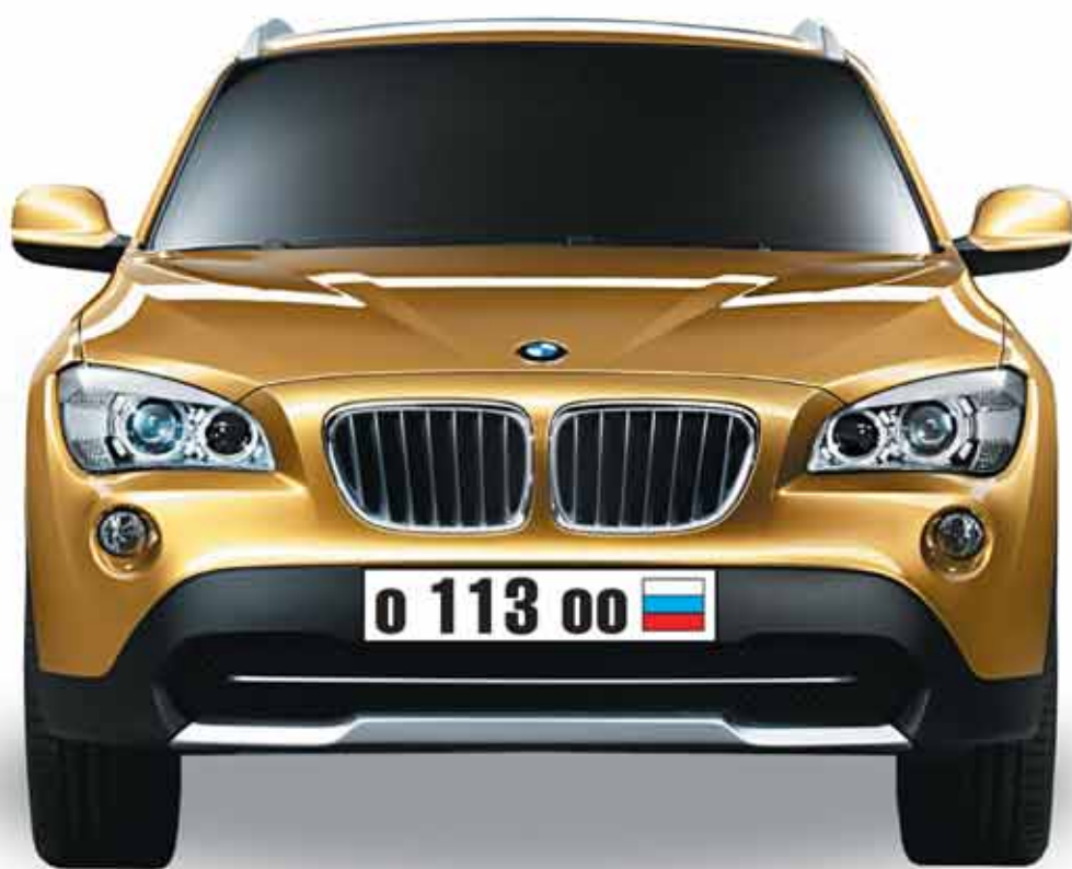
***При выполнении всех условий маркетинговой акции, указанных ниже***

Прямо сейчас проверьте, принадлежит ли Вам выигрышный номер 113 :