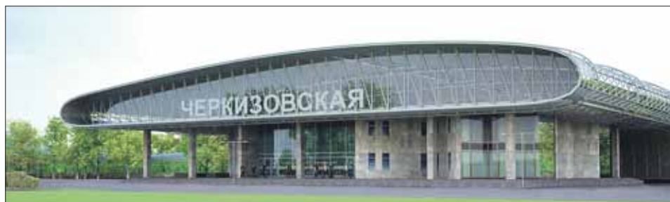
Так может выглядеть транспортно-пересадочный узел «Черкизовская» (проект ещё не утверждён)

На участке Московской кольцевой железной дороги в ВАО будет 7 станций