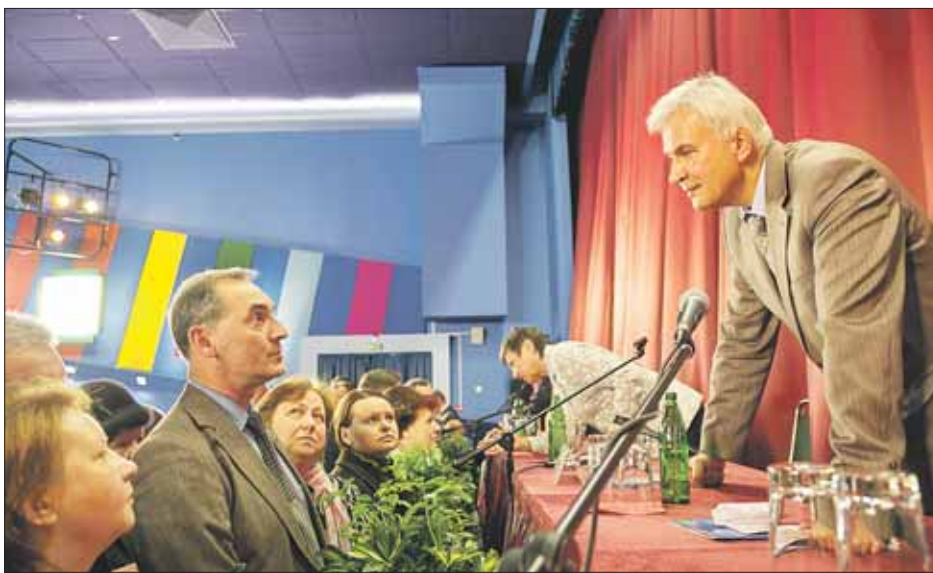
Жители задали префекту много вопросов