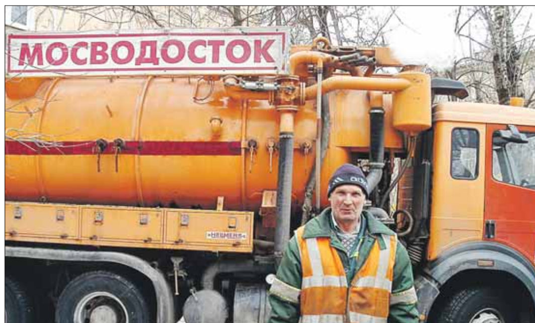
Специалисты Мосводостока начали готовиться к паводку задолго до прихода весны

Во время паводка необходимо, чтобы все водоёмные решётки были очищены