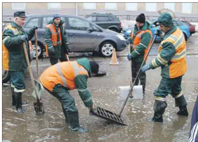
Во время паводка необходимо, чтобы все водоёмные решётки были очищены

и вода беспрепятственно попадала в коллектор.