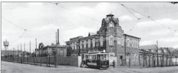
Главные Сокольнические мастерские городских железных дорог. 1913 год

В начале 1930-х тут организовали исправительно-трудовую колонию, а в 1946-м на её месте открыли знаменитый изолятор №1, а также особую тюрьму ЦК ВКП(б) — ныне Специальный след-