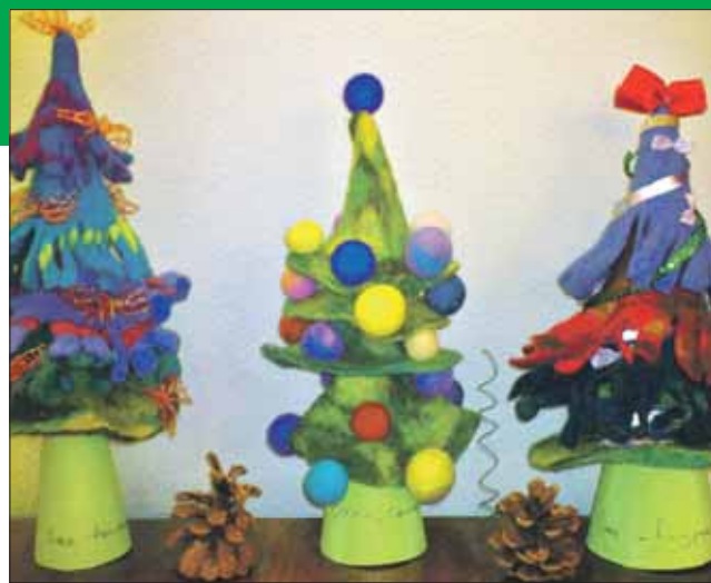
Из войлока получаются не только валенки

ЗАПИСАТЬСЯ В КРУЖОК ВОЙЛОКОВАЛЕНИЯ можно по телефонам: (495) 302-7374, 8-916-119-9332