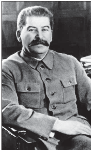
Сталин творил историю