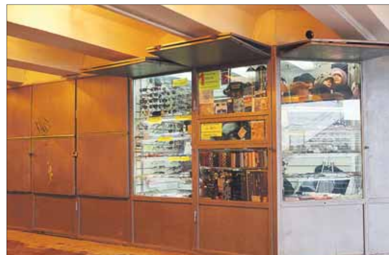
В подземном переходе на Измайловском шоссе, 69, половина ларьков уже закрылась

— Не соглашусь с вами. Большинство субарендаторов сегодня