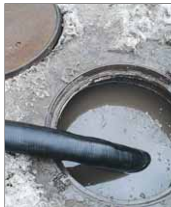
Излишек воды и ила откачивают в цистерну