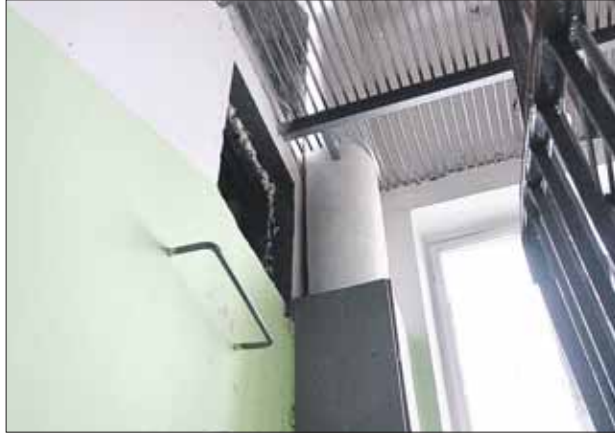
Незапертая дверь на крышу (вверху) выстужает подъезд