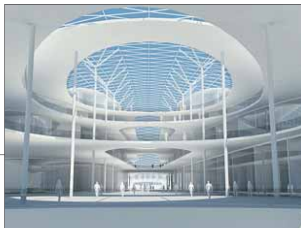
Проект ТПУ «Измайлово» (на согласовании)