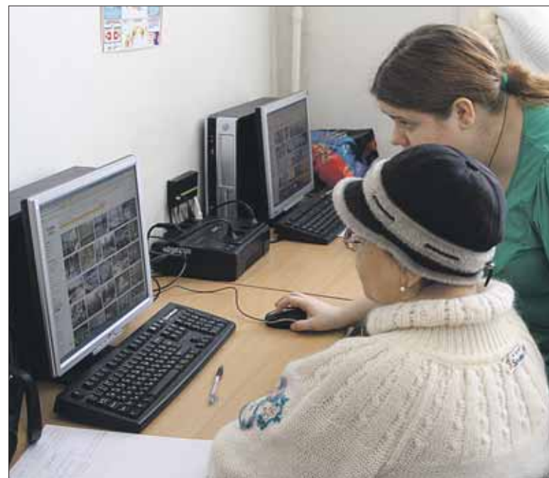
Так учат пенсионеров в ЦСО на Щёлковском шоссе, 24

Сегодня подопечные районных ЦСО всё больше интересуются курсами: только за прошлый год обучение прошли почти 1,5 тыс. человек, сейчас в округе более 300 пожилых «студентов». Очередь на бесплатное обучение растягивается минимум на месяц-два.