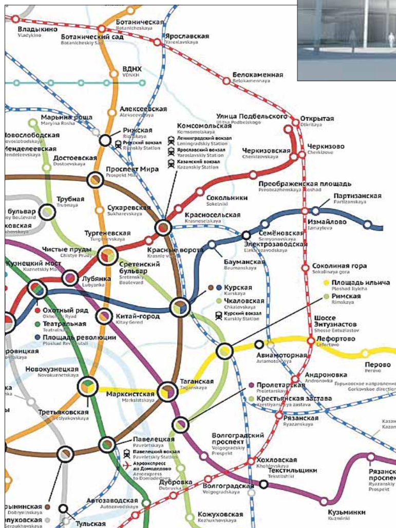
Контур МКЖД обозначен красно-белой линией

В поезде будет 7 вагонов. Однако платформы построят с запасом, чтобы в будущем они смогли принимать и более длинные поезда. Одно из требований к новым поездам — максималь-